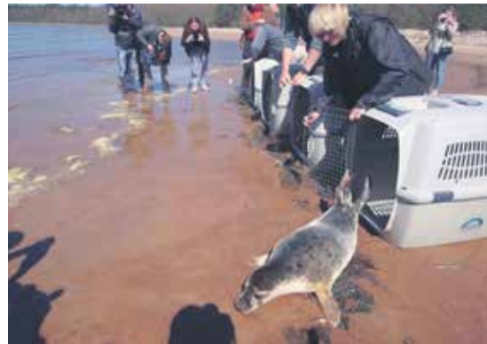
В Санкт-Петербурге на берегу Невы стали замечать детенышей ластоногих. Одно время считалось, что балтийские нерпы вымерли. Стараниями сотрудников «Центра спасения тюленей» петербуржцы увидели тех, кто столетиями жил рядом. Кадр из фильма «Краткое пособие по воспитанию тюленей» (Россия, режиссер Владимир Марин)

Кадр из фильма шведских режиссеров Микаэля Кристерссона, Оса Экмана, Оскара Хедина «Земля. Беззвучный режим». Герои фильма — китайские фермеры, истории которых иллюстрируют общечеловеческий конфликт: тяжесть выбора между насущными потребностями близких и общим благополучием планеты