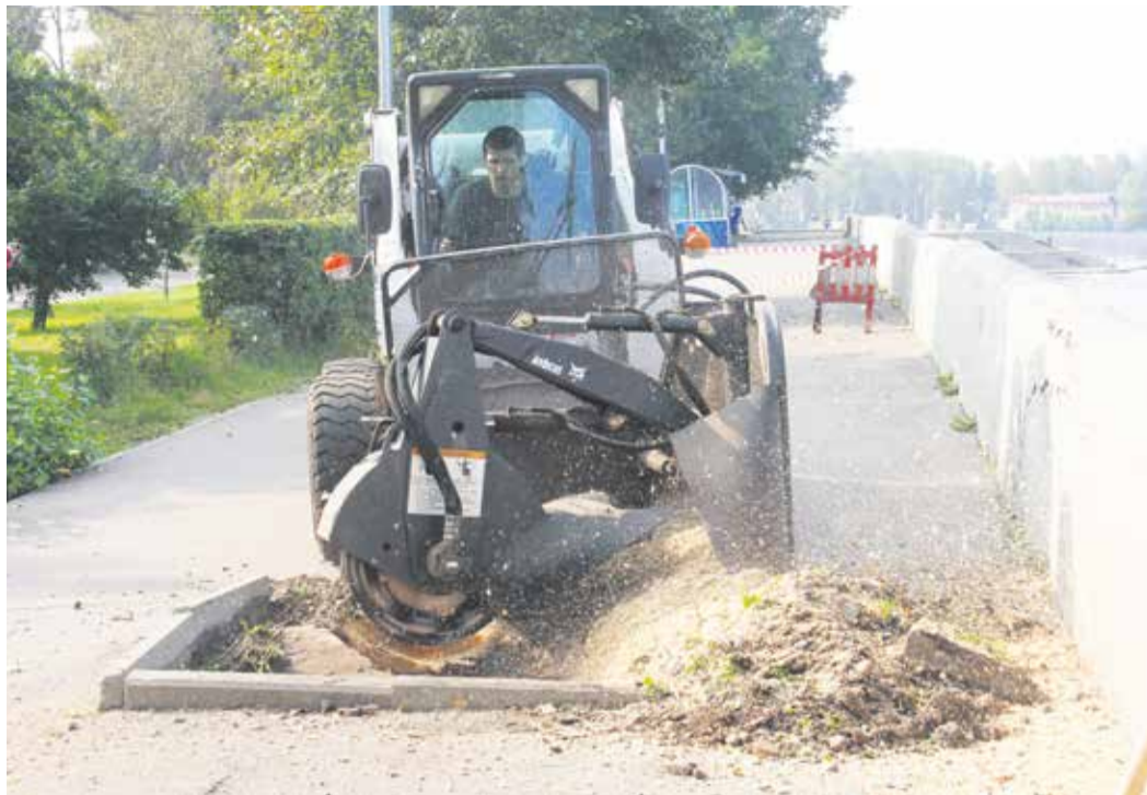
Суббота, раннее утро, бульвар Гагарина. Пока горожане спят или только просыпаются, команда «Горзеленхоза» выкорчевывает пни от старых, больных, ранее спиленных деревьев. На освободившихся участках появятся новые саженцы