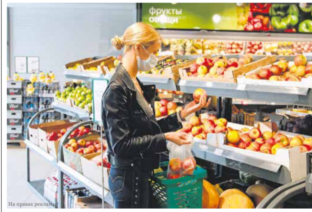
Весь товар группы «фрукты-овощи» в «Слате» проходит визуальный контроль качества в распределительном центре, который проводят товароведы групп. Проверяется внешний вид, цвет, запах, наличие скрытого брака