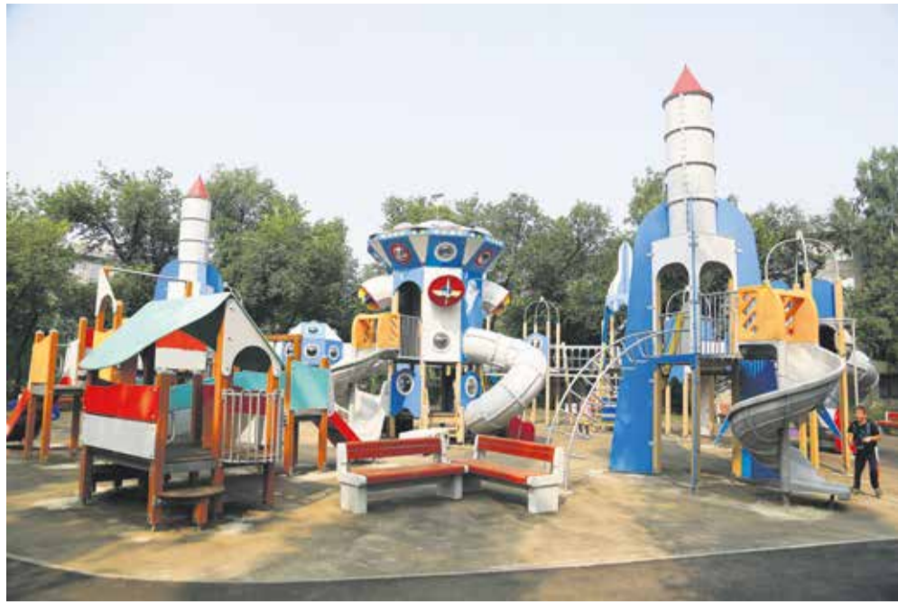
Официальная сдача игровой площадки на бульваре Рябикова горожанам назначена на начало сентября. Но поскольку готовность объекта высокая, дети уже облюбовали космический городок. Взрослые же в социальных сетях строят планы: когда поехать на Синюшку, чтобы показать ребенку самую большую игровую площадку за Уралом — третью по величине в России!