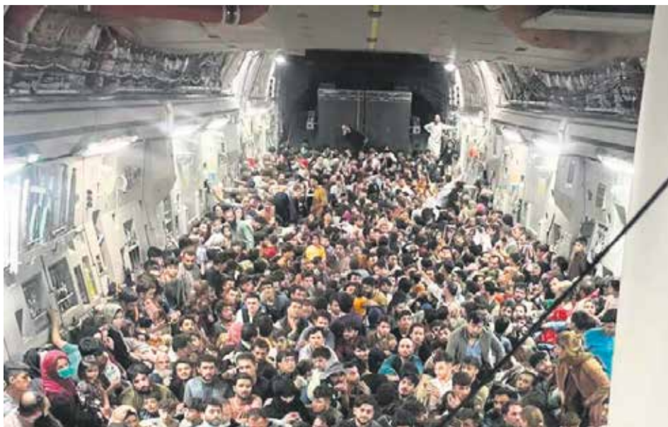
Эта фотография информационного агентства «Рейтер» облетела за последние несколько дней весь мир. Военно-транспортный самолет эвакуировал около 640 жителей Афганистана из аэропорта Кабула. Люди прорвались на летное поле и самостоятельно смогли забраться в самолет

— Сергей Борисович, события в Афганистане уже несколько недель — топ номер один всех мировых новостных лент. Никто не ожидал, что «Талибан», запрещенный в России как террористическая организация, практически сразу после ухода американских войск