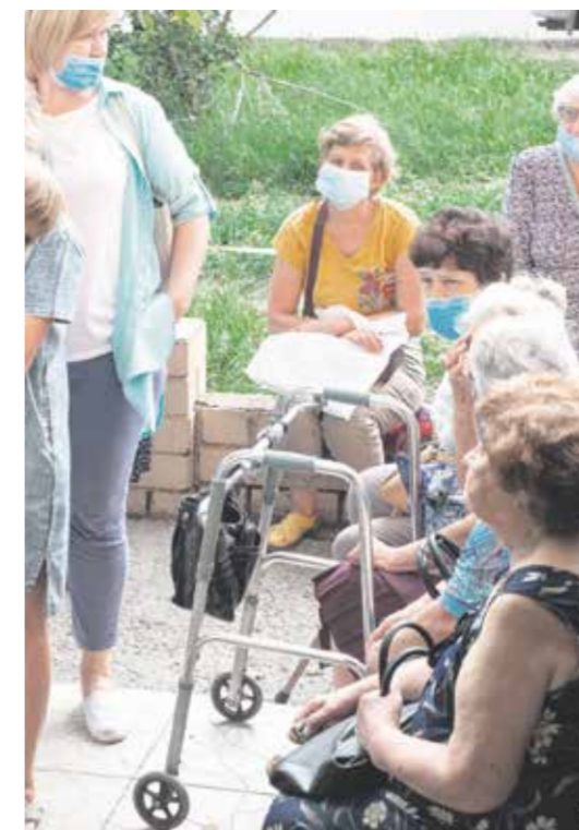
В очереди встречаются люди не только с палочками, но и с ходунками: в основном клиенты «Колымской» — очень пожилые люди. Компания начала свою работу в Иркутске еще в прошлом веке. Клиенты доверяли ей деньги в надежде обеспечить себе достойные похороны. Теперь СК решила прекратить свою деятельность

В июне страховая компания «Колымская», с которой десятки тысяч жителей Иркутска заключили договоры ритуального страхования, сообщила о добровольном отказе от страховой деятельности, заверив, что никого не бросит и исполнит свои обязательства перед клиентами. Репортерская группа «Иркутска» отправилась к офису компании узнать, как выполняется это обещание и что говорят люди. Увиденное повергло журналистов в шок.