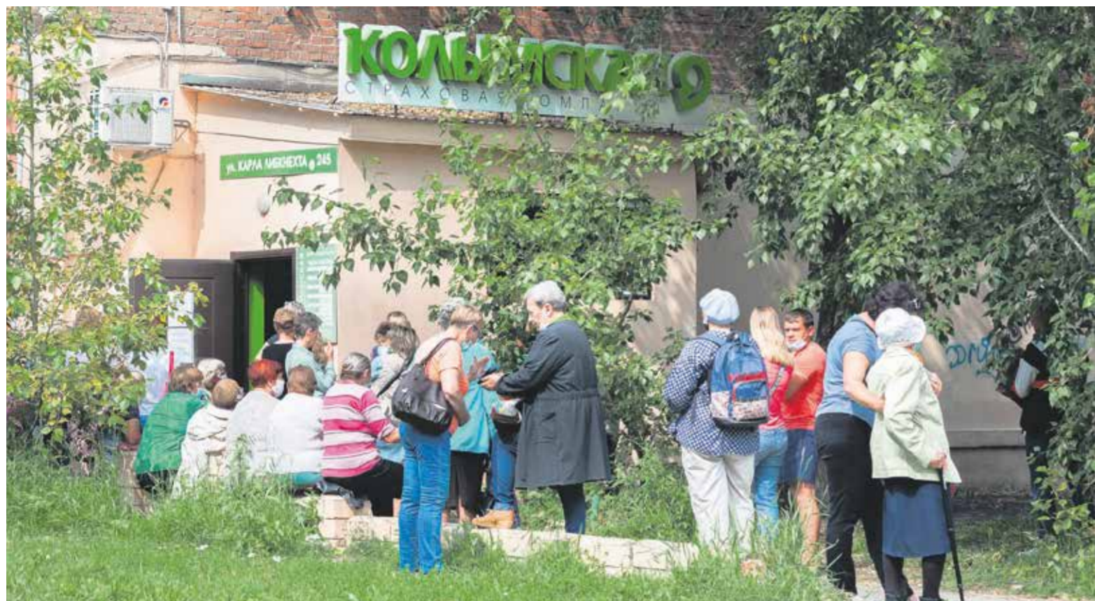
Офис «Колымской» на улице Карла Либкнехта в Иркутске. Внутри пускают по одному человеку. Остальные вынуждены часами стоять на улице под палящими лучами солнца либо мокнуть под дождем. А ведь это в основном люди весьма преклонного возраста