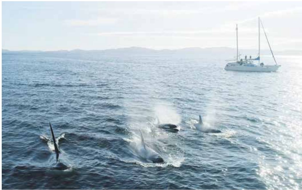
Фильм «О чем говорят касатки» (Германия, Россия, режиссер Генри Марио Микс) рассказывает о самом крупном морском хищнике, который может исчезнуть из-за негативного влияния человека на Мировой океан