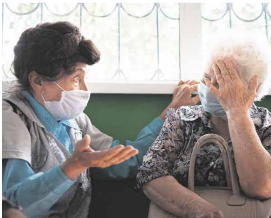
Не раз и не два пожилые люди в очереди говорили об издевательском отношении к ним. Почему они должны часами стоять в очереди, чтобы получить хотя бы часть своих денег? Зачем компания устроила такую спешку, объявив, что нужно прийти на прием обязательно до конца августа? Ответов на эти вопросы нет, поэтому люди теряются в догадках и подозревают, что их в очередной раз обманывают