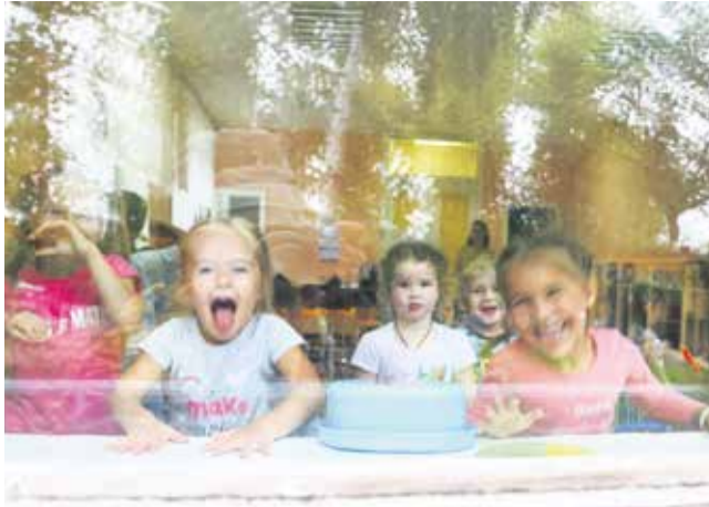
Детским садам № 139 и 96 на бульваре Рябикова повезло — они получили деньги на ремонт и успешно его провели. Но работа еще есть: нужно как минимум закончить замену окон