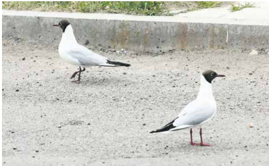
Озерные чайки — небольшие, изящного сложения птицы со светло-серой мантией. Длина 40 см, масса 200–350 г, размах крыльев 90–100 см. Весной и летом голова темно-коричневая (издалека кажется черной), капюшон оканчивается на затылке, вокруг глаз узкие белые «очки»

Почему в преимущественно сухопутном Иркутске в последнее время так много этих птиц?