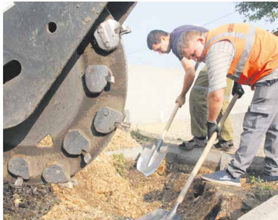
Благодаря этому колесу с огромными зубьями пень прямо на месте корчевания дробится на опилки. Гряда растет быстро — по мере того, как исчезает сам пень. В воздухе витает приятный запах сырой древесины

Е жегодно специалисты МУПЭП «Горзеленхоз» спиливают в городе сотни ветхих и аварийных деревьев. После валки, как известно, остаются пни. Однако, если вы попытаетесь отыскать их на улицах, придется сильно постараться. Корчевка пней — такая же обязательная работа по улучшению санитарного состояния города, как и валка деревьев. И процедура эта весьма непростая, даже если есть необходимая техника. На прошлой неделе в этом убедились репортерская группа «Иркутска».