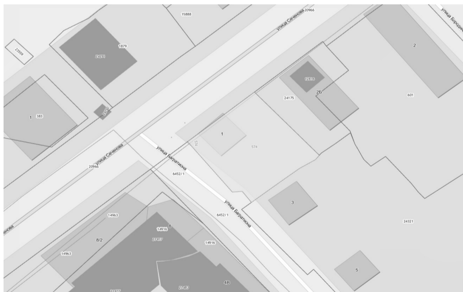
Схема расположения земельного участка и объекта капитального строительства, в отношении которых подготовлен проект решения о предоставлении разрешения на условно разрешенный вид использования «Предпринимательство» в отношении земельного участка с кадастровым номером 38:36:000027:574, площадью 562 кв. м, расположенного по адресу: Иркутская область, г. Иркутск, ул. Багратиона, 1, «Многофункциональные объекты» в отношении объекта капитального строительства с кадастровым номером 38:36:000027:5708, площадью 38,5 кв. м, расположенного по адресу: Иркутская область, г. Иркутск, ул. Багратиона, д. 1.

Учитывая запрос Саверского Василия Вениаминовича, Саверского Сергея Анатольевича, Сизикова Вячеслава Александровича о предоставлении разрешения на условно разрешенный вид использования земельного участка и объекта капитального строительства, предоставить разрешение на условно разрешенный вид использования «Предпринимательство» в отношении земельного участка с кадастровым номером 38:36:000027:574, площадью 562 кв. м, расположенного по адресу: Иркутская обл., г. Иркутск, ул. Багратиона, 1, «Многофункциональные объекты» в отношении объекта капитального строительства с кадастровым номером 38:36:000027:5708, площадью 38,5 кв. м, расположенного по адресу: Иркутская область, г. Иркутск, ул. Багратиона, д. 1.