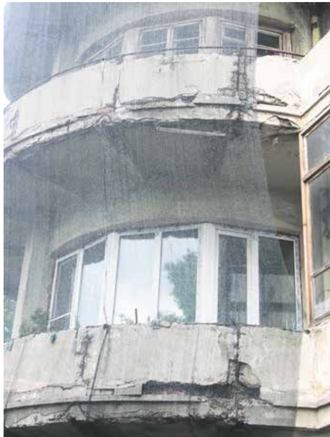
Здесь хорошо видна степень разрушения фасада, практически нет живого места, дом выглядит как заброшенные руины, а ведь это центр города, напротив два здания — регионального управления ФСБ и главного управления МВД по Иркутской области