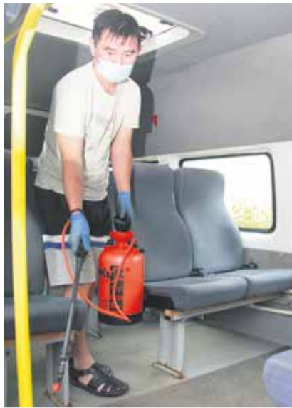
Полы и сиденья маршруток дезинфицируют после каждого рейса. Полностью салоны коммерческого транспорта обрабатывают дважды в день — утром и вечером.