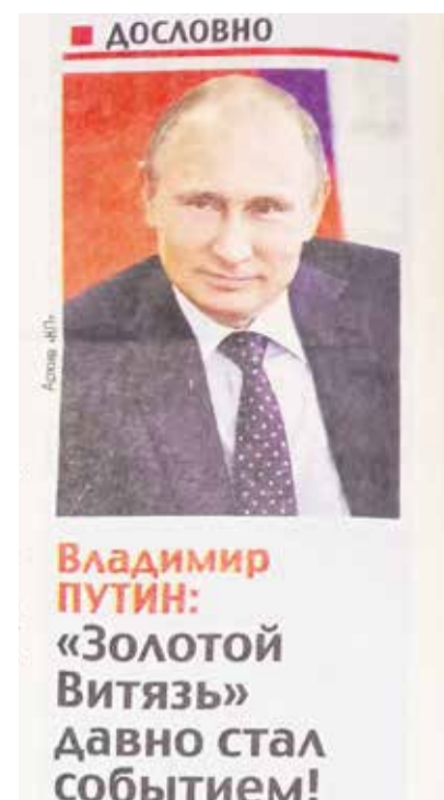
Публикация в федеральной газете «Комсомольская правда» о фестивале «Золотой Витязь». Его ежегодный участник — наш Иркутский театр народной драмы