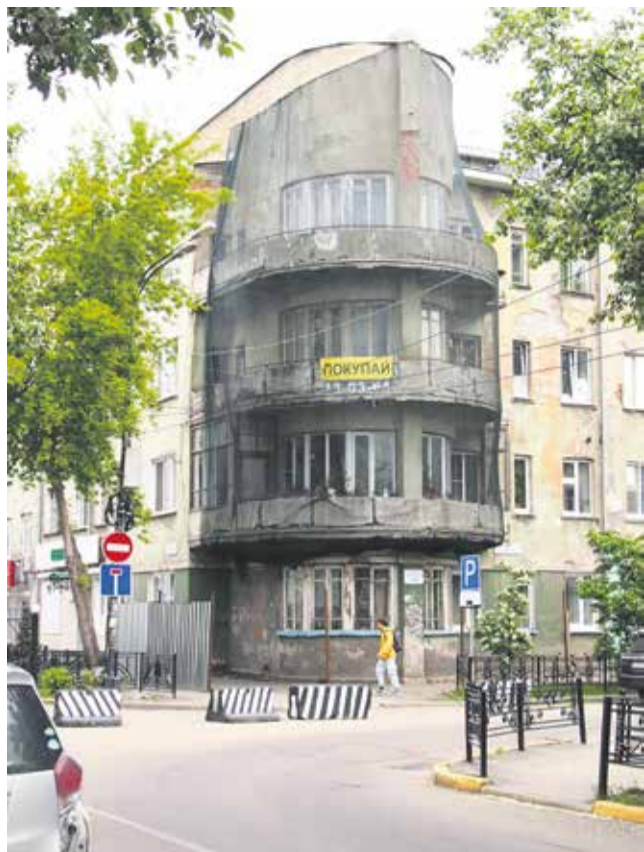
Так выглядит дом сотрудников НКВД 1930-х годов постройки в Пионерском переулке сейчас. Вся цилиндрическая часть затянута защитной сеткой, тротуар под балконами огорожен забором, для прохода на газоне проложены узкие мостки