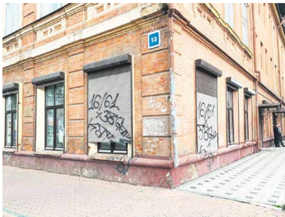
Печальное зрелище. Изрисованные роль-ставни на здании Выставочного отдела «Музейная студия» Иркутского областного краеведческого музея на улице Карла Маркса, 13. С появлением в городе неформальной молодежной группы 16/61 проблема вандализма обострилась

— Мне больно видеть, как прекрасные архитектурные творения в центре Иркутска — на улицах