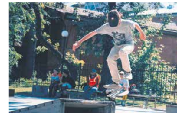
Скейбордистов очень трудно фотографировать: они все время либо в движении, либо в воздухе. И сердце замирает: только бы не упал!

В сквере Сигеки Мори в Иркутске 20 июня прошел фестиваль уличных видов спорта