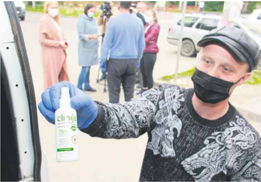
Водитель маршрутки № 83 показывает антисептик, которым он обрызгивает поручни в своей машине. После поручней он обработает полы и сиденья более мощным раствором на основе хлора. Раствор безопасен для пассажиров!