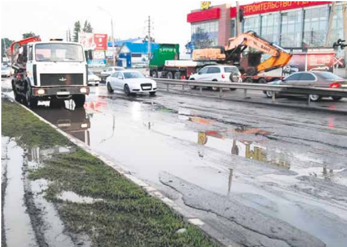
Вечер вторника, улица Тракторная. Воду с проезжей части уже откачали. Подрядная организация впрямь будет ремонтировать улицу, согласовывая свои действия с администрацией города. Напомним: по проекту здесь будет новый асфальт, тротуары и велодорожки, современная система освещения. Большая часть работ проводится в ночное время, чтобы меньше мешать автомобилистам