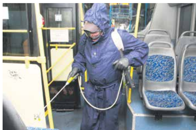
На фото — дезинфекция салона троллейбуса в депо на улице Лермонтова. Такую обработку здесь проводят трижды в день: перед выпуском на линию, перед проведением технического обслуживания и в течение рабочей смены на конечных станциях