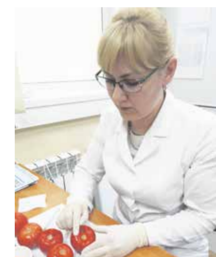
Идет исследование в лаборатории. Вирус мозаики пепино поражает томаты во многих странах мира. Он передается с семенами, его разносят насекомые-опылители, что способствует быстрой экспансии патогена

Основными растениями-хозяевами для возбудителя считаются томаты, баклажаны, картофель и пепино (длинная груша или сладкий огурец, представляющий вечозеленый кустинок семейства Пасленовых, который изначально произрастал