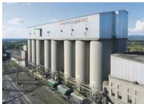
АО «Ангарскцемент» — одно из ведущих предприятий цементной отрасли Восточной Сибири. Его мощность — 1,3 млн тонн продукции в год!

Невозможно представить развитие нашего города без ангарского цемента