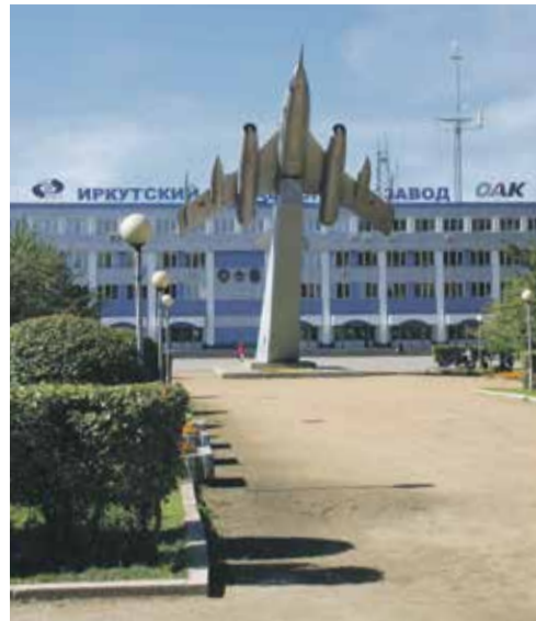
Иркутск — один из мощных авиационных центров России. С 1934 года в нашем городе работает Иркутский авиационный завод, который на протяжении всей своей истории обеспечивал страну самолетами боевого и специального назначения