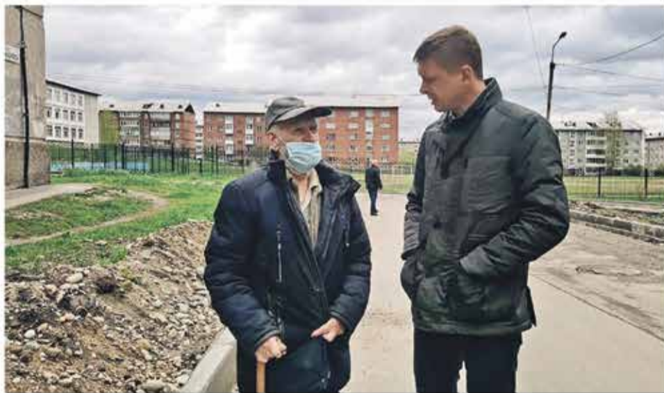
В каждом рейде общественного контроля принимают участие местные жители.

«Единая Россия» продолжает общественный контроль программы «Формирование комфортной городской среды»