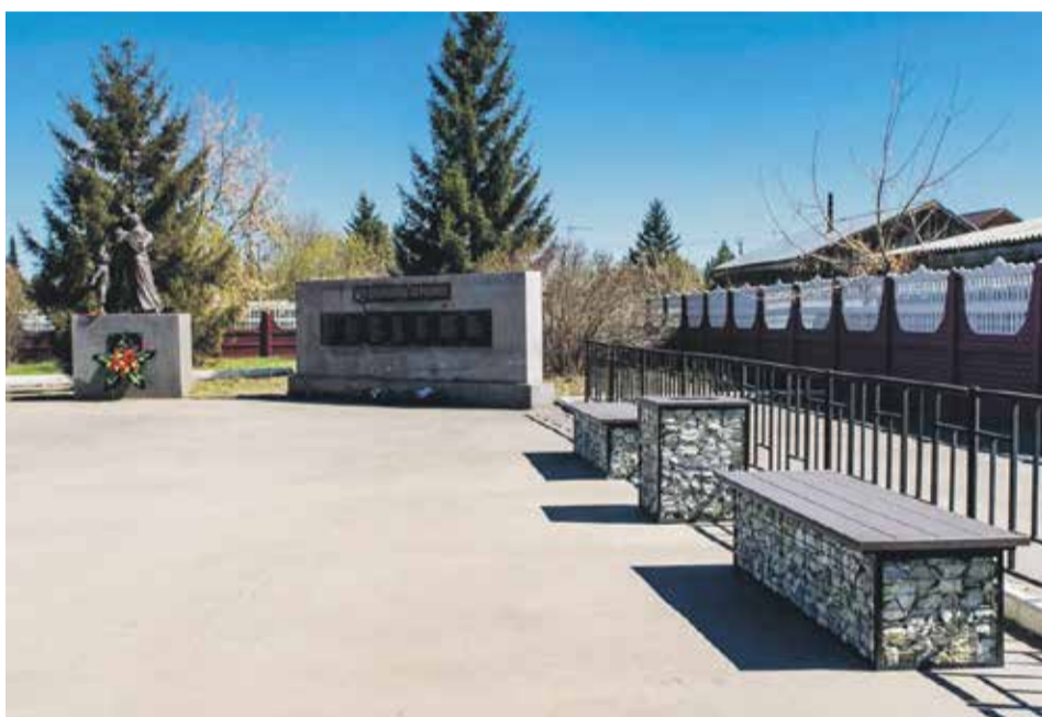
Эти лавочки-габионы сотрудники «Байкалкварцсамоцвет» установили в этом году к 9 Мая у памятника Великой Отечественной войне в селе Смоленщина. А сам памятник подарили поселку по просьбе ветеранов к 70-летию Победы

в Иркутске руками наших мастеров, и иконы написаны здешними художниками. Готовый иконостас привезти или заказать китайским мастерам, конечно, можно, а вот сделать самим, и в первый раз — большой риск. Это в хорошем смысле была для Иркутска авантюра, и она удалась!