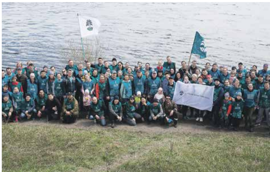
Традиционно на протяжении многих лет сотрудники Иркутской нефтяной компании принимают участие в субботнике

Кроме того, при поддержке нефтяников Иркутск стал первым российским городом, в котором появилось оборудование для проведения малоинвазивных лапароскопических операций у новорожденных и младенцев в видеоформате 4К — высокотехнологичный комплекс ИНК подарила Ивано-Матренинской детской клинической больнице.