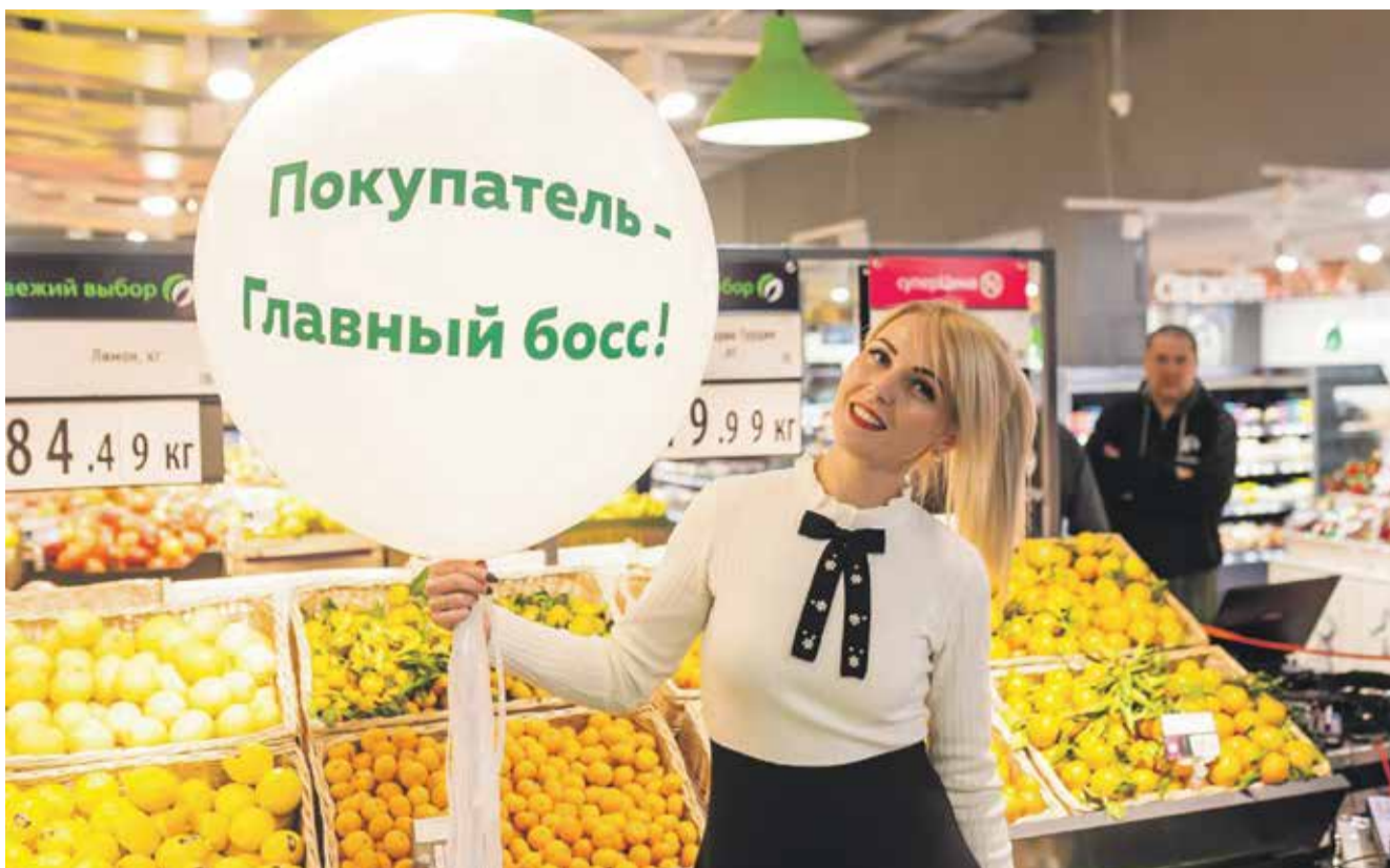
В группе компаний «Слата» все знают: именно покупатель — самый большой босс розничной сети, он платит деньги. И решения принимаются с точки зрения потребностей клиента, то есть нас с вами, обычных покупателей