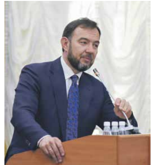
Заместитель мэра — председатель комитета по социальной политике и культуре администрации Иркутска Виталий Барышников озвучил на заседании думы тревожную цифру: в школах Иркутска не хватает 3000 педагогов

К роме повышения зарплаты нужны и другие меры социальной поддержки. Ведь от этого напрямую зависит, будут ли педагоги работать в школах. На депутатских слушаниях обсуждению кадровой проблемы в школах города посвятили около четырех часов. Народные избранники предложили больше десятка инициатив, которые должны сделать профессию более привлекательной для молодых специалистов.