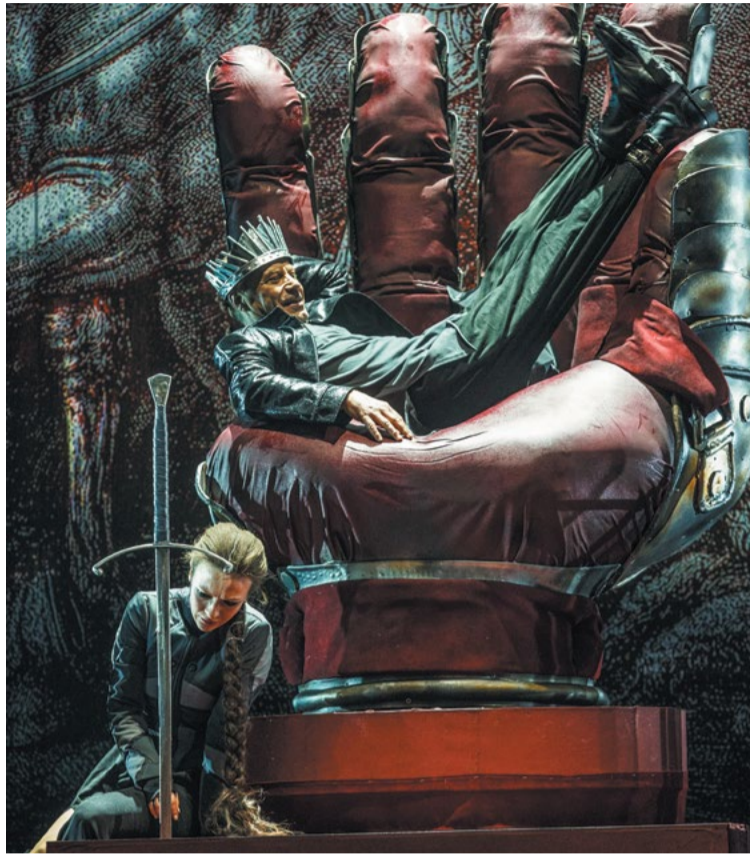
Сцена из нового спектакля «Лев зимой» от режиссера, заслуженного артиста России Геннадия Гущина, где сам он сыграл Плантагенета. Спектакль загадочный, неожиданный, населенный затейливыми героями и мудреными коллизиями

Как непохожа эта постановка на другие спектакли заслуженного артиста России Геннадия Гущина, в которых зритель ценит и любит мягкую иронию, почти нежное отношение к героям и актерам!.. Сложная партитура пьесы Голдмена, кажется, совсем не в стилистике режиссерского почерка постановщика. Огнедышащий бульон страстей, которым клокочет текст драмы, на сцене поначалу почти застывает в нарочито сдержанной тональности первого акта. Все выглядит обыденным и даже затрапезным, пока