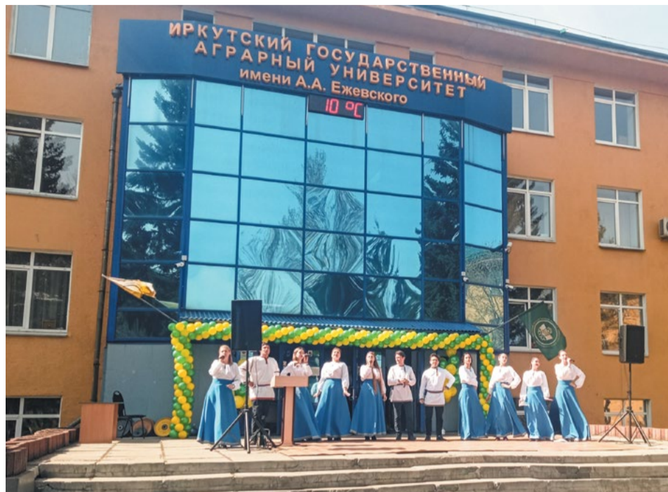
Праздник развернулся прямо на улице: шарики над входом, крыльцо, которое превратилось в сцену, выставка техники, ярмарка для садоводов. За сценой готовятся к творческим номерам педагоги и студенты, к демонстрации навыков и силы — спортсмены ИРГАУ

— Иркутский государственный аграрный университет, который носит имя выдающегося человека, Александра Ежевского, — самобытный, самостоятельный, семейный и добрый вуз. Сегодня мы набираем обороты, у нас высокая обеспеченность профессорским составом. Мы создаем массу прогрессивных вещей, которые смогут сделать вуз сильнейшим не только в Сибири, но и в Российской Федерации.