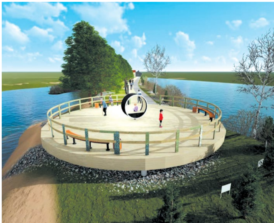
Вот так будет выглядеть видовая площадка с необычным арт-объектом — лавочкой-цилиндром, которая поворачивается на 360° и символизирует 360-летие Иркутска

ствие не из дешевых. Весь проект оценивается в 3,8 млн рублей. Здесь-то и начинается самое интересное и трудное — поиск средств и меценатов.