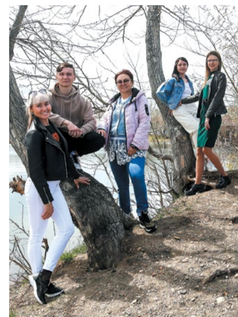
Часть команды «Аллея № 16» на традиционной планерке. Рассказывая читателям «Иркутска» о городских активистах, мы чаще всего представляем жителей старшего поколения: свое свободное время и накопленный жизненный опыт они охотно направляют на общественные проекты. И потому было удивительно познакомиться с инициативной группой иркутян, состоящей в основном из молодых людей

— Мы предлагаем «купить» именную дизайнерскую лавочку (и нанести на нее свою пожелание городу), высадить именное дерево или курстарник или оплатить упоминание