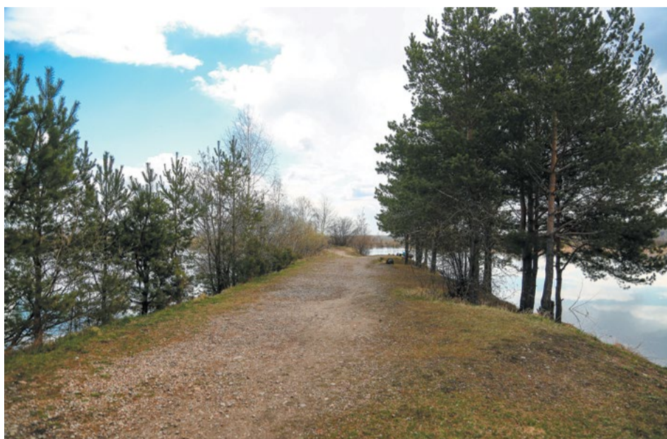
Это та самая песчаная коса, которая буквально на днях стараниями энтузиастов станет благоустроенной парковой зоной. Жители Левого берега хорошо знают это место в районе Академгородка: нужно свернуть с ул. Старокузьмичинской и проехать мимо парка «Поляна» до самого берега Ангары

Фронт работ может показаться небольшим, но парк — удоволь-