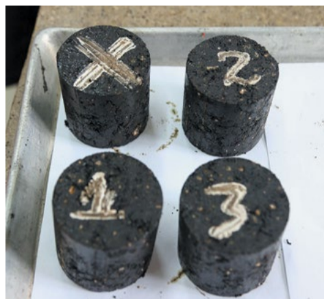
Так выглядят образцы асфальта, которые отбирают для проверки на качество в лаборатории АБЗ. От каждой партии асфальта, которую вывозят с завода, берут три пробы. Для этого на выезде с территории завода стоит лестница, а на ней лежит железная лопатка. Лаборант поднимается, зачерпывает из погрузчика образец и относит в лабораторию

К тому моменту, когда обнаружили дефект, на улице Ширямова уже успели закатать несколько десятков метров асфальта. Пришлось снимать покрытие и укладывать заново. Но такие случаи единичны. Как правило, сотрудники лаборатории могут визуально заметить отклонение от нормы еще на стадии производства и сразу же откорректировать рецепт.