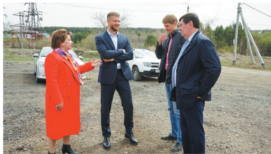
Идет выездное совещание в микрорайоне Лесной: обсуждают современный детсад на 220 мест, который здесь появится. Он сможет принять всех детей микрорайона Лесной, и родителям не придется возить их в другие учреждения

— В нем будет сразу две ясельные группы для детей до двух-трех лет. Также планируется объединить детский сад и школу, потому что сейчас развивается такое направление, как учебные комплексы. Таким образом, будет налажена системная работа двух учреждений для детей и появится единая программа, по которой они будут переходить из одного в другое. Это логично