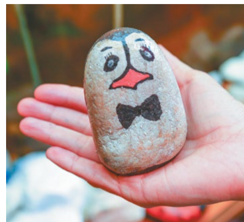
В лаборатории АБЗ на батарее сушатся камни — обычные булыжники. Как выяснилось, потом они превращаются вот в таких пингвинчиков, черепашек и божьих коровок. Так сотрудники лаборатории отвлекаются от рутинной работы: во время обеда 10 минут тратят на трапезу, а потом берутся за кисточки

— Испытания с адгезионными добавками — это же поэзия! Каждый «листочек» — результат того, как ведет себя битум с разными добавками. Когда кипятить образцы в соляном растворе, с одного все стекает, а на другом битум задерживается, образуя вяжущую пленку. На основании этих испытаний мы потом выбираем поставщика добавок.