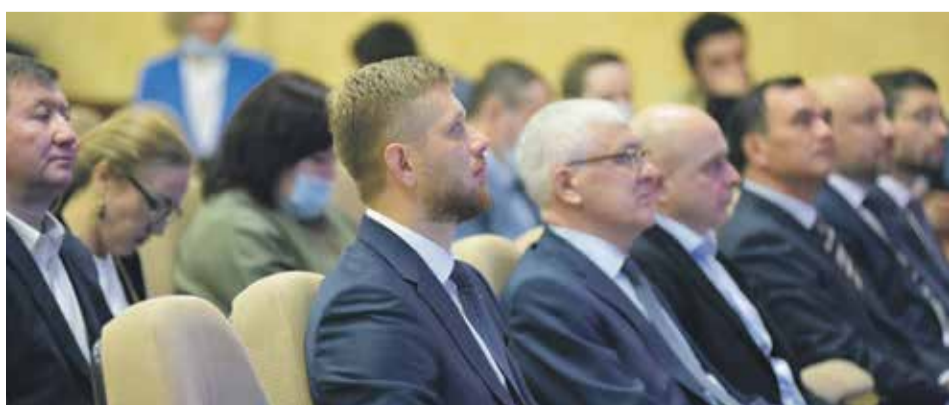
Впервые за последние годы отчет исполнительной власти был представлен депутатам надлежащим образом

Депутаты избрали нового мэра 30 апреля прошлого года. Совместными усилиями разработали проект бюджета на 2021 год, который был утвержден думой Иркутска. За это время произошли изменения и в структуре администрации: был возрожден комитет по экономике и социальному планированию, а также появилась должность первого заместителя мэра, курирующего комитеты по управлению административными округами.