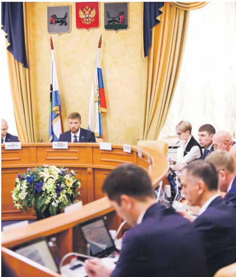
Регулярное рассмотрение комплексных проблем позволяет думе Иркутска быть в курсе того, как они решаются