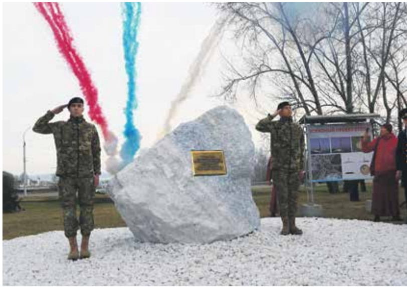
Суббота, 1 мая. Идет торжественная церемония установки камня на месте будущей стелы «Город трудовой доблести». Иркутск получил это звание за самоотверженную работу тружеников тыла в годы Великой Отечественной: у нас тогда действовали 20 крупных промышленных предприятий, 10 трестов и баз. В первые месяцы войны город принял более 20 эвакуированных производств, развернул 28 эвакуогоспиталей, в которых вылечили 103 тысячи раненых солдат и командиров Красной Армии