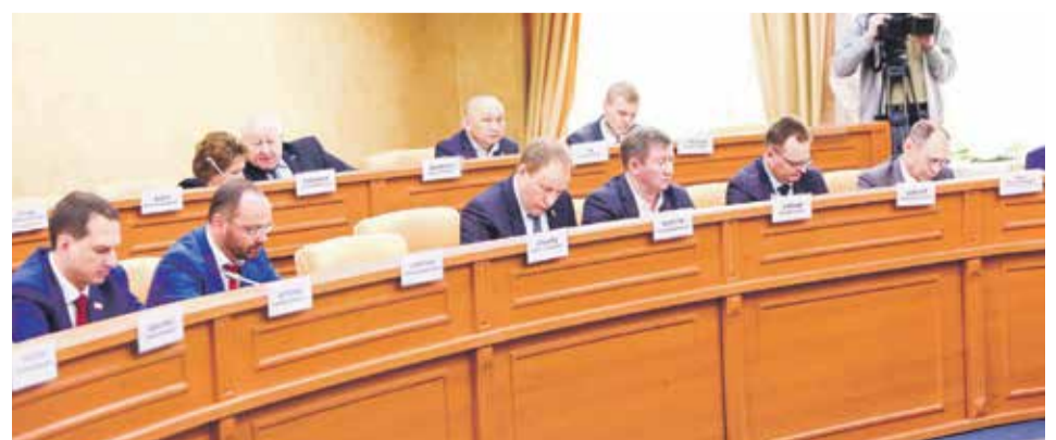
Депутаты единогласно утвердили отчет мэра Руслана Болотова о работе администрации в 2020 году