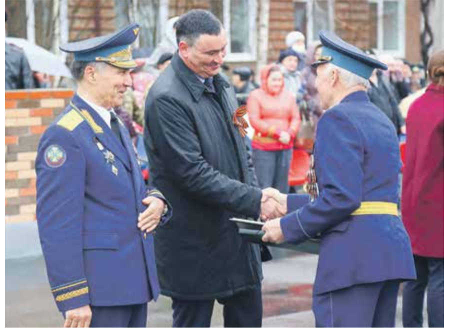
Торжественное построение курсантов центра «Патриот» в честь 90-летия ИВВАИУ. В сущности, «Патриот» заполнил ту большую брешь в военно-патриотическом воспитании, которая образовалась в Иркутске после расформирования авиационного училища. Кстати, его бывшие преподаватели и сотрудники сегодня принимают участие в работе центра, делятся с молодежью знаниями и интересным опытом