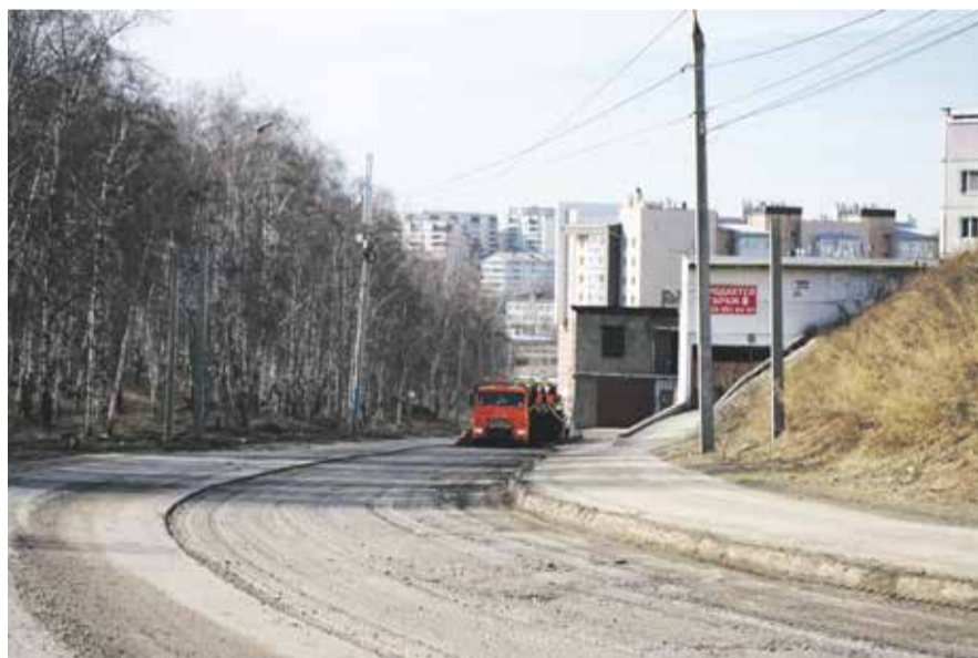
После ремонта по объездной появится возможность запустить маршрут общественного транспорта

— С коллегами из КГО еще раз «сверили часы»: обсудили, где появятся пешеходные переходы, парковки, тротуары. Планируется даже велодорожка. И сразу надо предусмотреть заездные карманы и остановки общественного транспорта. Жители давно просят запустить маршрут, но единственная причина, почему это до сих пор не было сделано, — несоответствие дороги требованиям безопасности для пассажирских