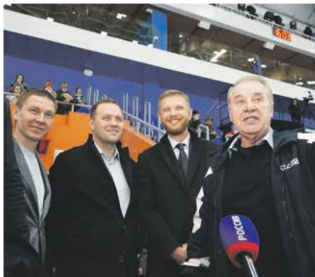
Депутаты думы Иркутска положительно оценили инфраструктуру «Байкала»

— Сегодня основной упор мы делаем на то, чтобы наш дворец стал опорным для сборных ко-