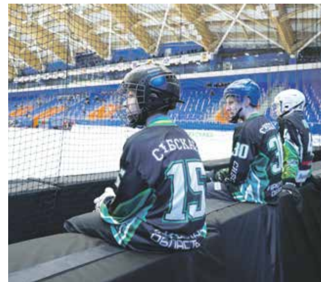
С утра и до полуночи в Ледовом дворце занимаются конькобежцы, керлингисты, хоккеисты, фигуристы

Воспитанники городских спортшкол могут получить возможность бесплатно тренироваться в ДС «Байкал»