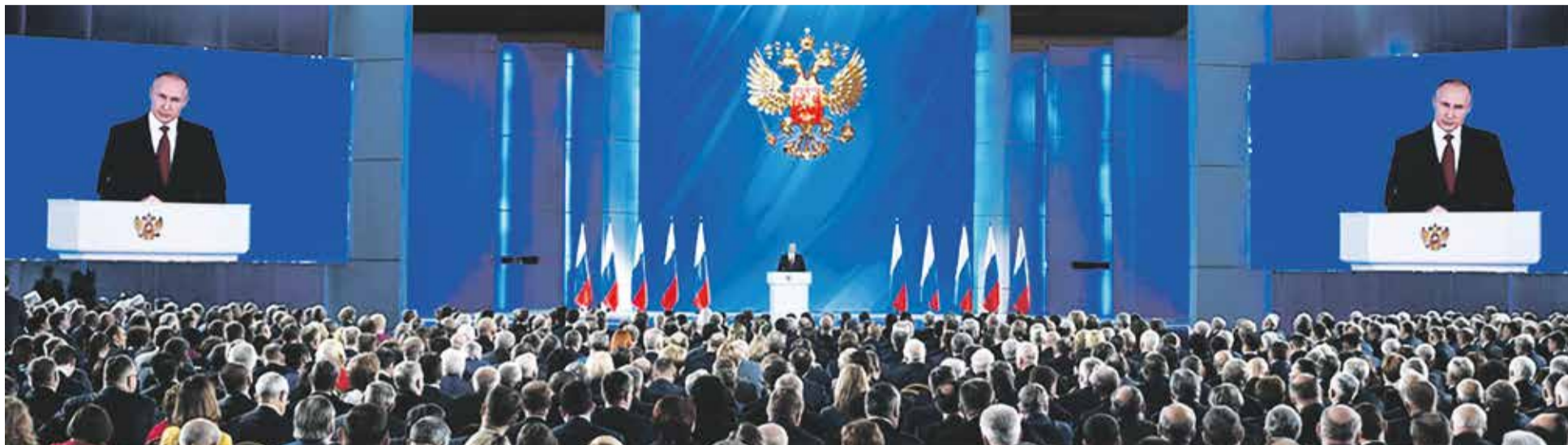
В Послании президента в этом году решено сделать акцент на развитии страны после пандемии.

В ежегодном Послании президента России Федеральному Собранию, с которым Владимир Путин выступит 21 апреля, традиционно будут определены главные векторы развития страны на ближайший год.