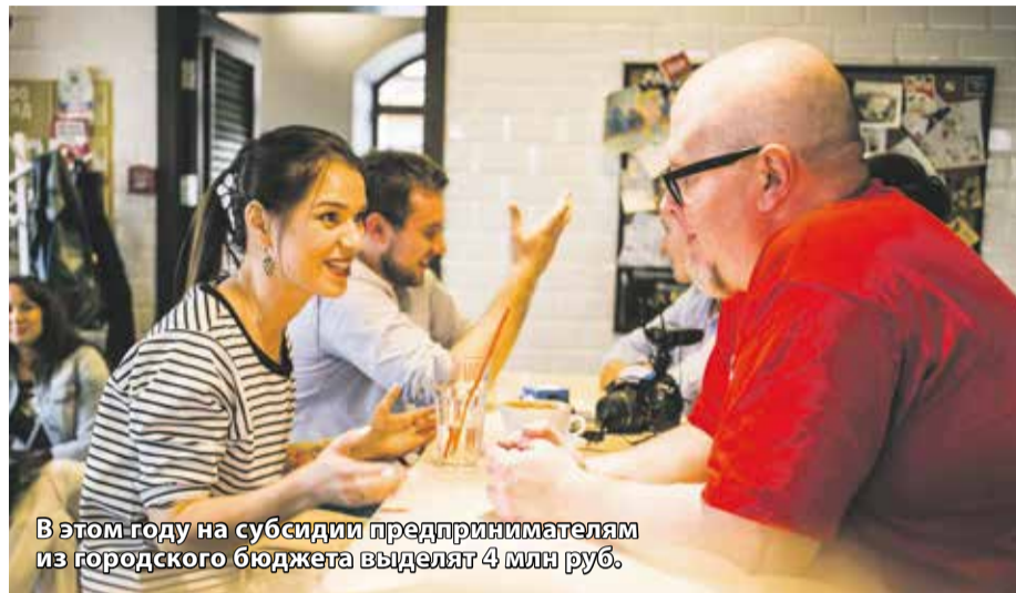
В этом году на субсидии предпринимателям из городского бюджета выделяют 4 млн руб.

— На момент начала пандемии у нас было 5 кофеен в Иркутске. Одну закрыли сразу в апреле, две еще в течение года. Сразу стали искать всевозможные меры поддержки. Взяли кредит под 2 %, который потом государство нам полностью возместило (потому что мы сохранили 90 % штата). Максимальная сумма займа рассчитывалась исходя из количества трудоустроенных сотрудников. Все полученные средства мы направили на зарплаты