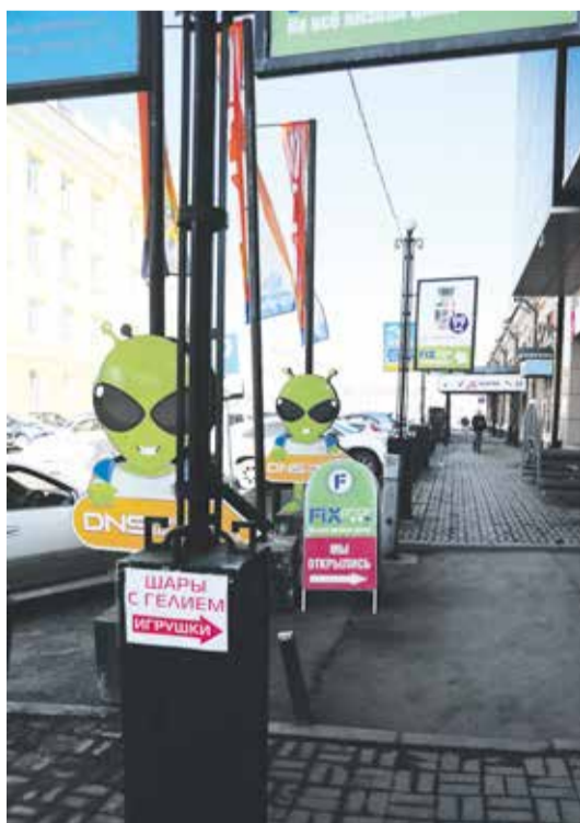
В центральной части города крупные баннеры 3*6 метров уже запрещены. Следующим шагом станет приведение к единообразию маленьких конструкций

Правила игры теперь меняются. Во-первых, разрабатывается новая схема размещения рекламных объектов. В прежней было 1280 мест, теперь их станет меньше.