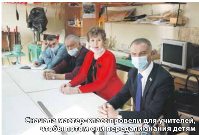
Сначала мастер-класс провели для учителей, чтобы потом они передали знания детям

— И это направление необходимо развивать. Нашему фонду на территории ДОСААФ было выделено помещение в 113 квадратов. Вместе с социальными