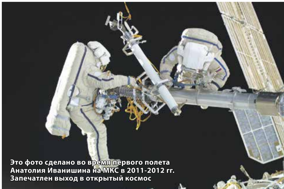
Это фото сделано во время первого полета Анатолия Иванишина на МКС в 2011–2012 гг. Запечатлен выход в открытый космос

Интересные факты о наших внеземных достижениях