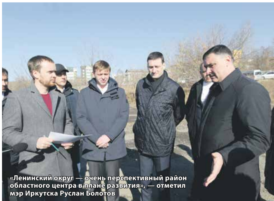
«Ленинский округ — очень перспективный район областного центра в плане развития», — отметил мэр Иркутска Руслан Болотов

Руслан Болотов и Константин Зайцев обсудили перспективы масштабного проекта