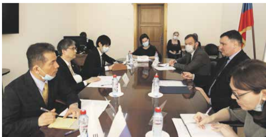
Мэр Иркутска и Генеральный консул Республики Корея в Иркутске обсудили перспективы сотрудничества в области культуры, образования, туризма, экономики и медицины