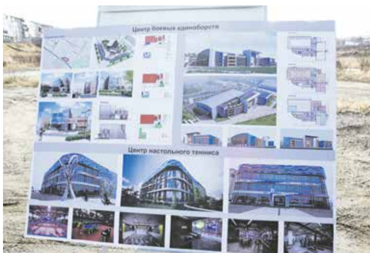
Спортивный кластер станет центром притяжения не только иркутян, но и жителей Ангарска, Шелехова и Усолья-Сибирского