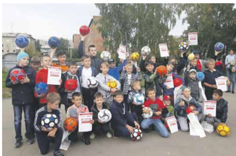
В Ново-Ленино много детей, желающих заниматься спортом, здесь часто проводят дворовые турниры