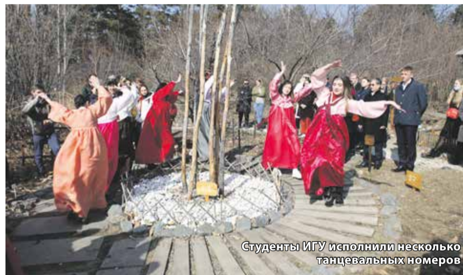
Студенты ИГУ исполнили несколько танцевальных номеров