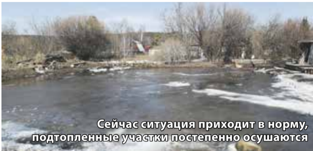
Сейчас ситуация приходит в норму, подтопленные участки постепенно осушаются

— На борьбу со стихией были брошены силы администрации города, МЧС, аварийно-спасательного отряда. В течение дня пропаривали и пропиливали русло реки Солонянки, завозили гравий, откачивали воду из домов. В Иркутске введен режим повышенной готовности, — прокомментировал ситуацию депутат Алексей Распутин.