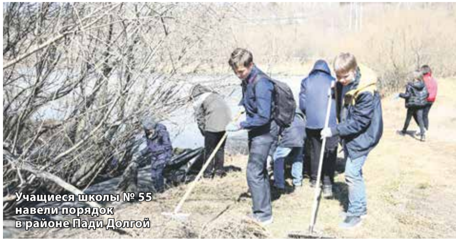
Учащиеся школы № 55 навели порядок в районе Пади Долгой

Иркутяне открыли сезон генеральной уборки города