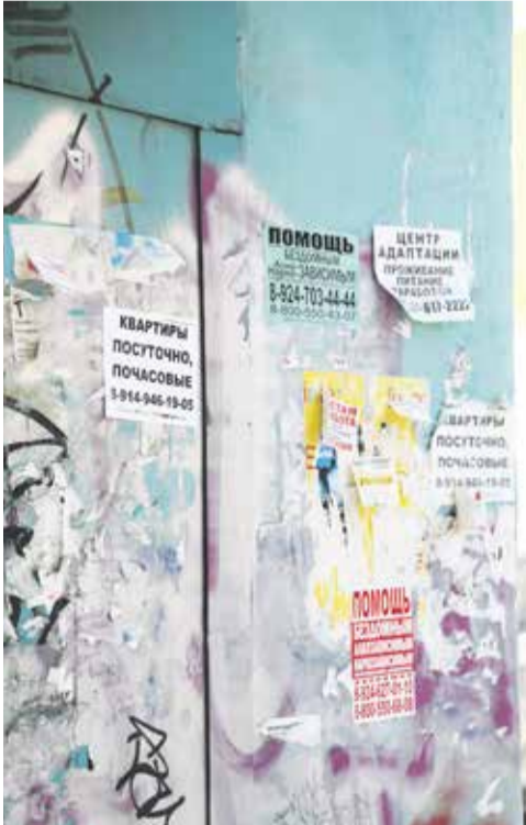
Незаконные объявления скоро исчезнут с остановок, опор освещения и городских стен: с ними будет бороться система «Автодозвон»

— Мы понимаем, что в этом случае капитальные вложения предпринимателей станут выше (покупка экрана, затраты на управление системы и электроэнергию), поэтому контракты будут разыгрываться на более длительный срок, на 10 лет.