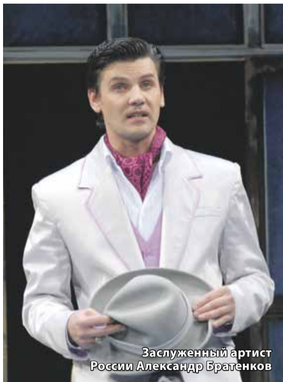
Заслуженный артист России Александр Братенков

Заслуженный артист России — о своем амплу и значимых ролях на сцене Иркутского драмтеатра