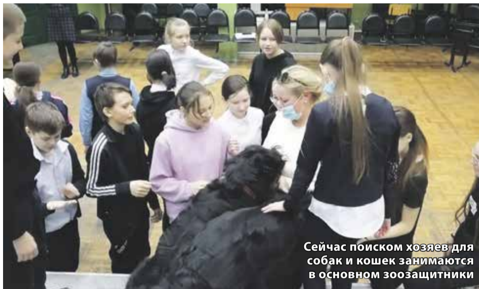
Сейчас поиском хозяев для собак и кошек занимаются в основном зоозащитники

ром пояснили, как не бояться собак, как вести себя при их нападении, почему они бросаются на людей и на что реагируют.