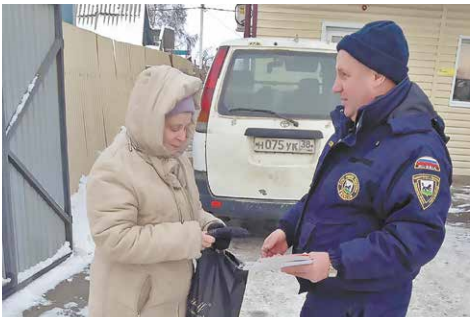
Специалисты МКУ города Иркутска «Безопасный город» рассказывают жителям, как действовать в случае наступления большой воды, раздают памятки