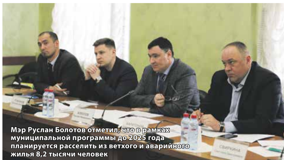
Мэр Руслан Болотов отметил, что в рамках муниципальной программы до 2025 года планируется расселить из ветхого и аварийного жилья 8,2 тысячи человек

В администрации Иркутска обсудили вопросы расселения аварийного жилищного фонда