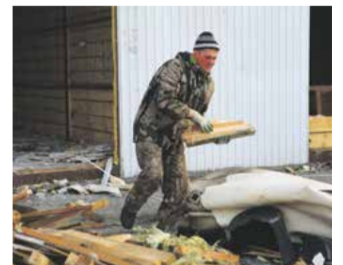
До конца марта площадку расчистят полностью