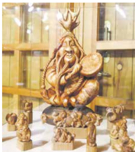
На выставке можно увидеть самые разные виды резьбы по дереву

Выставка-конкурс «Сказка в дереве» открылась в Усадьбе В.П. Сукачева