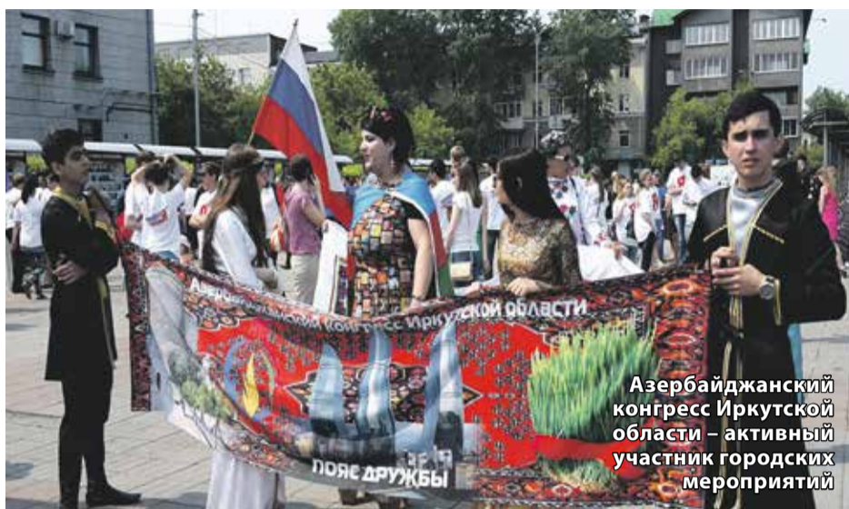
Азербайджанский конгресс Иркутской области — активный участник городских мероприятий

Как в областном центре отметят один из самых древних праздников весны