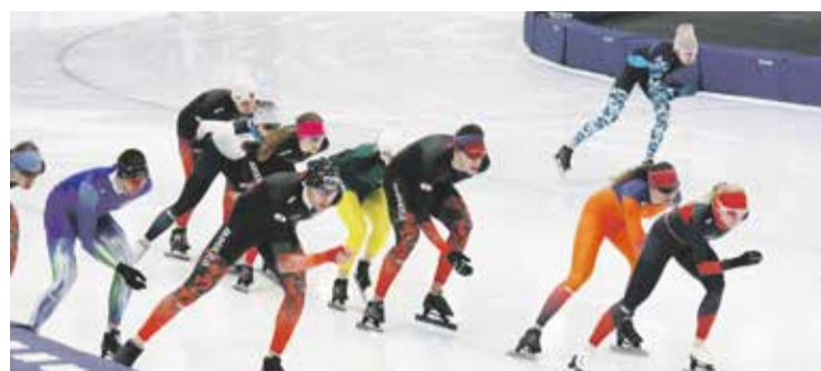
За победу в чемпионате боролись более 80 конькобежцев из 22 регионов России

— Я слышала, как болельщики восхищались конькобежцами: «Как это здорово смотрится, как