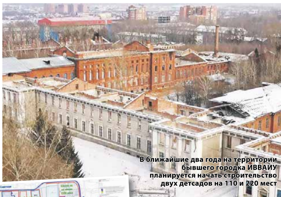
В ближайшие два года на территории бывшего городка ИВВАИУ планируется начать строительство двух детских садов на 110 и 220 мест

В бывшем городке ИВВАИУ определили площадки для строительства школы и четырех детских садов