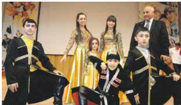
Юное поколение с интересом соблюдает традиции предков