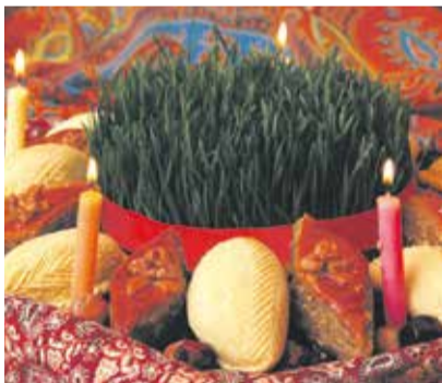
Сэмэни и сладости на праздничном столе — к благополучию

Несколько лет назад праздник стал общегородским: сначала его проводили в кинотеатре «Художественный», а затем Навруз, что называется, вышел на улицы, и его площадкой стала территория возле Дворца спорта «Труд». В 2019 году здесь установили сцену для выступлений национально-культурных объединений и разбили палатки с бесплатными угощениями для горожан и выставкой изделий народных умельцев. Народные гуляния собирались превратить в традицию, но свои коррективы в эти планы