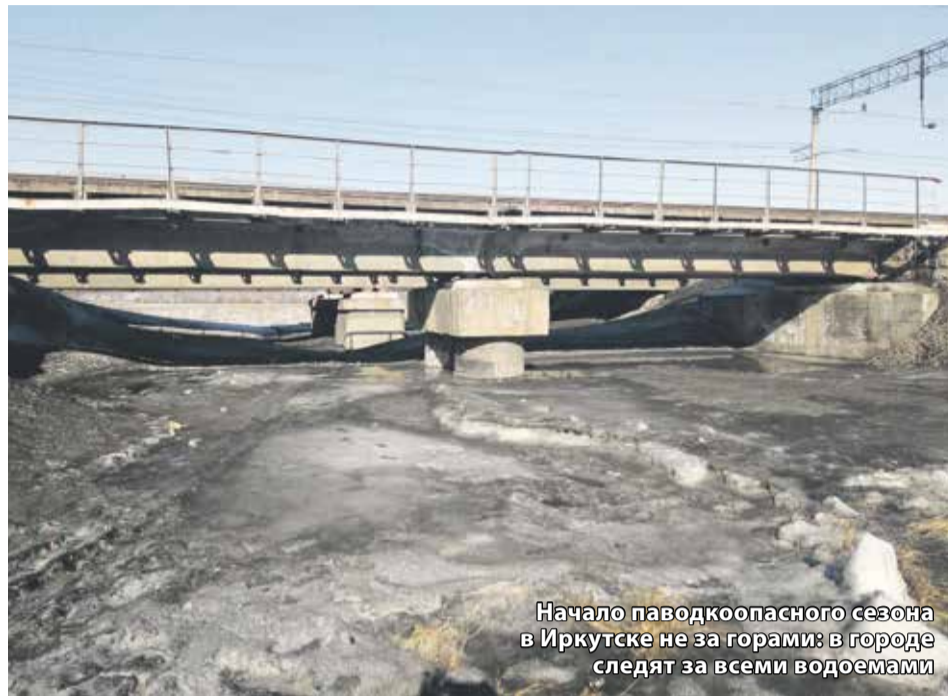
Начало паводкоопасного сезона в Иркутске не за горами: в городе следят за всеми водоемами

В Иркутске идет подготовка к весеннему паводкоопасному периоду