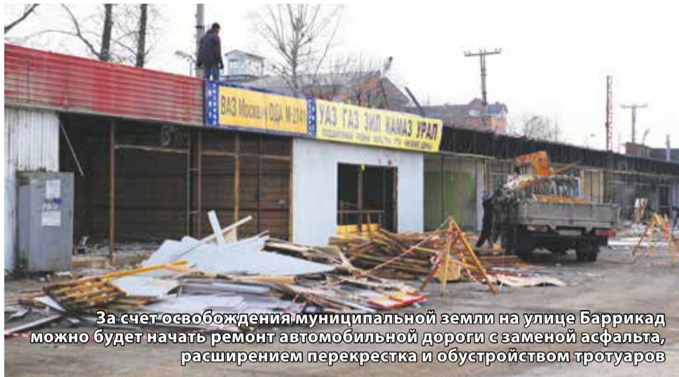
За счет освобождения муниципальной земли на улице Баррикад можно будет начать ремонт автомобильной дороги с заменой асфальта, расширением перекрестка и обустройством тротуаров

На рынке «Знаменский» проводится снос 12 незаконных павильонов