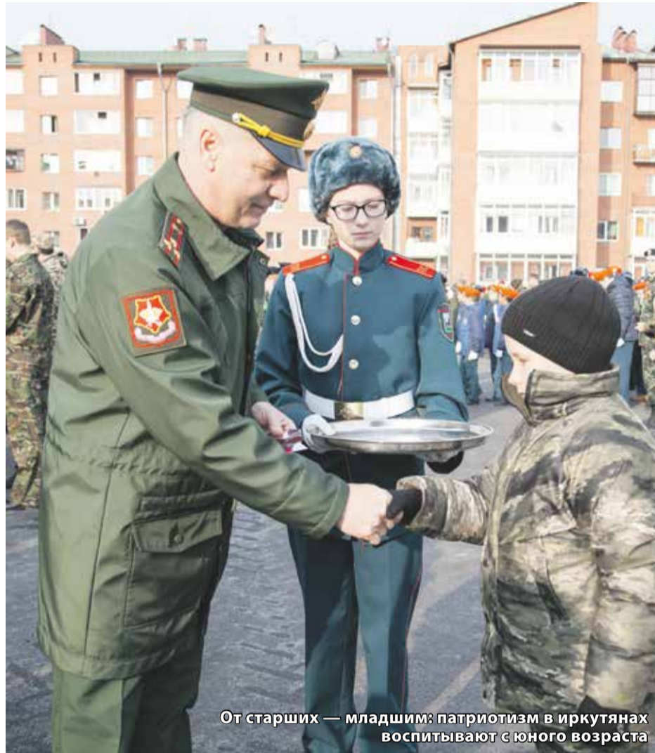
От старших — младшим: патриотизм в иркутянах воспитывают с юного возраста

— Детей сегодня нужно обучать не только с точки зрения физиче-