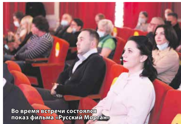
Во время встречи состоялся показ фильма «Русский Морган»

мочь тем, кто нуждался. Это дорогого стоит.