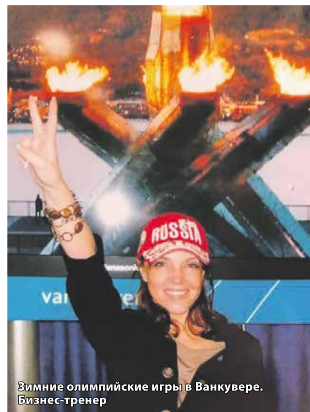
Зимние олимпийские игры в Ванкувере. Бизнес-тренер

А потом наступила черная полоса: «После Олимпийских игр было сложно найти работу по специальности. У меня началась жуткая депрессия: я была в отчаянии, плакала, не спала ночами, выпивала вино, чтобы снять стресс. В какой-то момент даже возникла мысль — не хочу жить. Спрашивала себя: зачем уехала из родной страны, чтобы начать с нуля и выстраивать жизнь заново? В чужой стране твои прежние заслуги и регалии никому не нужны».