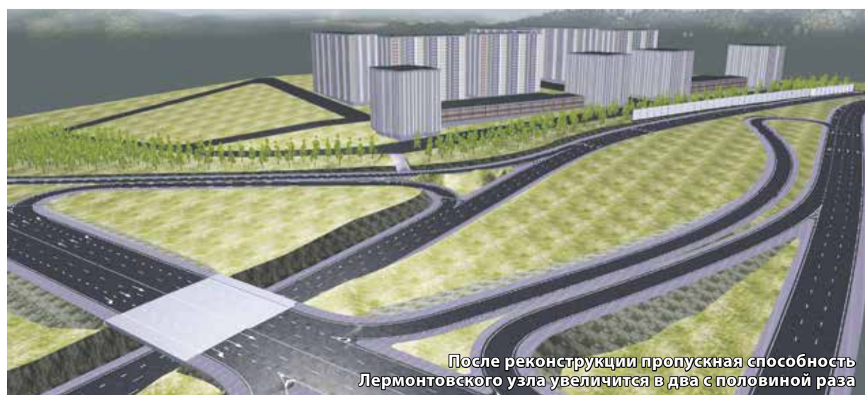
После реконструкции пропускная способность Лермонтовского узла увеличится в два с половиной раза

Отметим, что муниципальный контракт на разработку проектной документации по реконструкции Лермонтовского транспортного узла был заключен в 2020 году, завершить работы по ПСД планируется в конце 2021 года. Реализация проекта намечена на 2022–2024 годы. Предварительно реконструкция развязки оценивается в 3 миллиарда рублей.