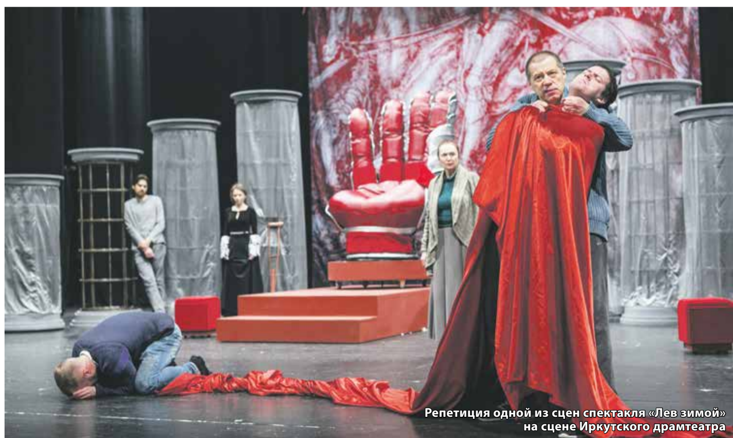
Репетиция одной из сцен спектакля «Лев зимой» на сцене Иркутского драмтеатра