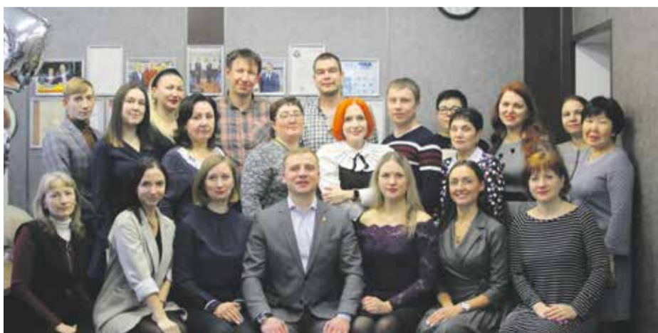
Коллектив МКУ «СШ «Центр развития спорта»