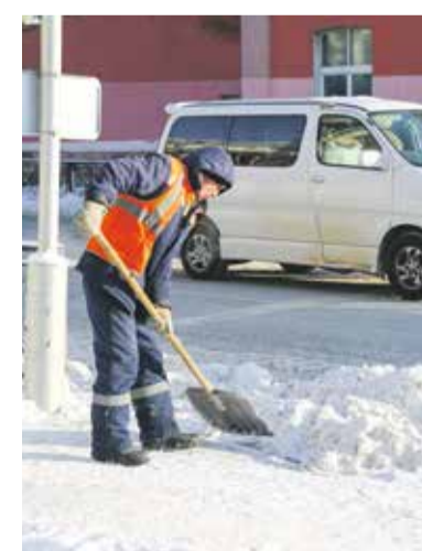
Дворники работают с 5 часов утра, чтобы подготовить тротуары к появлению первых пешеходов