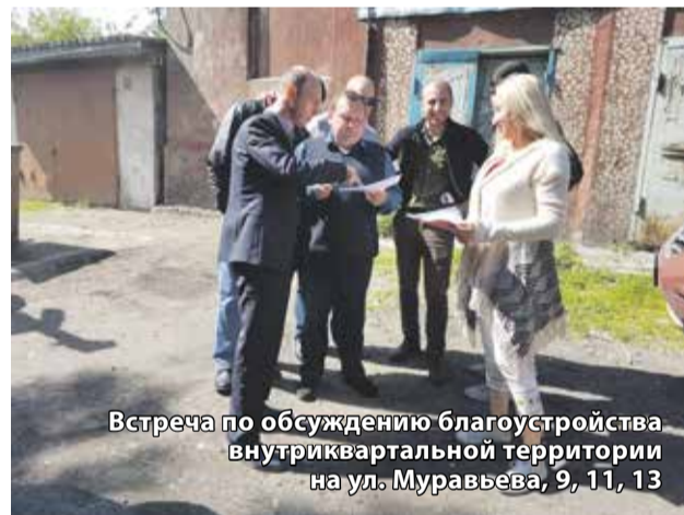
Встреча по обсуждению благоустройства внутриквартальной территории на ул. Муравьева, 9, 11, 13

Ворошиловой, Лескова, Шевченко, Поликарпова, Державина, проездов Морского и Моторного, переулка Октябрьского. Отремонтировали дорожное полотно во дворе домов на ул. Гравийной, 12–14, ямочный ремонт сделан на ул. Гравийной, Курганской, Макаренко. На улицах Александра Матросова, Попова, в проезде Моторном и переулке Дальнем заменили плафоны на уличных фонарях.