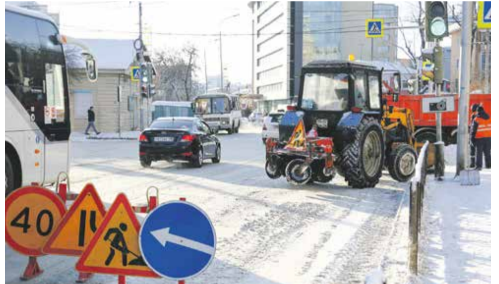
Улица Чкалова считается одной из самых неудобных для уборки. Узкие полосы, интенсивное движение — сплошной стресс для дорожников