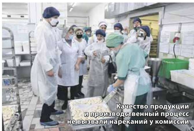
Качество продукции и производственный процесс не вызвали нареканий у комиссии

Депутаты сравнили производство школьной еды на Комбинате питания и в Центре образования № 47