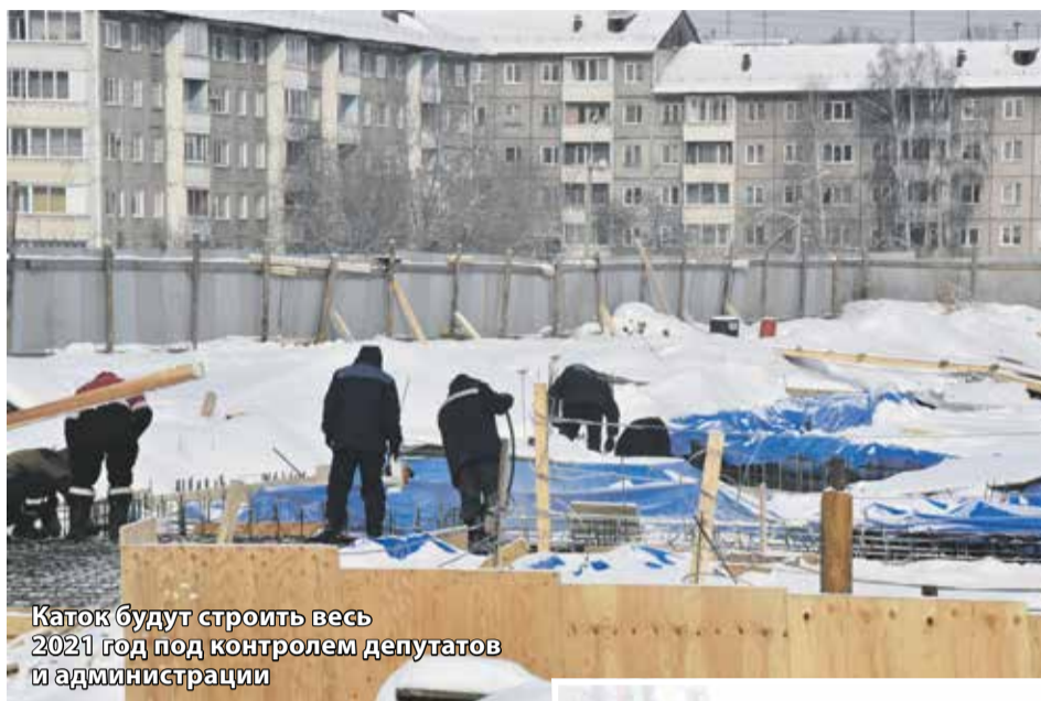
Каток будут строить весь 2021 год под контролем депутатов и администрации

В пади Долгой строится крытая ледовая арена