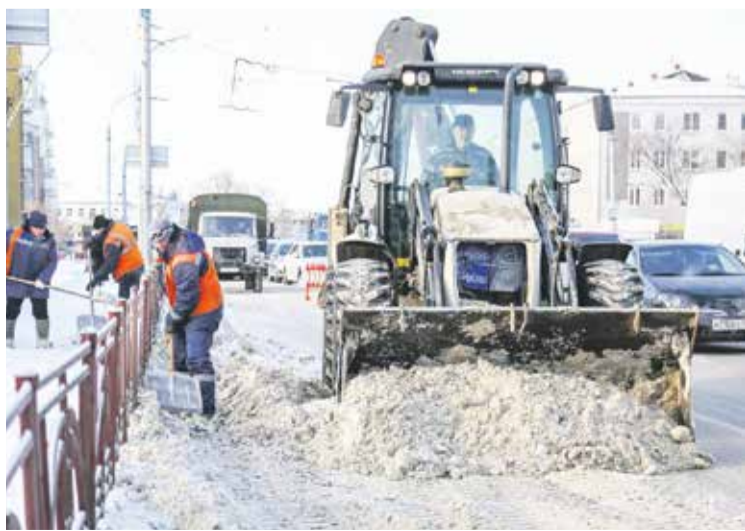
Дорожники с сожалением констатируют: «У автомобилистов — никакой солидарности. Сначала сами лезут под ковш, а потом жалуются, что мы улицы медленно чистим»

Нынешние пробки спровоцированы не только осадками. Во-первых, в городе неумолимо растет число автомобилей. По данным ГИБДД, за последний год количество личного транспорта в Иркутске и Иркутском районе увеличилось на 10 тысяч единиц. А во-вторых, транспортные заторы часто создают сами автомобилисты — особенно во время снегопадов.