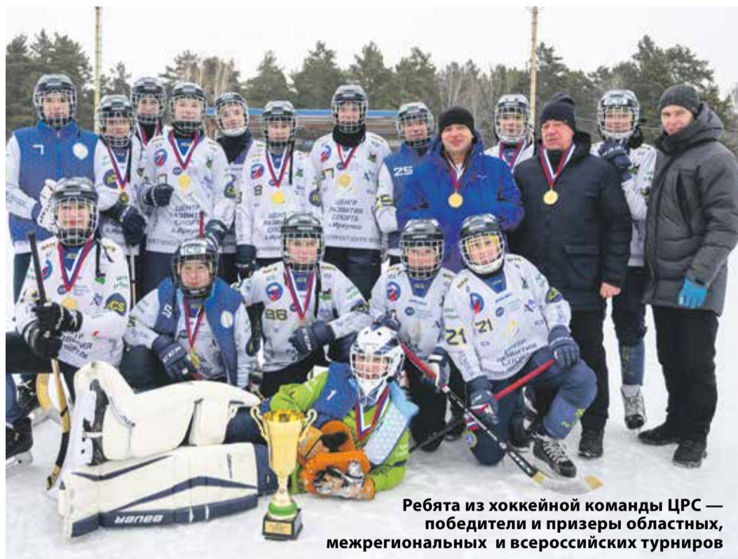
Ребята из хоккейной команды ЦРС — победители и призеры областных, межрегиональных и всероссийских турниров

«Центр развития спорта» отметил свою первую юбилейную дату