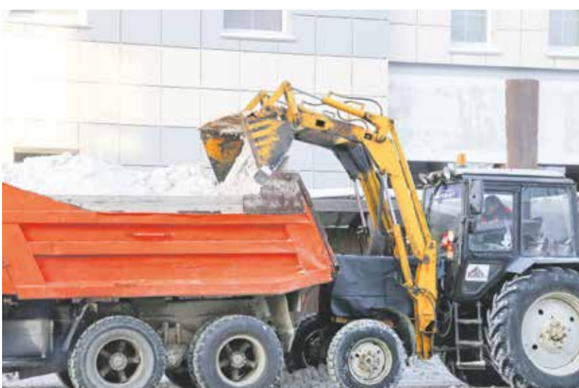
За январь с улиц Иркутска вывезено 40 тысяч тонн снега, за первую половину февраля — уже 38 тысяч тонн