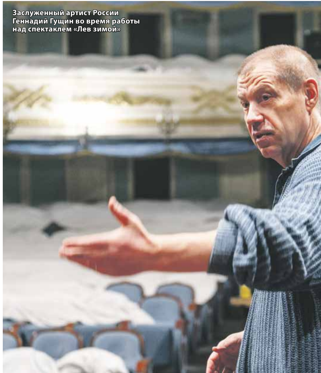
Заслуженный артист России Геннадий Гуцин во время работы над спектаклем «Лев зимой»

труды, по сути, напрасны, поскольку и сыновья, и жена предали его, от каждого он ждет удара в спину. И это уже не про власть, а про то, что наши современники наблюдают в собственных семьях, что чувствуют, глядя на своих детей. И при разборе материала мы именно на это и делаем главный акцент.