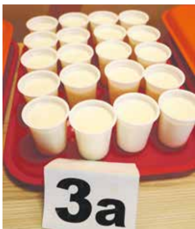
Ученики начальных классов ежедневно получают по стакану молока

Всего в 74 общеобразовательных учреждениях Иркутска обучается свыше 85 тысяч детей, и более 50 тысяч из них получают питание бесплатно. Это учащиеся начальной школы, дети из многодетных и малообеспеченных семей, дети с ограниченными возможностями здоровья, а также другие категории льготников. Кроме горячего питания, более 37 тысяч учеников младших классов получают молоко.