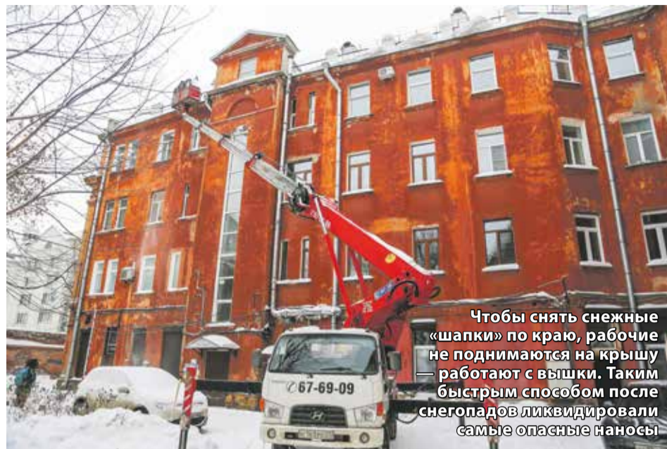
Чтобы снять снежные «шапки» по краю, рабочие не поднимаются на крышу — работают с вышки. Таким быстрым способом после снегопадов ликвидировали самые опасные наносы

Кто должен чистить крыши домов и зданий от скоплений снега