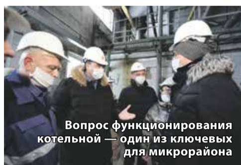
Вопрос функционирования котельной — один из ключевых для микрорайона

администрация Иркутска приняла решение сменить поставщика.