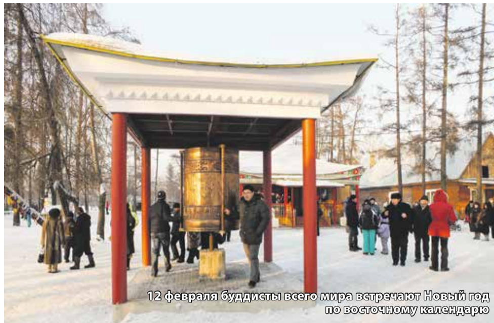
12 февраля буддисты всего мира встречают Новый год по восточному календарю

Новый год буддисты встретят обрядом очищения от зла и болезней