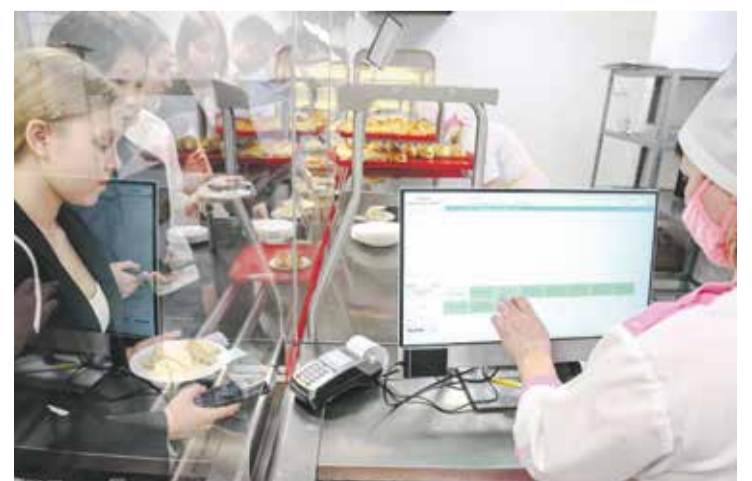
Весеннее меню в школьных столовых также будет проходить родительский контроль