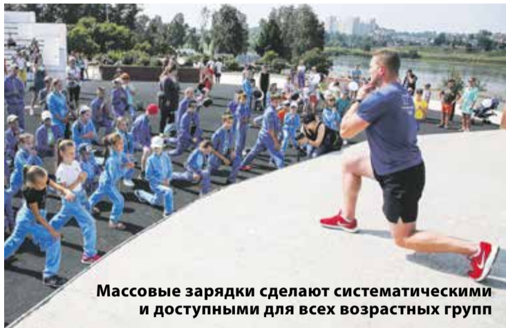
Массовые зарядки сделают систематическими и доступными для всех возрастных групп