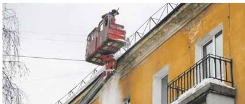
Для обслуживающих компаний и собственников зданий существует четкий регламент: снег на крыше не должен превышать 30 см. В этом году сугробы появились раньше обычного