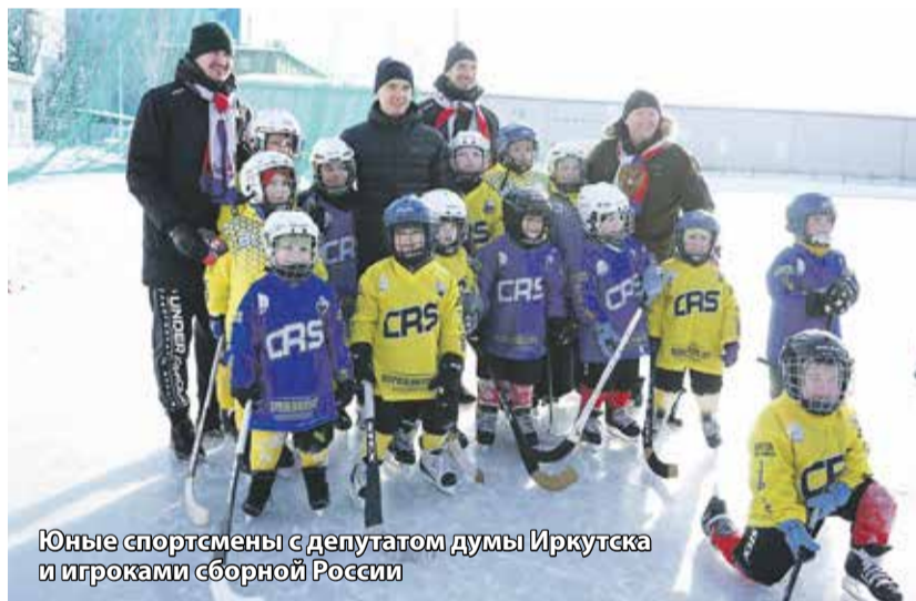
Юные спортсмены с депутатом думы Иркутска и игроками сборной России