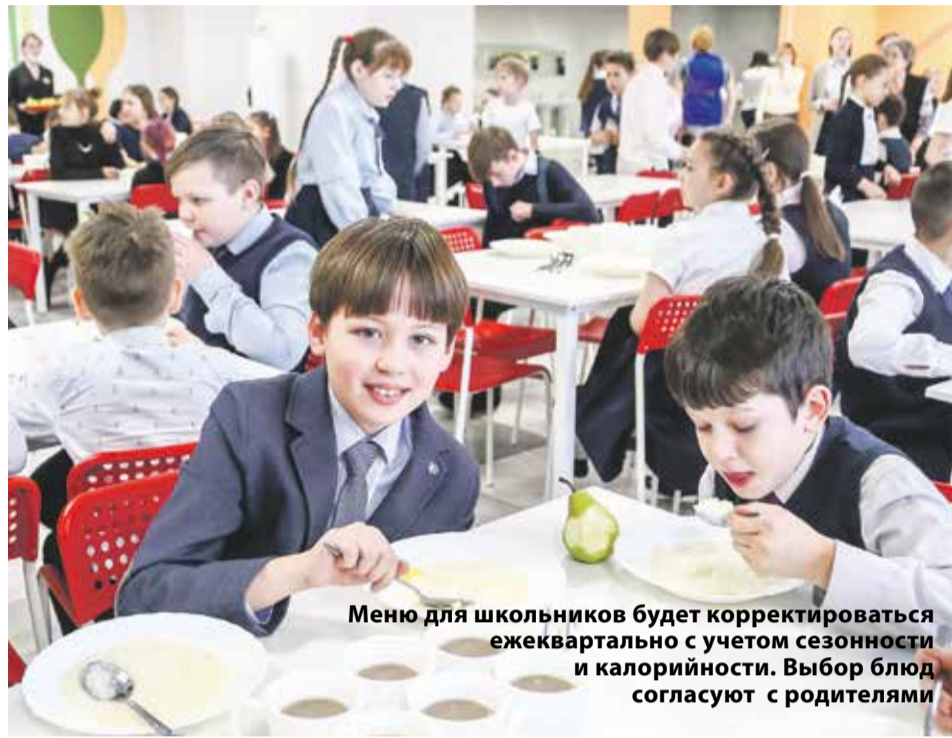
Меню для школьников будет корректироваться ежеквартально с учетом сезонности и калорийности. Выбор блюд согласуют с родителями