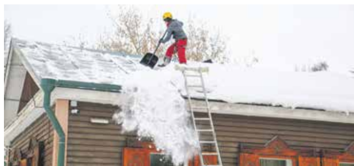
Убирать снег с памятников архитектуры доверяют только проверенным компаниям, у которых есть полное снаряжение и работают сертифицированные промышленные альпинисты

— По поручению мэра Руслана Болотова к уборке было привлечено почти 300 единиц техники и порядка 2000 человек. Подключились волонтеры, а предприниматели предоставили дополнительную технику. Особое внимание уделяли местам с большим трафиком пешеходов: общественным пространствам, лестницам и пешеходным переходам, — отметил глава комитета городского обустройства администрации Иркутска Роман Орноев.