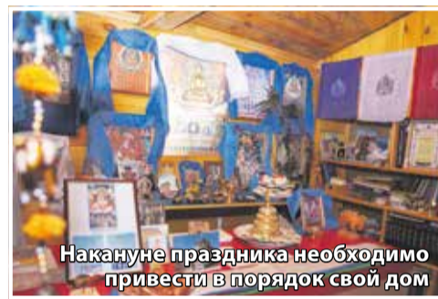
Накануне праздника необходимо привести в порядок свой дом

— Есть ли какие-то особенные блюда, которые буряты готовят в Сагаалган?