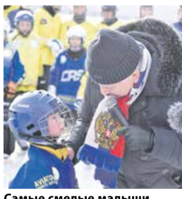
Самые смелые малыши задавали звездам хоккея вопросы