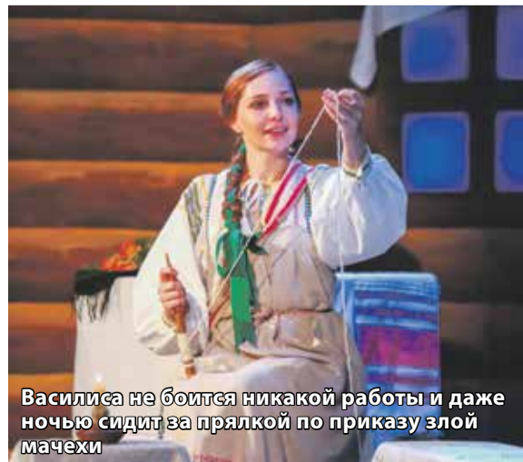
Василиса не боится никакой работы и даже ночью сидит за пряхкой по приказу злой мачехи

Нина Александрова