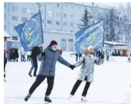
На коньки в этот день встали студенты всех ссузов и вузов Иркутска