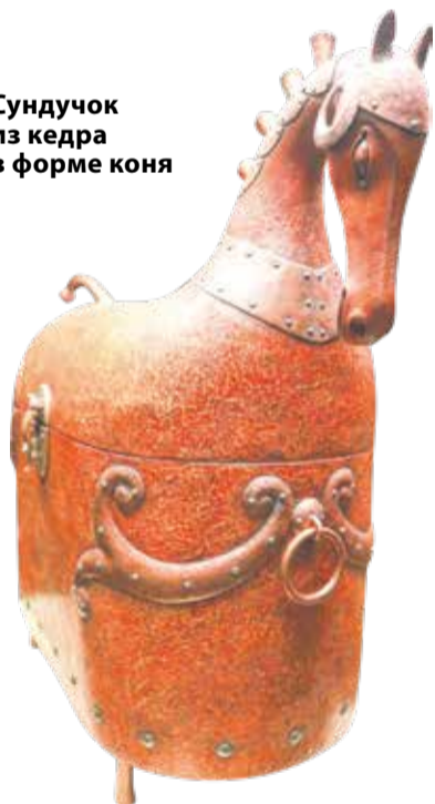
Сундучок из кедра в форме коня

можно разгадать самим, но можно и воспользоваться аудиогидом — доступ к нему открывает QR-код. Вот Намгар — это