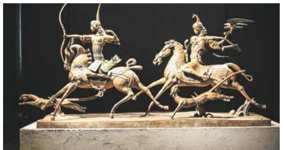
Скульптуры Даши Намдакова в новом выставочном пространстве