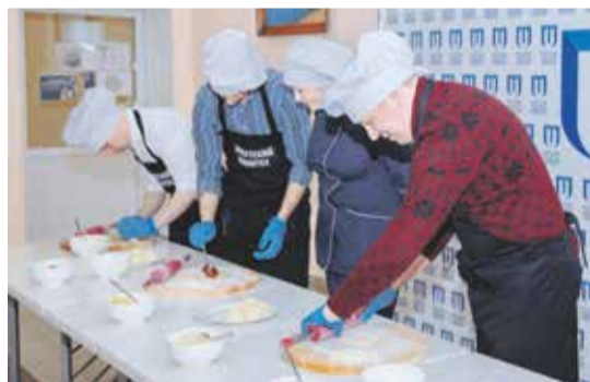
«Путь к сердцу студентов лежит через желудок», — уверен ректор ИрНИТУ

Танцевальные, вокальные коллективы и команда КВН создавали атмосферу капустника, по которой все изрядно соскучились. Вечером