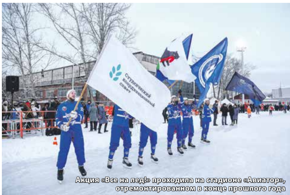
Акция «Все на лед!» проходила на стадионе «Авиатор», отремонтированном в конце прошлого года