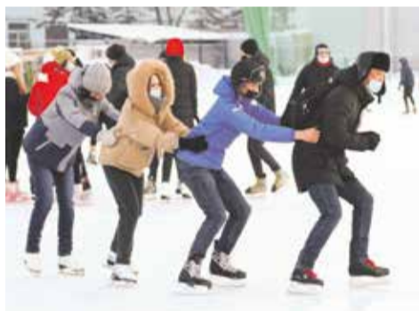
Катание продолжалось до самого вечера

Специально для гостей на «Авиаторе» оборудовали прокат коньков, теплые раздевалки, точки питания. Хотя некоторые пришли