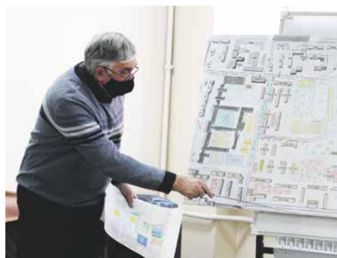
Большую часть предложений жильцов по проекту планировки территории администрация города учла