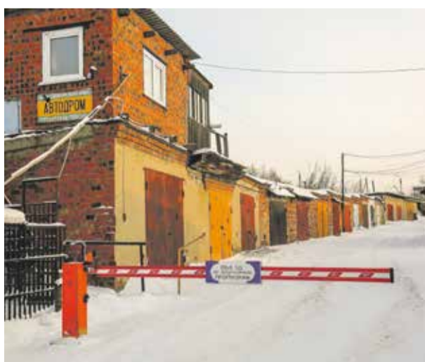
Мэрия готова выкупить по рыночной стоимости несколько гаражей, попадающих в «пробивку» улицы Пискунова