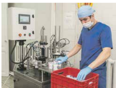
Молочная кухня может стать иркутским брендом

В ближайшем будущем в Свердловском округе появится два новых детских сада — в ЖК «Союз» на 160 мест и на ул. Костычева на 110 мест. Участки уже сформированы, деньги на строительство сада в «Союзе» заложены на 2022 год, однако с застройщиком проведут переговоры и, возможно, работы начнут раньше.