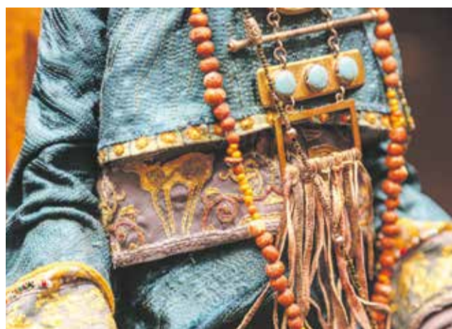
Бережно проработанные детали костюмов — настоящее искусство