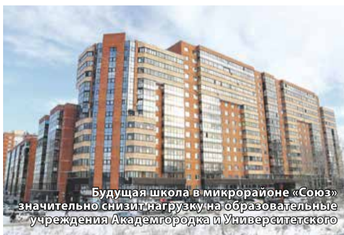
Будущая школа в микрорайоне «Союз» значительно снизит нагрузку на образовательные учреждения Академгородка и Университетского

Для будущей школы в микрорайоне «Союз» выбирают тематику