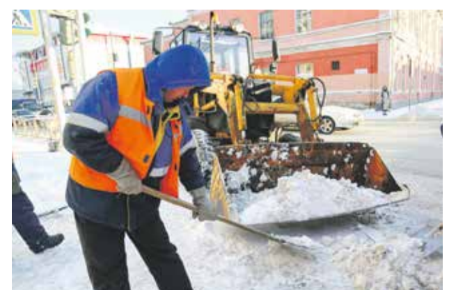
Основные городские магистрали чистят в первую очередь