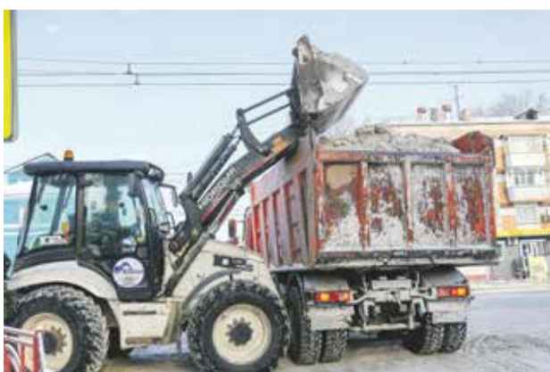
С начала января с городских улиц и трасс ежесуточно вывозится до 2–2,5 тысяч тонн снега