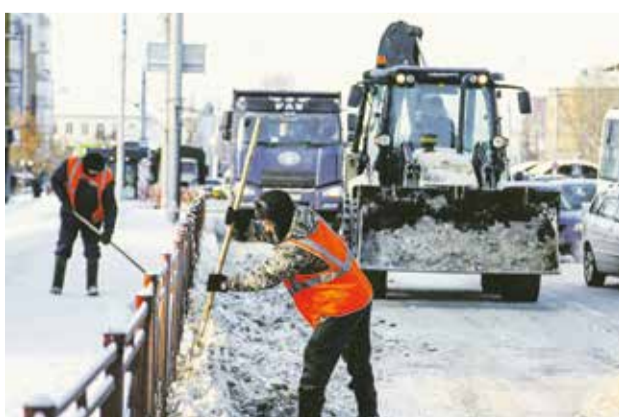
На уборку трасс в Иркутске регулярно выходит от 70 до 100 единиц специализированной техники

Водителей призывают быть осторожнее и обращать внимание на дорожную ситуацию