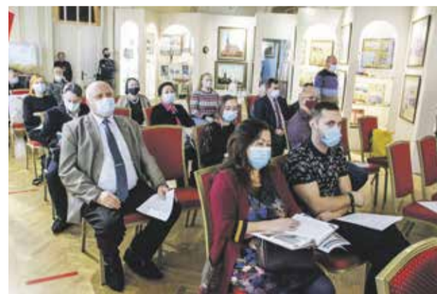
Презентация издания прошла в Музее истории города Иркутска в декабре 2020 года