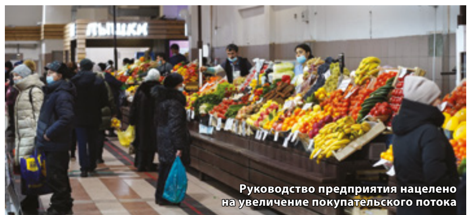
Руководство предприятия нацелено на увеличение покупательского потока