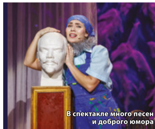
В спектакле много песен и доброго юмора