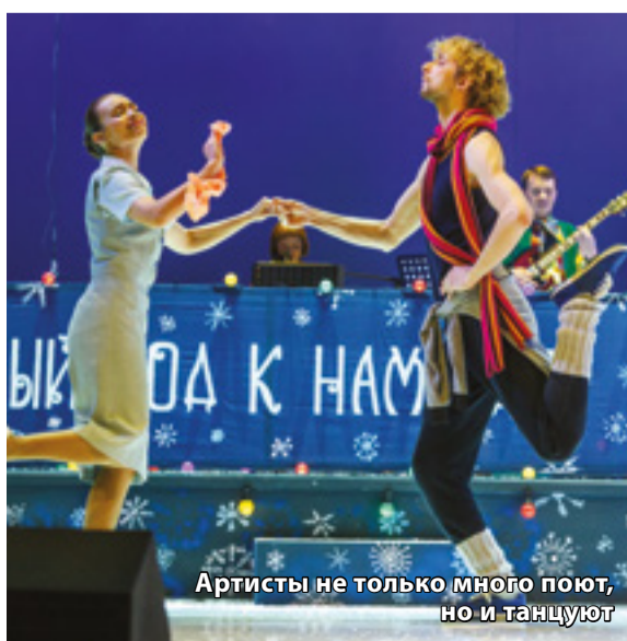
Артисты не только много поют, но и танцуют