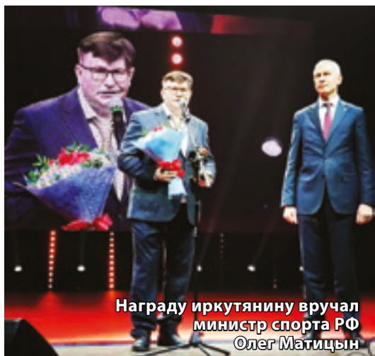
Награду иркутянину вручал министр спорта РФ Олег Матицын

Айкидо — вид боевых искусств, считается одной из ветвей традиционного будо. По определению айкидо — это боевое искусство, сочетающее древние техники борьбы и самообороны с философией гармонии духа. Само название айкидо составлено из трех иероглифов, каждый из них по отдельности обладает несколькими значениями. Иероглиф «ай» означает гармонию, выгоду; «ки» — это энергия духа и движение пара; «до» — дорога, способ. Составленные вместе, все эти знаки обозначают «путь к гармонии духа».