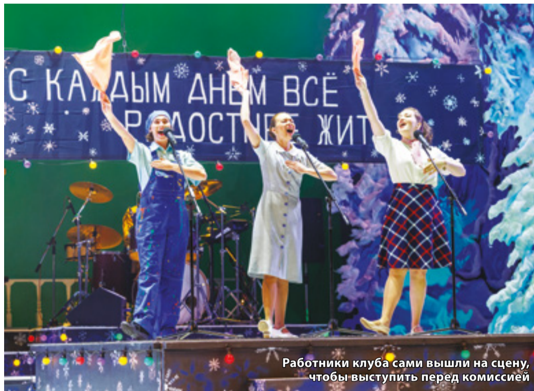
Работники клуба сами вышли на сцену, чтобы выступить перед комиссией