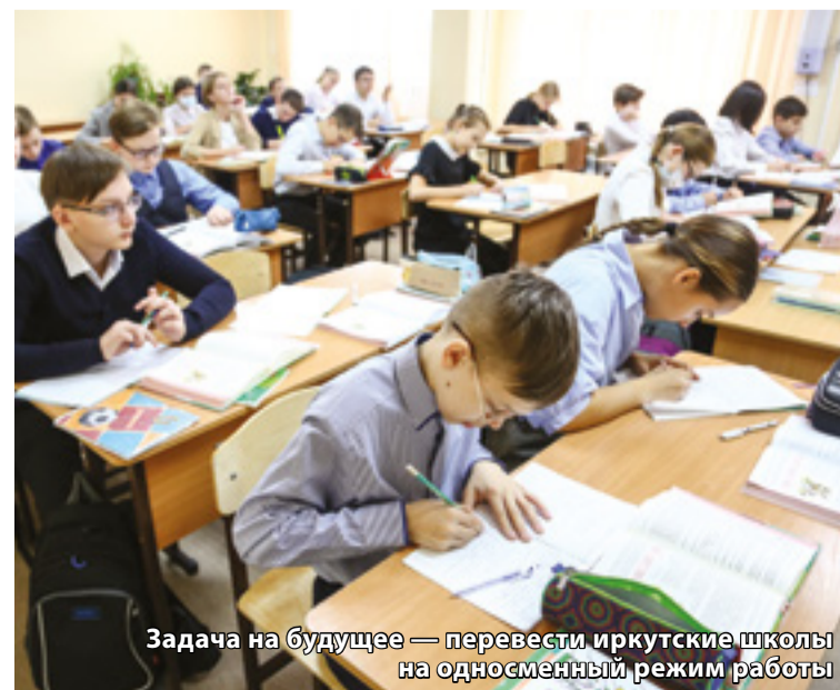
Задача на будущее — перевести иркутские школы на односменный режим работы