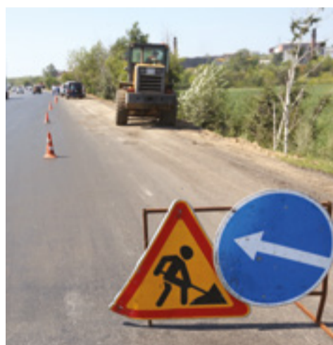
В 2021 году в Иркутске запланирован ремонт 19 участков дорог общей протяженностью 22 км