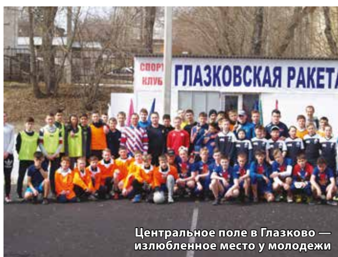
Центральное поле в Глазково — излюбленное место у молодежи