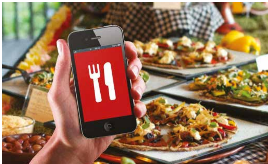
Россияне активно используют приложения на смартфонах для доставки еды и продуктов

Число покупателей, которые приобрели фильмы, игры, подписки на сервисы и другие цифровые товары, выросло в «черную пятницу»