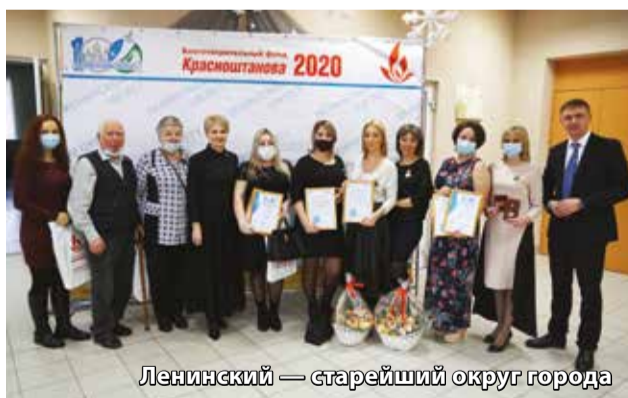
Ленинский — старейший округ города

Депутаты думы Иркутска наградили жителей округа знаками признания