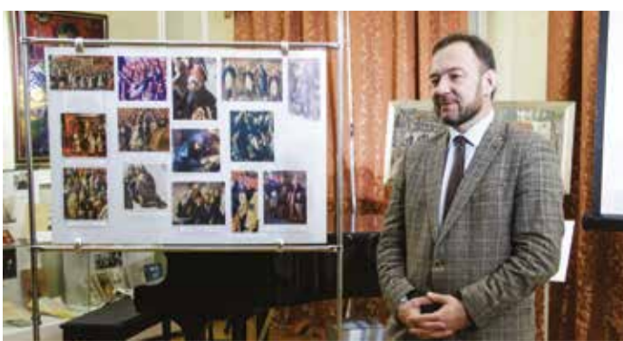
Виталий Барышников считает, что картина — настоящий раритет, который открыл неизвестную страницу в истории Иркутска