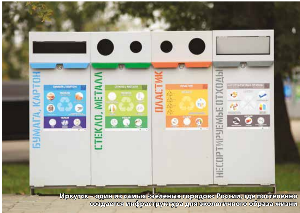
Иркутск — один из самых «зеленых городов» России, где постепенно создается инфраструктура для экологичного образа жизни

Фестиваль «Эковолна» впервые провели в Иркутске