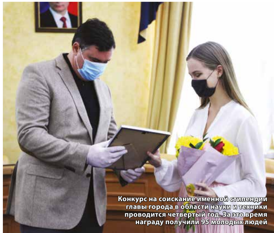
Конкурс на соискание именной стипендии главы города в области науки и техники проводится четвертый год. За это время награду получили 95 молодых людей