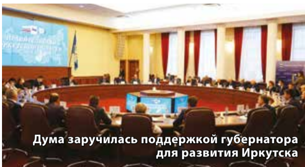
Дума заручилась поддержкой губернатора для развития Иркутска

Депутаты создадут реестр остро необходимых Иркутску социальных объектов