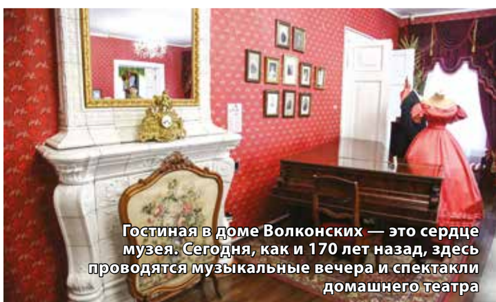
Гостиная в доме Волконских — это сердце музея. Сегодня, как и 170 лет назад, здесь проводятся музыкальные вечера и спектакли домашнего театра

Юбилейная выставка «Между прошлым и будущим» будет работать до конца новогодних каникул. Посетить ее можно по предварительной записи группами не более пяти человек (подробности по тел.: 20-75-32, 29-26-63). К остальным мероприятиям фестиваля «Декабристские вечера» можно присоединиться в онлайн-формате (в социальных сетях и на сайте музея imd38.ru). 11 декабря состоится презентация большого иллюстрированного альбома «Иркутский музей декабристов: страницы биографии. К 50-летию музея». А 20 декабря программу фестиваля завершит спектакль Домашнего театра Волконских «Нерешительный, или Семь пятниц на неделе» по пьесе Н.И. Хмельницкого.