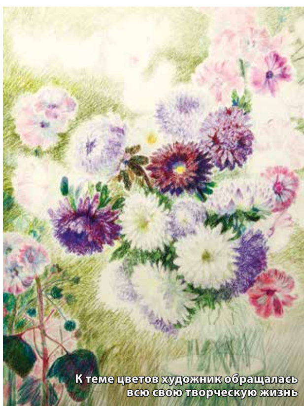
К теме цветов художник обращалась всю свою творческую жизнь

Выставка к юбилею Раисы Бардиной-Шпирко открылась в Музейной студии краеведческого музея