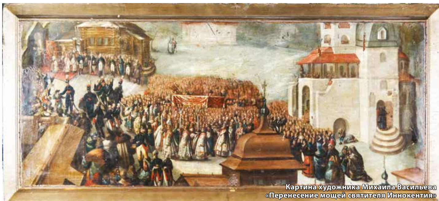
Картина художника Михаила Васильева «Перенесение мощей святителя Иннокентия»

Музей истории Иркутска представил картину, созданную более 200 лет назад