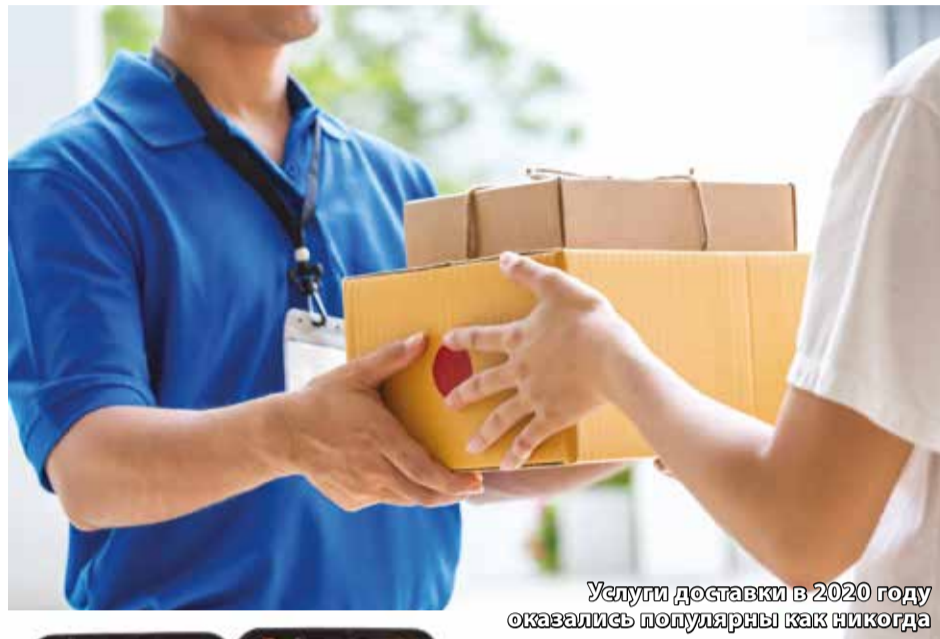
Услуги доставки в 2020 году оказались популярны как никогда

Спрос на услуги доставки товаров в 2020 году побил все рекорды