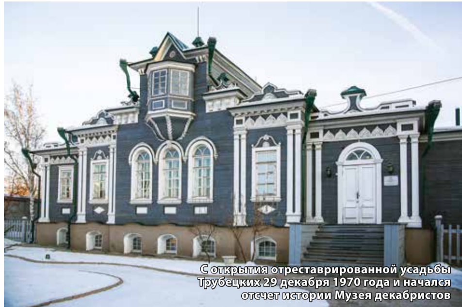
С открытия отреставрированной усадьбы Трубецких 29 декабря 1970 года и начался отсчет истории Музея декабристов

Музей декабристов отмечает свое 50-летие