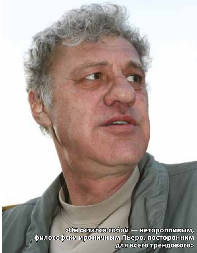
«Он остался собой — неторопливым, философски ироничным Пьеро, посторонним для всего трендового»

Жалко, что реализовать свой творческий дар он так и не смог. Ему хотелось и нравилось писать о людях, размышлять об их судьбах. Но не с набега, не с присущей нашему времени поверхностностью соцсетей, а серьезно, вдумчиво. При этом он понимал, что такое творчество интересно единицам, и круг его общения в последние годы сузился до единиц. Когда мы еще поддерживали редкие телефонные разговоры, он всегда спрашивал: «Пишешь?» Если слышал, что есть новый незаконченный рассказ, искренне