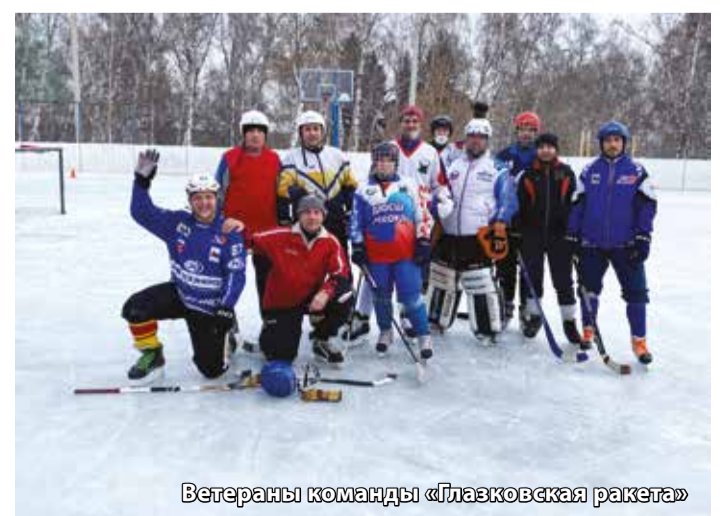
Ветераны команды «Глазковская ракета»