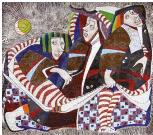
«Перед сном» (медь, эмаль)

Нина Александрова