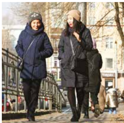
Основными точками нашей прогулки стали Академгородок и центр города