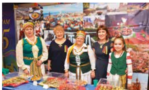
Иркутские литовцы активно поддерживают свои традиции