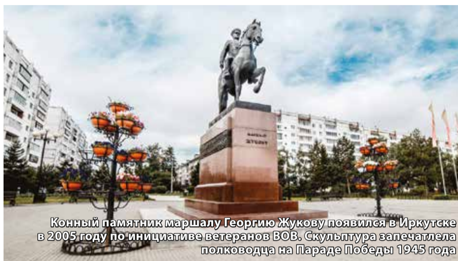
Конный памятник маршалу Георгию Жукову появился в Иркутске в 2005 году по инициативе ветеранов ВОВ. Скульптура запечатлела полководца на Параде Победы 1945 года

Малоизвестные факты из жизни Маршала Советского Союза, четырежды Героя Советского Союза Георгия Жукова