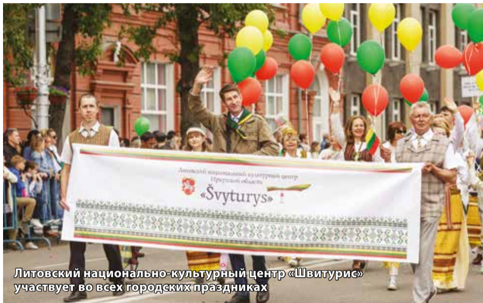
Литовский национально-культурный центр «Швитурис» участвует во всех городских праздниках

Председатель Иркутской областной общественной организации «Литовский национально-культурный центр Иркутской области «Швитурис» («Маяк») — о сохранении традиций