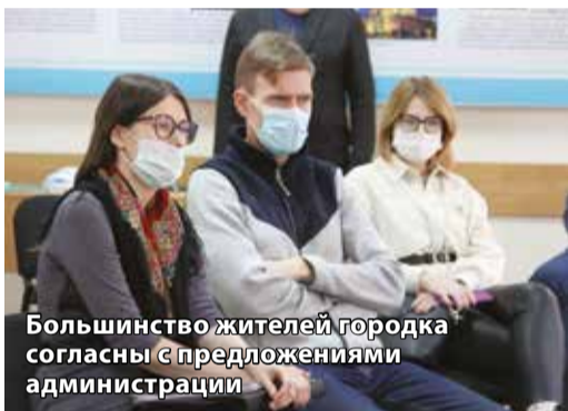
Большинство жителей городка согласны с предложениями администрации

— Долгие годы на этой территории ничего не делалось. И вот, наконец, начались реальные позитивные изменения: в следующем году здесь заработает Суворовское