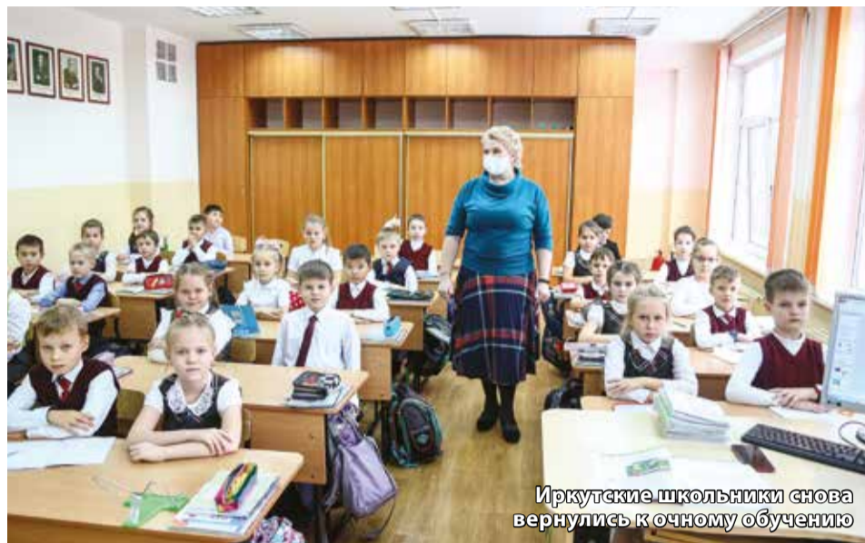
Иркутские школьники снова вернулись к очному обучению