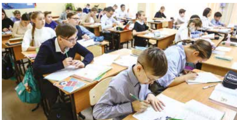
Ученики сами признают: воспринимать материал в классе куда проще, чем дистанционно