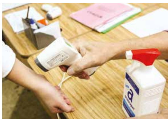
В школах города — усиленный контроль за состоянием здоровья детей и педагогов