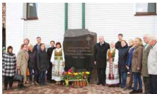
В память о репрессированных литовцах в областном центре установлен памятник