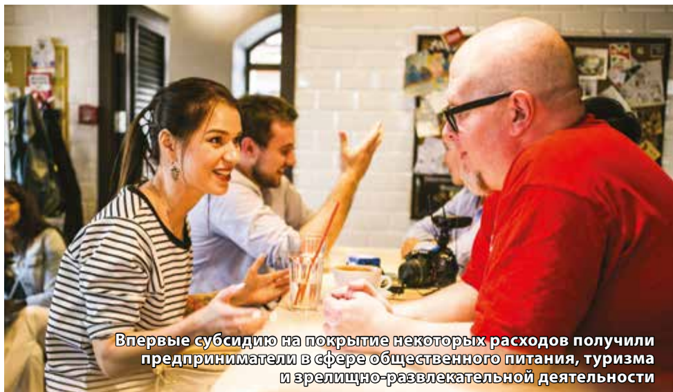
Впервые субсидию на покрытие некоторых расходов получили предприниматели в сфере общественного питания, туризма и зрелищно-развлекательной деятельности