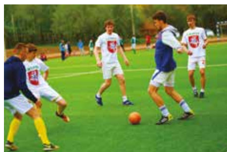
Спорт — неотъемлемая часть иркутской общины литовцев