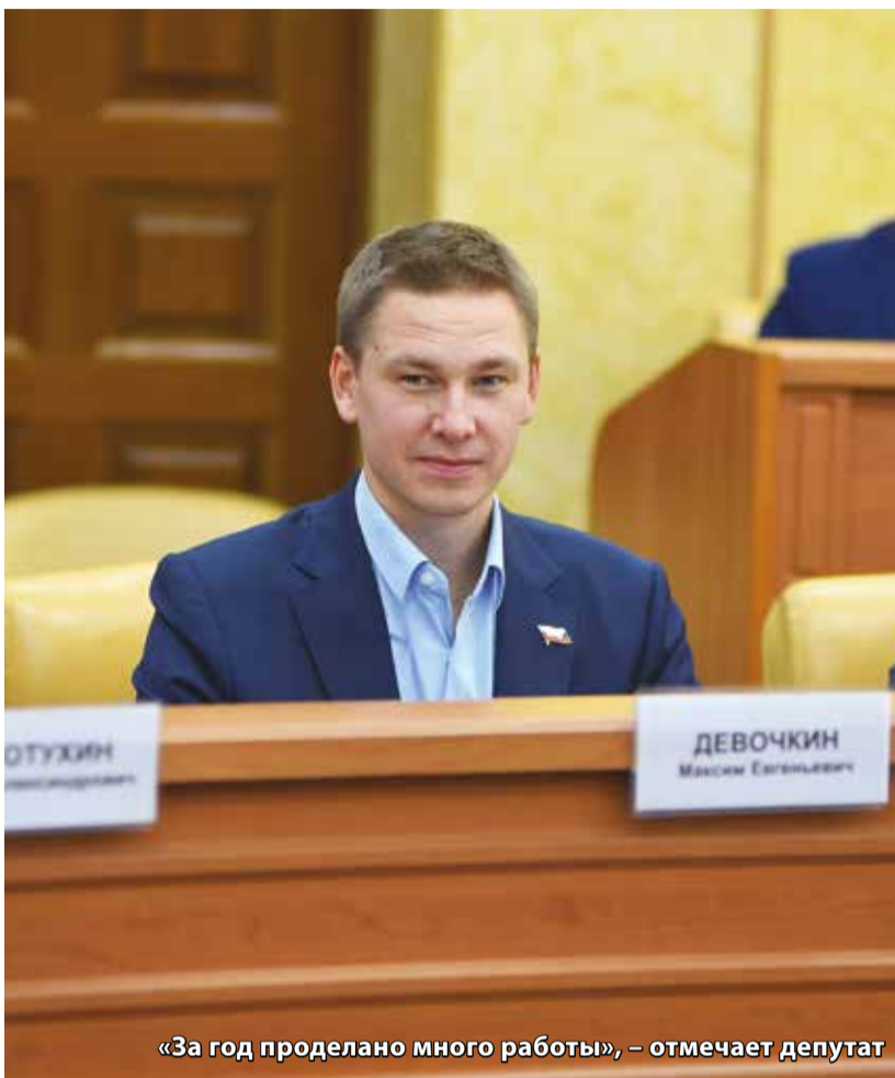
«За год проделано много работы», — отмечает депутат

Таким образом, в основном и дополнительном зданиях смогут учиться 1300 школьников, что позволит разгрузить не только школу № 80 в округе, но и школы № 63 и 19 в Академгородке.