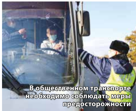
В общественном транспорте необходимо соблюдать меры предосторожности

В Иркутске начались проверки соблюдения мер безопасности в общественном транспорте