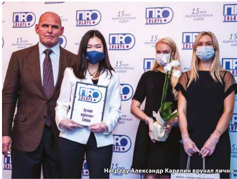
Награду Александр Карелин вручал лично

— Крайне важно, что проект поощряет талантливых сибирских журналистов и вдохновляет их на дальнейшую работу, создает воз-