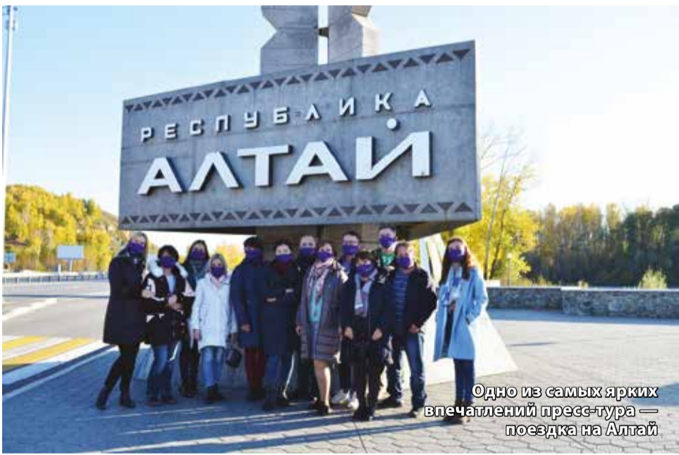
Одно из самых ярких впечатлений пресс-тура — поездка на Алтай