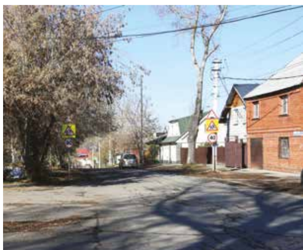
В 2021 году приведут в порядок асфальт на улице Профсоюзной