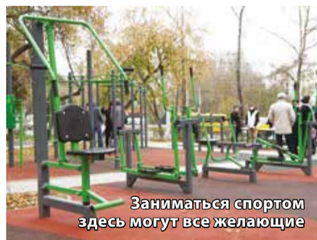
Заниматься спортом здесь могут все желающие

К 45-летию Иркутского государственного университета путей сообщения открыли спортивную площадку и высадили аллею