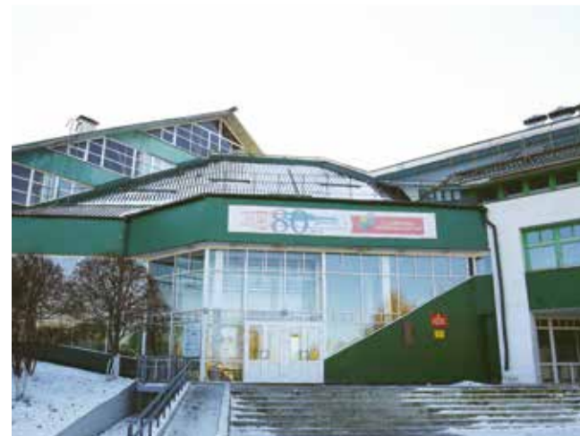
Единственная действующая школа в округе — школа № 80