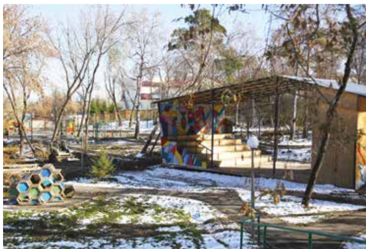
Продолжается благоустройство «Парка инициативной молодежи»