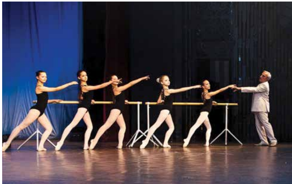
Урок классического балета в ТЮЗе. В новогодние праздники дети просто живут в театре, играют по три-четыре спектакля в день. И это им в радость