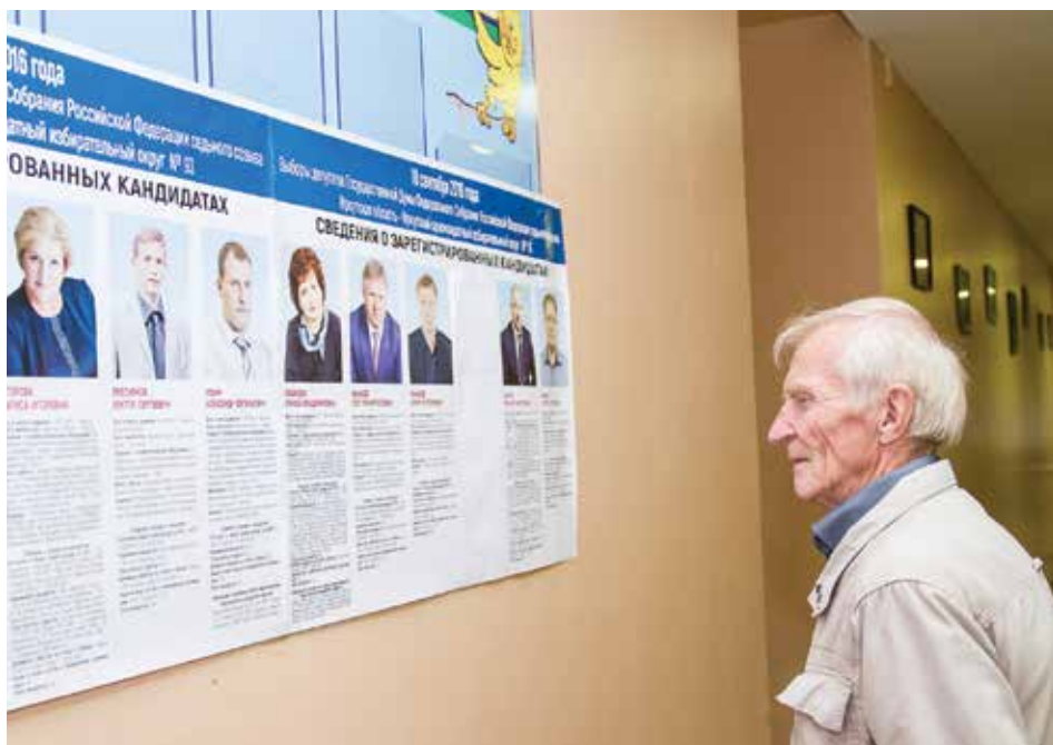
Среди тех, кто пришел на избирательные участки были представители старшего поколения, молодежь, голосовали иркутяне и целыми семьями

Он принял данные от космонавта в специальной комнате, заполнил за него бюллетень и бросил его в переносной ящик для голосования.