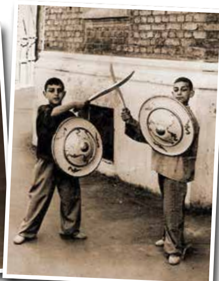
Солнечный Баку, 1953 год. Ребята ставят балет «Красный мак» в хореографическом училище