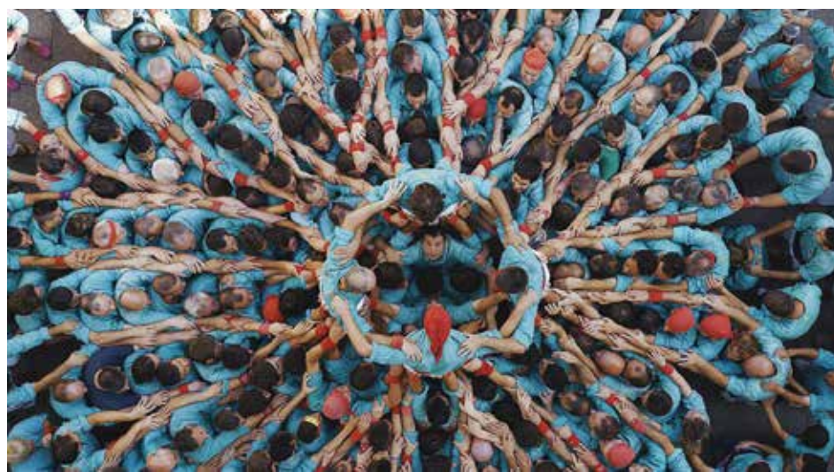
Ян Артюс-Бертран собрал для фильма «Человек» рассказы людей из 60 стран

— Уровень фильмов, присланных на фестиваль в этом году, разительно выше, чем в прошлые годы. Об этом