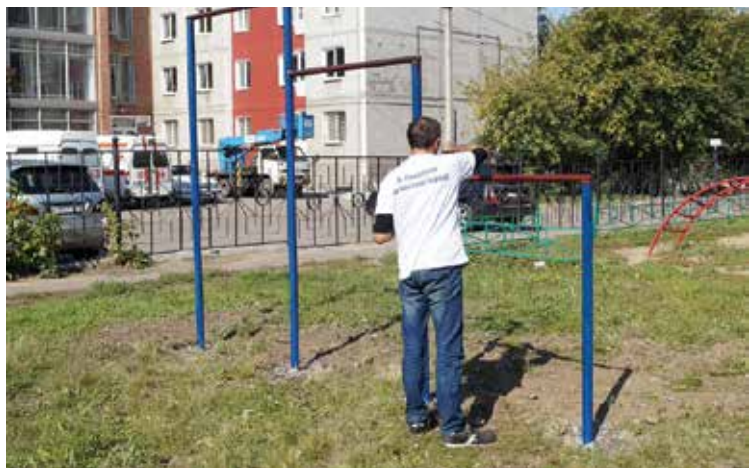
Покрасить турник или починить скамейку — дело быстрое и незатратное, но двор после этого действительно преображается