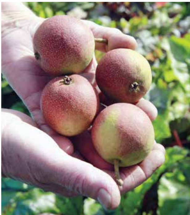
Груши, сорт Малиновка, созревают в начале сентября