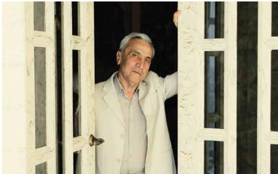
«Балет — это искусство, которое заставляет трудиться до седьмого пота. Надо много работать, чтобы создать запоминающиеся образы», — считает Велиев