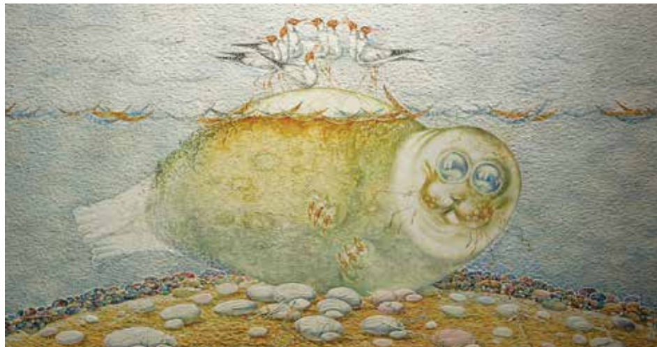
Ольхон, по представлению художника, не что иное, как большая нерпа, спинка которой выглядывает из воды и образует остров