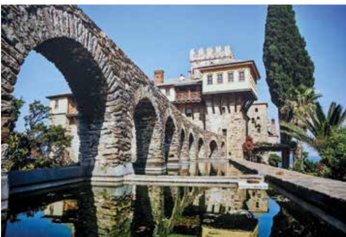
В этом самом маленьком монастыре Афона подвизался святой Паисий Святогорец