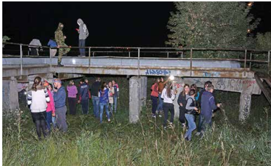
Первая локация игры оказалась на улице. Здесь, несмотря на мрачный антураж, искать коды было не так страшно

«Ну что, нерпенек? На нас вышел агент один восемь восемь, который трижды утверждал, что знает где произойдет следующее преступление маньячки. Нам необходимо встретиться с ним. Он оставил сообщение: «Англичане, приезжая на Байкал, говорят, что это легко». Примечание: Агенту нужно сказать: «Я знаю, кто украл меня на брифинге».