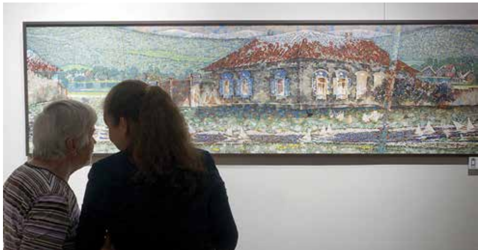
В пейзаже «Иркут» хорошо просматривается излюбленная мозаичная манера автора: картина будто сложена из пазлов