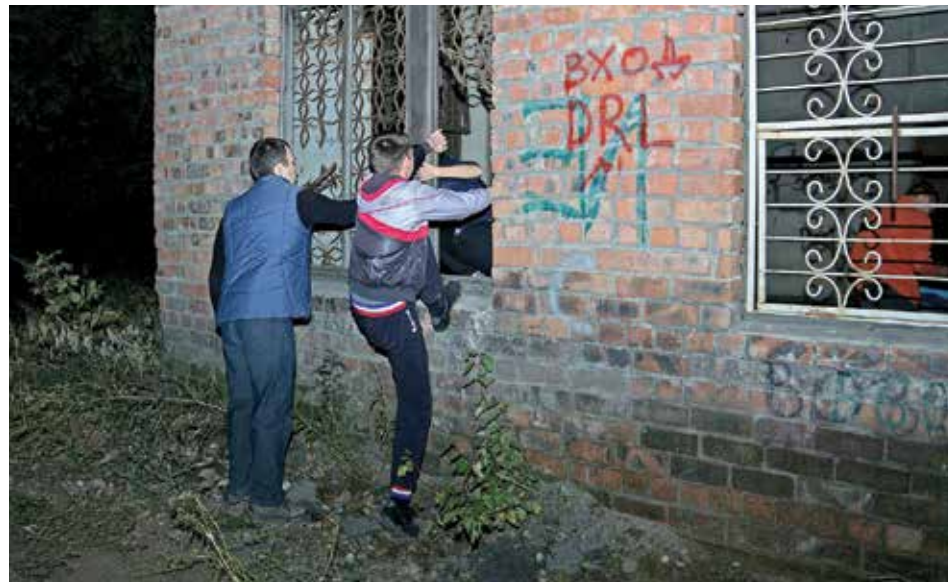
Газета «Иркутск» штурмует очередную локацию. Попасть в это заброшенное здание можно только через окно. Внутри в поисках кода мечутся наши соперники