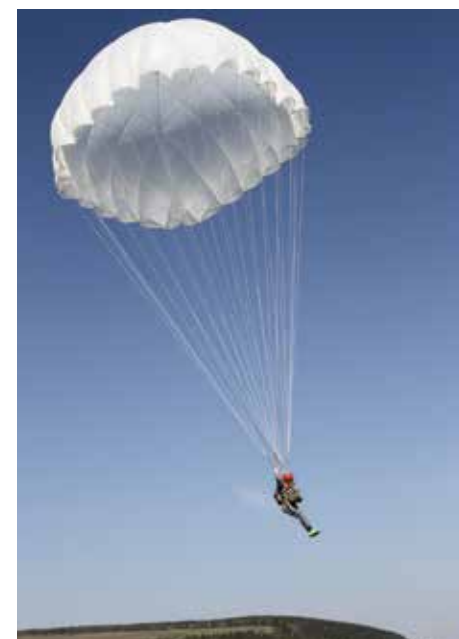
Полет длится всего каких-то три минуты. Но ощущения — незабываемые!