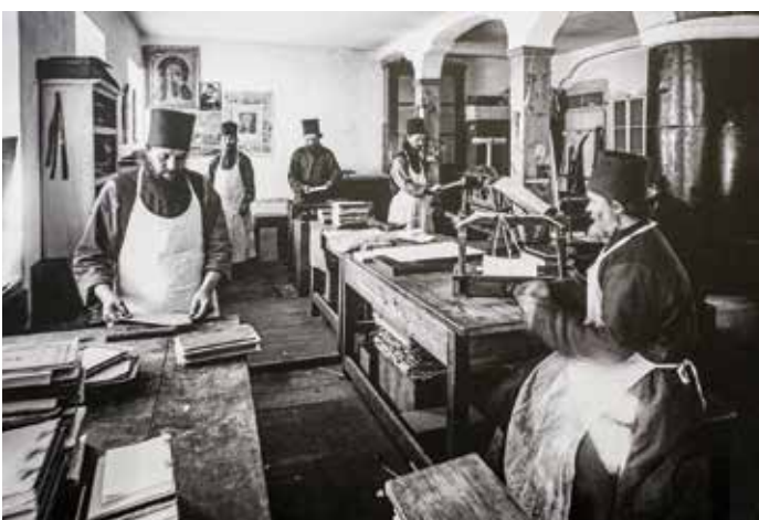
Быт монахов конца XIX века сохранился на старинных дагеротипах, восстановленных Костасом Асимисом