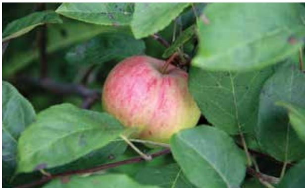
Крупноплодные яблоки в Сибири давно уже не редкость. На фото — сорт Алтайское румяное

Сибири необходимо формировать в стланцевой форме, иначе они погибнут зимой.