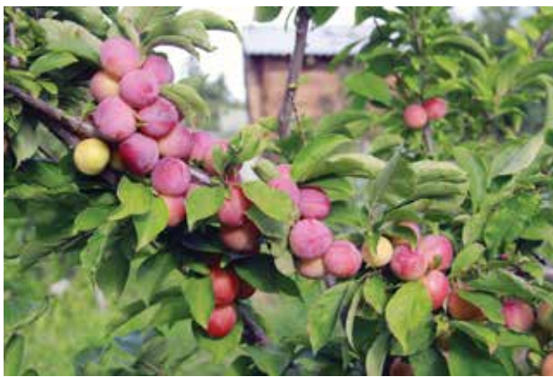
Сливы, сорт Алтайское юбилейное — урожайные, зимостойкие и очень сладкие