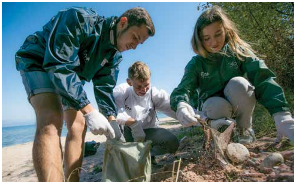
На берегу добровольцы нашли обстановку для небольшой квартиры: чайник, магнитофон, холодильник, кухонную плиту, а также фарфоровые изоляторы для ЛЭП и большое количество металлолома

вопрос — ехать или нет — уже не стоит. Байкал — наш дом, а дом нужно держать в чистоте. Я просто получаю удовлетворение от того, что действительно могу чем-то помочь.