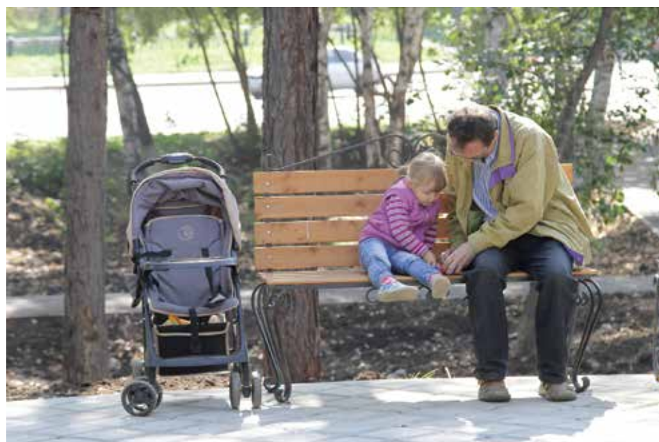
Новый сквер на улице Станиславского уже облюбовали жители Октябрьского округа. Горожане здесь гуляют с детьми, катаются на роликах, отдыхают

Всего осенью будет открыто 20 благоустроенных территорий для горожан. Сквер на улице Станиславского стал десятым. Еще десять, если погода не подведет, появится до конца сентября.