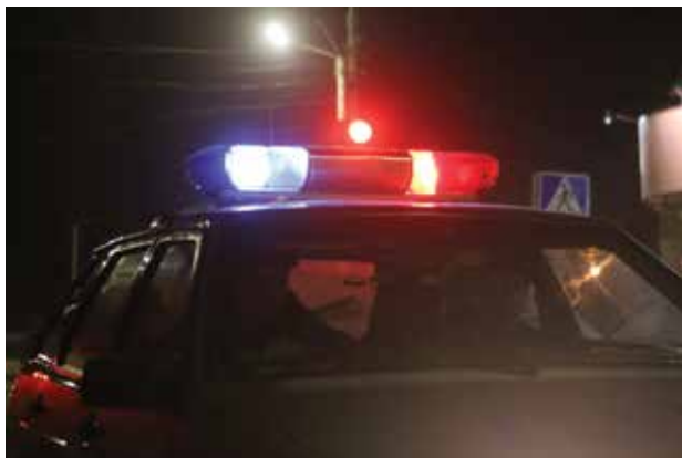
Ни один рейд не обходится без обязательного сопровождения наружных служб полиции. Если подростки ведут себя агрессивно, инспекторам ПДН необходима их помощь