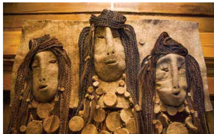
«Три невестки с долины» — олицетворение хозяек местности, покровительниц одного из бурятских родов