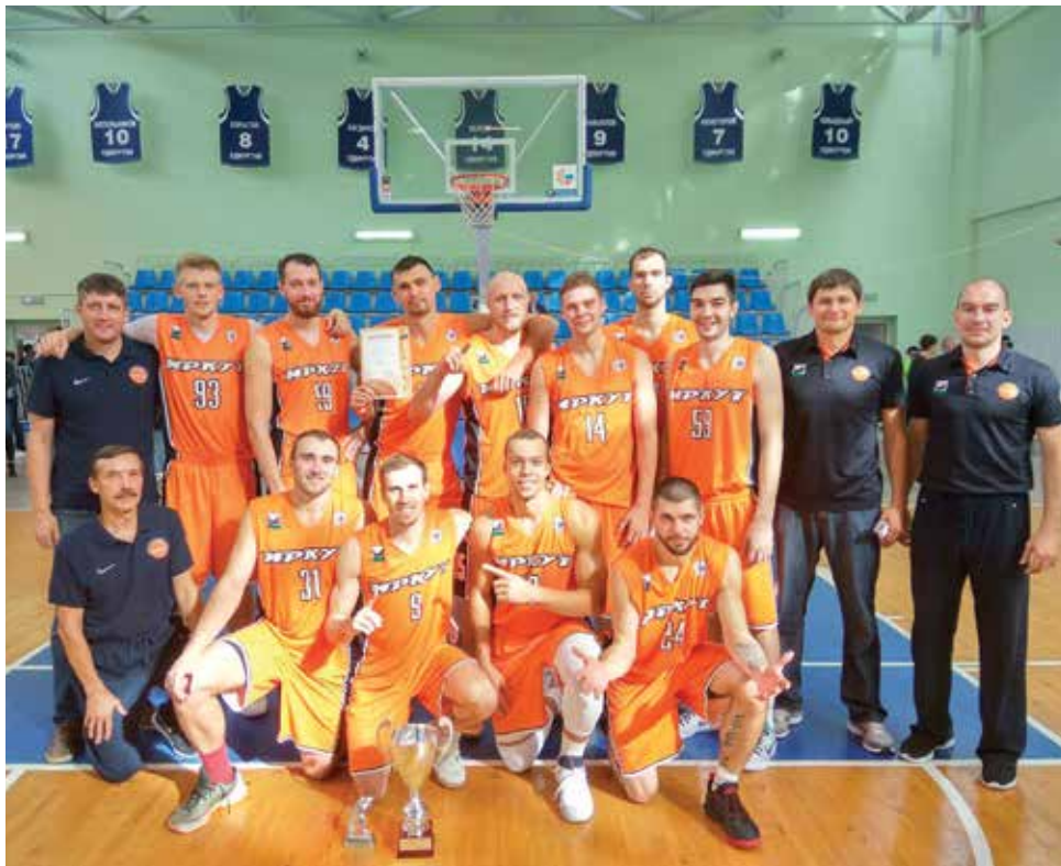
Новые тренеры и новые игроки нашей команды уже выиграли первый за 11 лет трофей для Иркутска. Нас ждет интересный и насыщенный сезон!