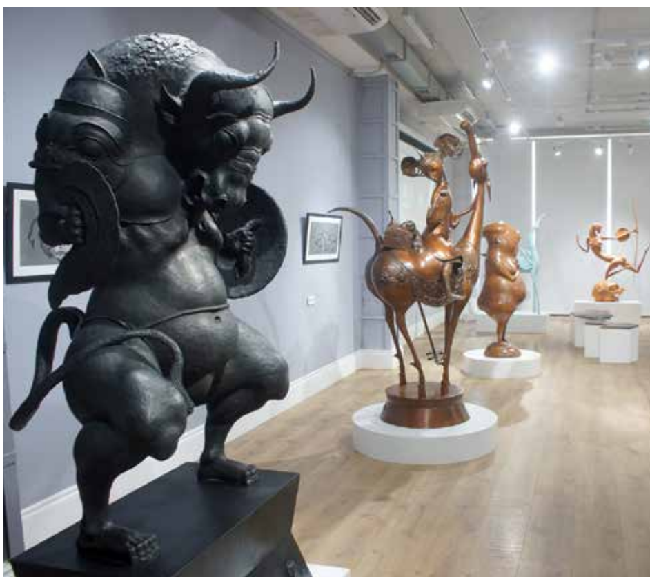
Зал работ Даши Намдакова в Галерее Бронштейна — единственная в мире постоянная экспозиция работ всемирно известного скульптора

«Мистерия» стала шестой монументальной скульптурой в постоянной экспозиции, посвященной творчеству Даши Намдакова и его семьи, в Галерее Бронштейна. Напомним, что здесь можно увидеть четыре бронзовые работы — «Вдохновение», «Цель», «Приданое» и «Виктория», которые были специально отлиты и доставлены в Иркутск из Италии в августе 2015 года. Кроме того, в коллекции находится уникальная скульптура «Птица и тигр», выполненная из лазурита и бронзы в единственном экземпляре, а также авторские куклы, изготовленные семьей Даши Намдакова. Новая скульптура была отлита первой из нескольких существующих копий, что, по словам искусствоведов, увеличивает ее коллекционную ценность.