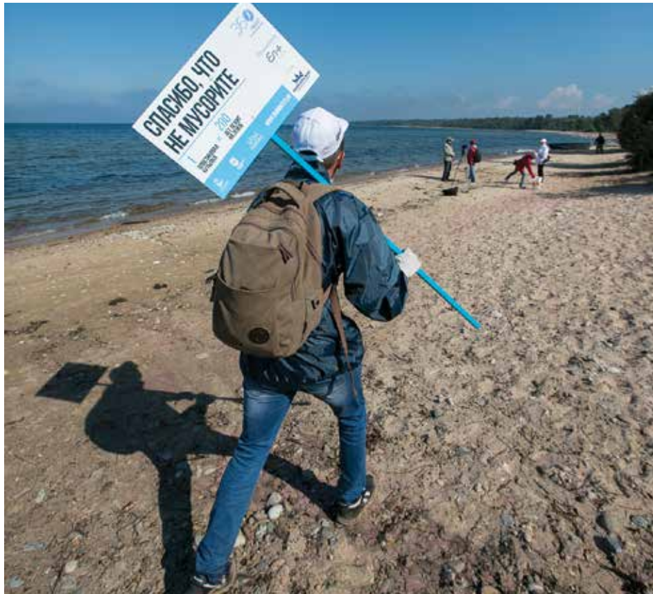
10 сентября волонтеры убрали территорию в 117 точках Байкальского побережья. За время экомарафона собрано и сдано в переработку 30 тысяч мешков мусора

— Когда я впервые приехал на акцию, мне было десять. С тех пор каждый раз убираемся всей семьей, даже