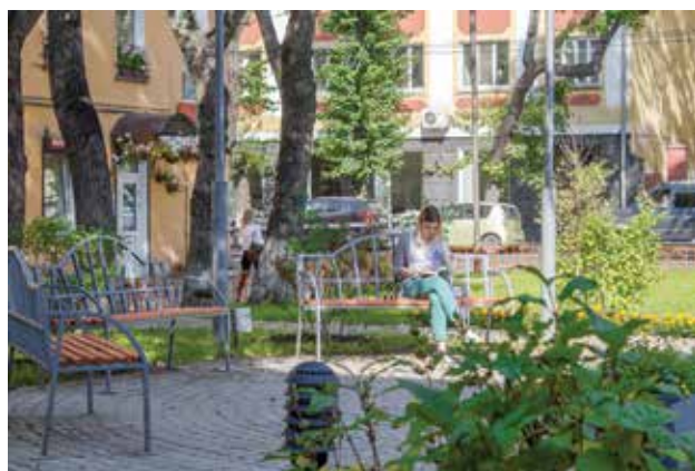
Еще один зеленый островок появился недалеко от набережной Ангары, на улице 5-й Армии, 50