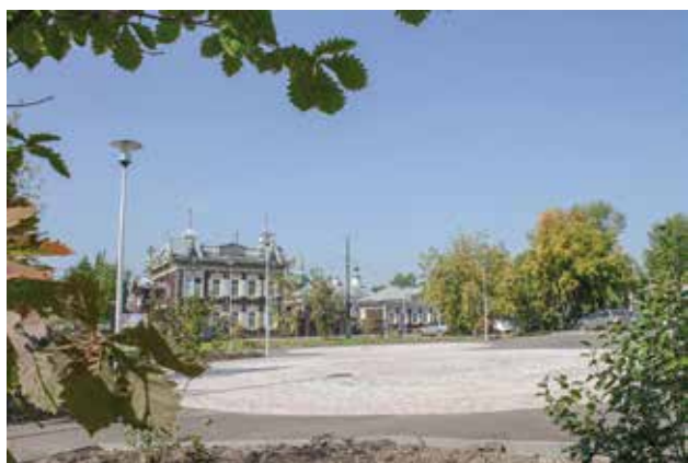
Благоустройство в сквере напротив Дома Европы еще не завершено до конца, но он уже носит гордое название Купеческий и привлекает многих горожан