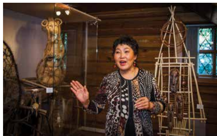
Манжелай — желтый козел, по словам художницы, является символом плодородия, посредником между богами и людьми