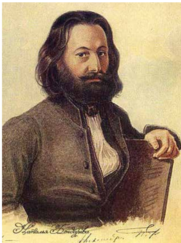
«Длинные черные волосы, падавшие густыми прядями на плечи, красивый лоб, черные выразительные глаза, орлиный нос», — так описывает Николай Белоголовый своего любимого учителя Александра Поджио

После смерти отца молодые Поджио продолжали служить в Петербурге, а мать, к которой они питали самую нежную любовь, жила в киевском имении, управляя хозяйством. Братя скоро завоевали себе видное положение как на службе, так и среди гвардейской молодежи и петербургского общества. Они отличались изяществом и красотой, прекрасным вос-