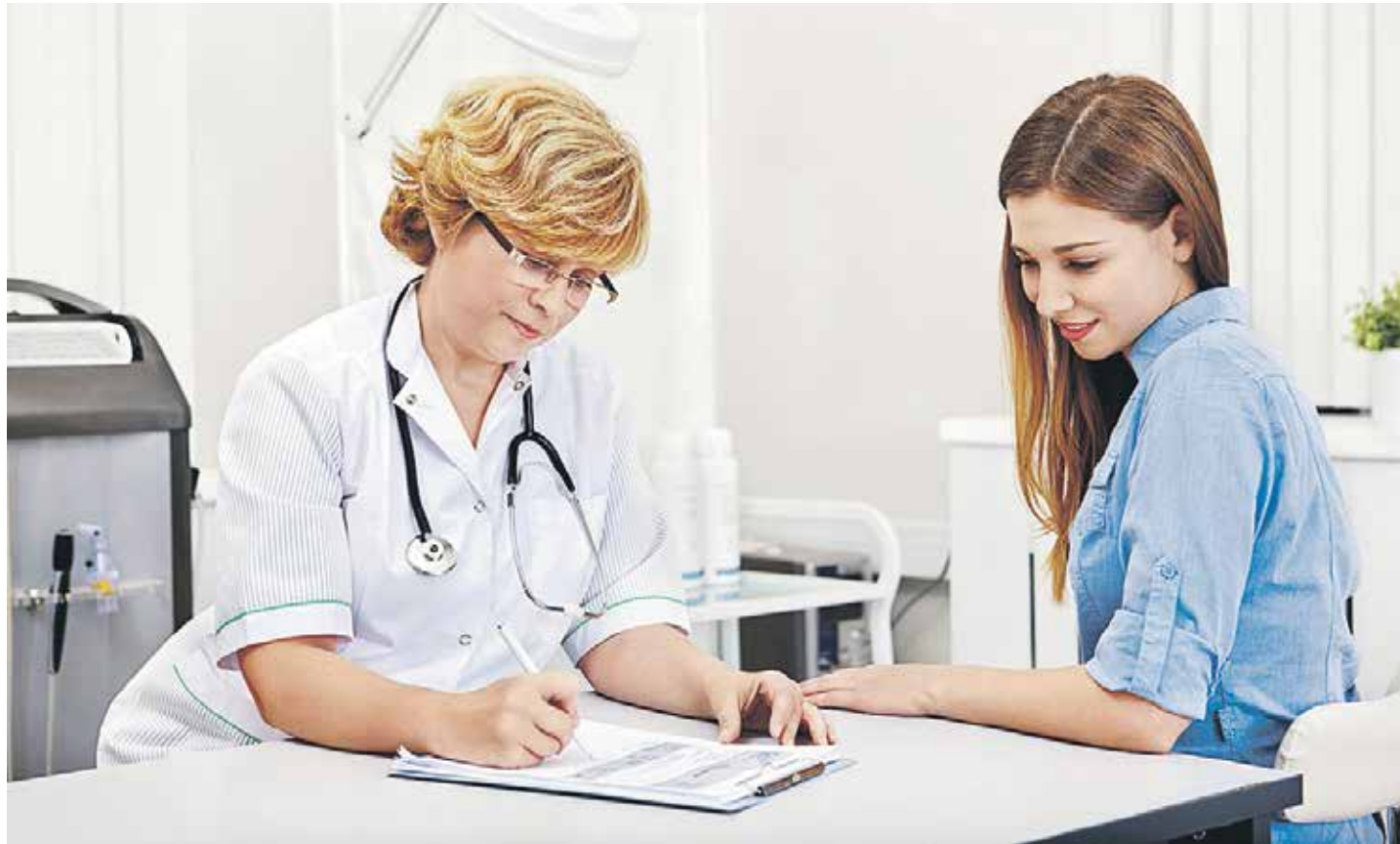
Диспансеризации подлежат все россияне, достигшие 21 года. По рекомендации Минздрава, проходить обследование следует с периодичностью раз в три года

Мысленно перебрав в голове все свои мнимые и реальные болячки, я скромно произнесла вслух: «Ничего». После этого она покорно послушала