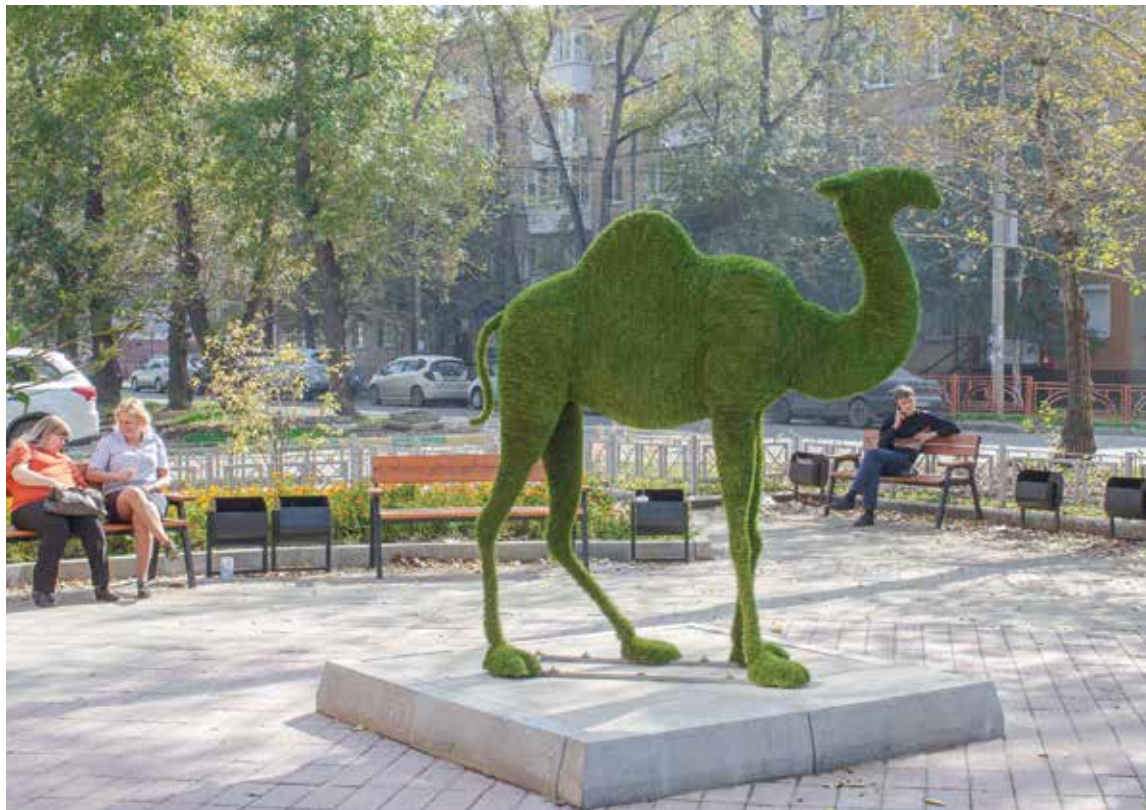
Вот такой зеленый мохнатый верблюжонок поселился во дворе дома №42 по улице Тимирязева. Он символизирует торговый путь, который когда-то проходил через эту территорию