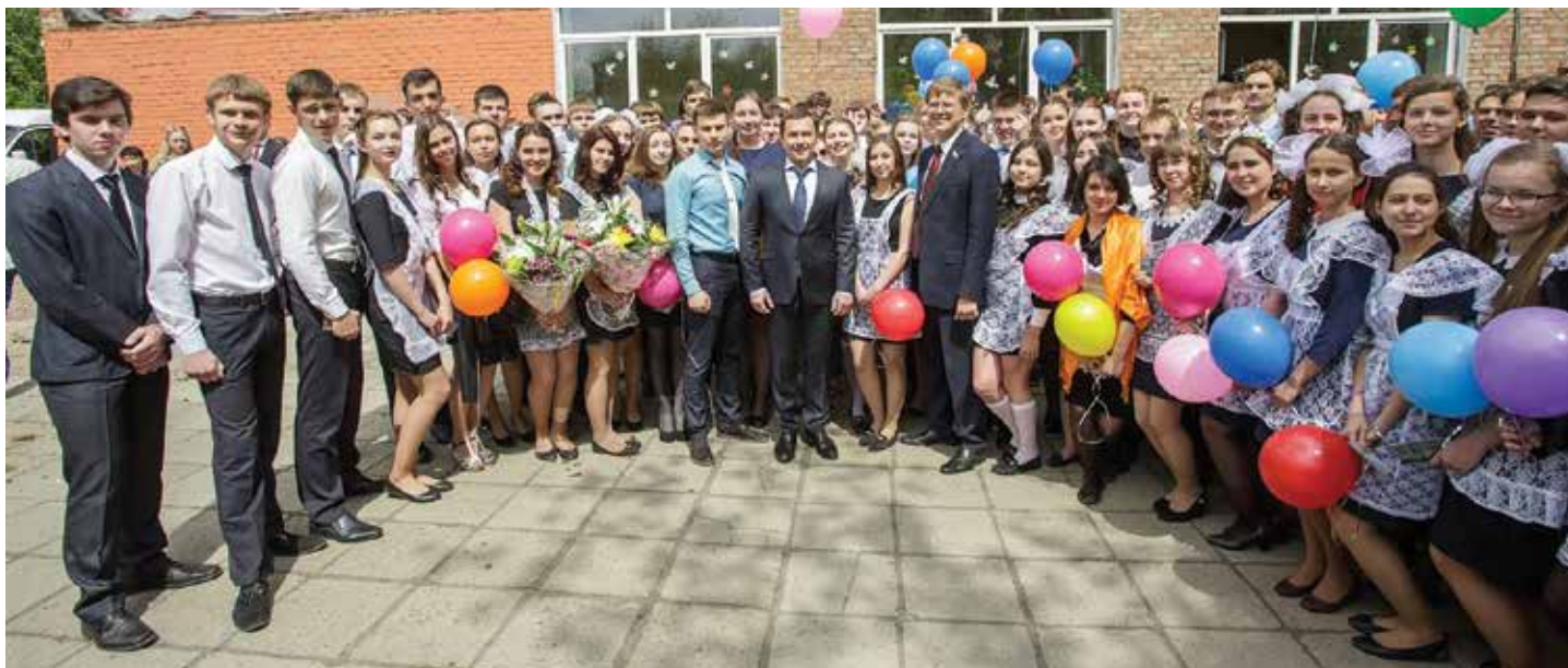
Лицеисты — это будущие инженеры, айтишники, специалисты технических вузов. В гостях у лицея № 1 — мэр города Дмитрий Бердников

А на юбилейном Всероссийском форуме научной молодежи «Шаг в будущее»