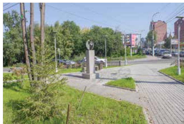
Изюминкой нового сквера на углу улиц Советской и Красноярской стал арт-объект «Земной шар»