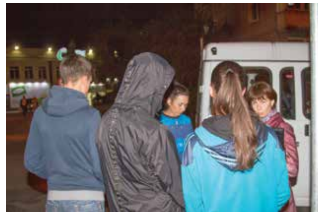
Для этой троицы поход в магазин после 23:00 стал неудачным. Ребята восприняли это как приключение, однако обещали больше не нарушать комендантский час