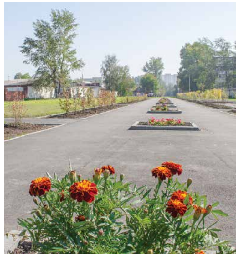
Вдоль улицы Трилиссера разбили несколько пышных цветочных клумб — теперь возвращаться домой будет намного приятнее!