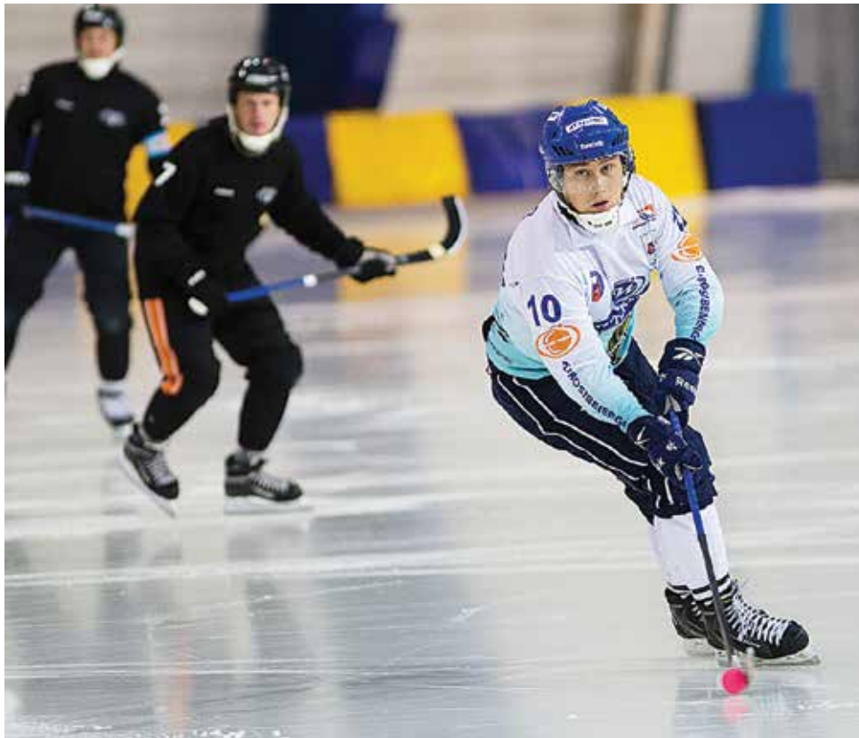
«Байкал-Энергия» в прошлом году готовилась к сезону на льду хабаровской арены «Ерофей». Нынче тренировочный сбор и товарищеские игры иркутяне провели в Кемерове

Изменения в команде уже дали первые положительные результаты, что подтвердили первые предсезонные соревнования. С 8 по 10 сентября наши спортсмены приняли участие во всероссийском турнире на призы АО «Ижевский электромеханический завод «Купол». Выиграв по очереди у «Урала» (Екатеринбург), «Динамо» (Магнитогорск) и местного клуба «Ку-