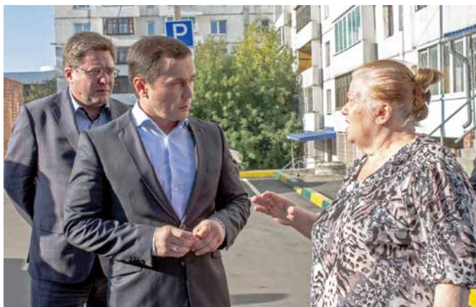
Жители дома № 49 на улице Трилиссера довольны: в их дворе отремонтировали проезжую часть и тротуары, установили новые лавочки и урны, обустроили 20 парковочных мест