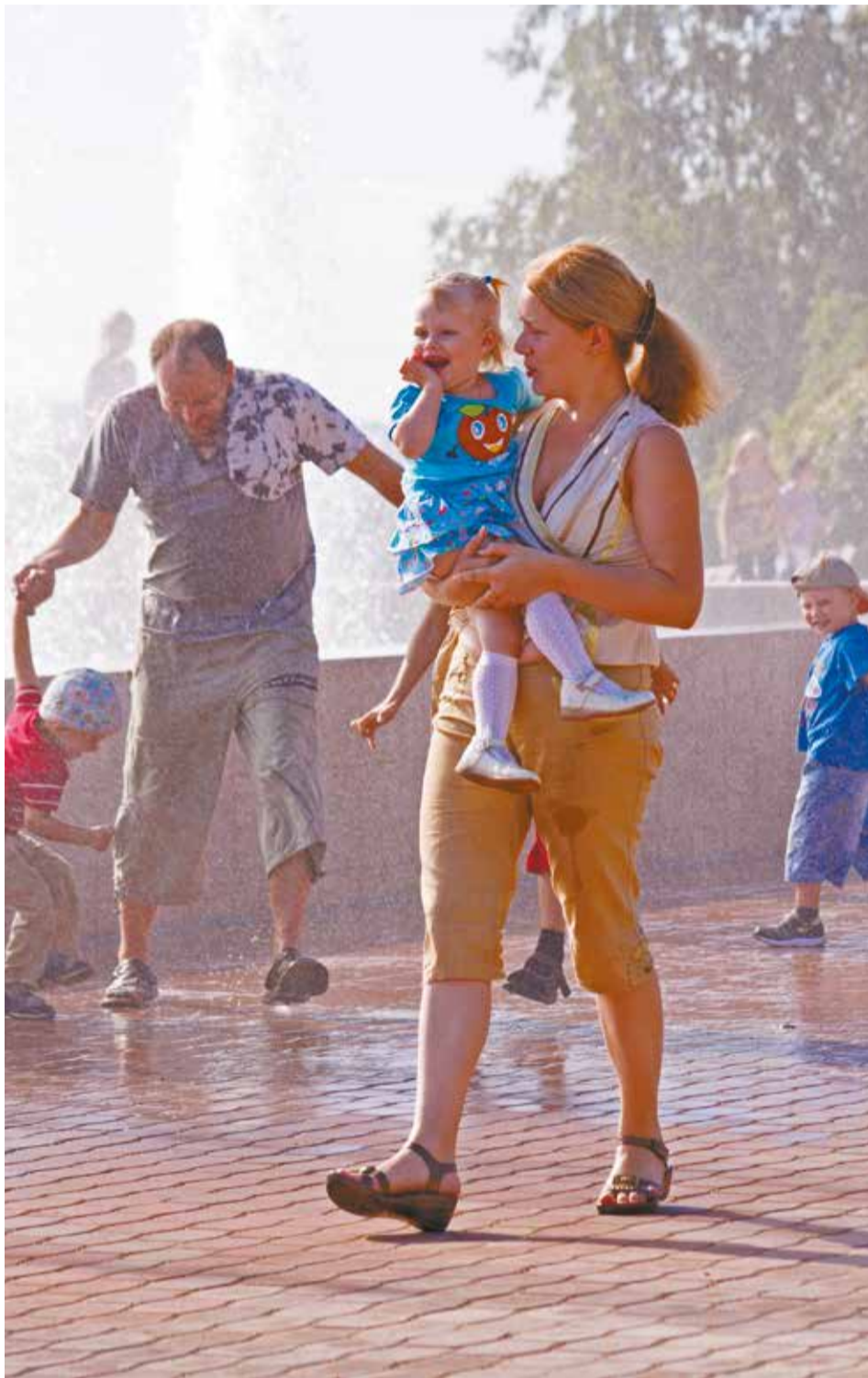
Многие люди, напротив, даже в пекло чувствуют себя очень даже комфортно

— Как можно реже находиться на солнце, ограничить физические нагрузки. С наступлением лета необходимо сходить на консультацию к своему лечащему врачу, днем и вече-