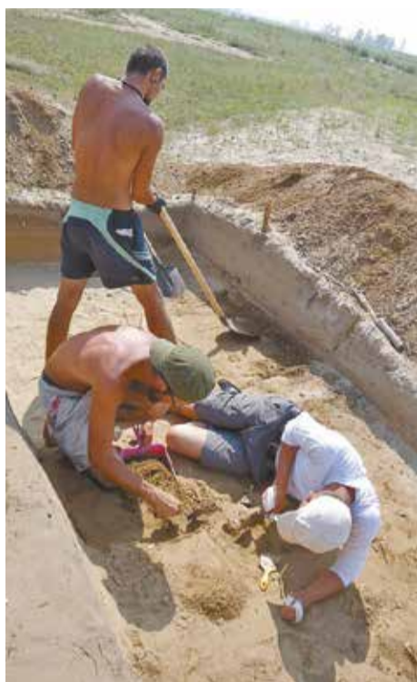
Орудовать лопатой в жару не каждому под силу — только самым выносливым

— Наша помощь действительно нужна при подготовке к строительным работам. Например, строят турбазу на