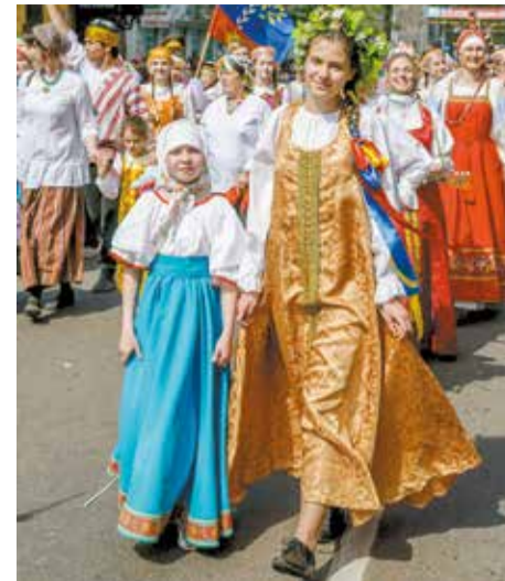
На Дне города колонна Центра русской культуры была украшением праздничного шествия