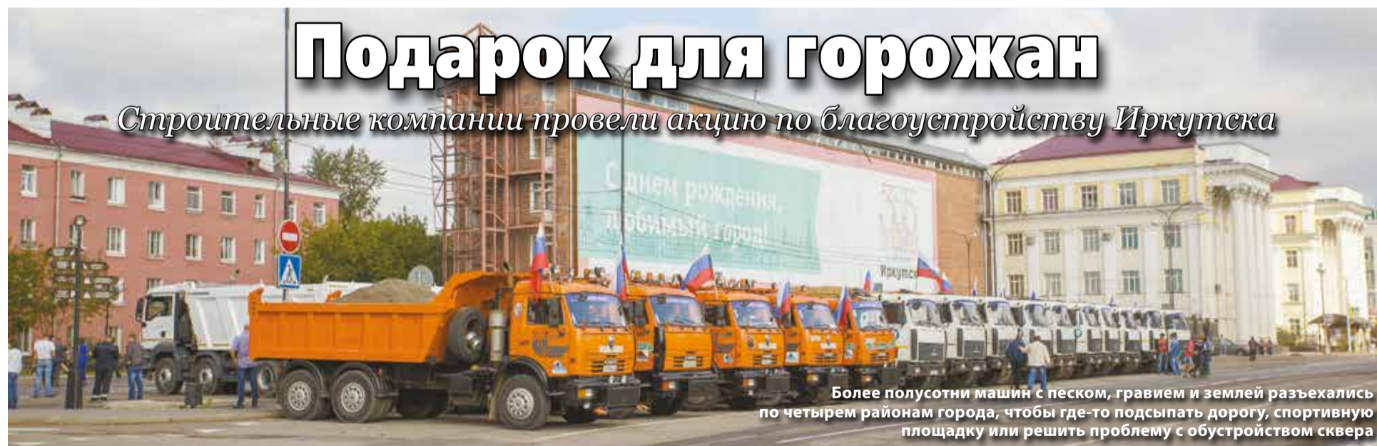
Более полусотни машин с песком, гравием и землей разъехались по четырем районам города, чтобы где-то подсыпать дорогу, спортивную площадку или решить проблему с обустройством сквера

Строительные компании провели акцию по благоустройству Иркутска