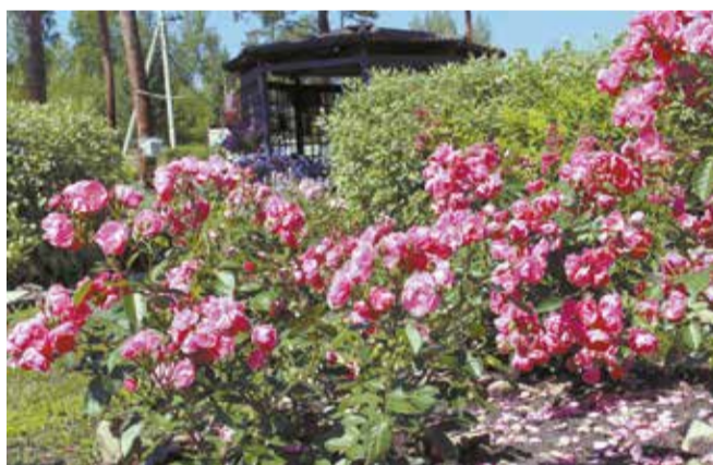
Два-три растения одного сорта, посаженные рядом, создают большой объем, который выглядит очень красиво