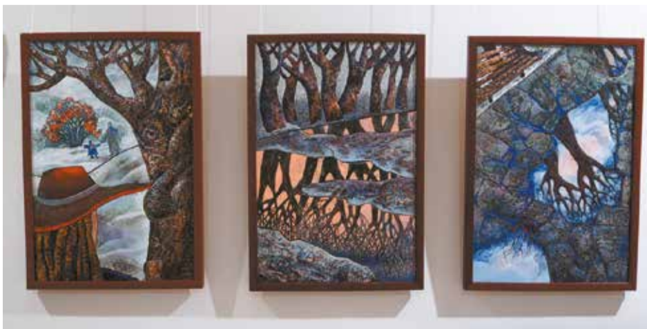
Триптих московского эмальера Ларисы Новиковой «Дорога»

В Музейной студии можно увидеть 100 работ ведущих эмальеров России: народных художников России Алексея Талащука и Николая Вдовкина, произведения Каталин Холлоси (Венгрия) и Анастасии Вдовкиной (Россия—Румыния).