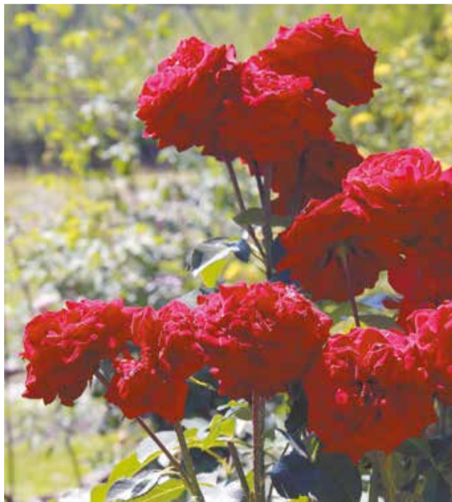
Розы — капризные создания, не любят пересадку. Поэтому лучше всего их не трогать, оставляя зимовать в открытом грунте