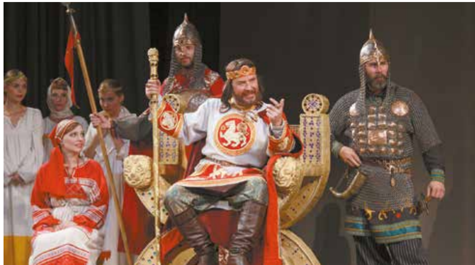
Сцена из спектакля Театра народной драмы о святом князе Владимире — крестителе Руси