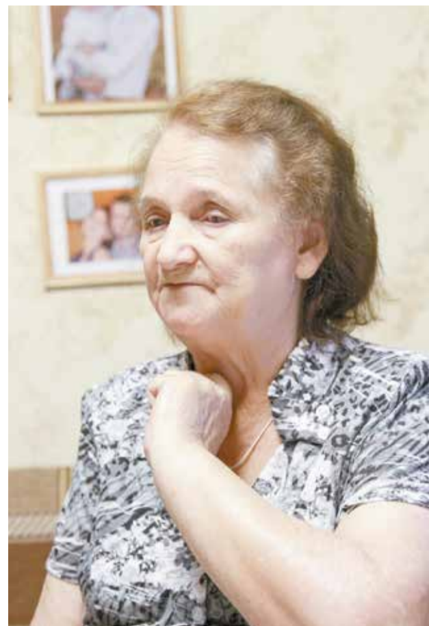
От воспоминаний о погибшем на войне отце и рано ушедшей из жизни маме на глаза у нее до сих пор наворачиваются слезы