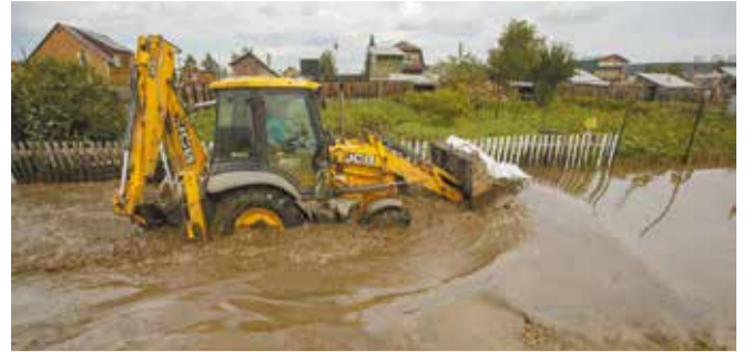
Вода в садоводствах по Плишкинскому тракту прибывала с каждым часом. По словам старожилы СНТ «Солнышко-1», последний раз подобное наводнение было в 1993 году