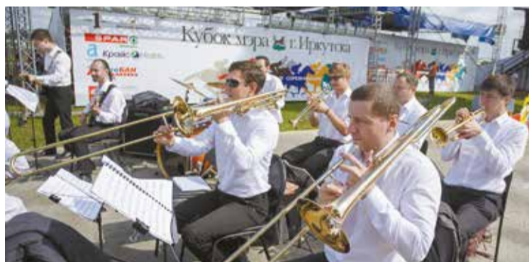
Гостей мероприятия встречала красивая музыка в исполнении городского оркестра