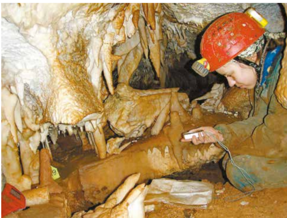
Пещера Ботовская представляет большой интерес для ученых и спелеологов. Это самая длинная пещера в России — 70 километров. И это не предел, каждый год экспедиции наносят на карту Ботовской новые фрагменты

По мнению исследователей, на сегодняшний день пещеры — это одно из малоизученных мест на земле. Для ученых здесь открывается целый мир, где нет места для сложившихся научных стереотипов.