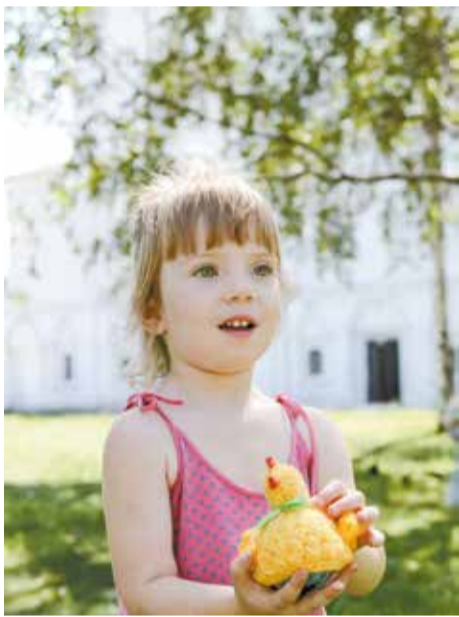
Ребятам понравились куклы с секретом: курочка (а в ней яичко) и Мастеровые (у них есть и пила, и замочек, и ключики)