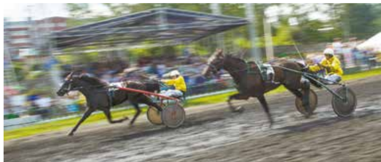
В соревнованиях приняли участие жеребцы рысистых и верховых пород, рожденные в Иркутской области и других регионах России

Мероприятие прошло при поддержке ГК «КрайНефть», сети супермаркетов SPAR, BAIKALSEA Company, торгового дома «Анавидин», ООО «АвтоБАН», детского развлекательного центра «Пика-БуМ», радио tsm, FM 102.1, Иркутской заводской конюшни с ипподромом, Центрального рынка Иркутска, МУП «Иркутскавтодор».