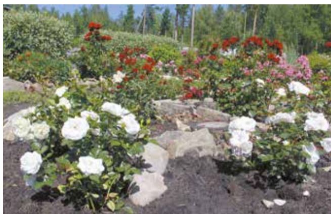
При хорошем уходе один розовый куст может расти около 15 лет