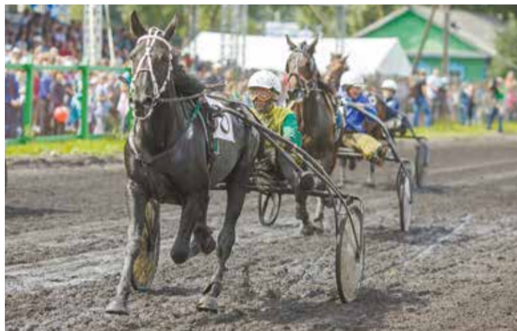
Городские власти намерены возродить славу иркутского ипподрома и вернуть интерес горожан к одному из самых зрелищных видов спорта