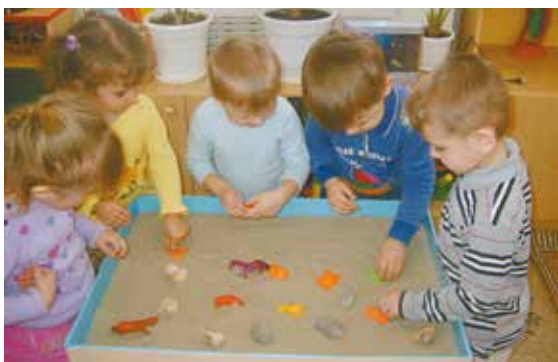
Основная задача лекотеки — вовлечение ребенка в игровую активность