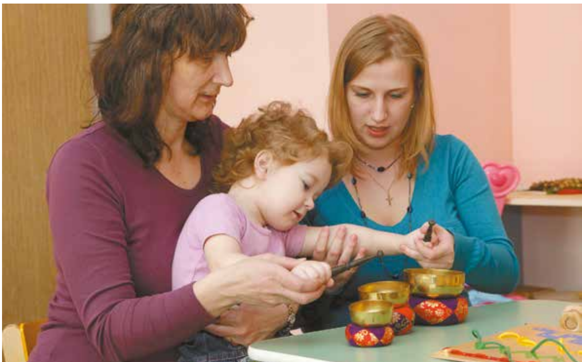
Педагоги центра покажут родителям, как правильно обучать малыша с особенностями развития