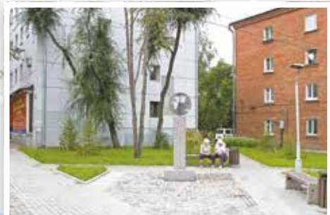
Сквер на пересечении улиц Советская и Красноярская