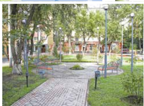
Сквер на улице 5-й Армии, 50