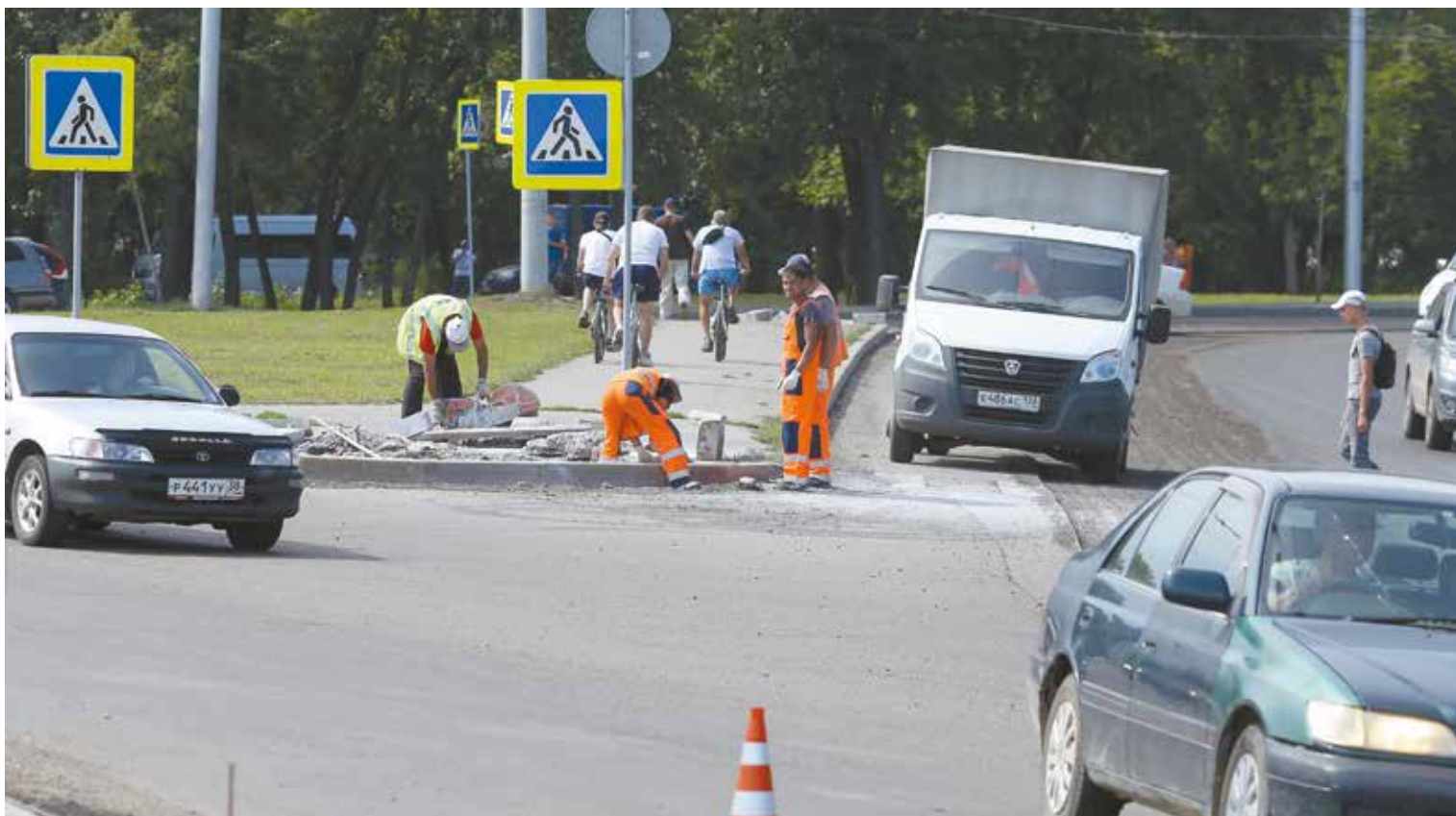
Байкальская развязка будет полностью готова к 15 августа. Дорожники меняют бордюрный камень и укладывают новый асфальт