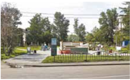
Сквер Космонавтов на Цесовской Набережной