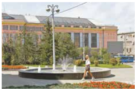
Сквер перед зданием компании «Востсибуголь»