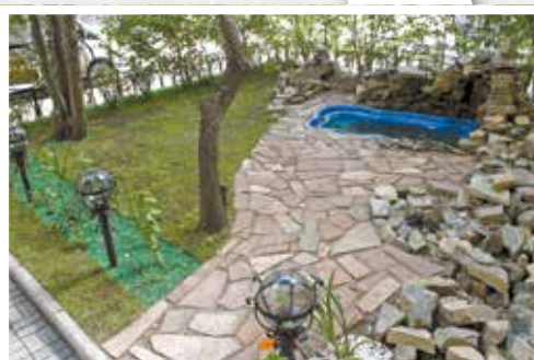
Сквер на улице Декабрьских Событий, 84