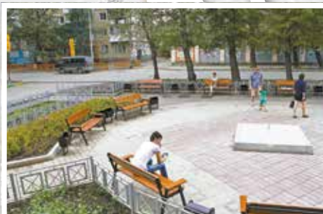
Сквер на пересечении улиц Тимирязева и Карла Либкнехта