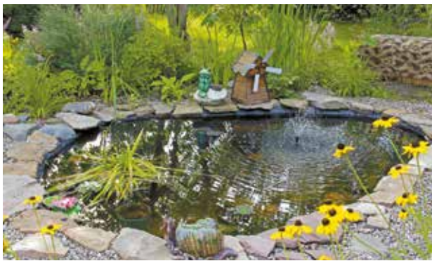
Сделать такой красивый пруд на своей даче — по силам каждому