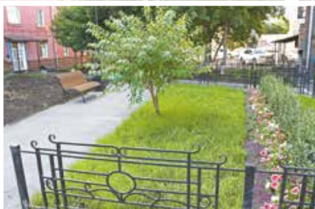
Сквер на улице Ленина, 14б