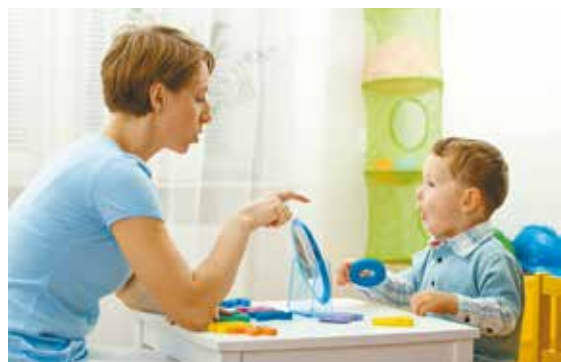
Занятия с детьми будут проводить высококвалифицированные специалисты