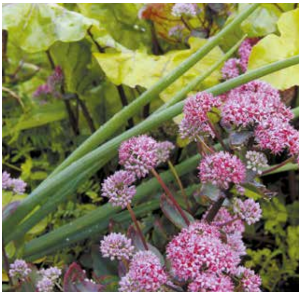
Одну из зон на своем участке наша героиня назвала декоративным огородом. Овощи и цветы здесь живут вместе

лая группа каменных сов — новое увлечение Анны Огородниковой. Она разрисовывает камни, которые становятся дополнительными декоративными элементами в саду.