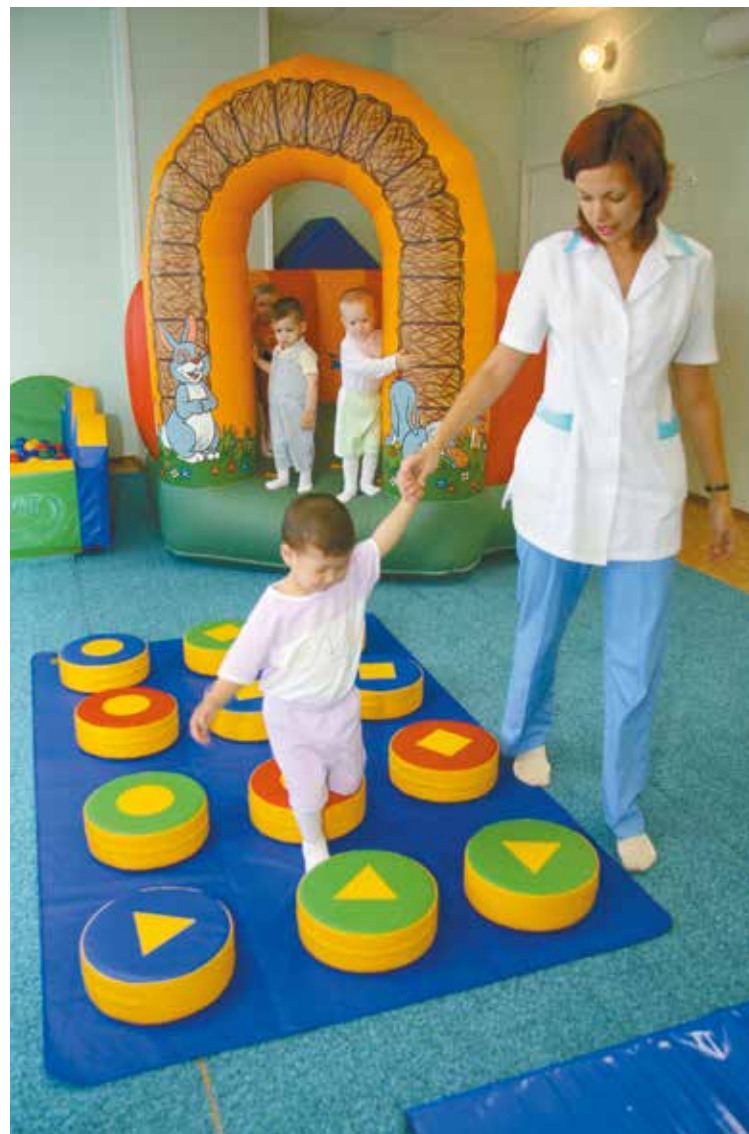
Центр оснастят современными игровыми комплексами для развития двигательной активности ребятшек