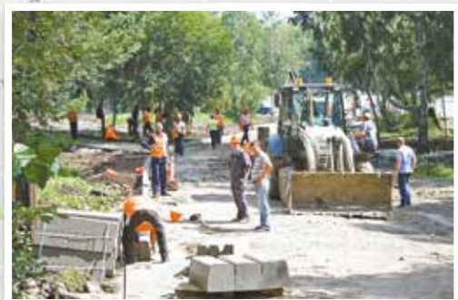
Сквер на пересечении улиц Байкальская и Станиславского