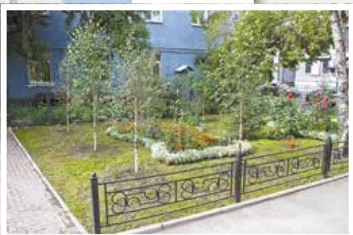
Сквер на улице Ленина, 28