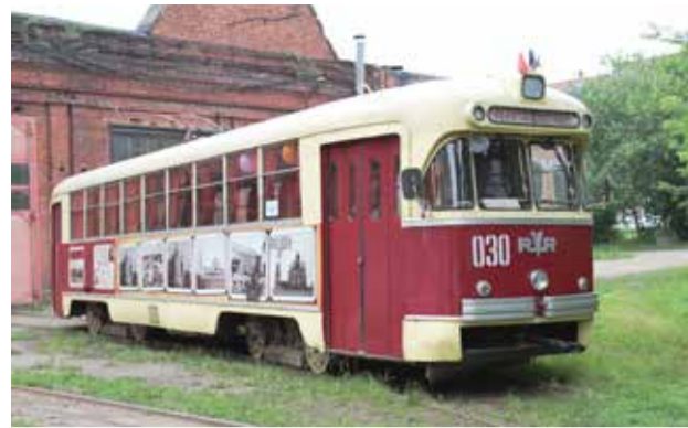
Такие трамваи выпускали в 60-е годы. Под старинным корпусом скрывается новая начинка: в 2011 году его обновили и пустили по экскурсионному маршруту