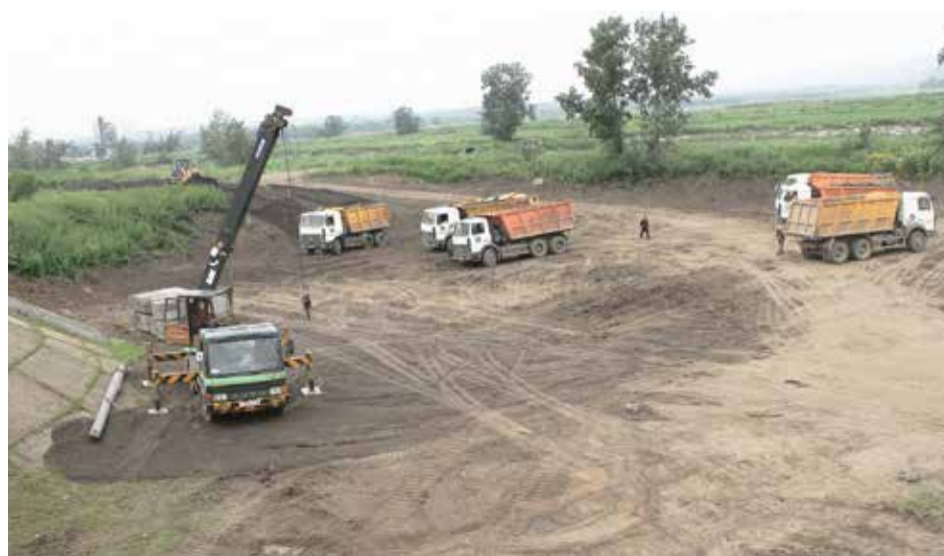
Сейчас осуществляется предварительный этап: вынос коммуникаций, подготовка земельного полотна, создание новых съездов и заездов

В настоящее время идет вынос коммуникаций, подготовка земельного полотна, создание новых съездов и заездов. После этого дорожники приступят к наращиванию ширины путепровода до норм магистральной улицы общегород-