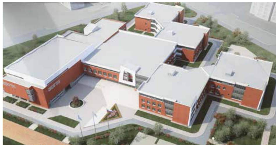
Новая школа будет включать в себя восемь блоков разной этажности (от одного до трех)