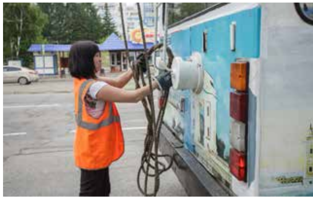
Иркутский горэлектротранс первым в России самостоятельно модернизировал троллейбус для автономного хода