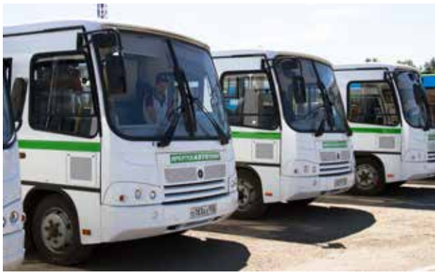
Новые пазики — мера временная. Им на смену придут автобусы средней и большой вместимости