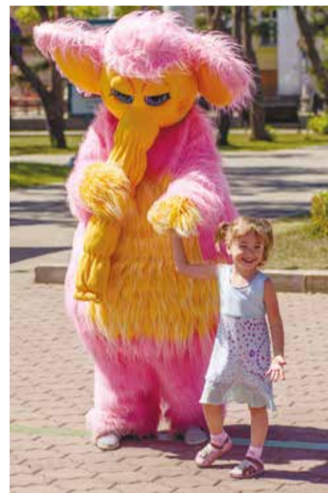
Веселый клоун и Розовый Слон веселили детвору на «Стихии игры»