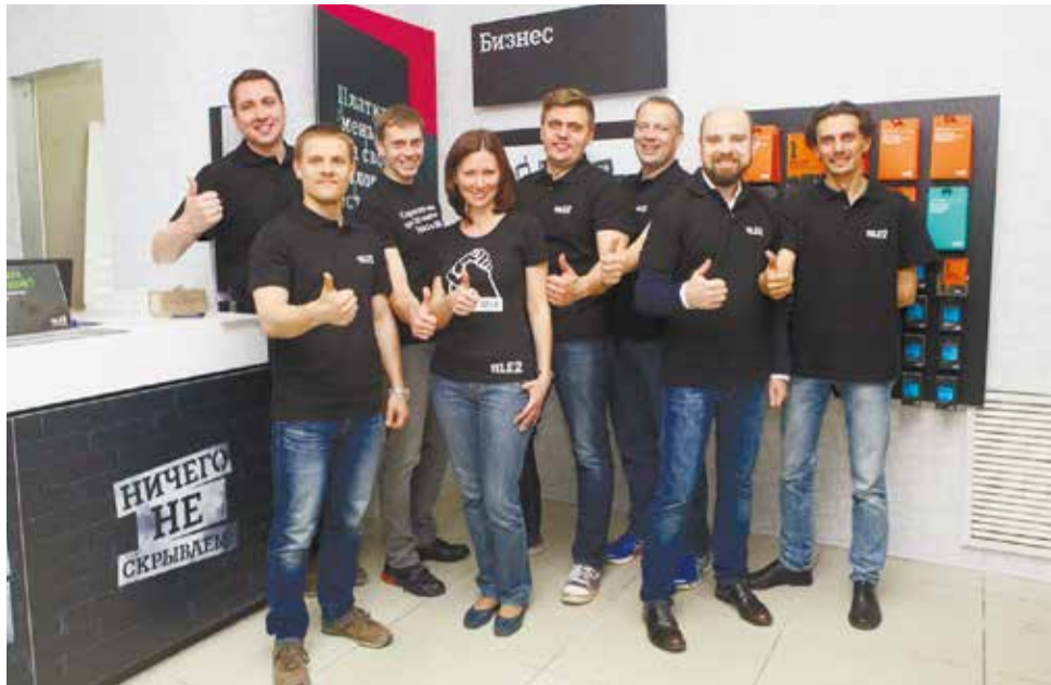
Главная миссия сотрудников Tele2 — делать абонентов счастливыми