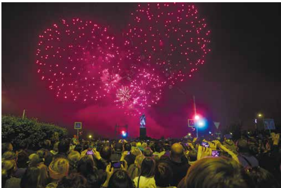
В День города даже темное ночное небо призналось Иркутску в любви