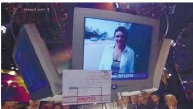
Вопрос из Иркутска выпал в конце игры. И девятый раунд стал решающим в интеллектуальном противостоянии знатоков и телезрителей