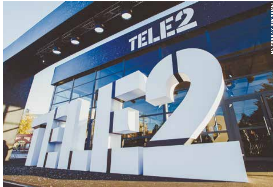
Компания инвестирует беспрецедентно крупные средства в развитие телекоммуникационной инфраструктуры Иркутска и области в период кризиса