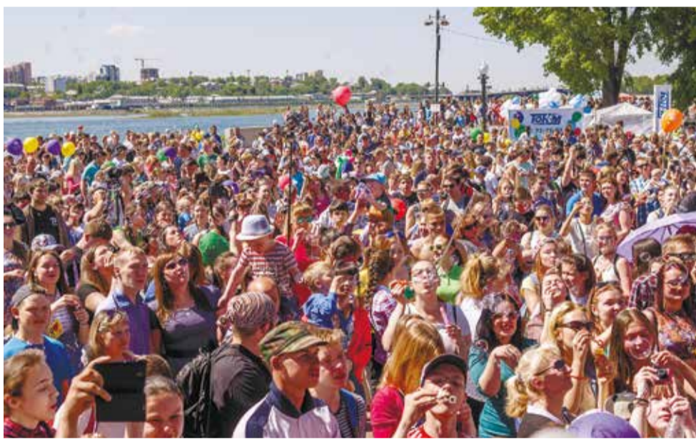
Пауза в рок-концерте: публика запускает в небо радужные мыльные пузыри!