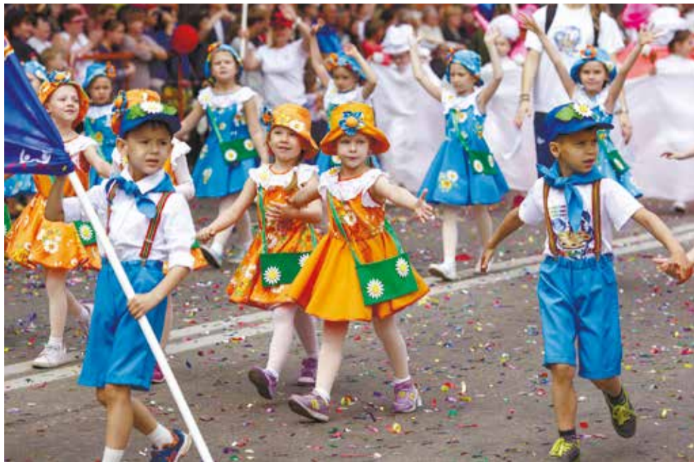
В праздновании юбилея приняло участие около 100 тысяч горожан, взрослых и детей