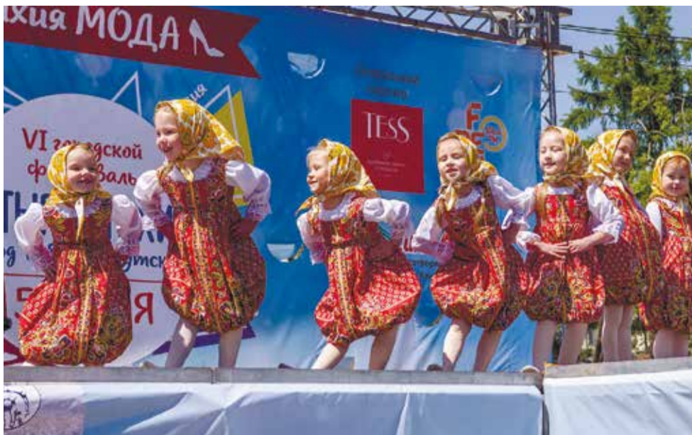
Крошки-матрешки из ансамбля «Фиеста плюс» оказались самыми юными и трогательными артистками

Ана Шутова, Оксана Гордеева