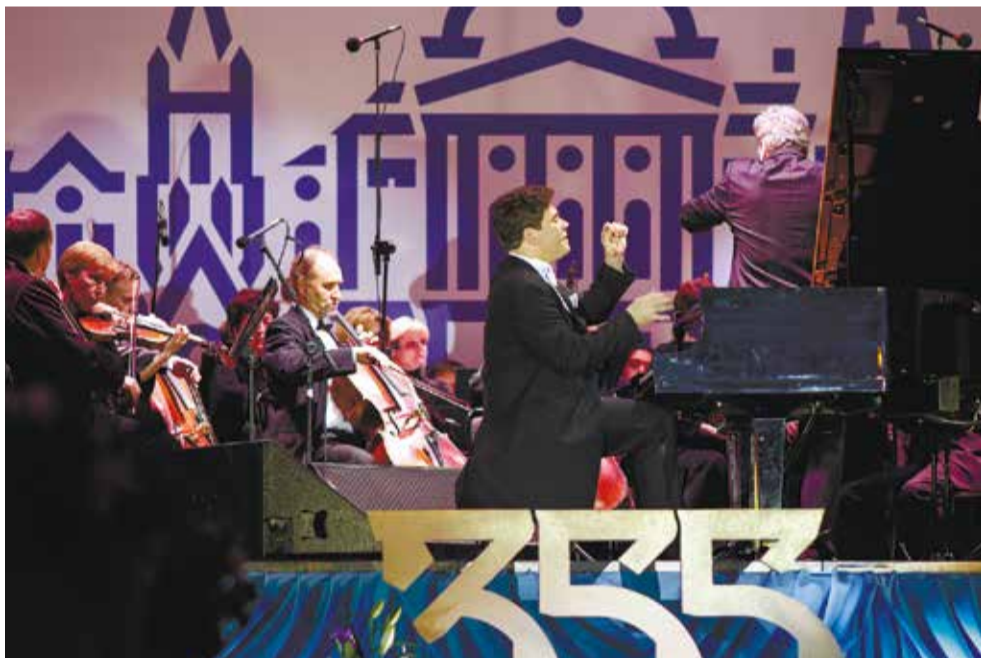
Денис Мацуев исполнил на главной площади города Первый концерт Чайковского