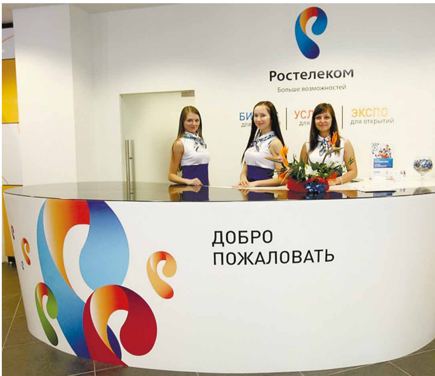
Качество работы с клиентами в «Ростелекоме», культура обслуживания является приоритетным направлением. В последнее время в компании появилось много новшеств, которые призваны поднять качество сервиса

Если про оптоволокно люди в большинстве своем слышали, то «Интерактивное ТВ 2.0» — вещь абсолютно новая. И в настоящее время ее может предложить лишь «Ростелеком». Это решение, с помощью которого телевидение «Ростелекома» становится до-