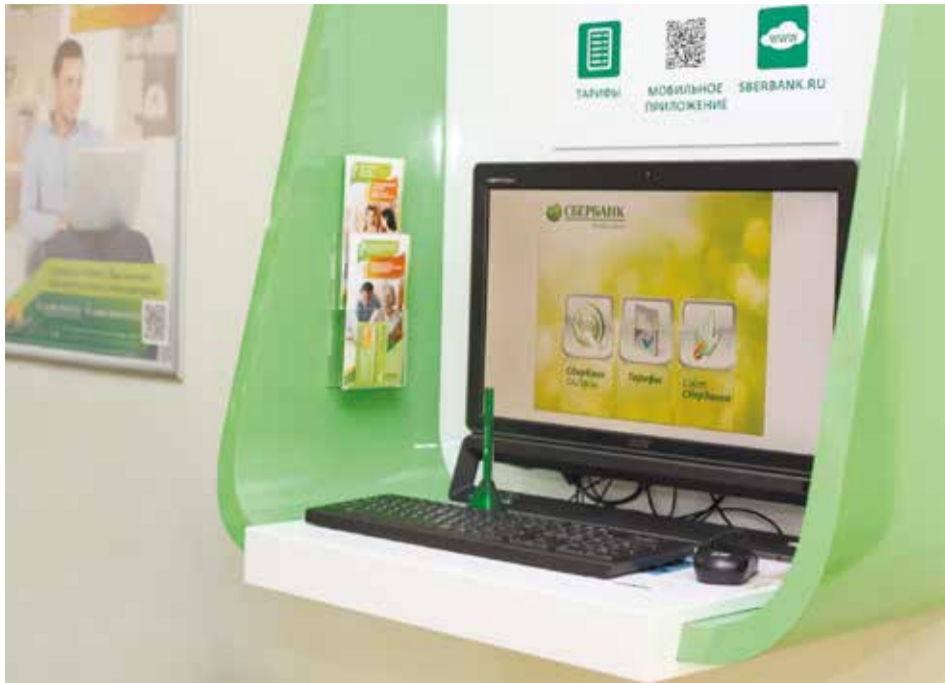
Владельцы зарплатной карты Сбербанка могут основные операции проводить онлайн через интернет-банкинг