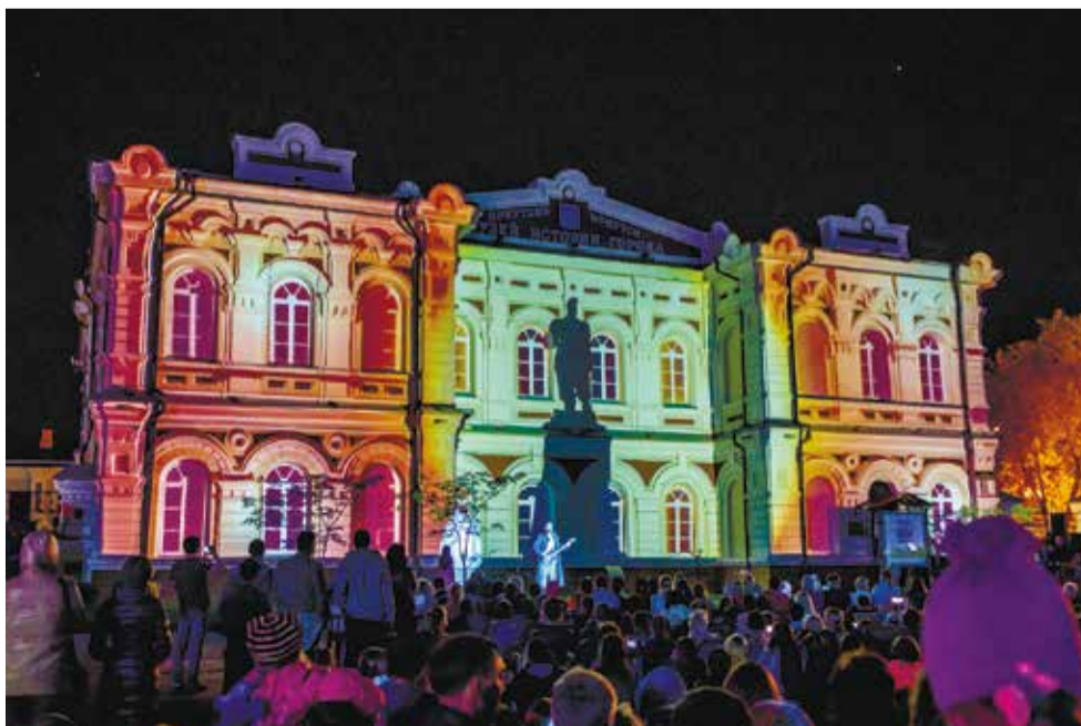
На фасаде Музея истории города Иркутска силуэт Александра III — царя, проложившего железную дорогу в наши края