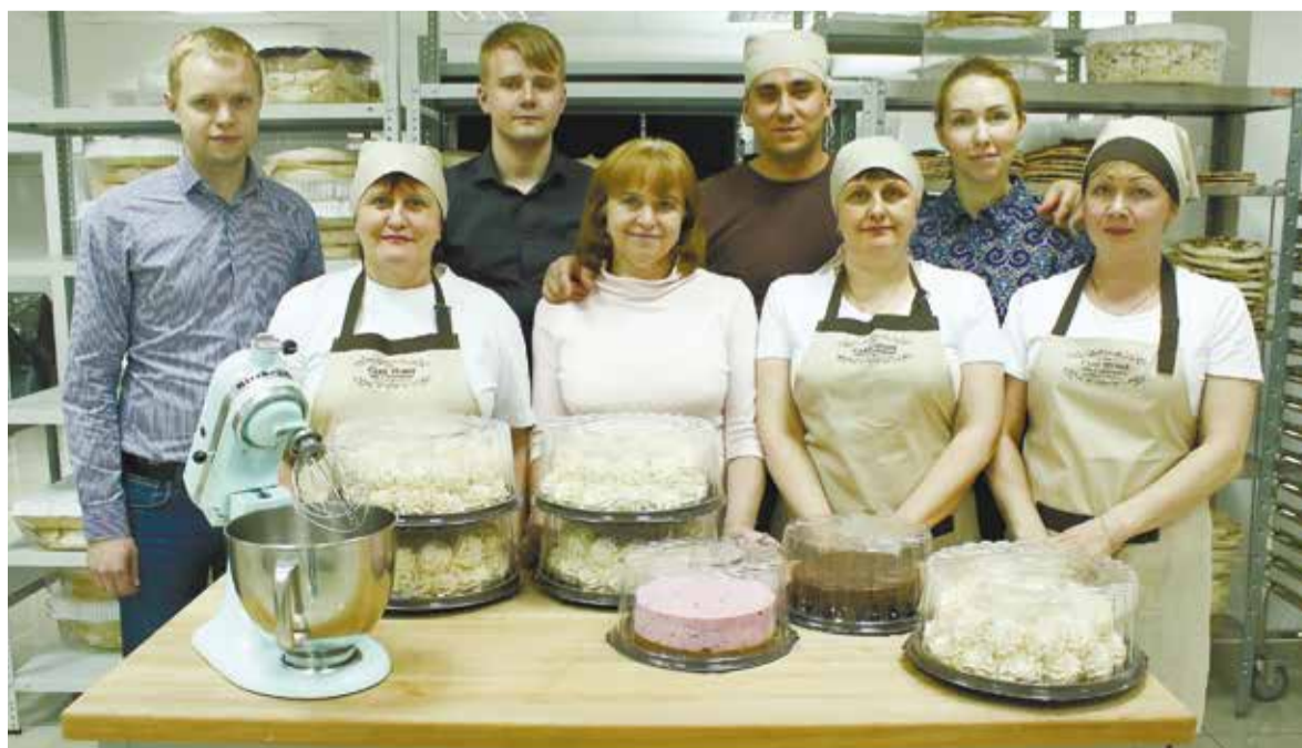
За четыре года коллектив сети кондитерских Cake Home увеличился более чем в десять раз — с 8 до 90 специалистов. Каждый из них подходит к делу с любовью, энтузиазмом и творчеством