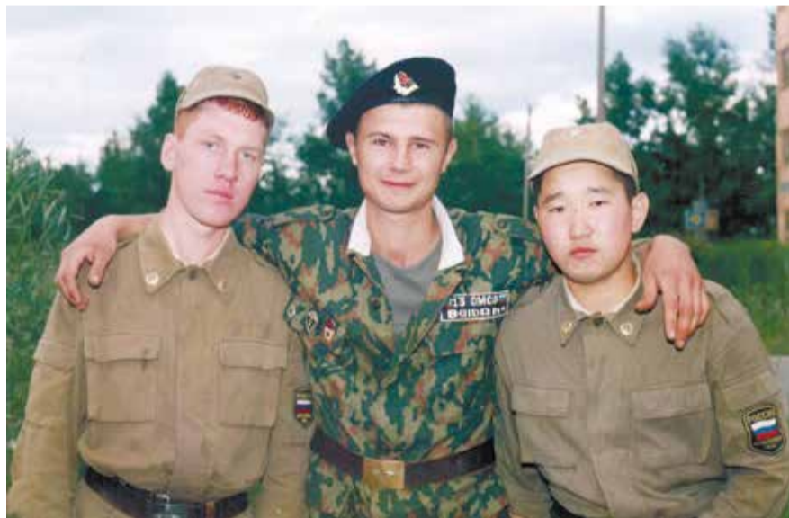
В армии Саша приобрел не только жизненный опыт, но и друзей — на всю жизнь