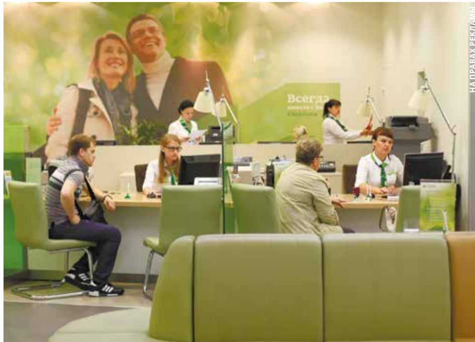
Базовая ставка для участника зарплатного проекта в Сбербанке может быть на несколько пунктов ниже базовой ставки, действующей для других категорий клиентов