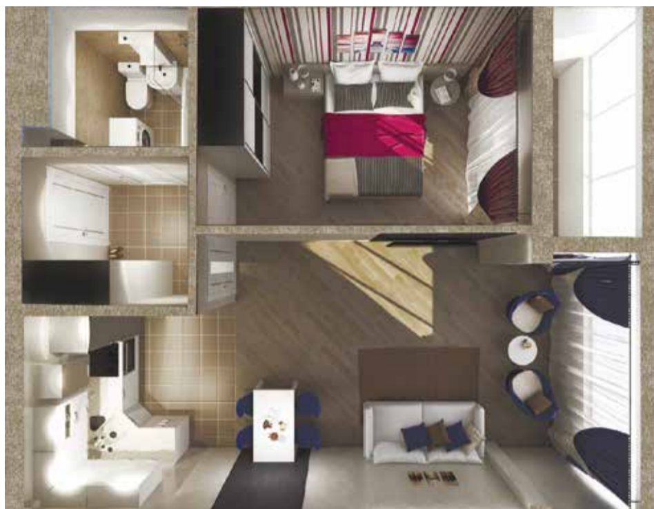
Квартиры различной площади с удобной планировкой, местоположением и инфраструктурой по разумной цене предлагает клиентам «ВостСибСтрой»

- На праздничных мероприятиях и акциях компании.