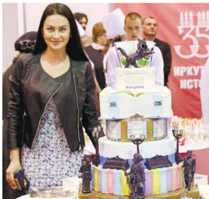
На фестивале «Иркутская история» торт Cake Home, искусно украшенный сладкими символами города, занял I место