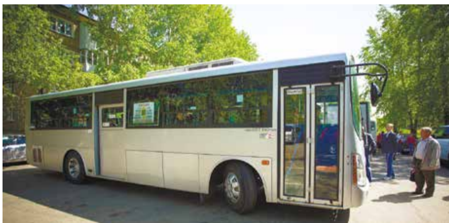
Сейчас автобусам едва хватает места на остановке, чтобы развернуться

Как выяснилось, сюда, на конечный пункт в микрорайоне Юбилейный, приходят пять маршрутов: 2, 2к, 3, 80 и 55. Четыре из них