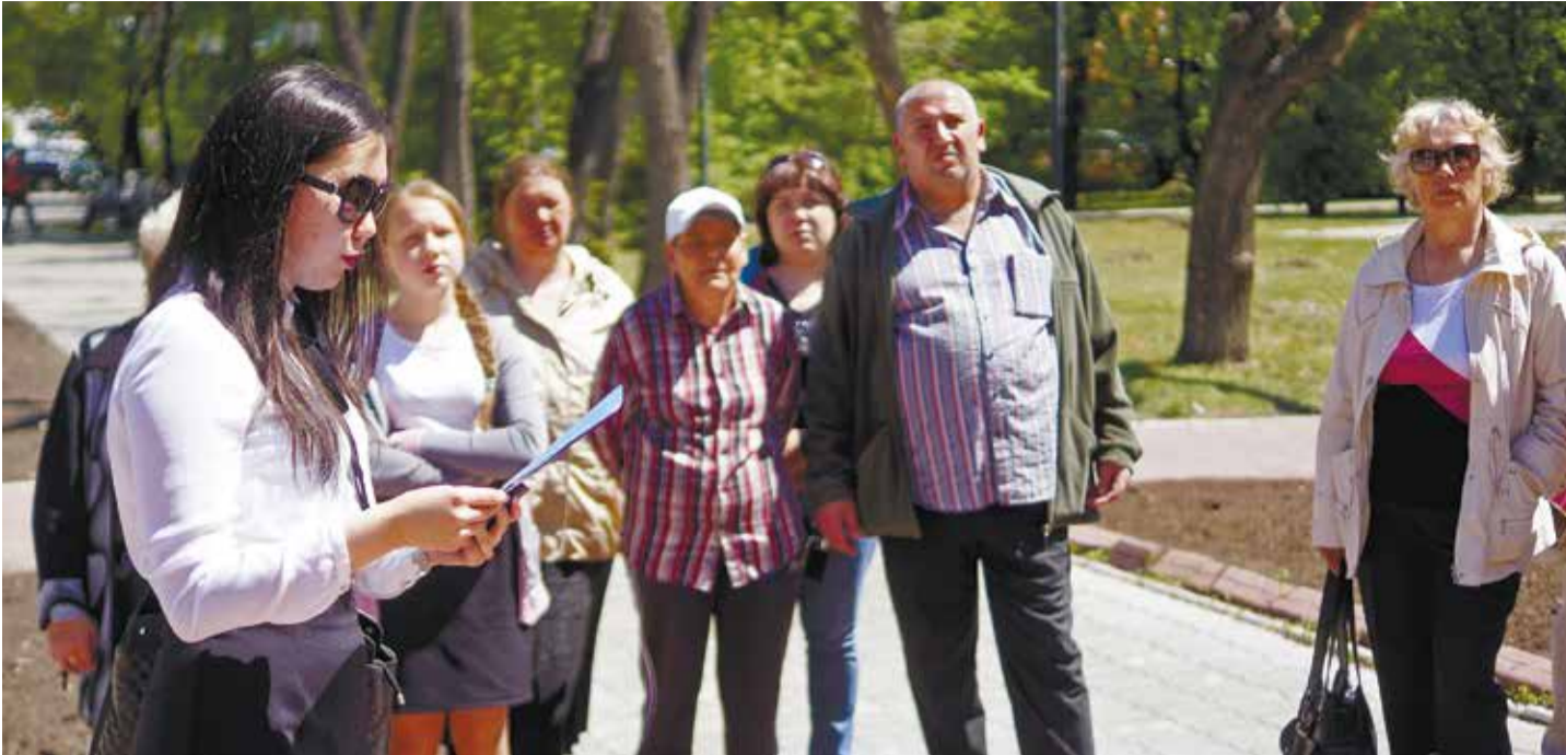
Главное правило экскурсовода — знать чуть больше, чем планируешь рассказать. И быть готовым к любым вопросам