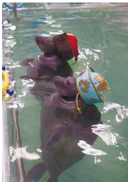
Герои сказки Яков Похабов и хан Иркут в исполнении нерп Винни-Пуха и Ласки