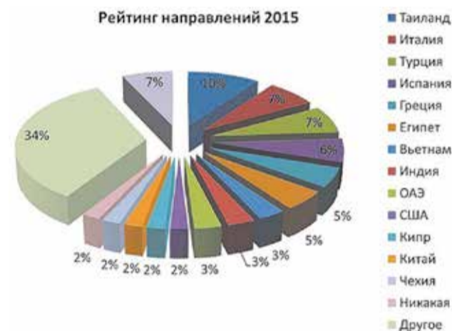
Рейтинг направлений 2015

Чтобы отдых на российском или зарубежном морском побережье не влетел вам в копейку, надо позаботиться о перелете и бронировании отеля заранее