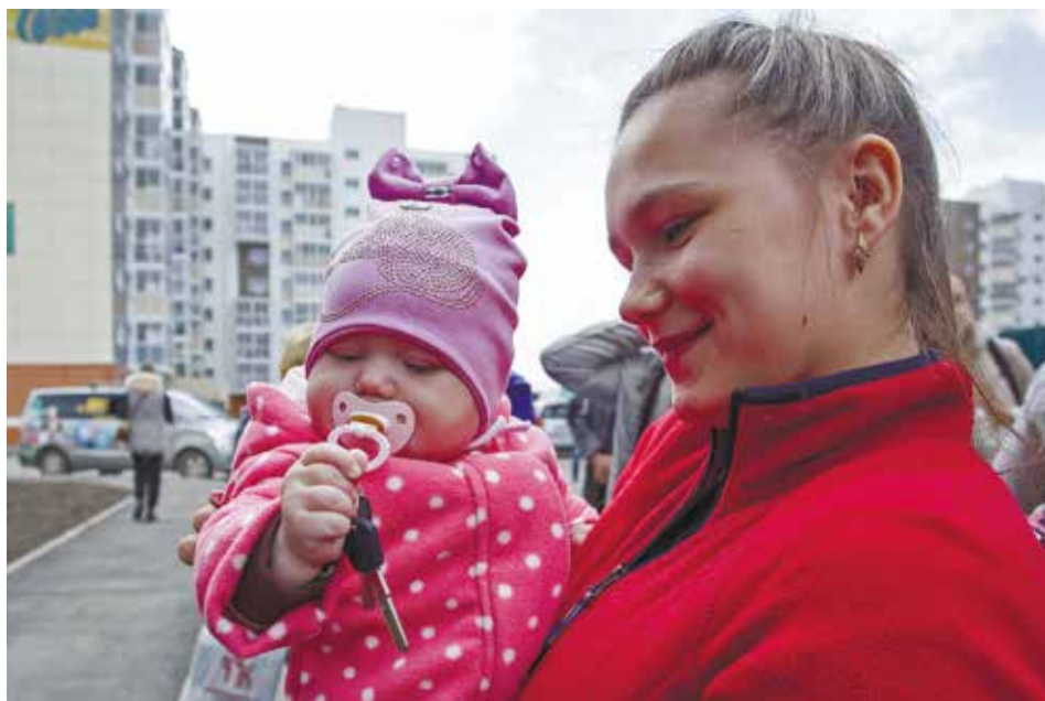
Жилой комплекс «Эволюция», куда переезжают новоселы, — один из ярких примеров того, как правильно развивать инфраструктуру