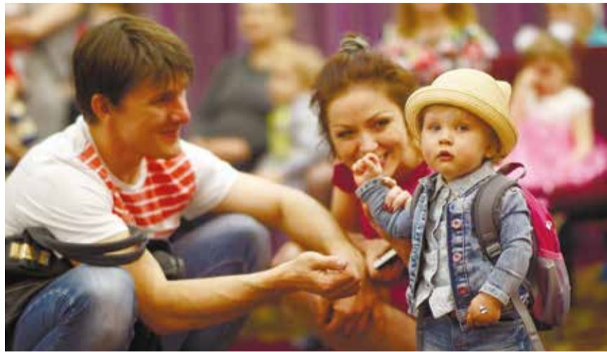
Врачи перинатального центра дарят родителям самое главное чудо — здорового малыша

Сотрудники городского перинатального центра поделились своими успехами. 29 мая в роддоме собрались семьи, в которых родились дети с экстремально низким весом.