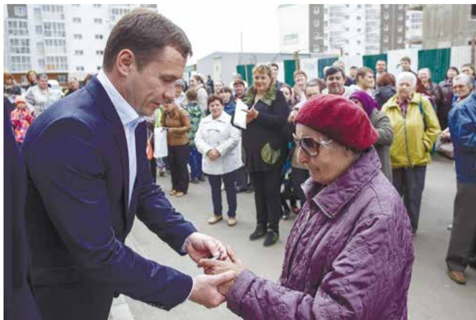
В рамках программы в этом году до сентября будут расселены из аварийных домов 268 иркутских семей