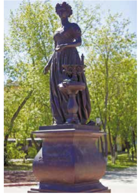
Памятник женам декабристов — самый трогательный мемориал города