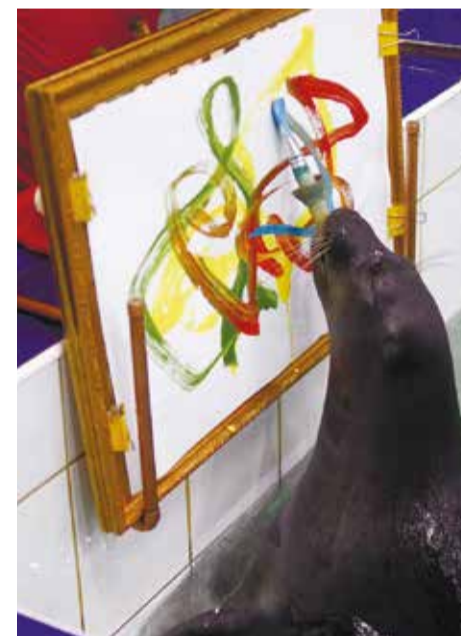
В ходе спектакля нерпы покажут свои театральные, музыкальные и художественные способности