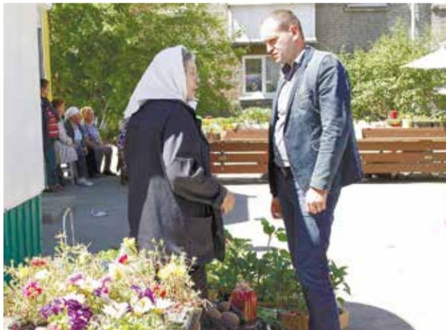
На этой небольшой ярмарке сейчас торгуют рассадой. Чуть позже садоводы предложат новоленинцам свежие овощи, выращенные на собственных огородах