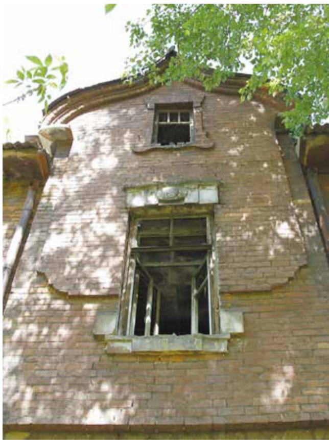
Памятник архитектуры в Дёповском переулке попробуют привести в порядок и найти инвестора