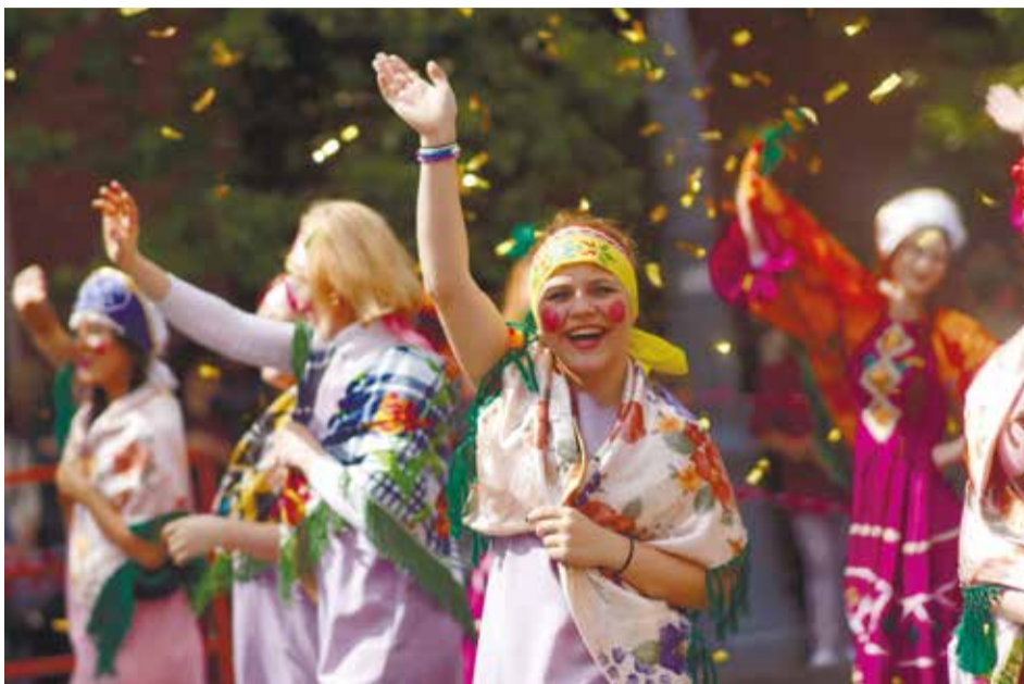
В этом году в костюмированном шествии примут участие 108 команд

На малой сцене у административного здания (Ленина, 14б) в 16:00 состоится гала-концерт фестиваля «Ве-