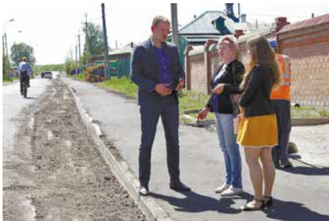
В 5-м Советском переулке доделывают тротуары. Половину ремонтных работ успели сделать в прошлом году

Сворачиваем на улицу Мичурина. Здесь более оживленный район — многоэтажная застройка. Проезжаем