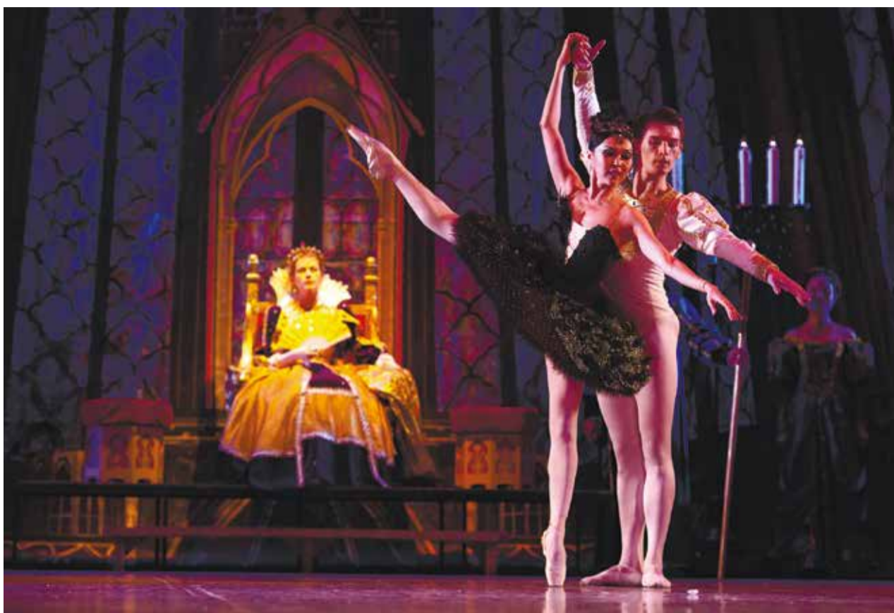
Новое «Лебединое озеро» придет на смену постановке 2005 года. В переработанном варианте сделан упор на костюмы и декорации, изменена хореография

Новое «Лебединое озеро» придет на смену нашей постановке 2005 года, которая устарела как мораль-