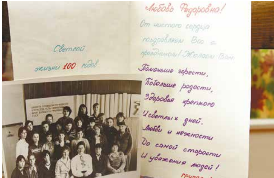
Студенты не забывают любимого преподавателя. Свидетельства этого бережно хранятся в специально отведенной папке