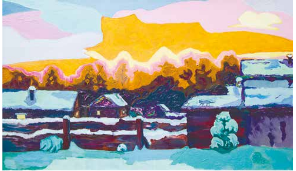
На картине Галины Ивановны баньки по Байкальскому тракту на фоне заката