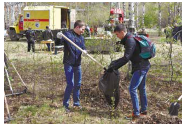
Пока студенты работали граблями и метлами, организаторы готовили полевую кухню