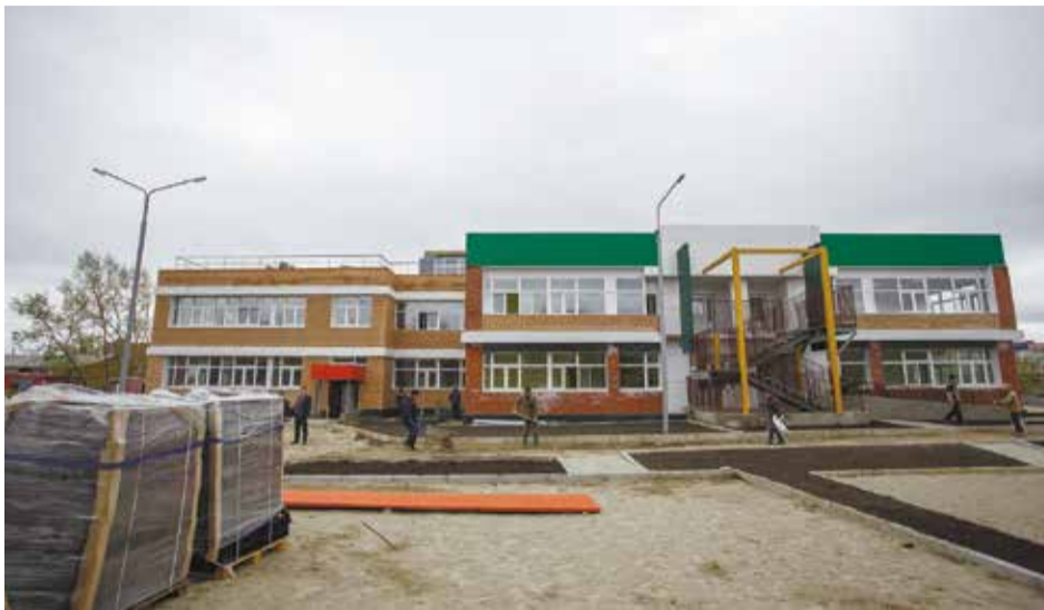
Типовые дошкольные учреждения в Иркутске возводятся с использованием самых современных технологий и материалов

Детский сад сможет принять порядка 350 ребятшек. Это позволит обеспечить местами малышей, стоящих на регистрационном учете в районе Нижней Лисихи, бульвара Постышева и микрорайона Байкальского.