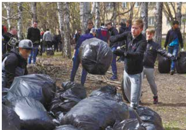
За один день удалось собрать больше тысячи мешков мусора и прошлогодней листвы