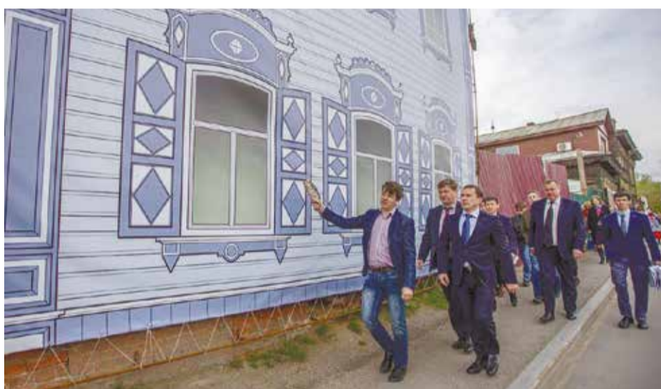
Старинные дома, затянутые баннерами, уже реставрируются Агентством развития памятников Иркутска