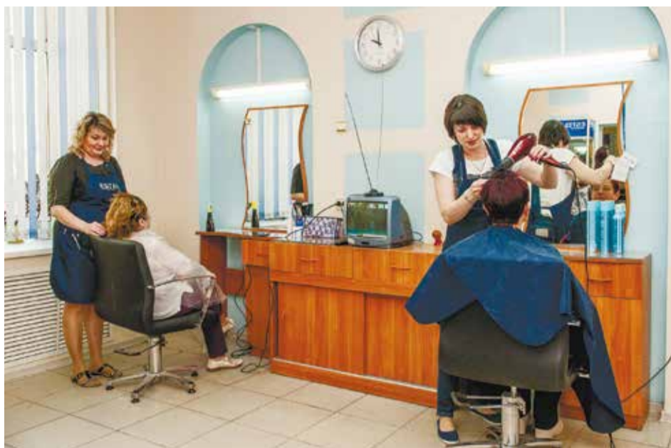
Парикмахерские МУП «Бытовик» обслуживают всех желающих, но в первую очередь их деятельность направлена на оказание услуг льготным категориям иркутян

— За прошлый год мы обслужили более 140 тысяч человек, в том числе почти 40 тысяч льготников. Из них 30 тысяч пенсионеров, 5 тысяч инвалидов, 4 тысячи студентов. В 2016 году значительно возросло количество безработных, которые у нас обслуживаются. Сказывается кризис.