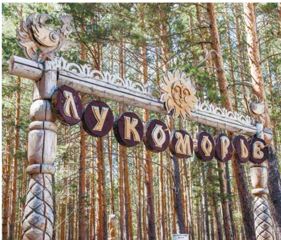
По признанию маститых скульпторов, «Лукоморье» — сильнейший фестиваль деревянной скульптуры во всей России