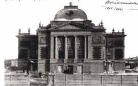
Здание театра в 1851, 1873 и 1886

тов театров в Киеве, Тифлисе, Нижнем Новгороде. Шрётер перестроил и фасад Мариинского театра после пожара в 1880-х.