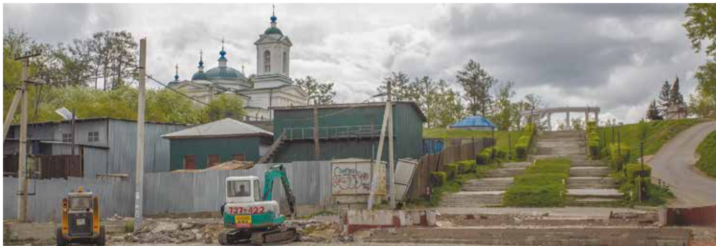
После того, как Иерусалимскую лестницу полностью разберут, начнется реконструкция. Возможно, ее построят из именных кирпичей, купленных иркутянами