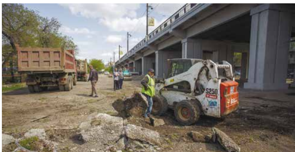
Под Глазковским мостом к 1 июня откроется бесплатная парковка на 107 автомобилей