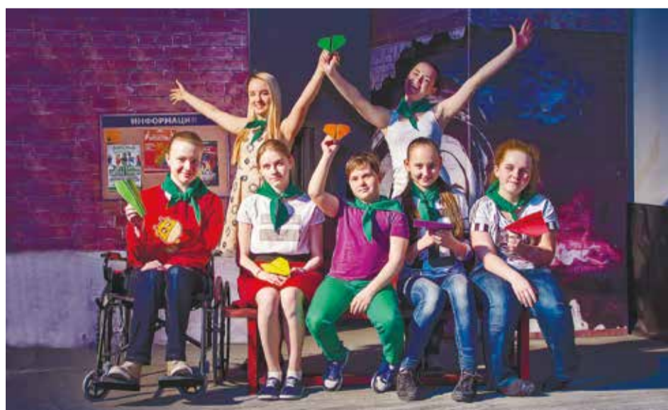
Идея спектакля «Звездный путь» проста — подарить мечту обычным ребятам и показать, как ее достичь

В драмтеатре имени Охлопкова на камерной сцене состоялся фестиваль молодежных театров