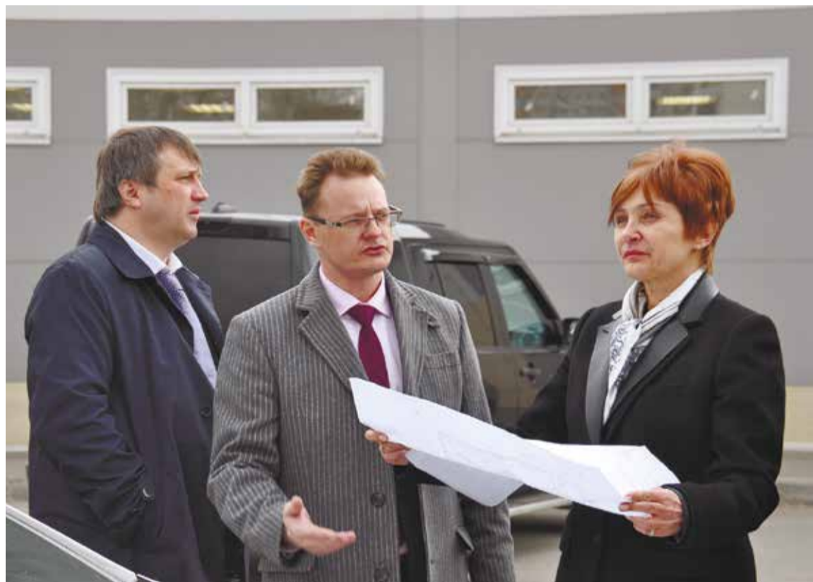
Инициативные жители Иркутска-II подготовили эскизный проект нового сквера. Это хорошее подспорье для архитекторов