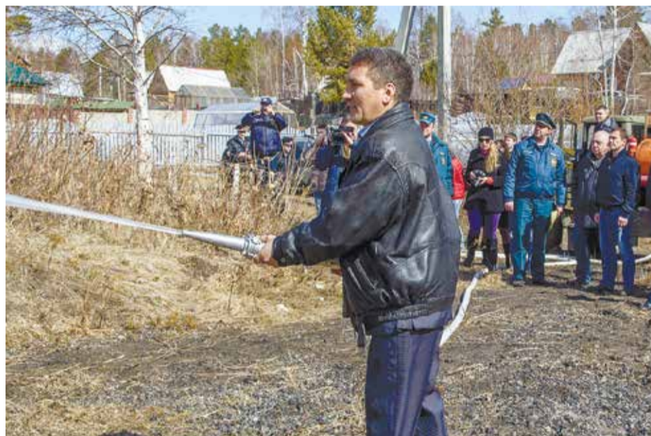
Жители самостоятельно приобрели бывший бензовоз и переоборудовали его в пожарную машину с гидрантами