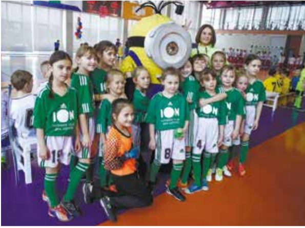
Единственная на турнире команда девочек «Рекорд» составит достойную конкуренцию мальчишкам