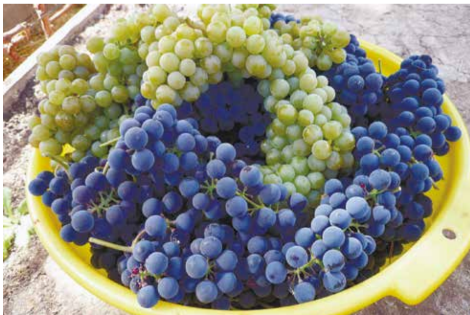
Получить хороший урожай винограда на второй-третий год после посадки — вполне достижимая цель даже для новичков

которое уже ничем не согнешь. А нам его еще укрывать надо.