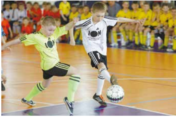
В день открытия турнира состоялся товарищеский матч между командами капитанов