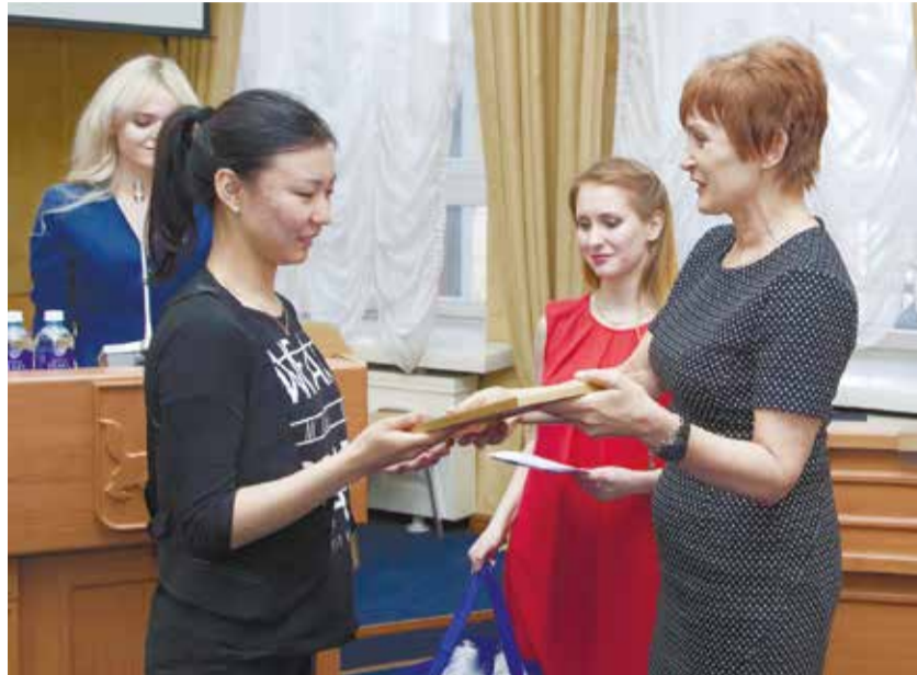
Студентки института МВД — постоянные участницы экологических фотоквестов. Их команды освобождают Иркутск от «лохмотьев» бумажных объявлений