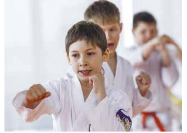
Юные каратисты и рукопашники продемонстрировали свое мастерство на церемонии открытия