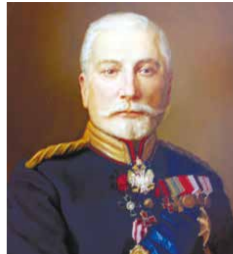
Леонид Князев до приезда в 1910 году в Иркутск был тобольским, вологодским, костромским и курляндским губернатором