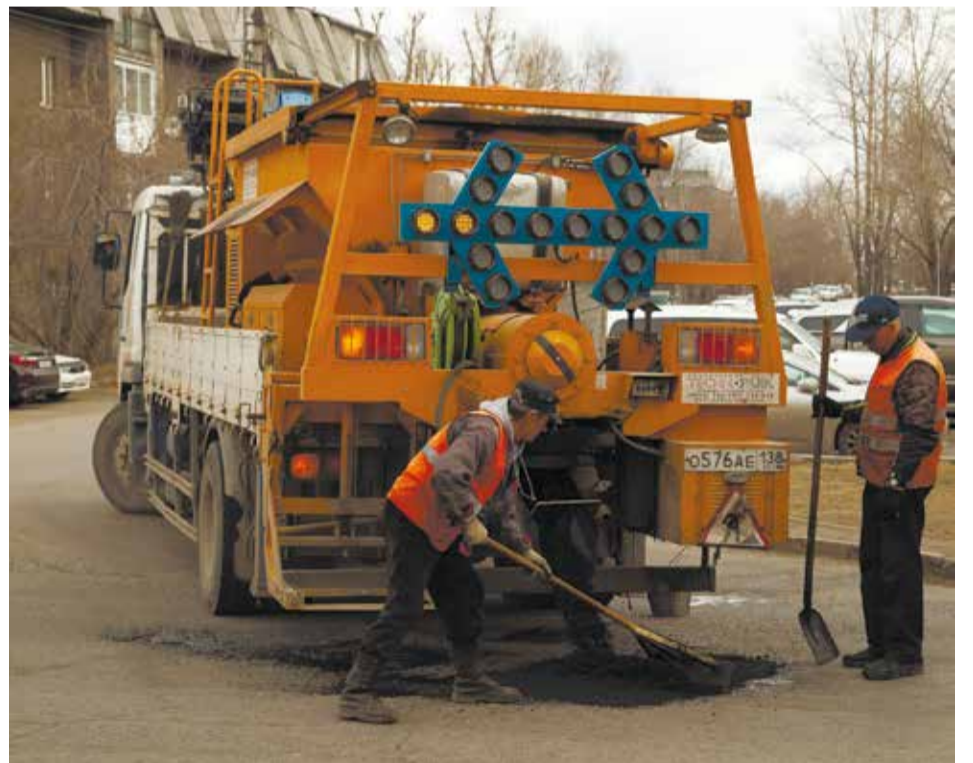
Сейчас в городе ведутся работы по ямочному ремонту

В середине мая начнется ремонт дорог большими картами. Сейчас разыгрываются конкурсы на проведение работ. На эти цели в текущем году будет направлено почти в 2,5 раза больше средств, чем в прошлом — более 100 млн рублей.