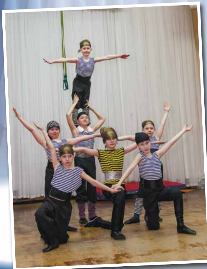
Младшая группа цирковых акробатов: маленькие актеры всегда на позитиве!

ется, когда хотелось все бросить. Но это быстро проходило.