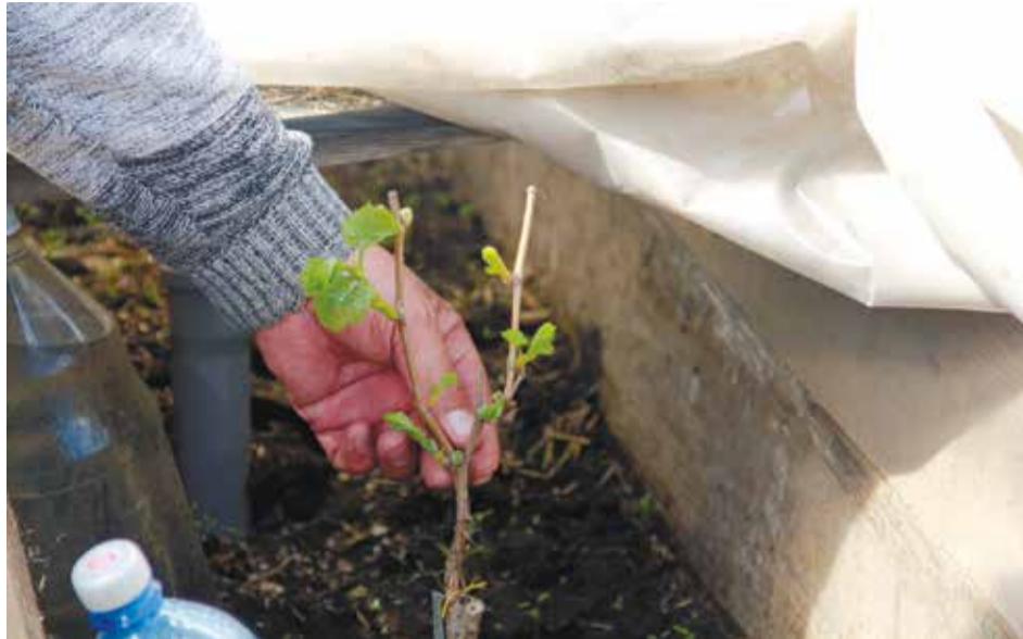
Посадка саженцев в ямы или траншеи предохранит корни от поверхностного вымерзания зимой

Далее наполняем яму плодородным слоем, смешанным с перегноем, торфом и удобрениями, оставляя лишь 40 см до края ямы. Туда же можно добавить еще ведро золы. Посадив саженец, хорошо поливаю теплой водой (по 2-3 ведра на куст). Кстати, сажаем черенок под углом в 45 градусов. Виноград растет 30 лет на одном месте, и если посадить его прямо, то через некоторое время он превратится в дерево,