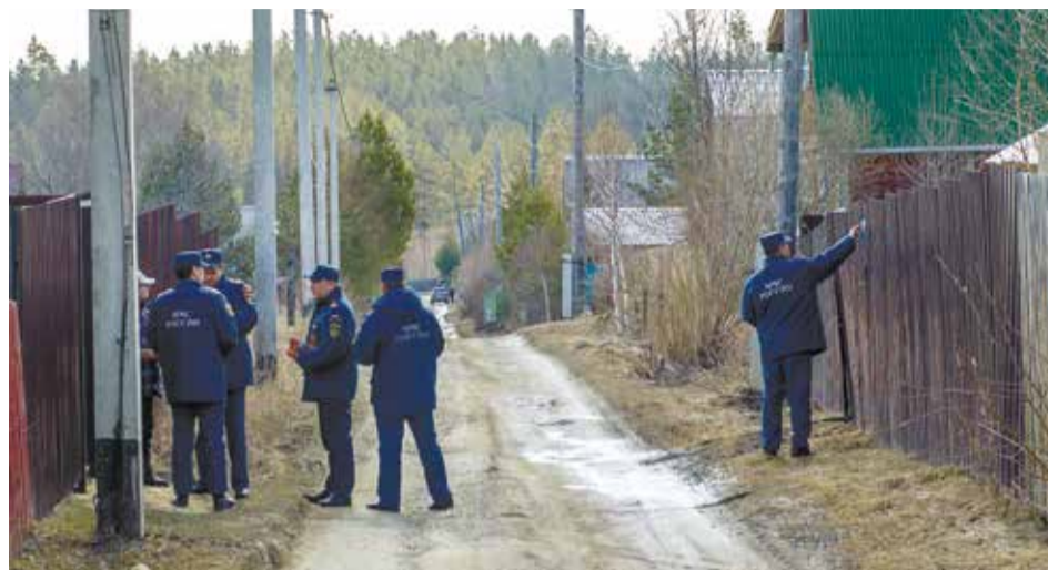
Сотрудники МЧС раздают жителям специальные памятки по правилам поведения во время пожара, рассказывают о том, как уберечь свое жилье от огня и не допустить возгорания сухой травы и мусора