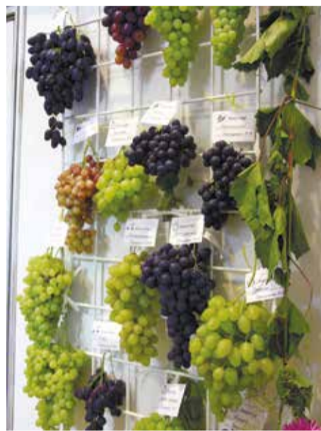
Так выглядел стенд Троицкого на прошлогодней выставке садоводов и огородников в «Сибэкспоцентре»