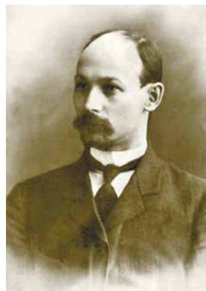
О событиях 14 апреля 1916 года наши современники смогли узнать из летописи Ниты Романова

Подготовил Алексей Петров