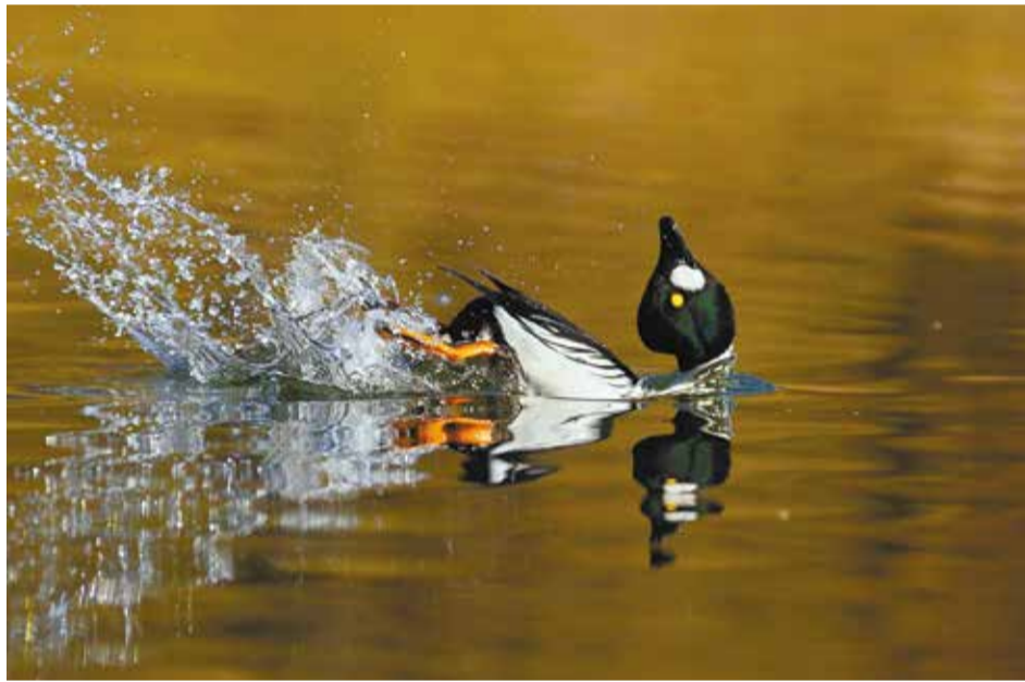
В период брачных игр гоголь закидывает голову назад, выпячивает грудь колесом и быстро бежит по воде, поднимая фонтаны брызг — тем самым демонстрируя самочке свою грациозность