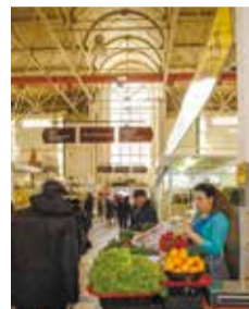
Навигация помогает ориентироваться в огромном здании