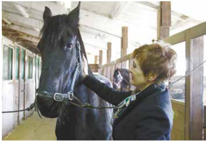
Вороная голландская кобыла — гордость конюшни. К посетителям она относится спокойно и доброжелательно: охотно позволяет себя гладить

К участию в приеме результатов выполненных работ по ремонту улично-дорожной сети привлекут общественные организации, депутатов думы Иркутска и молодежной думы.