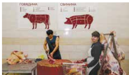
Изменился цех по разрубке мяса. Здесь не только обновился интерьер, но и отремонтирована система вентиляции, установлено новое оборудование