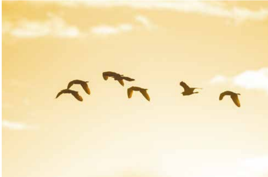
Всего в нашем регионе обитает 426 видов птиц. 17 тысяч уток зимует в истоке Ангары и более 10 тысяч — в черте города

— Есть такие утки — огари — они вместе на всю жизнь. Вместе выводят