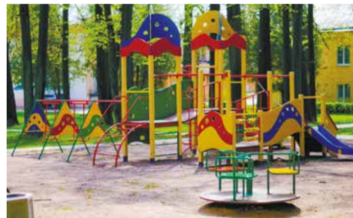
В Свердловском округе порядка 650 детских площадок, из них капитальному ремонту подлежат 92

— Постарайтесь, чтобы и благоустройство площадки не осуществлялось по остаточному принципу, — обратился