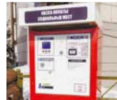
Для удобства продавцов на улице установлен терминал для оплаты социальных мест