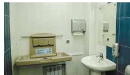
В туалетной зоне появилась кабина для матери и ребенка с пеленальным столиком, а также кабина для людей с ограниченными возможностями