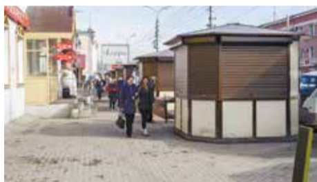
Новые шестигранные павильоны, установленные вокруг рынка, будут украшены панно с видами старого Иркутска