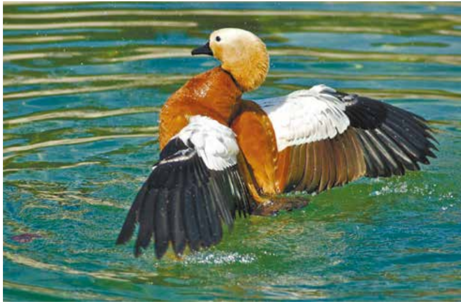
В отличие от большинства уток, огари слывут прилежными семьянинами: если выбирают себе партнера, то на всю жизнь. Вместе они будут выводить потомство и воспитывать утят