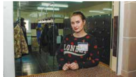
Теперь покупатели могут оставить вещи в отремонтированном гардеробе, это позволит совершать покупки налегке

Основными задачами предприятия пока являются ремонт кровли и вентиляции в здании рынка. В связи с новыми стандартами и внедрением современных технологий активно ведутся консультации с экспертами по вентиляции и кондиционированию. Проведена экспертиза, готовится проект по ремонту крыши.