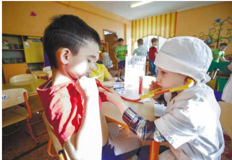
В образовательной программе для особенных детей упор делается на игру. Ребятишки с азартом оттачивают перед зеркалом трудные слова, ищут в баночке с фасолью спрятанные буквы, примеряют на себя профессии врачей, космонавтов и пожарных