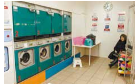
Новая услуга для покупателей рынка — прачечная. Здесь по приемлемой цене можно быстро постирать или почистить вещи