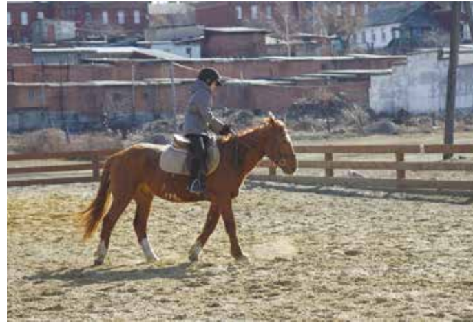
На базе заводской конюшни с ипподромом работают девять конноспортивных секций, где верховой ездой занимаются дети и взрослые