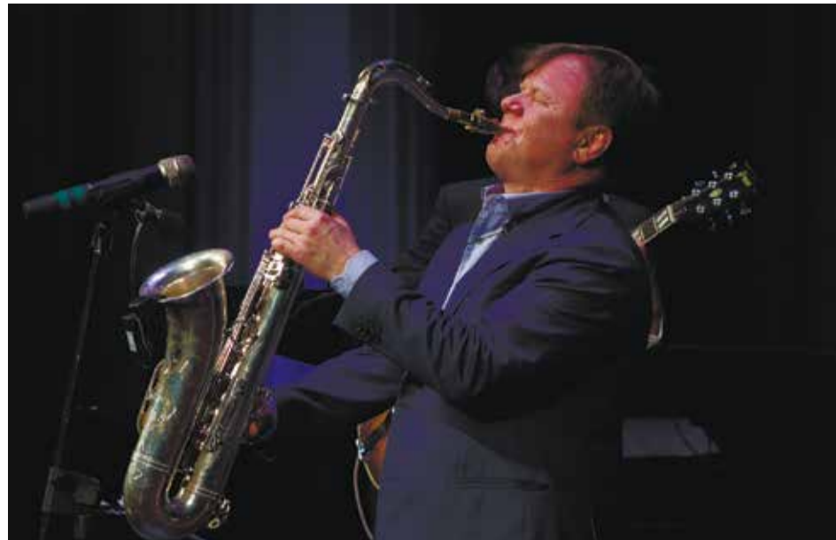
В этом году в прослушиваниях детско-юношеского конкурса приняли участие 160 музыкантов из России, Франции, Южной Кореи и Китая