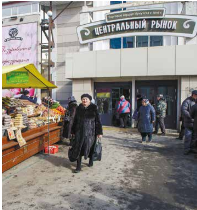
В планах администрации сделать Центральный рынок современной и комфортной зоной торговли

В планах — привести прилегающую территорию к единому стилю, добавить эстетики в привычное для всех место торговли.