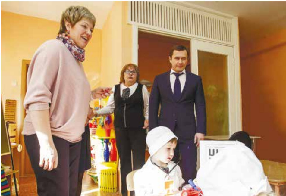
По словам мэра, первая иркутская лекотека будет открыта на условиях софинансирования: на ее создание из городской казны выделено 500 тысяч рублей, из областного бюджета — 1,5 млн рублей