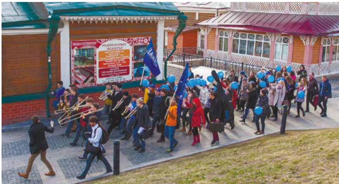
В честь открытия «Джаза на Байкале» участники фестиваля организовали музыкальный парад по 130 кварталу Иркутска и затем провели открытый концерт