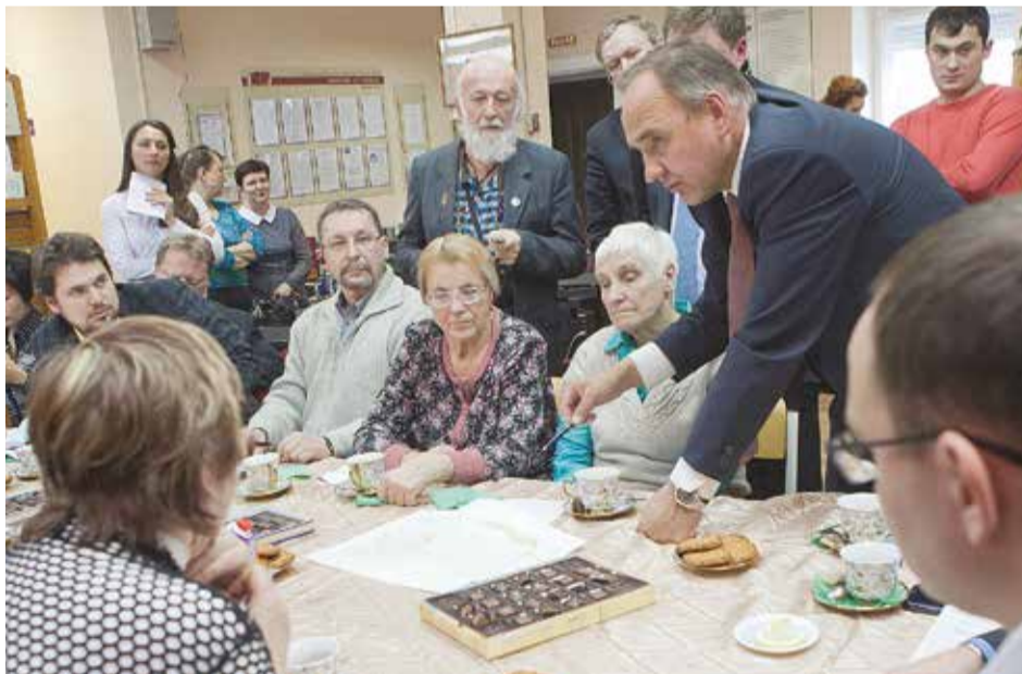
Жители считают, что изменение схемы движения позволит разгрузить проезды от потока транспорта, который движется с Академического моста через микрорайон на улицу Лермонтова

Жители Академгородка начали создание своего ТОСа