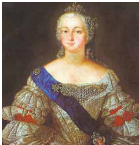
Императрица в знак уважения и монаршей любви вышила для Софрония епископское облачение

Святой Софроний был личным духовником императрицы Елизаветы Петровны. В знак монаршей любви и уважения Елизавета собственноручно вышила для него епитрахиль, пояс и поручи (шитые по серебряной парче и красному бархату цветными шелками, серебром и золотом). Позднее она вышила белый саккос (шитый золотом и серебром) и подарила его Софронию во время его хиротонии во епископа Иркутского и Нерчинского.