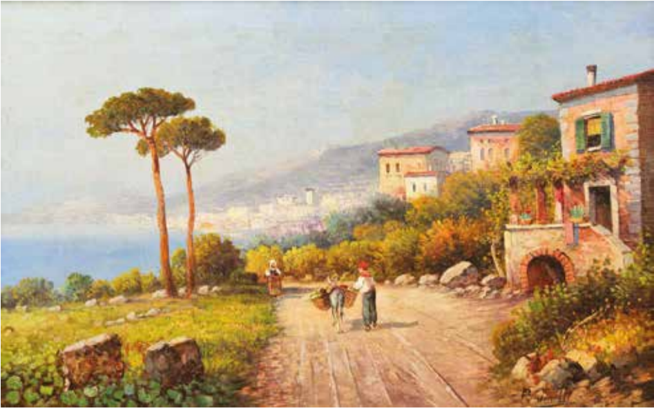
Этот солнечный пейзаж итальянского живописца Торетти редко покидает запасники