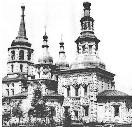
В Крестовоздвиженской церкви хранится икона, которую святитель держал в руках

Гвозди, доски, цементирующий раствор, кирпичи, известка, строительные леса... Фундаменты, кровли, кокошники, купола и закомары, колокольни и приделы – левые и правые, ризницы и алтари... Все это наполняло жизнь святителя Софрония.