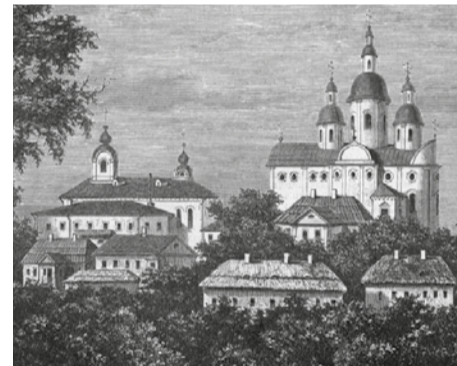
На возведение каменной церкви в Золотоношском Красногорском монастыре святитель Софроний отправил три тысячи рублей