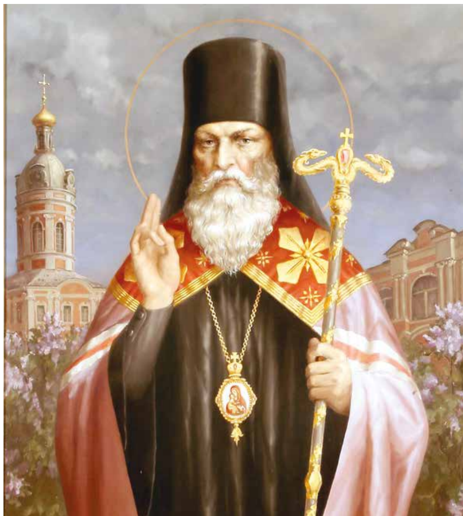
Святой Софроний на иконе современного иконописца Усалева совсем как живой — мудрый, волевой, решительный человек

С одной стороны, ему оказывалась высокая честь, с другой – ждала поездка в необжитую суровую Сибирь. Тогда путь в Иркутск мог длиться несколько месяцев – на лошадях, оленях,