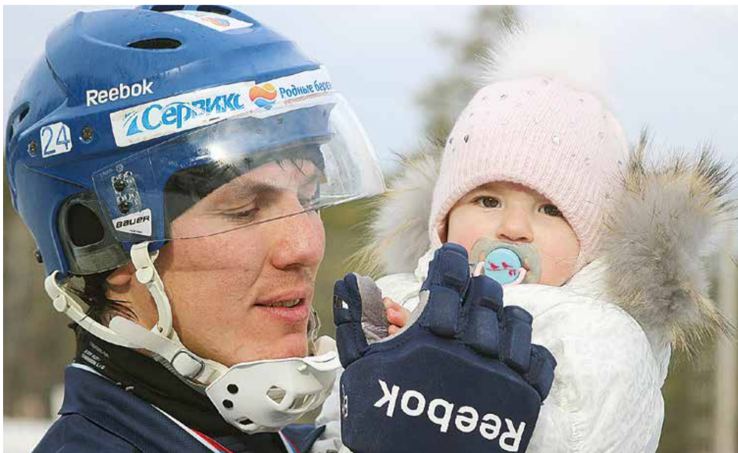
Маленькая Ада старается не пропускать матчей «Байкал-Энергии». Иногда после игры она даже делает круг по льду стадиона на руках у папы

Элина Халтанова