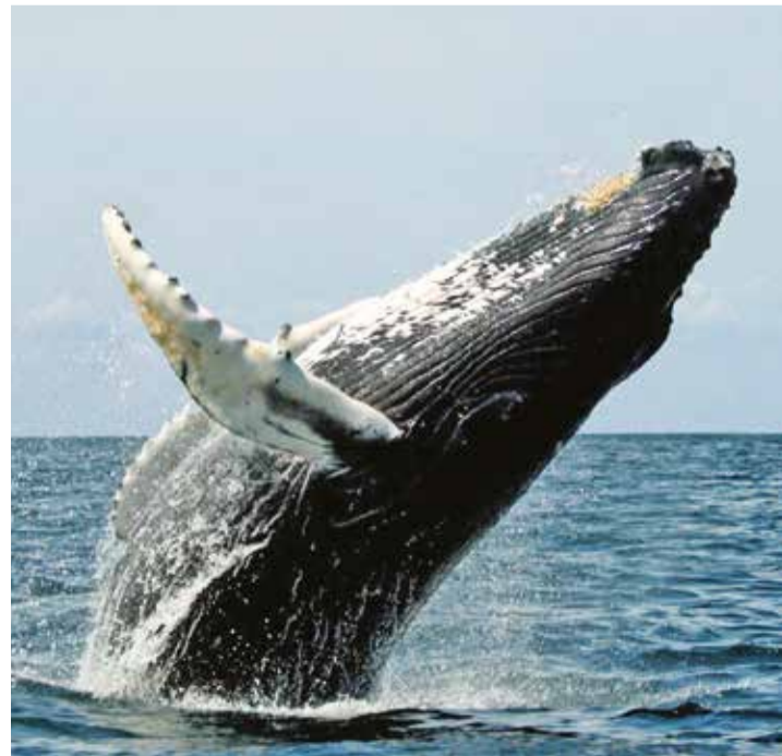
Во время яхтенного перехода от Датч-Харбора до Ситки путешественники смогут понаблюдать за китами в дикой природе