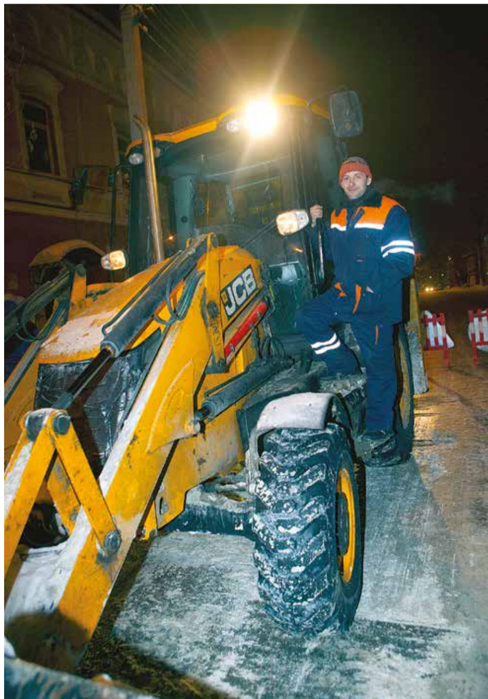
Борцы со стихией призывают иркутян не мешать уборке города: не оставлять машины на ночь вдоль дорог и не лезть под колеса снегоуборочной техники