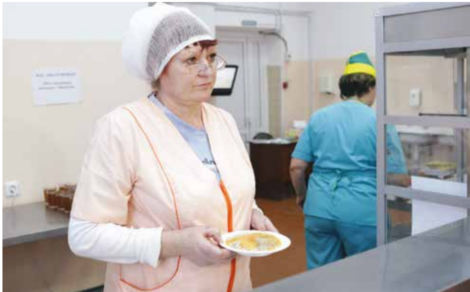
Сегодня в меню на завтрак ячневая каша, тефтели с томатным соусом, бутерброд с сыром, какао с молоком