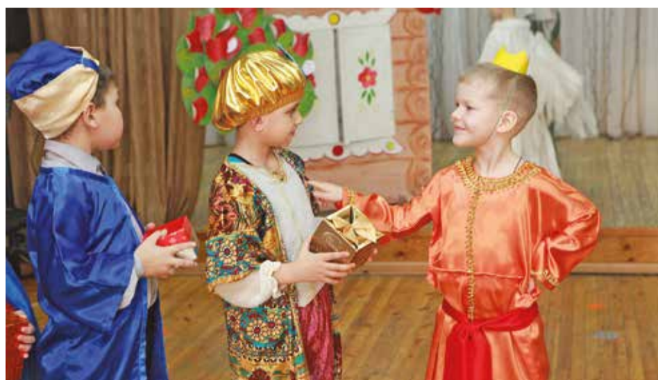
Даже Ирод в исполнении детсадовцев получился не таким уж кровожадным