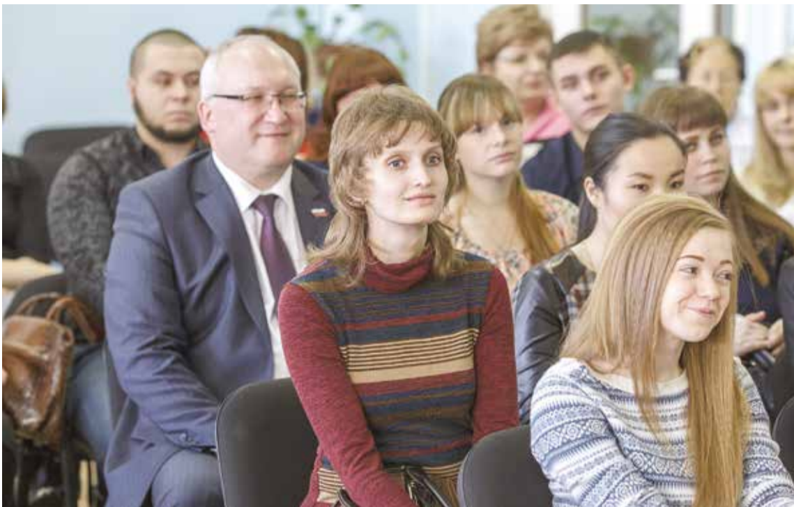
Власти города уверены: социальная поддержка молодых медиков привлечет больше специалистов в больницы и поликлиники, а также поднимет престиж профессии

– Сегодня прошло межевание земель и определены те участки, кото-