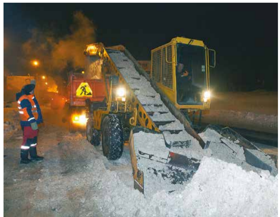
Серые хлопья снега поднимаются по ленте, как по конвейеру, и сыплются в кузов КамАЗа

возят из города новые порции белого материала. Фары самосвалов озаряют красным светом снежные стены, и града холодного порошка высыпается на полигон.