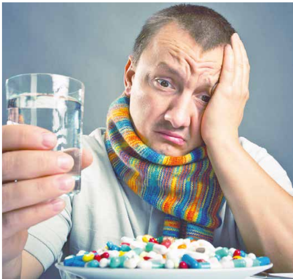
Грипп, в отличие от других вирусов, очень быстро мутирует. Именно поэтому нашего иммунитета хватает на 2-3 года, а не на всю жизнь

— Да, она дает 95% защиты. Сегодня применяется бесклеточная вакцина, под действием которой у человека вырабатываются антитела — защитники организма.