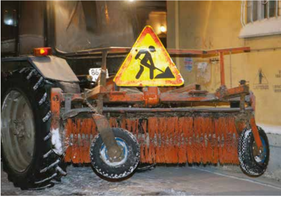
Собранный с улиц снег увозят на полигон. За смену городской снегоотвал принимает около 350 машин

ставлены машинами, вот и приходится бирать по ночам.