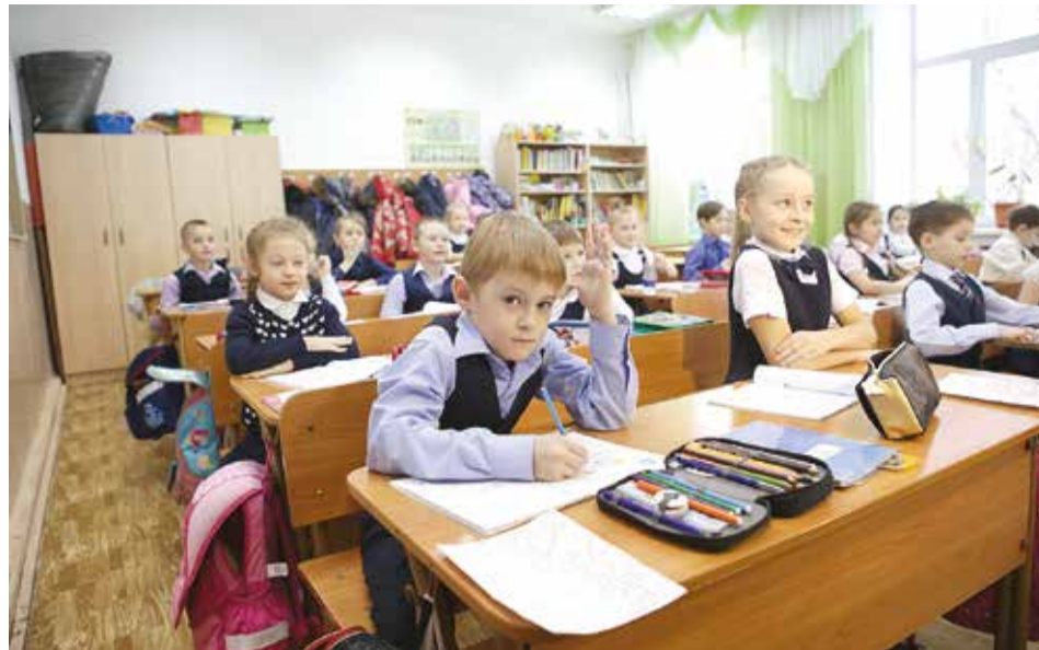
С начала января в школе №24 стало теснее и оживленнее: сюда перевели первые и четвертые классы школы №19, закрытой на капремонт