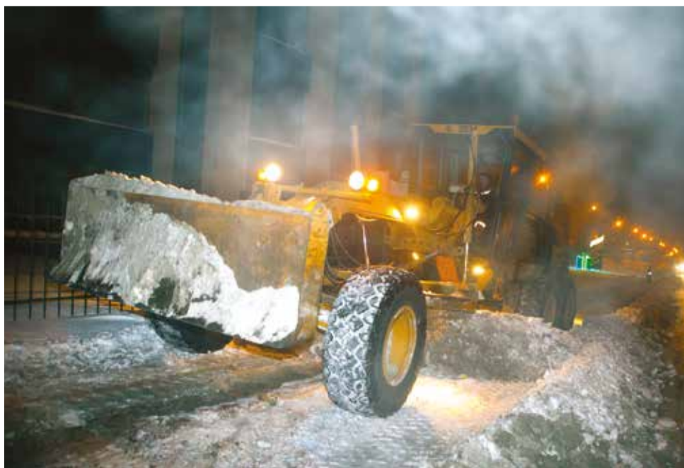
Ночью работа дорожников осложняется морозом. В ночь нашего дежурства столбик термометра опустился до -27 градусов. Но работникам Автодора морозы ничем – уборка при любой погоде идет полным ходом

ЦИФРЫ 102 единицы техники убирают город 69 машин задействовано на уборке снега 221 человек работает на дорогах 9345 тонн противогололедных материалов израсходовано за январь 60000 тонн снега вывезено с улиц города