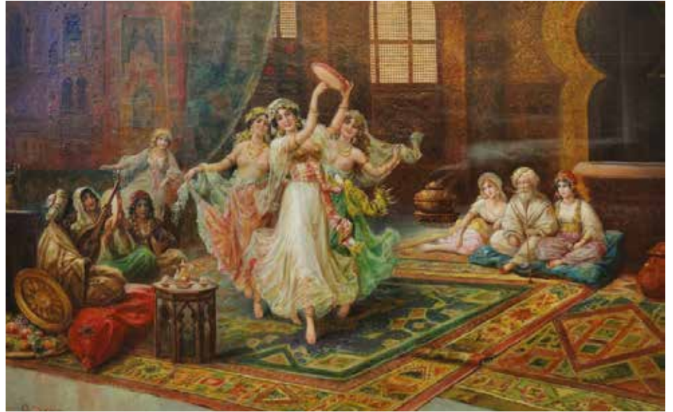
В жанровой сценке художника А. Бело перед зрителями предстает восточный гарем с танцующими изящными одалисками