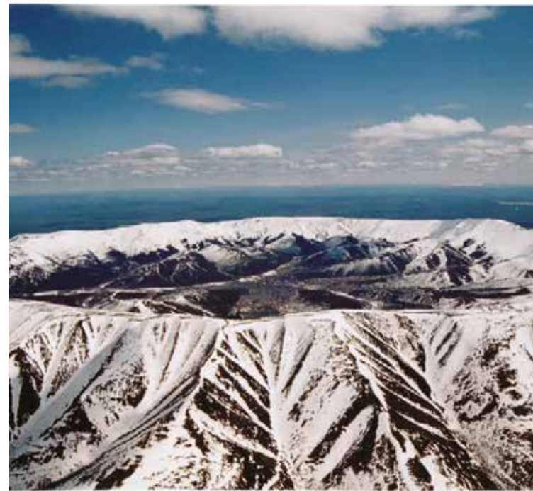
По пути из Якутска на Камчатку запланирована остановка на горном массиве Кондер – одном из крупнейших в мире платиновых месторождений