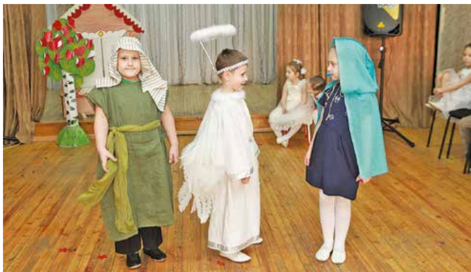
Иосиф, Дева Мария и Ангел «со штуковиной вокруг головы, которую делала тетя Маша»