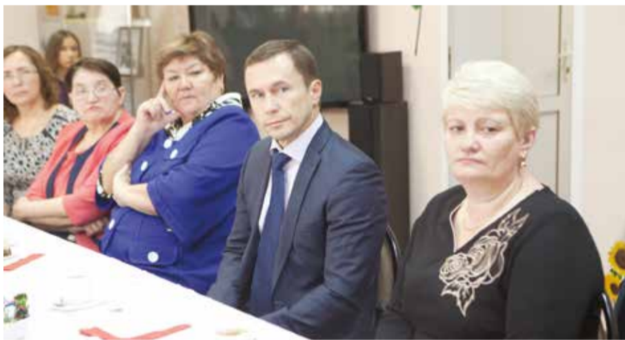
Благодаря действиям, предпринимаемым городскими властями, предместье Рабочее в ближайшие годы станет одним из самых привлекательных для проживания районов города

По словам иркутского градоначальника, в ближайшее время Рабочее станет одним из самых перспективных районов Иркутска. Но чтобы он начал развиваться, в первую очередь необходимо решить вопрос с инженерной инфраструктурой и протянуть в Рабочее так называемый тепловой луч. Как только эти работы будут сделаны, здесь начнется комплексная застройка жилых массивов, а также стартует реализация программы развития застроенных территорий. Уже сейчас администрацией города проводится большая работа по расселению жите-