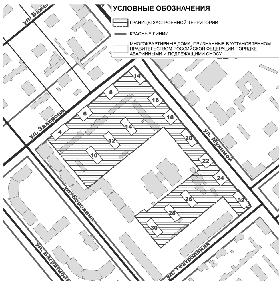
СХЕМА застроенной территории

Приложение № 2 к решению Думы города Иркутска от 25.08.2016 № 006-20-240384/6