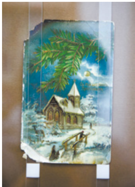
Дарить новогодние почтовые открытки стали с конца XIX века, эта традиция пришла к нам из Англии. Причем дореволюционные открытки поражают своим качеством: объемные, красочные, с тиснением, на хорошей бумаге. К 1880 году по почте рассылалось более 11,5 млн подобных отправок. Почтовые работники были вынуждены напоминать поздравляющим: «Не откладывайте отправку открыток до самого Рождества»

сенком и курицей. Подавались рыба, салаты, студень, блины, красный борщ, грибной или рыбный суп, свиной и телячий окорок, пирожки, рулет с маком или маковый торт, пряники, клюквенный кисель, компот из сухофруктов, яблоки, орехи», — вспоминает Лидия Тамм.