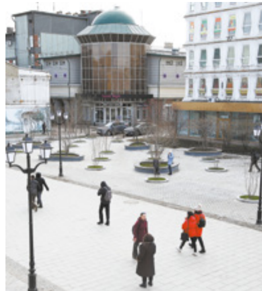
Одно из главных событий 2019 года — ремонт улицы Урицкого