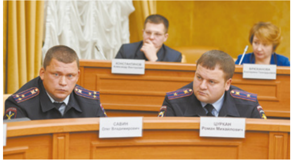
В совещании, инициированном мэром Иркутска, приняли участие директор учебных заведений, представители родительских комитетов и правоохранительных органов