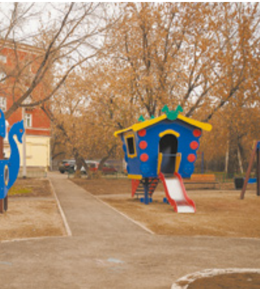
«...обустроили совместно с жителями... «...повышение комфортной городской среды»