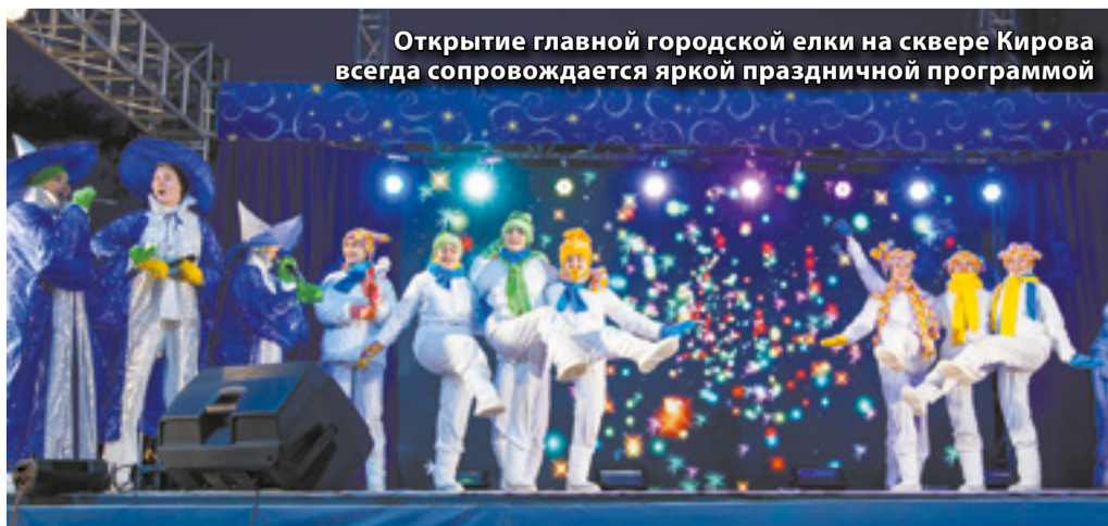
Открытие главной городской елки на сквере Кирова всегда сопровождается яркой праздничной программой

— На острове Конный 22 декабря предусмотрена праздничная программа и презентация семейной зоны зимнего отдыха. С 1 по 6 января там пройдут игровые программы, 13 января — бал-маскарад, на котором горожане будут встречать Старый Новый год, а 25 января — второй общегородской День студента. 22 декабря