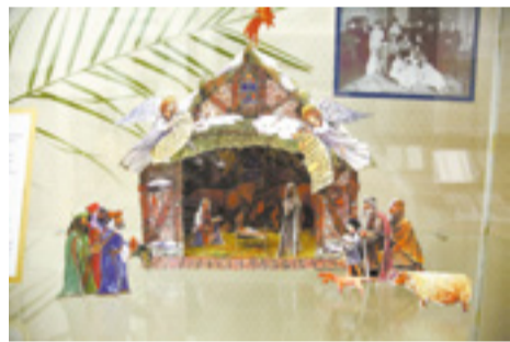
В рождественские праздники горожане с нетерпением ждали артистов вертепного представления — в то время они заменяли иркутянам походы в театр

Распространенная сегодня форма благотворительности «Тайный Санта», по сути, существовала еще полтора века назад. И называлась она «Тайная милостыня». Семья собирали подарки, угощения, аккуратно складывали все это в корзинки, накануне Рождества относили в дома бедных соседей и оставляли на крыльце.