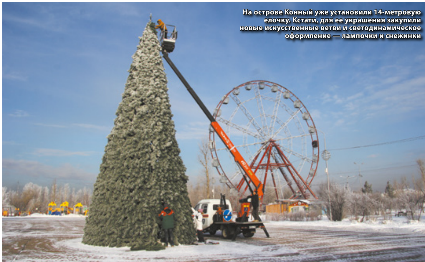
На острове Конный уже установили 14-метровую елочку. Кстати, для ее украшения закупили новые искусственные ветви и светодинамическое оформление — лампочки и снежинки

Традиционно центром притяжения горожан и туристов станет сквер имени Кирова, где 21 декабря откроется главная елка, ледовый городок и резиденция Деда Мороза. Елку уже смонтировали, она снова предстала в традиционном «облачении» последних двух лет, выдержанном в стиле золотисто-зеленых русских мотивов. А вот ледовое оформление сквера Кирова в этом году будет посвящено популярным мультипликационным персонажам. К 20 декабря планируется установить около 20 ледовых фигур, световой фонтан, а также