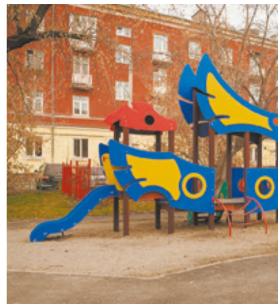
Этот сказочный двор городские власти благоустроили в рамках федеральной программы «Формирование комфортной городской среды»