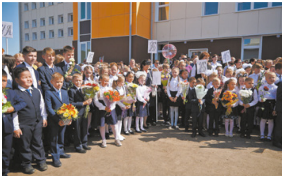
1 сентября 2019 года дети микрорайона Лесной отправились в большую и современную школу № 33

— Ничего особенного в этом нет. Первым делом жильцам нужно совместно обсудить концепцию благоустройства своей территории. Потом следует собрать ряд документов, заполнить заявку. И на этом этапе горожанам активно помогают наши специалисты. До 1 июня 2019 года заявки принимались только в марте, но сейчас они принимаются круглогодично. Есть ряд критериев, в соответствии с которыми составляется рейтинг дворов. Согласно этому рейтингу утверждается очередность