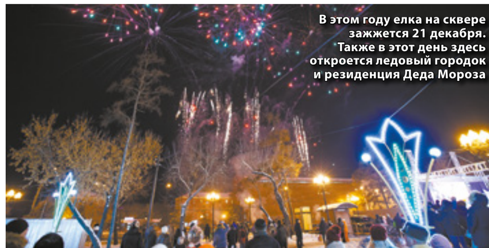
В этом году елка на сквере зажжется 21 декабря. Также в этот день здесь откроется ледовый городок и резиденция Деда Мороза