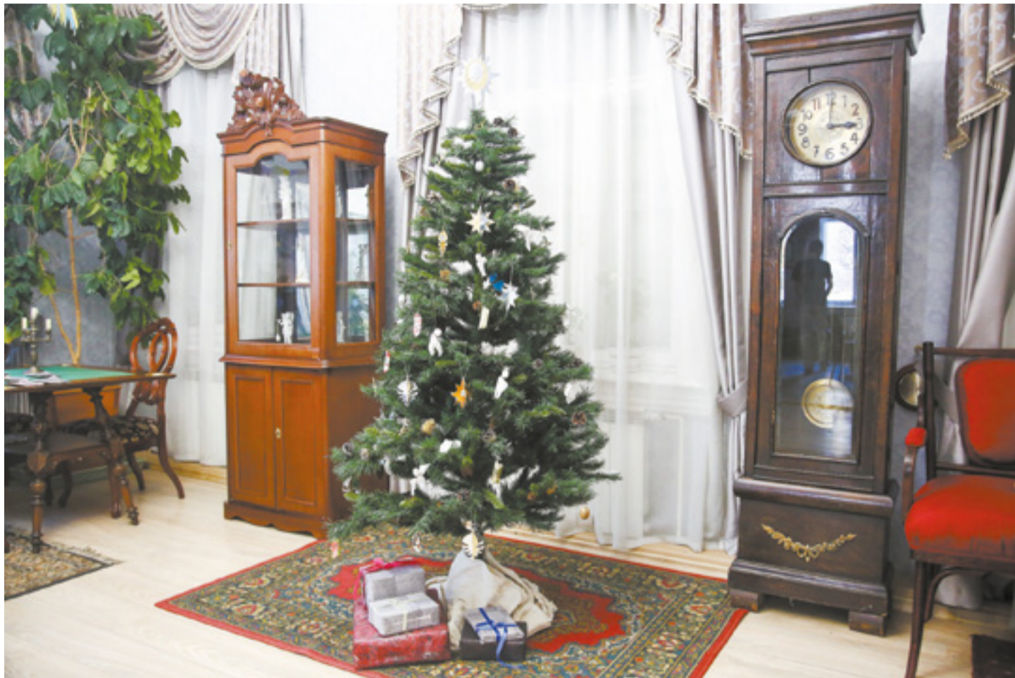
Сейчас в Музее городского быта каждая комната отражает рождественские традиции: в гостиной можно узнать, как наряжали елку, в столовой — что подавали на стол, в девичьей — все о гаданиях, а в детской — про святочные забавы