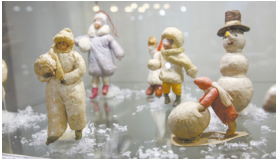
В 1965 году елочные игрушки перестали раскрашивать вручную, запустили массовое производство. Поэтому по решению Международной ассоциации коллекционеров елочных украшений раритетными считаются игрушки, выпущенные до 1965 года