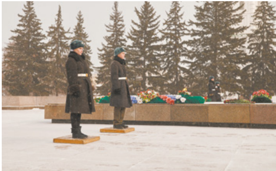
В преддверии 75-летия со дня Великой победы было принято решение провести реставрацию мемориала «Вечный огонь»