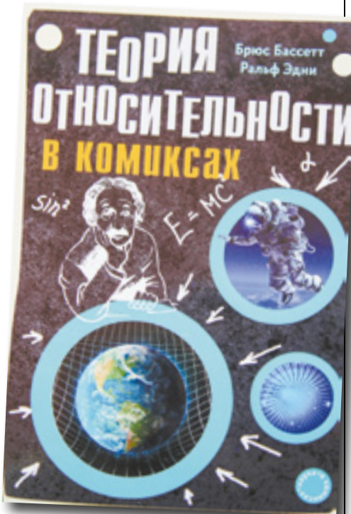
В формате комикса издательство «Эксмо» представило аудитории теорию относительности Альберта Эйнштейна