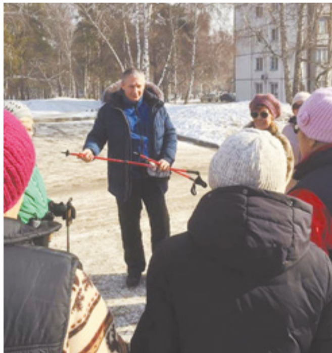
Сегодня благоустройство и развитие Свердловского округа во многом зависит от слаженной работы населения и городских властей