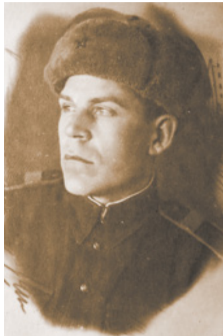
В своих посланиях Клевицкий признавался, что это его первая переписка в жизни