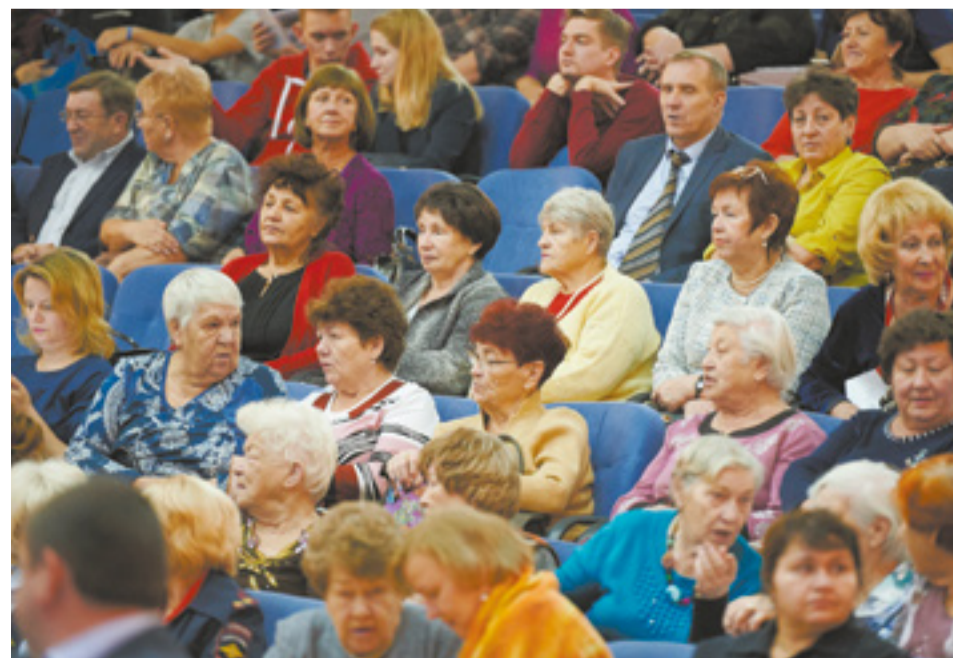
На концерт пришло около 500 горожан, чьи судьбы связаны с районом на левом берегу Ангары