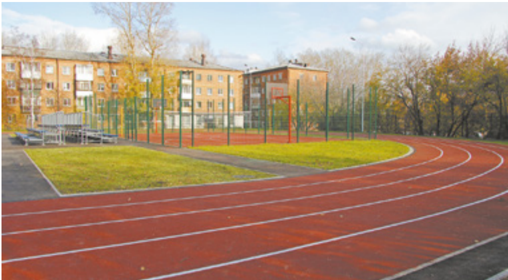
В рамках муниципальной программы «Территория детства» в этом году завершена реконструкция стадиона лица ИГУ