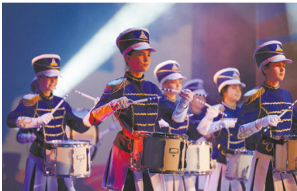
Торжественный концерт по случаю 75-летия Свердловского округа в зале ИРНТУ открыли барабанщицы ВСИ МВД России

Елена Трофименко