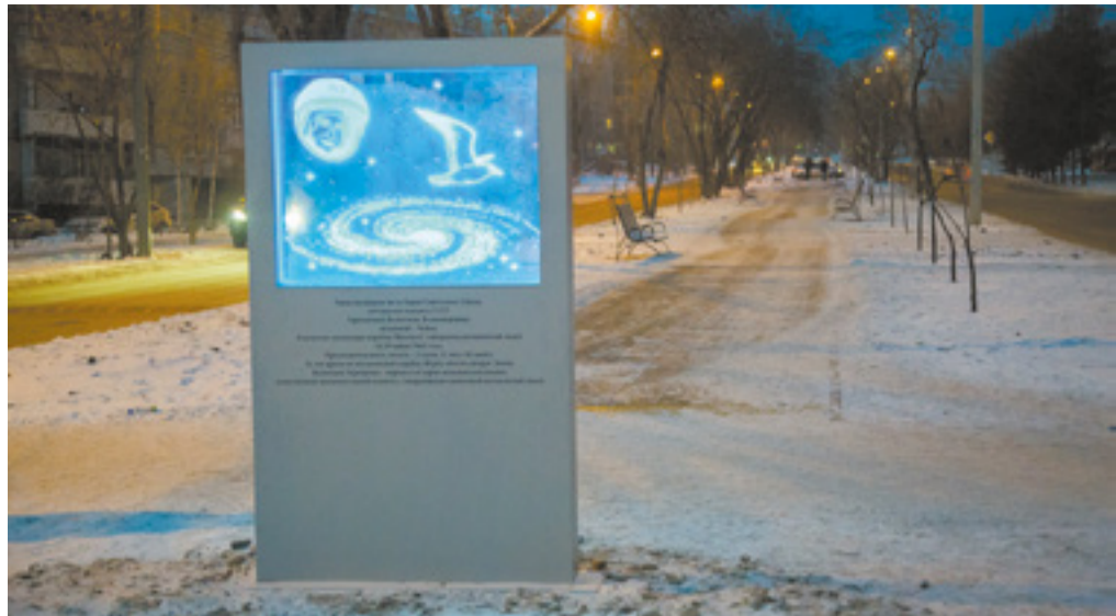
Памятник первой женщине-космонавту Валентине Терешковой появился в сквере на улице, названной в честь этой легендарной женщины