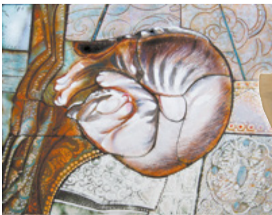
Лев Сериков «Лунная соната»