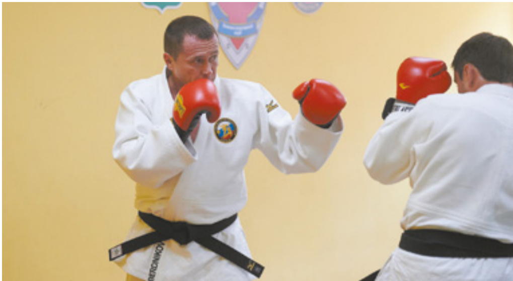
Накануне турнира глава города провел тренировку по армейскому рукопашному бою со сборной Иркутска