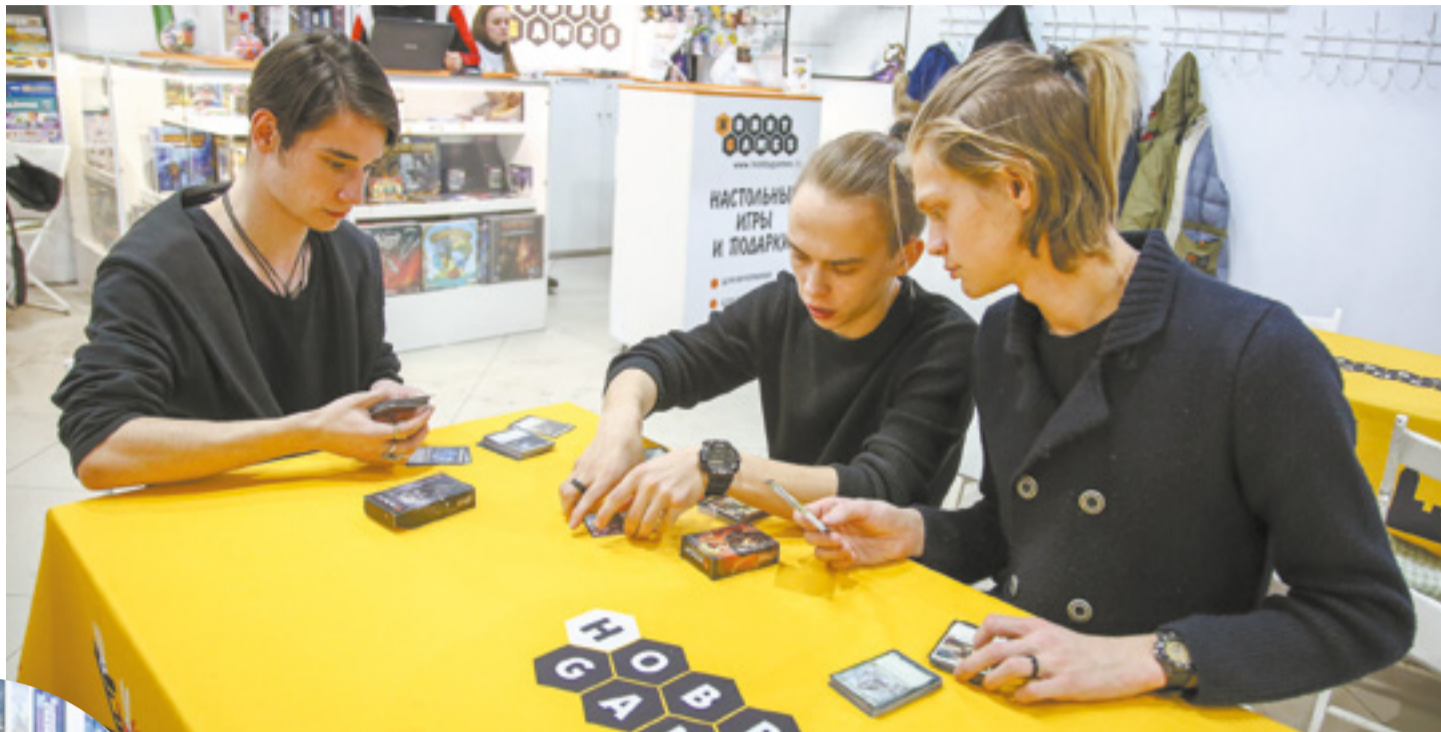
Многие коробки с играми уже распакованы, их можно открыть, почитать правила, рассмотреть карточки, кубики, фишки и тут же поиграть, если захочется

Из советского детства мне больше всего запомнилось, как вся семья собиралась вечером за большим столом и играла в русское лото. Вот из мешка один из игроков достает деревянный бочонок и громко говорит: «Дед. А сколько ж ему лет? 90». Еще были «барабанные палочки — 11», «чер-