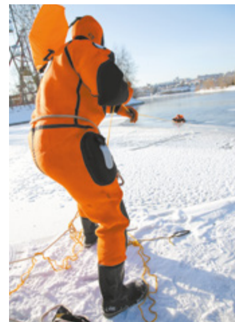
Спасатели разыграли перед школьниками три возможных сценария развития событий: когда выбраться из воды приходится самому, когда на помощь спешит прохожий и когда в дело вступает аварийно-спасательная служба