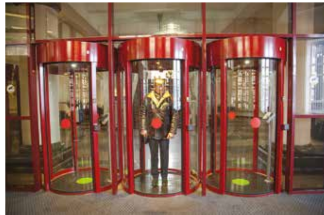
Система шлюзов защищает здание банка от нежеланных гостей