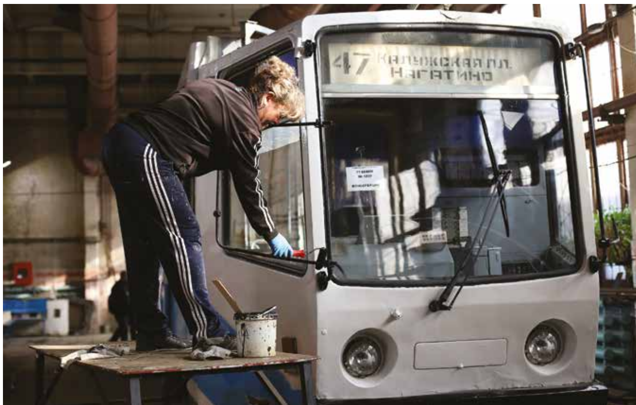
Работники трамвайного депо готовят московские вагоны к выходу на маршрут. На улицах Иркутска они появятся в середине ноября

Алексей Буренин