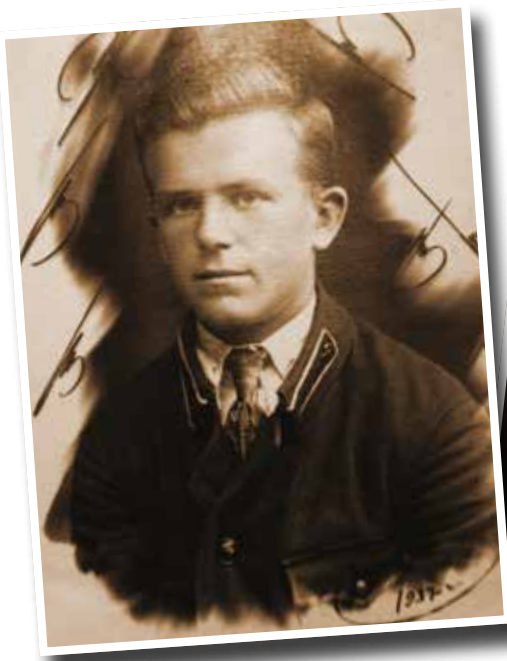
Времена учебы в Орловском военно-политическом училище, 1937 год