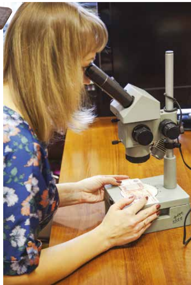
Один из этапов проверки купюры на подлинность — изучение под микроскопом