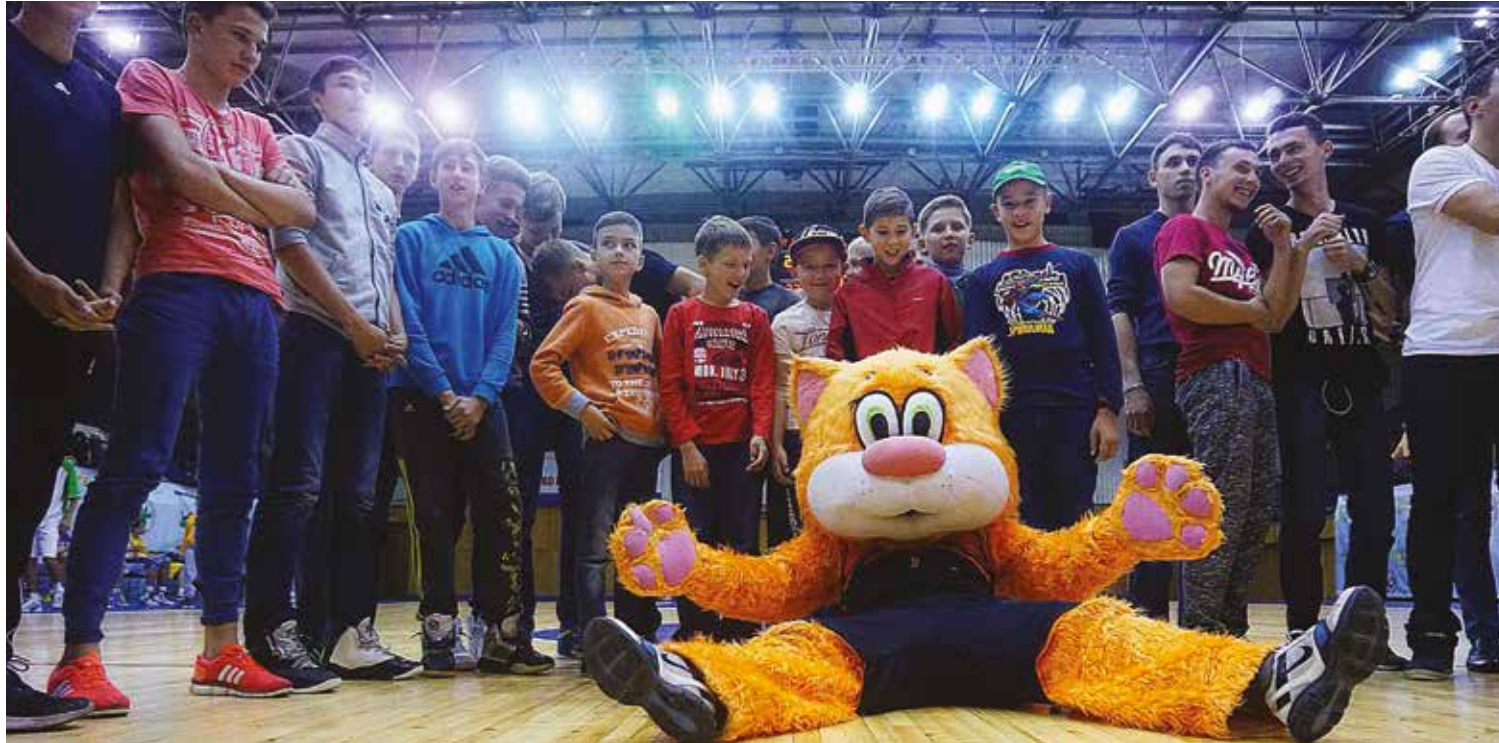
Кот Феликс — любимец иркутских болельщиков, а особой популярностью он пользуется у детей. С рыжим котом любая игра превращается в праздник!