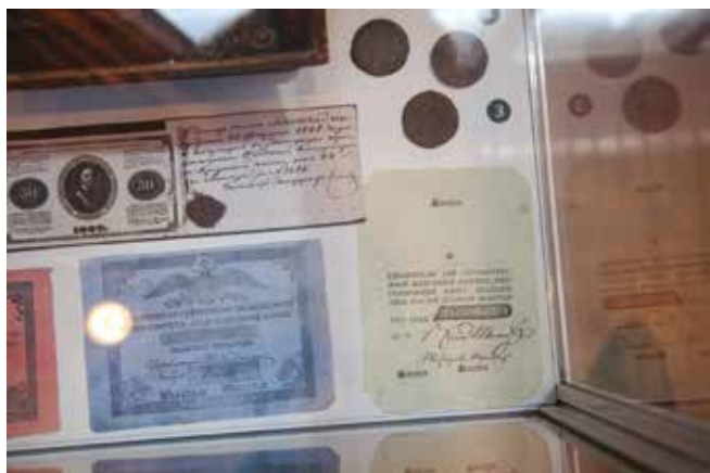
В 1769 году была предпринята первая попытка ввести в России бумажные деньги. Ассигнация получилась крупной, выполнена она была на простой бумаге, что повлекло много подделок. Она так и не прижилась в России