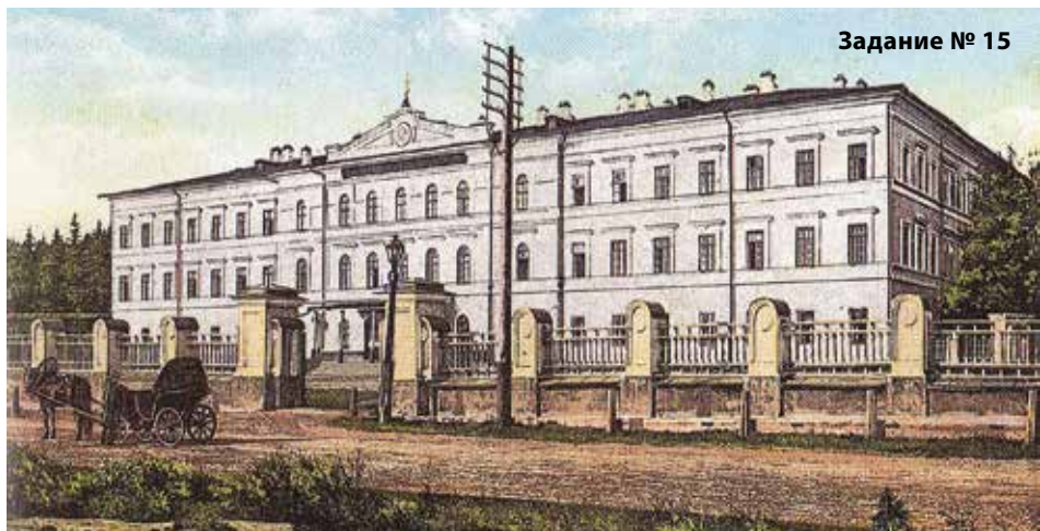
Задание № 15

Иллюстрации из книги Сергея Медведева «Иркутск на почтовых открытках 1899–1917».