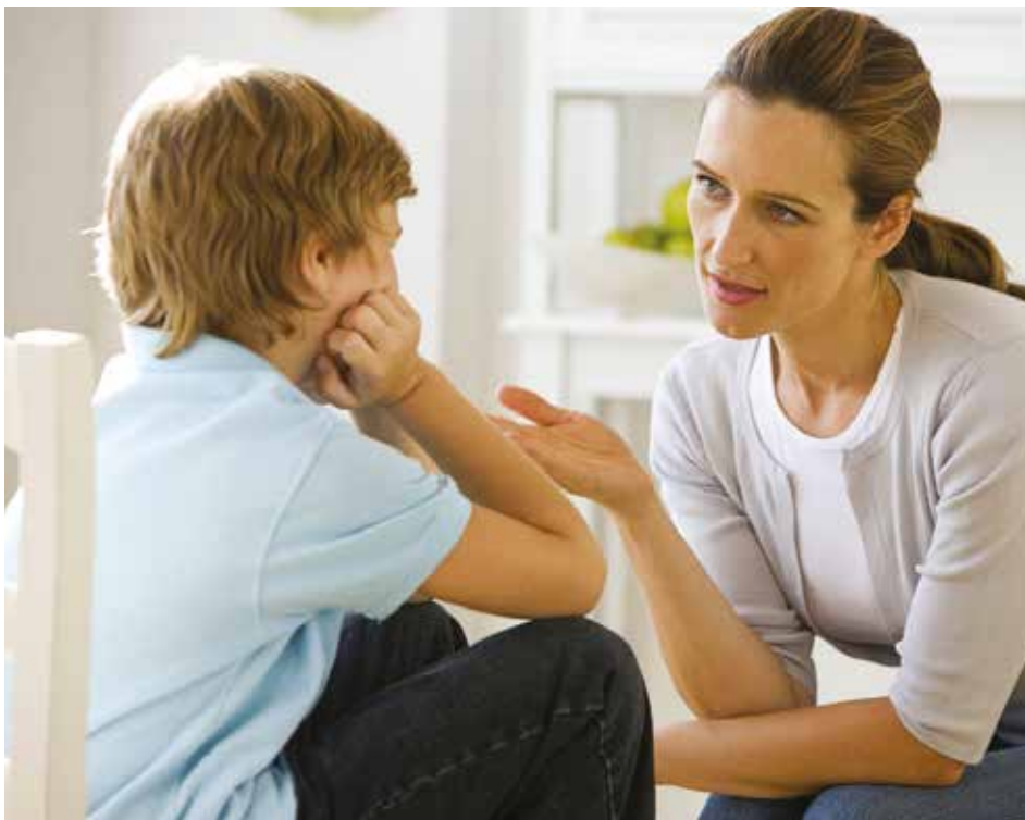
В конфликте между учителем и учеником очень важно, чтобы педагог проявил мудрость и выдержанность

Многим педагогам тяжело найти индивидуальный подход к каждо-