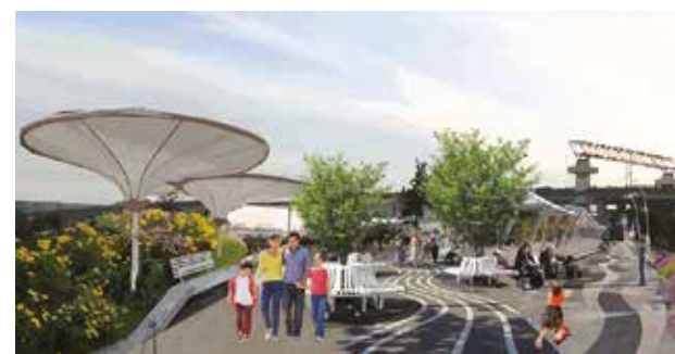
Красивый пешеходный бульвар соединит между собой все острова. Новое общественное пространство будет закрыто для движения транспорта