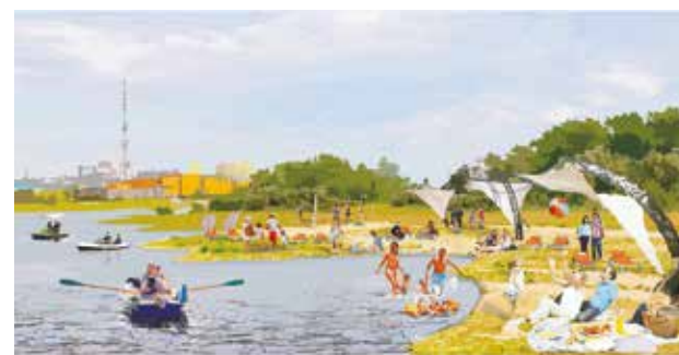
По задумке разработчиков проекта, здесь может появиться городской благоустроенный пляж, который станет излюбленным местом отдыха горожан