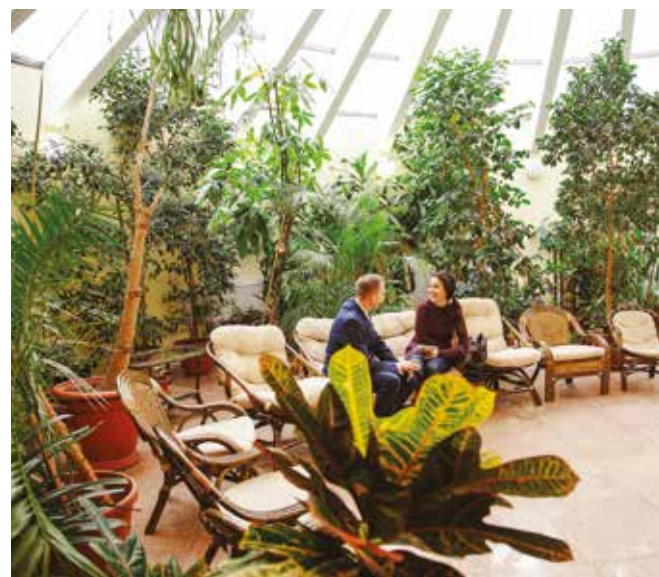
Под крышей здания находится зимний сад, в котором сотрудники могут отдохнуть во время обеденного перерыва