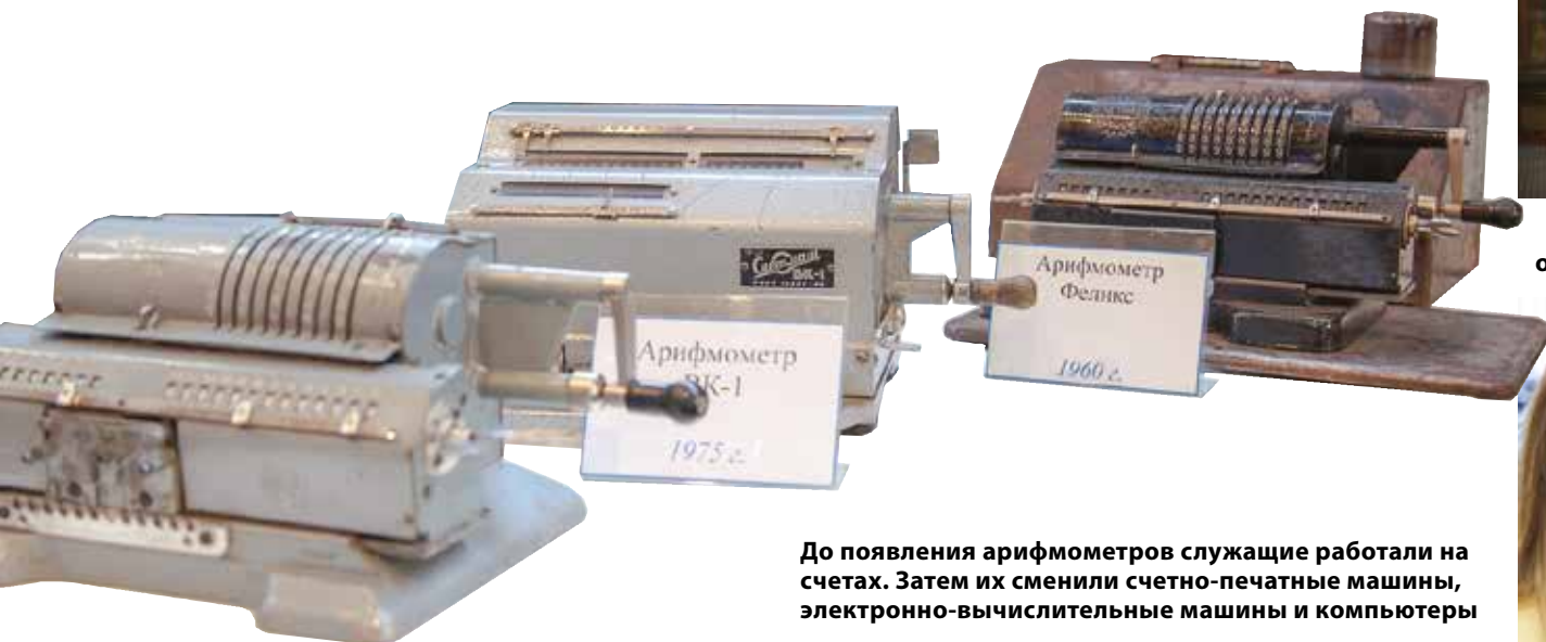
До появления арифмометров служащие работали на счетах. Затем их сменили счетно-печатные машины, электронно-вычислительные машины и компьютеры