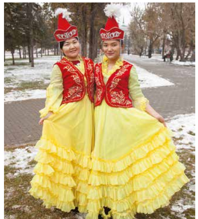
По-киргизски «единство» звучит как «биримдик», говорят участницы концерта

— У нас в Сибири живут удивительно дружные люди, — говорит представитель татаро-баш-