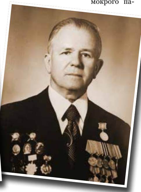
«Как я выжил? Не прятался за чужие спины, ел из одного котелка со своими солдатами и спал с ними в одном окопе»