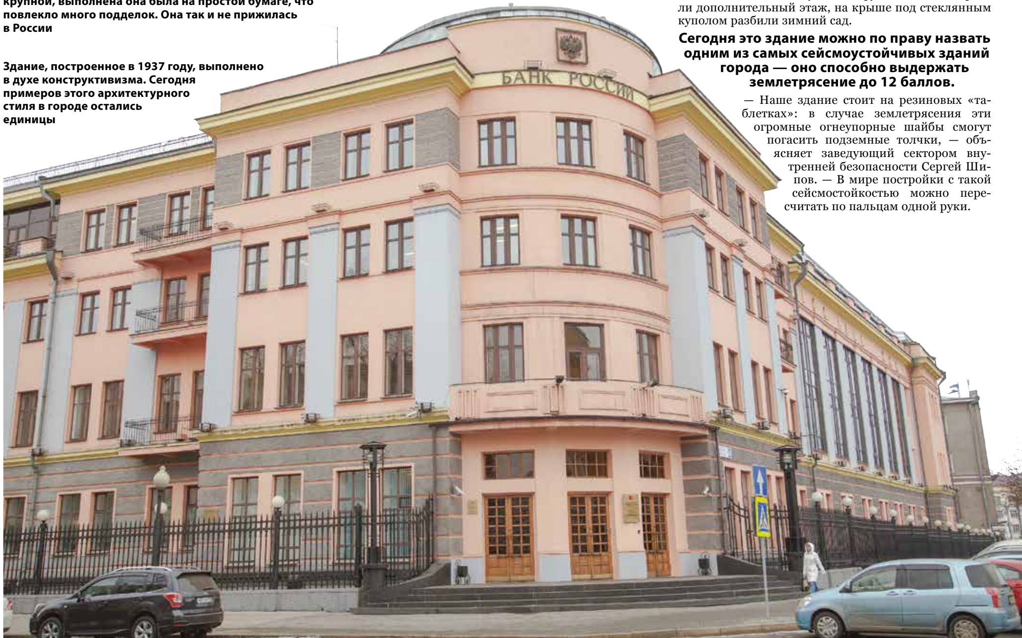
Здание, построенное в 1937 году, выполнено в духе конструктивизма. Сегодня примеров этого архитектурного стиля в городе остались единицы