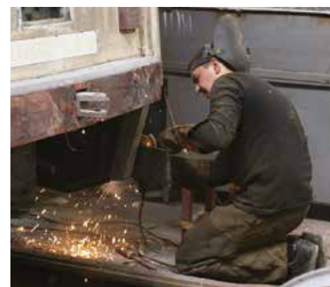
Трамваи, прошедшие капремонт, выходят на линии полностью обновленными