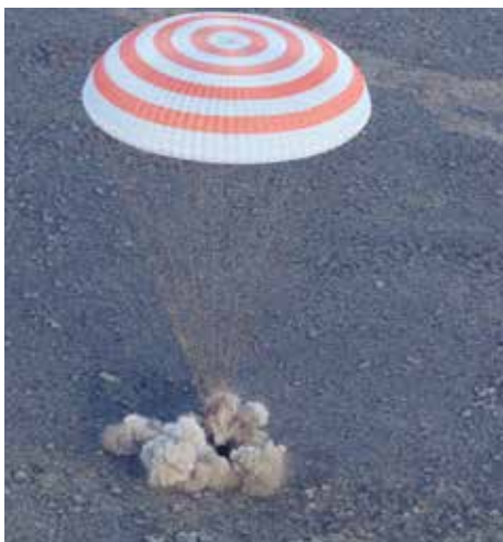
Каждый космический корабль — одноразовый. Он обгорает еще при спуске из космоса, а затем ударяется о землю. Приземление смягчает парашют, который раскрывается на высоте 10 километров