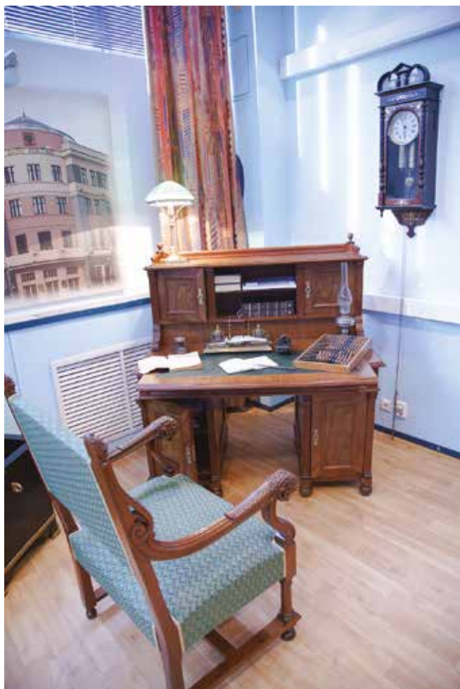
Воссозданный кабинет управляющего на стыке XIX и XX веков. Все детали интерьера оригинальные