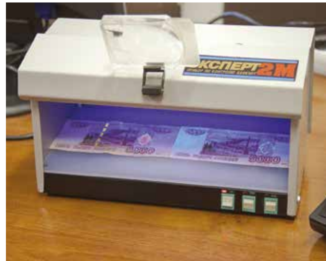
В ультрафиолетовых лучах специалисту легко различить фальшивые и настоящие купюры