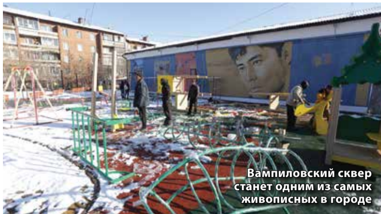
Вампиловский сквер станет одним из самых живописных в городе