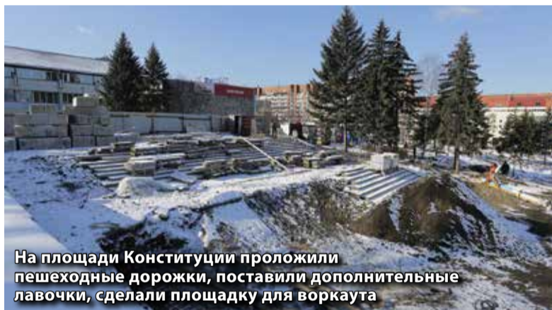
На площади Конституции проложили пешеходные дорожки, поставили дополнительные лавочки, сделали площадку для воркаута

сквер на пересечении Чкалова и Степана Разина, известный иркутянам как «шайба» (ранее там располагалась стена с надписью «Кировский район»). Здесь установили фонтан, лавочки, выполнили озеленение. В апреле следующего года фонтан «оживет». А пока на зиму оборудование демонтируют.