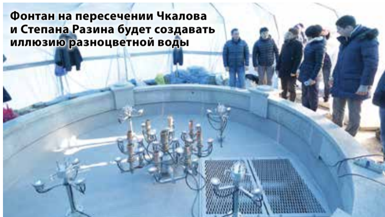
Фонтан на пересечении Чкалова и Степана Разина будет создавать иллюзию разноцветной воды