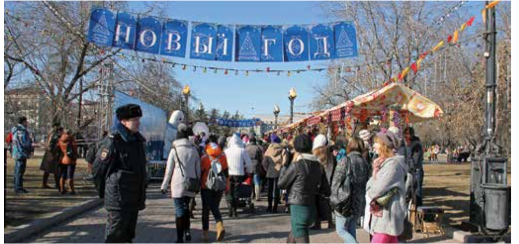
В марте 2015 году на сквере им. Кирова снимали новогоднюю сцену фильма «Млечный путь». Ради этого иркутянам вновь пришлось достать шубы и шапки