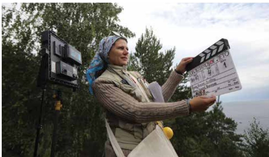
А нынешним летом на Байкале снимали кинокартину «Облепиховое лето», посвященную жизни и творчеству драматурга Александра Вампилова

В нашем городе уникальная кинематографическая энергия. Приангарье — единственный регион России, где есть областной кинофонд — государственная структура, занимающаяся развитием производства и прокатом кино. Наша территория — единственная за Уралом, где есть филиал ВГИКа. У нас проходит и