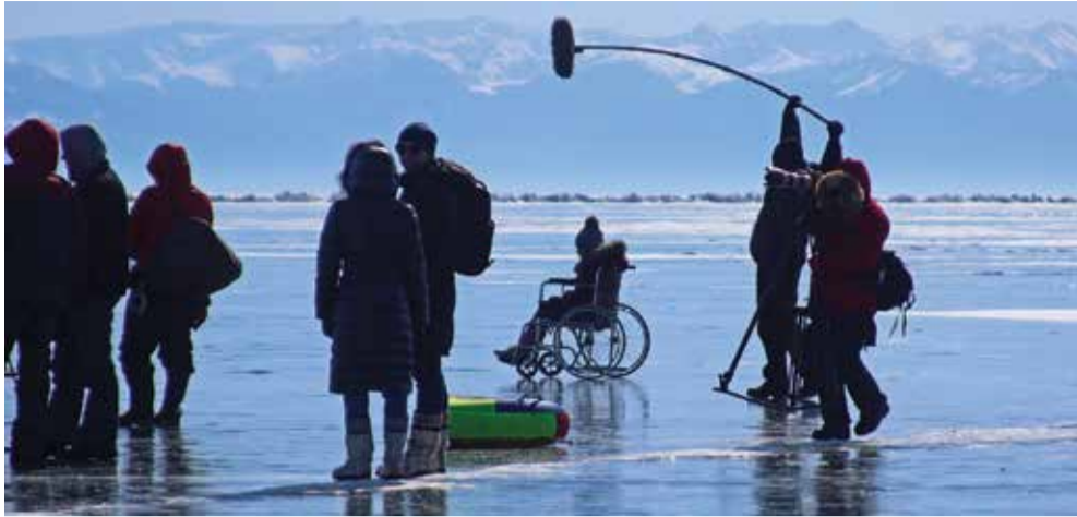
Съемки фильма «Лед» проходили на Байкале и в микрорайоне Университетском. Премьера фильма намечена на февраль 2018 года