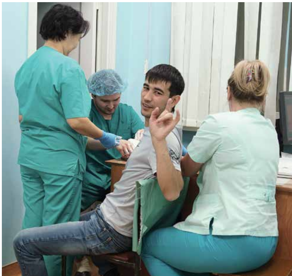
Этот пациент, пока ему вправляли вывих, веселился как мог — чтобы отвлечься от болевых ощущений. И даже попросил сфотографировать его на память

После недолгих причитаний парень сдался. Из-за укола боль немного отпустила, и началось основное действие — медики стали вправлять «вылетевшие» пальцы на место и гипсовать руку. Медсестра крепко держит его за плечи, тот вырывается, дергает ногой.