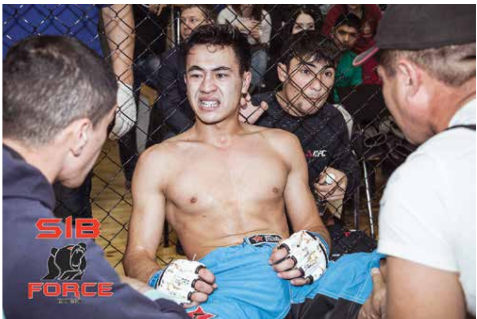
Несмотря на то что мероприятие официально именовалось кастингом, турнир можно смело назвать вечером профессиональных боев. Бойцы, тренеры и секунданты отнеслись к отбору очень серьезно

шел на болевой, уже силы в руках пропадали, но чувствовал, что соперник близок к сдаче, и решил дотянуть.