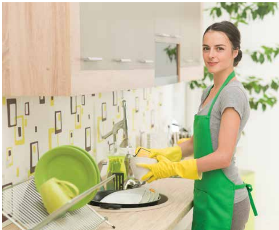
Исходя из новой инициативы, женщина-домохозяйка — тоже тунеядец, хотя она может быть с утра до вечера загружена работой по дому или уходом за детьми

Первая — люди, живущие на проценты от банковских счетов, дивиденды от акций или от ренты жилья. Брать с них некий платеж вместо по-