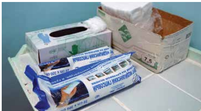
Гипс хранится в индивидуальной упаковке. В зависимости от вида травмы отрезается кусок нужного размера и закрепляется на поврежденной ноге или руке

— Да он просто улолов боится, — объясняет девушка, подходя к нему, чтобы обнять.