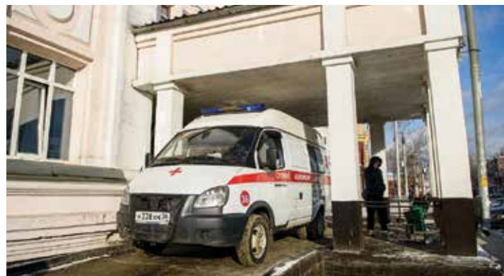
Травмпункт выполняет функцию сортировки больных. Если у обратившегося человека травмы крайне тяжелые, то его отправляют в другие медучреждения по профилю