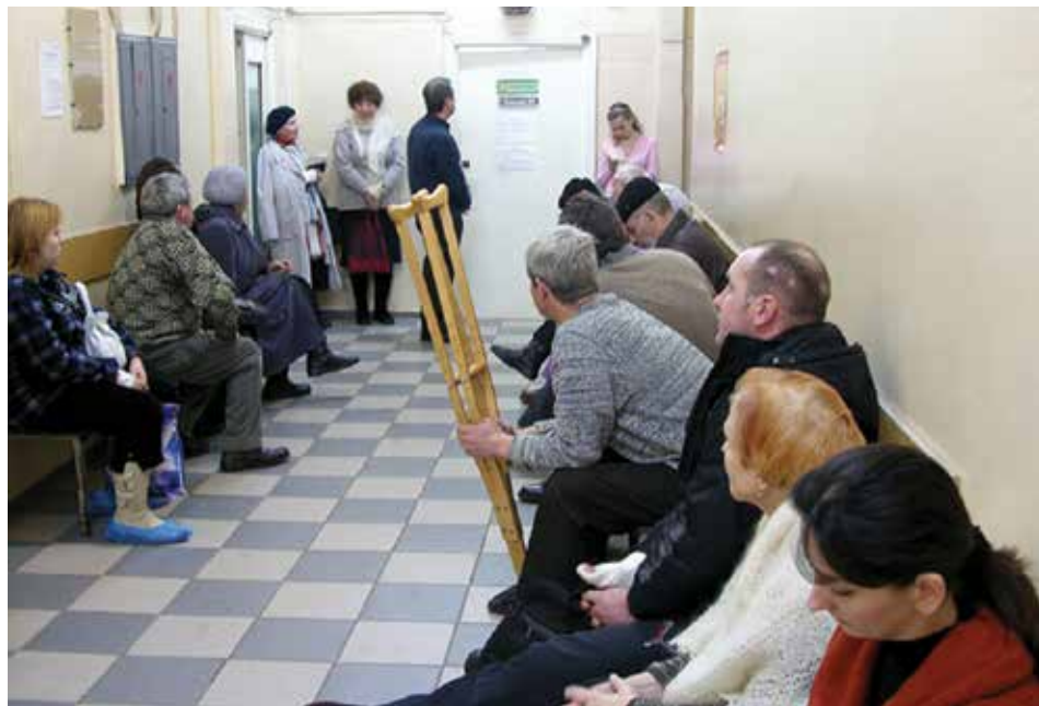
Кого только не встретишь в этом коридоре! Многие посетители обращаются сюда уже не первый раз и знают всех сотрудников в лицо

Пожелание не сработало. Но обо всем по порядку.