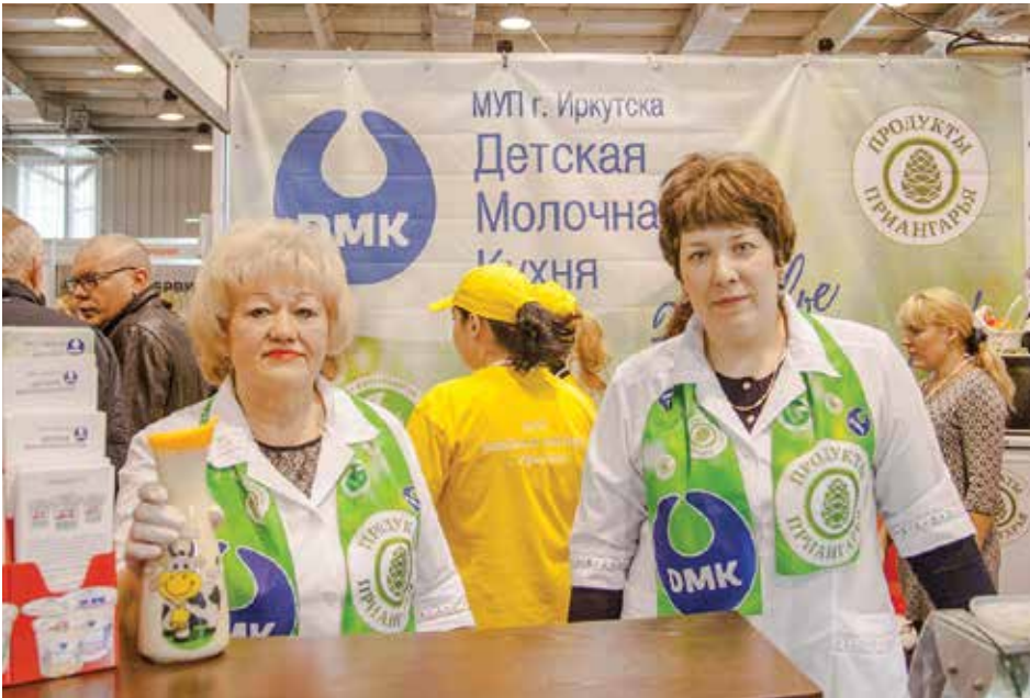
Иркутское муниципальное предприятие «Детская молочная кухня» получило золотую медаль выставки за свой диетический продукт — козье молоко