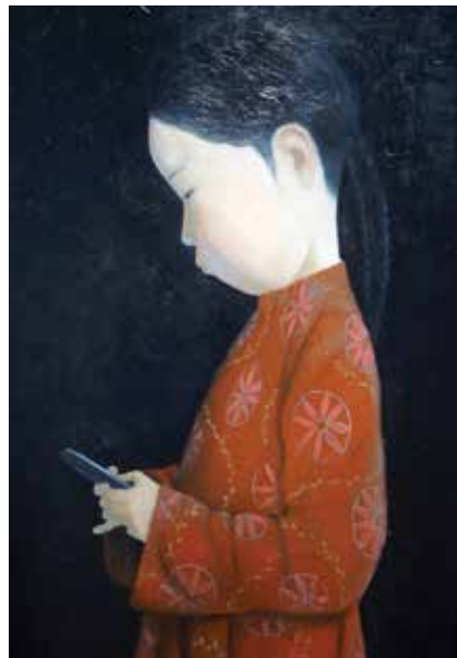
У картин «Волшебник» и «Angry Birds» существуют скульптурные копии