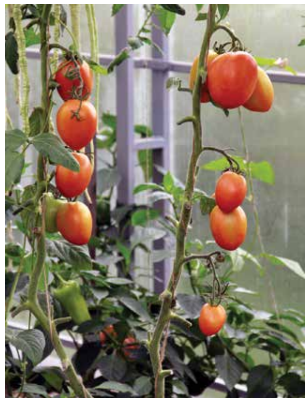
Рассаду томатов высаживают на расстоянии 30–50 см друг от друга и формируют растение в один ствол

те в лунку ложечку ОМУ-универсал, перемешайте с землей и полейте теплой водой.