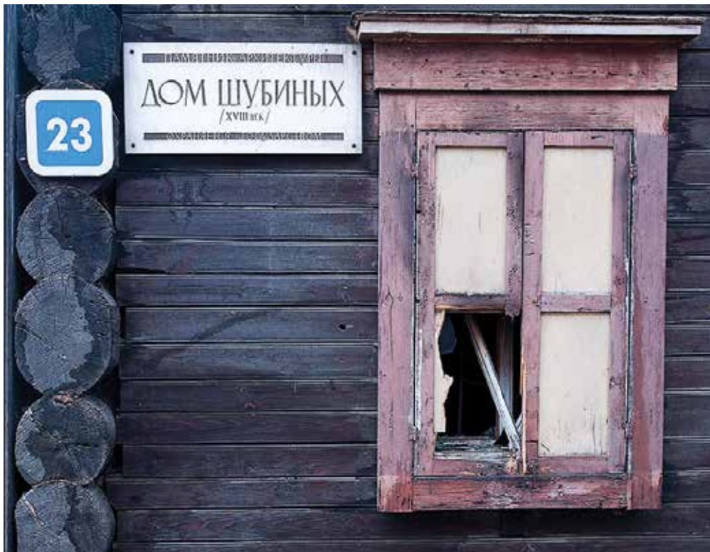
Памятник федерального значения Дом Шубиных пережил нелегкие времена. За последние десятилетия он горел шесть раз, но выстоял и дождался реконструкции