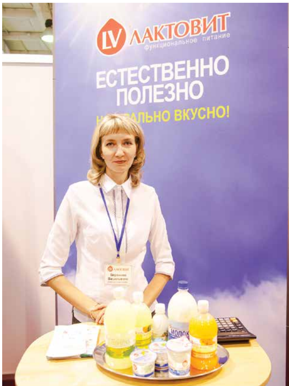
Марка «Лактовит» хорошо известна иркутянам. За свою продукцию фирма была отмечена золотой, серебряной медалями и дипломом

Алексей Буренин