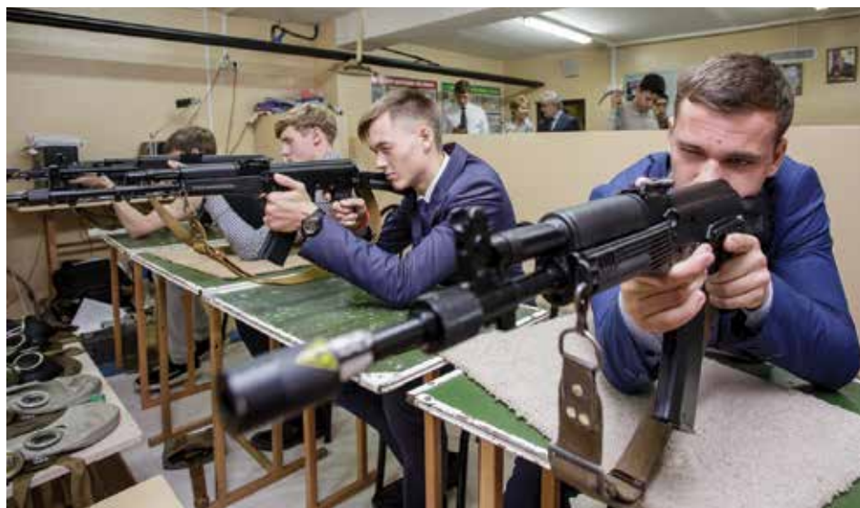
Кабинет допризывной подготовки в иркутской школе № 14 отличается редкой оснащённостью современным тренировочным снаряжением