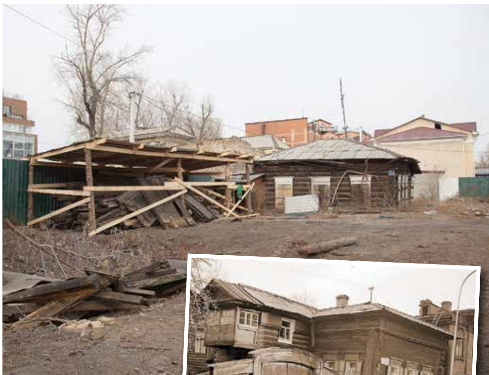
Еще недавно на этом месте стоял полуразрушенный особняк. Сейчас его полностью разобрали, сохранившиеся бревна пронумеровали и убрали под навес