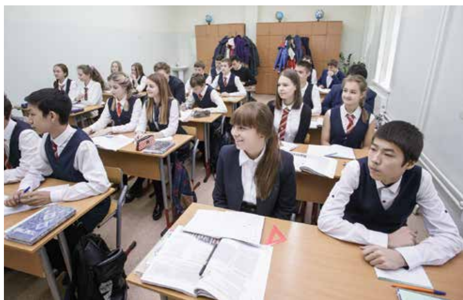
В школе № 72 созданы все условия для качественного получения образования. Ребята, переведенные сюда из школы № 9, обеспечены всем необходимым

В 2010 году здесь проведен капитальный ремонт. Вместо старого, расположенного в полуподвальном по-