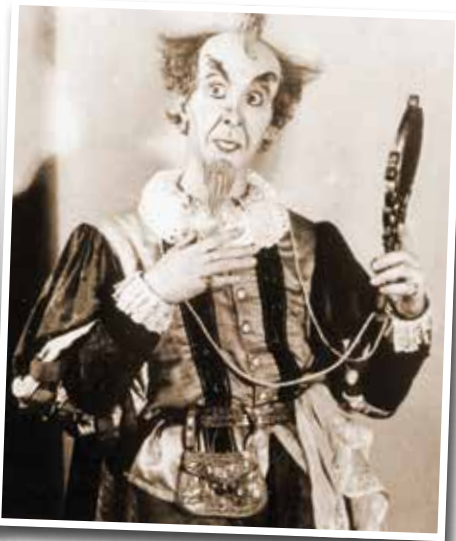
Образы, воплощенные актером в юности: Лаэрт в спектакле «Гамлет» (1950-е годы) и Исаак Мендоса в спектакле «Дуэнья» (1955 год)