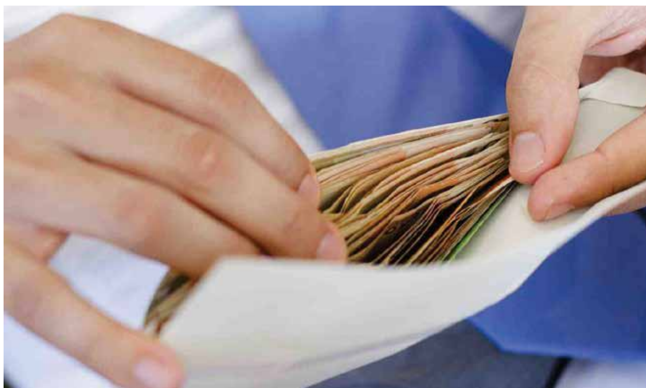
В городе постоянно проводится серьезная работа по легализации трудовых отношений и заработной платы

Тем работодателям, в организациях которых выявляется скрытая занятость, предлагается устранить нарушения трудового законодательства в добровольном порядке. Если этого не происходит, информация направляется в прокуратуру или Государственную инспекцию труда Иркутской области для принятия соответствующих мер. Последняя проводит соответствующие проверки в этих организациях. Так, по результатам проверок в 2016 году с 77 работниками заключены тру-