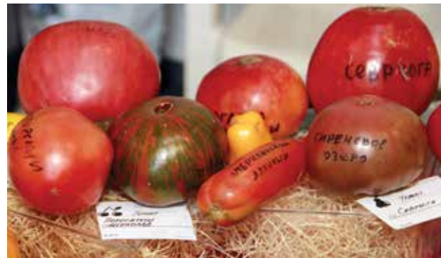
Вот такие разные помидоры получаются у членов клуба имени А. Томсона каждый год

Уже при пересадке в землю на участке надо обязательно обезвредить почву с помощью «Фитокфлоры С» или «Флоры С». Перед высадкой добавь-