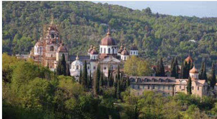
Плоды благотворительности Иннокентия Михайловича поражают воображение: иркутский драматический театр, храм Казанской иконы Божией Матери и Собор Святого Андрея Первозванного на Афоне