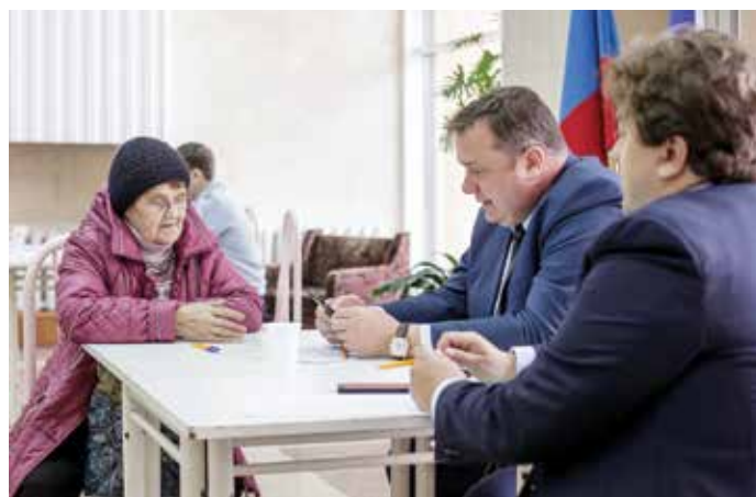
Многие вопросы отсеялись уже на стадии записи. Их перед самым приемом решили руководители комитетов и департаментов мэрии