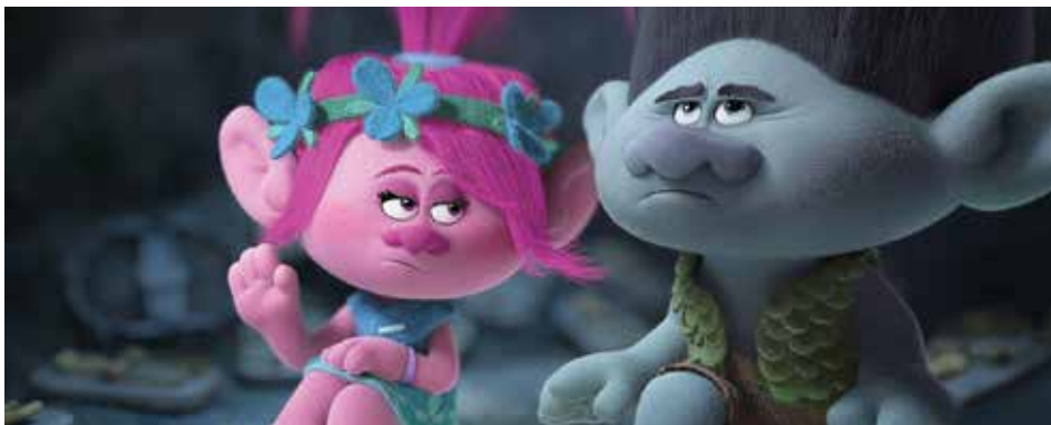
Кадр из фильма «Тролли» (6+)

«Дом странных детей мисс Перегрин» 3D (16+) «МУЛЬТ в кино. Выпуск №38» (0+) «Ледокол» (12+) «Инферно» (16+) «Джек Ричер — 2: Никогда не возвращайся» (16+) «Доктор Стрэндж» 3D (16+) «Новая Эра Z» (16+) «Коллектор» (16+)