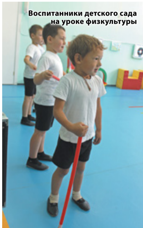
Воспитанники детского сада на уроке физкультуры