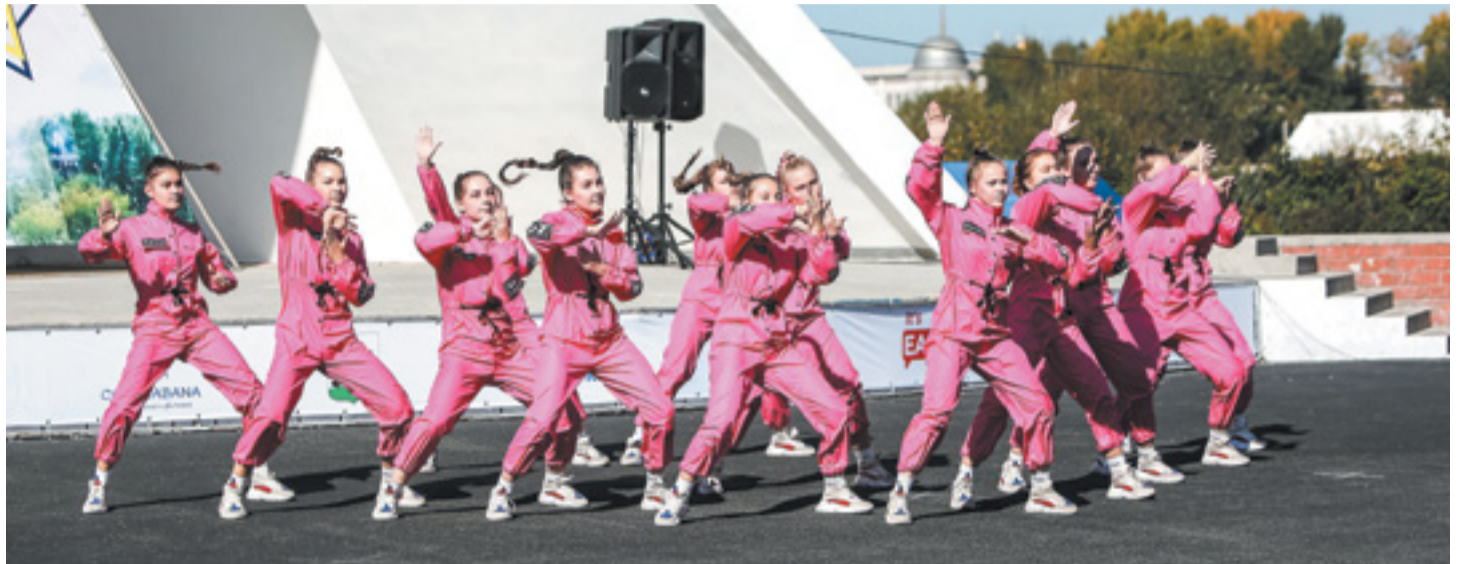
Лучшие танцевальные и вокальные коллективы Иркутска выступили с творческими номерами

Заключительный концерт «Городской площади талантов» прошел в Иркутске 21 сентября