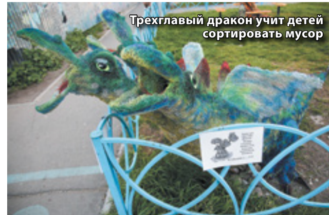
Трехглавый дракон учит детей сортировать мусор