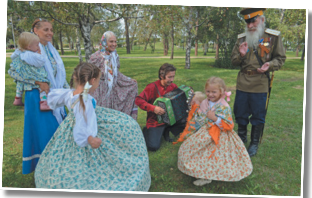
Семейный ансамбль во время одного из выступлений