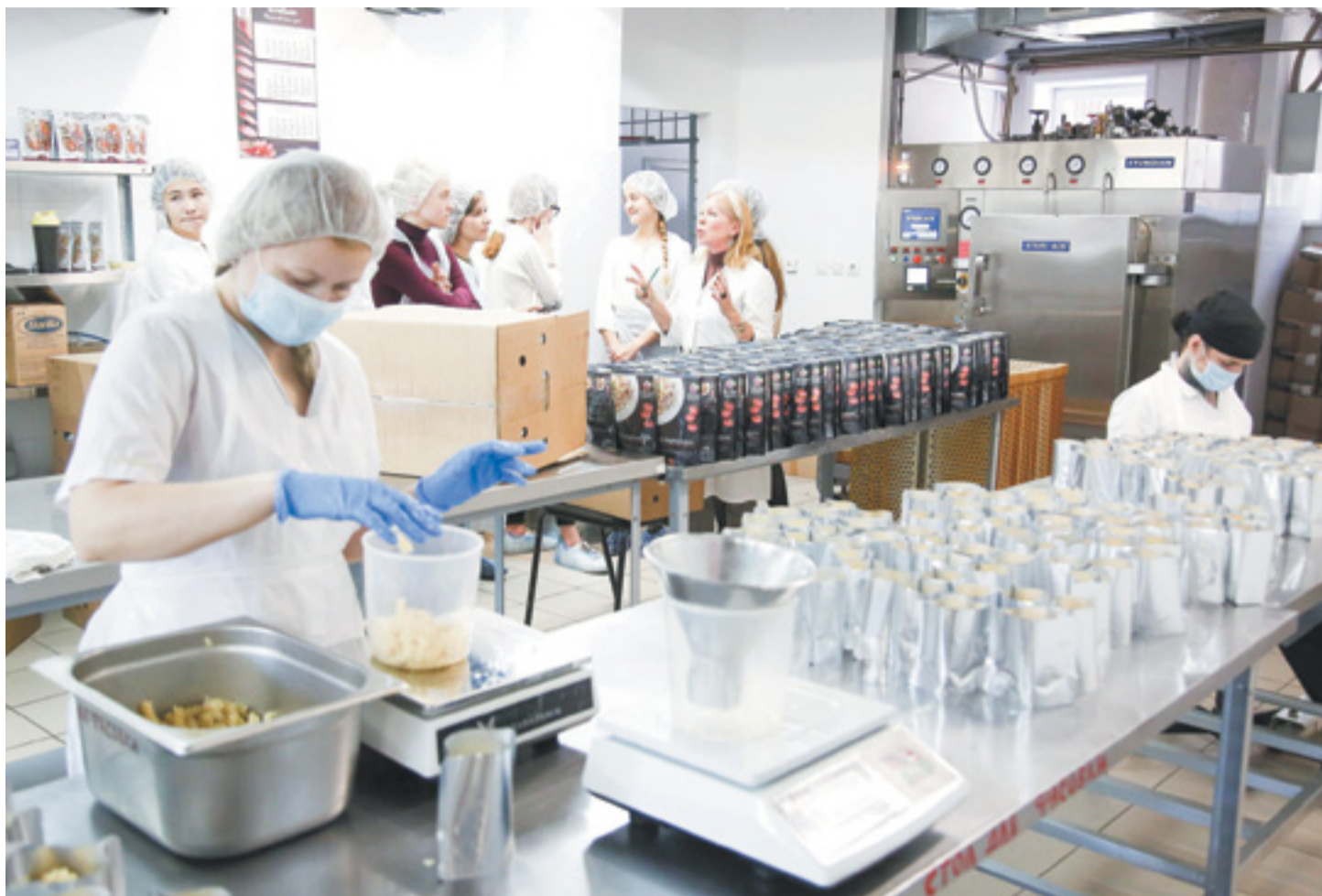
Девятиклассницы из лицея № 3 побывали на Фабрике здоровой еды. Школьницам показали кухню, рассказали о процессе приготовления продукции

Иркутских школьников знакомят с малыми предприятиями города