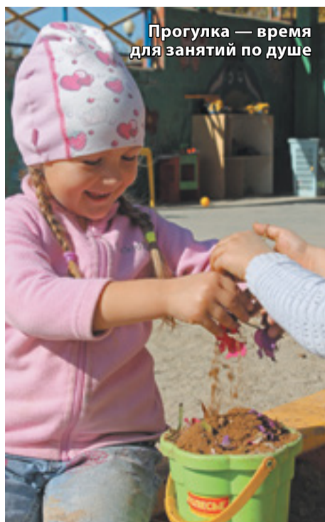
Прогулка — время для занятий по душе