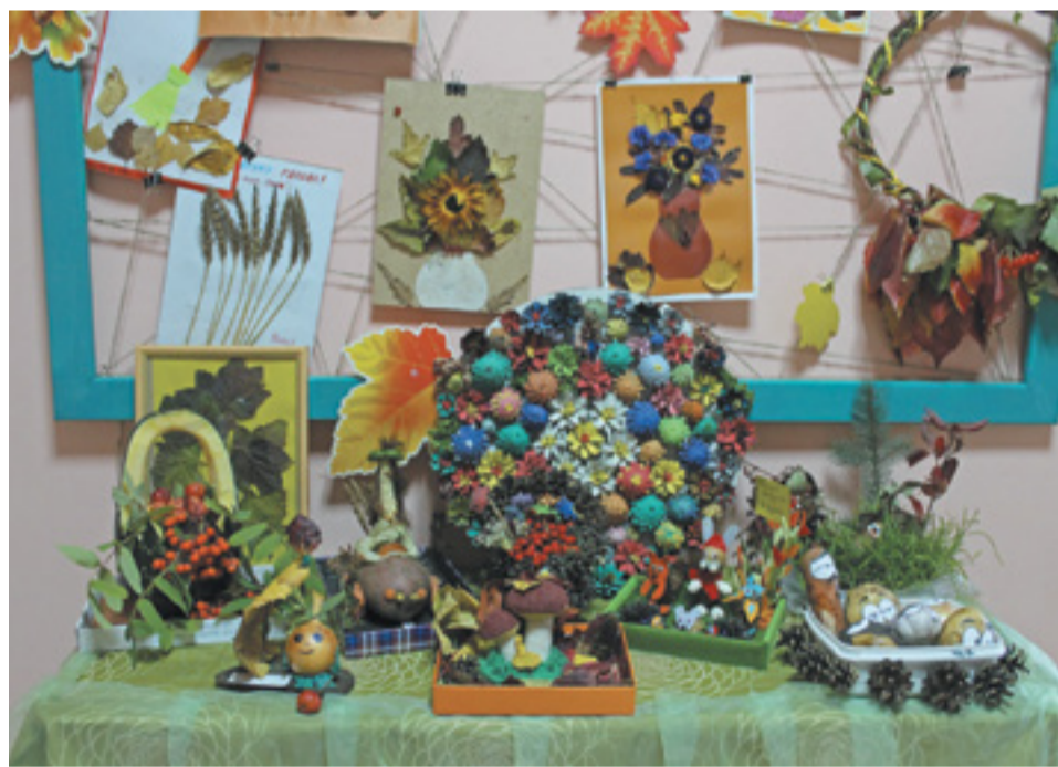
Тематическая выставка работ воспитанников