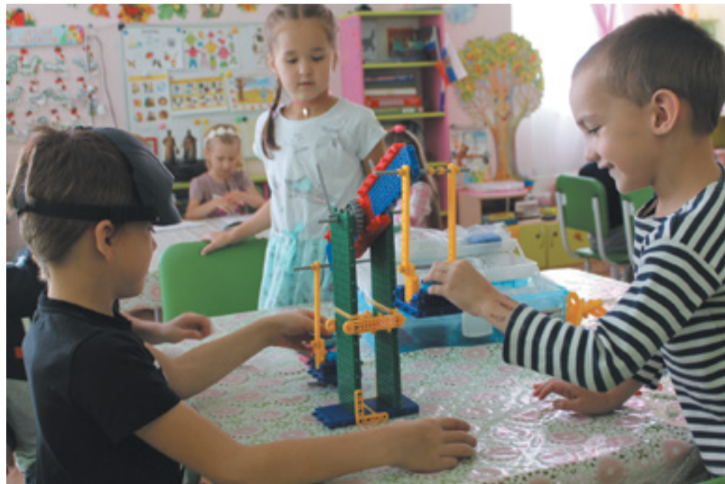
Ребята из группы № 2 делают весы, чтобы взвешивать на них урожай