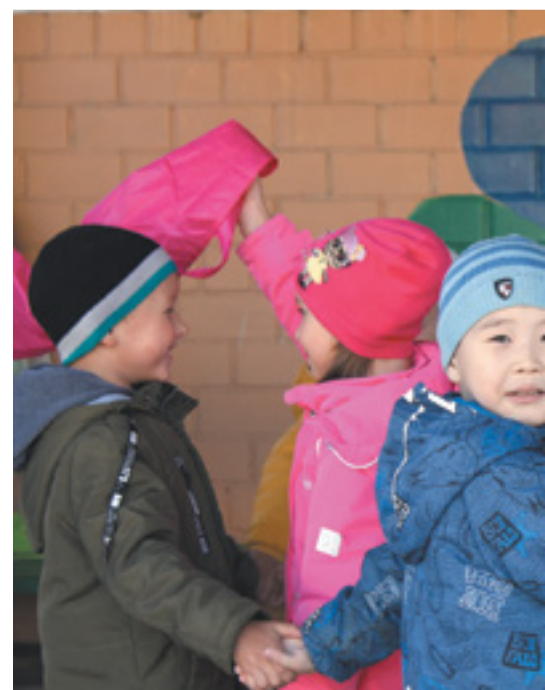
Групповые игры на свежем воздухе

дисциплин, что положительно скажется на их успеваемости и развитии личных инженерных навыков.