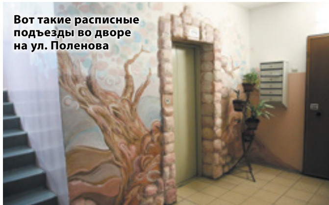
Вот такие расписные подъезды во дворе на ул. Поленова