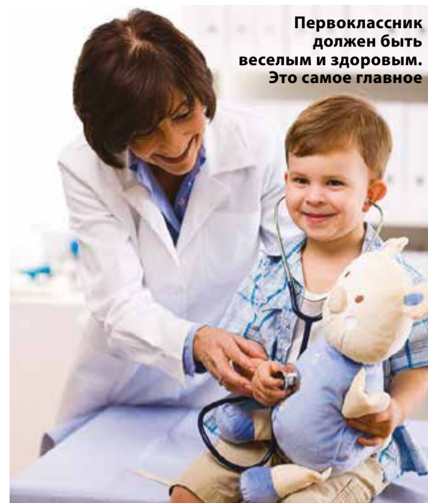
Первоклассник должен быть веселым и здоровым. Это самое главное

Во многих иркутских детских садах сейчас родителям помогают и вовсе избежать хождений по поликлиникам. По словам нескольких опрошенных газетой «Иркутск» родителей, в подготовительные группы приходят педиатры и специалисты из соседней поликлиники, которые