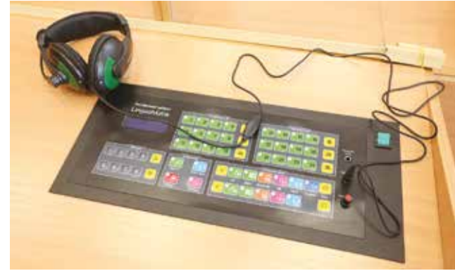
Таковыми устройствами оснащен каждый рабочий стол в лингафонном кабинете начальной школы № 66