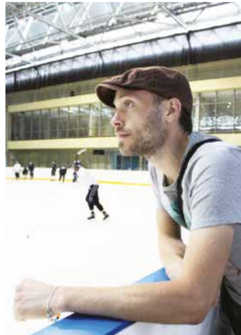
Для режиссера Юрия Яшников — снимать фильм о «Байкал-Энергии» — большая честь и возможность узнать больше об иркутском хоккее с мячом