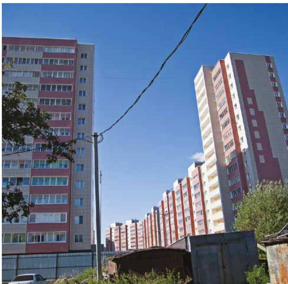
Застройщик с самого начала понимал отсутствие перспективы работ на данной территории. Но несмотря на это сегодня он все же предлагает включить землю в зону жилой застройки

— Новый жилой комплекс и оставшиеся аварийные дома входят в одну зону развития застроенных территорий улицы Пискунова. При подписании договора на выделение земли было строго обозначено место, где можно вести строительство. Сегодня здесь возведен ЖК «Высота», при этом дома № 125а, 129а, 131а, 131б, 133а, 133б, 135а снесены, а их жители расселены. Земля под домами № 125, 127, 129, 131, 133, 135, 137, 139, 141 находится в границах красных линий, согласно генплану города является