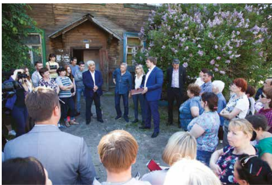
Очередной вариант строительства предполагает перенос красных линий, что, по мнению депутатов, представителей власти, строителей и архитекторов, невозможно

частью транспортной схемы по расширению улицы Пискунова, соответственно, строительство жилых объектов не предполагает.