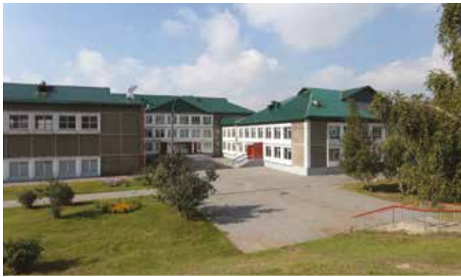
С новой крышей школу № 57 не узнать: она похорошела и помолодела