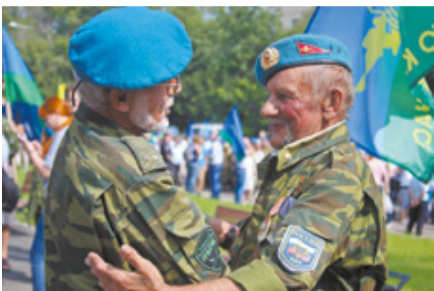
2 августа — день теплых встреч старых друзей

— Бывших десантников не бывает, — рассказывает он о себе. — Я старший сержант ВДВ 11-й бригады. Третий батальон, разведзвезд. Служил в 1994 по 1996 год, призван был в военный городок Сосновый Бор, под Улан-Удэ. Оттуда началось мое путешествие по России.