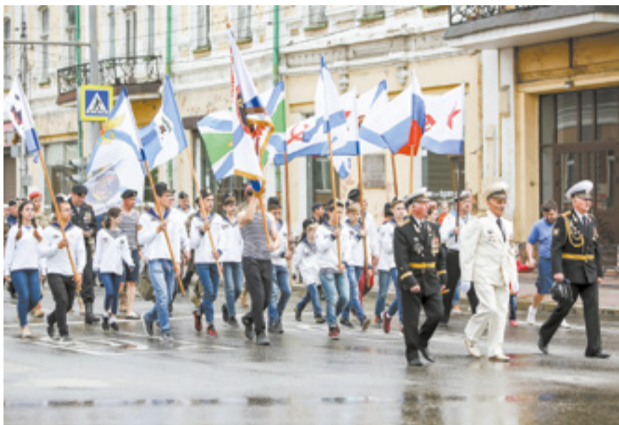
Торжественная колонна под андреевскими флагами прошла по центру города