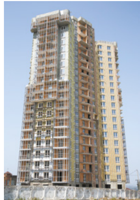
В городе вырастают новые жилые комплексы, причем многоэтажные дома разного класса возводят абсолютно во всех районах города

Были проведены масштабные исторические исследования. Например, уличные фонари подбирали по