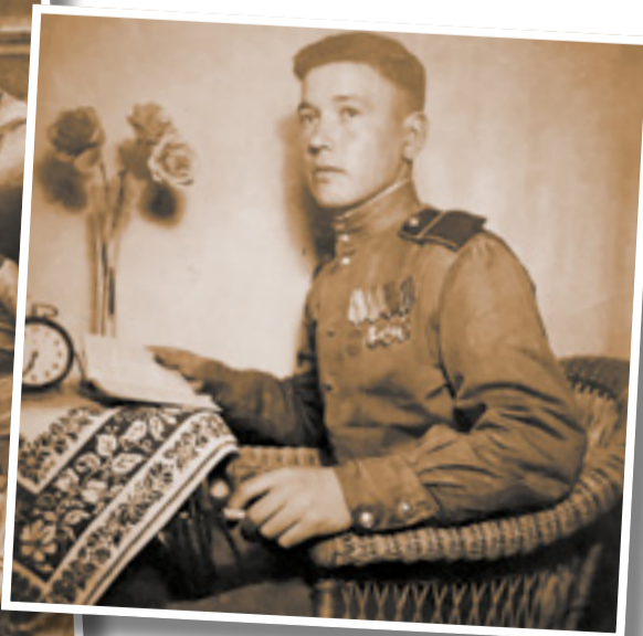
Германия, 1945 год