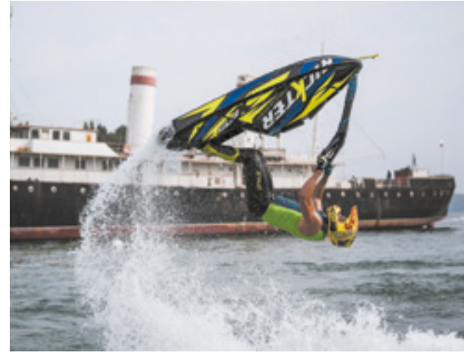
Иркутяне смогли увидеть захватывающие трюки на гидроциклах и флайбордах