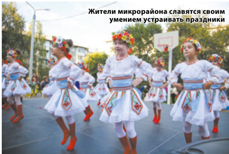
Жители микрорайона славятся своим умением устраивать праздники

Первые жилые дома здесь построили в 1979 году. Ввод в эксплуатацию состоялся накануне первомайских праздников, поэтому микрорай-