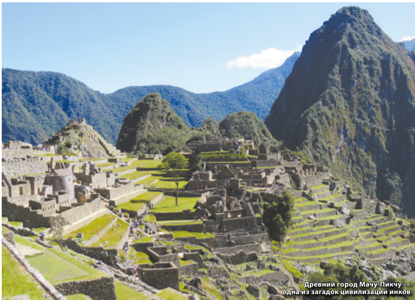
Древний город Мачу-Пикчу — одна из загадок цивилизации инков