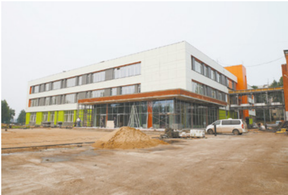
Один из масштабных городских проектов — строительство нового полноценного блока гимназии № 25 на 500 учеников