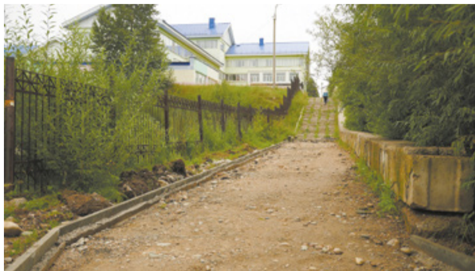
Площадь благоустройства — почти 800 квадратных метров. Здесь заасфальтируют пешеходную зону, установят новые опоры освещения, отремонтируют мост и обновят лестницу, ведущую к школе

— Будут установлены и малые архитектурные формы. Для этого про-