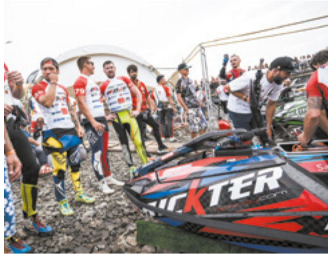
В соревнованиях приняли участие именитые спортсмены, чемпионы мира и рекордсмены Книги рекордов Гиннеса