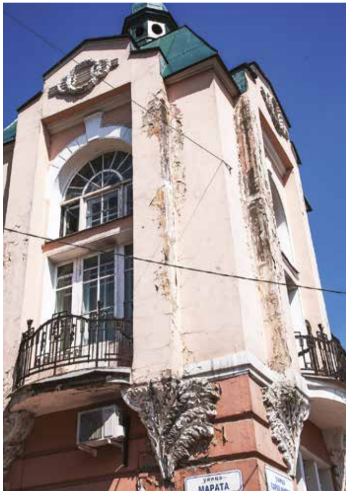
Фасад бывшего Русско-Азиатского банка явно находится в плачевном виде

Через три квартала по этой улице, на углу с Киевской, можно обнаружить грязный, облупившийся фасад