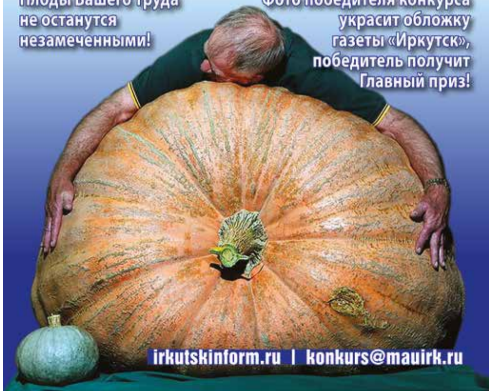
Фото победителя конкурса украсит обложку газеты «Иркутск», победитель получит Главный приз!

Плоды Вашего труда не останутся незамеченными!