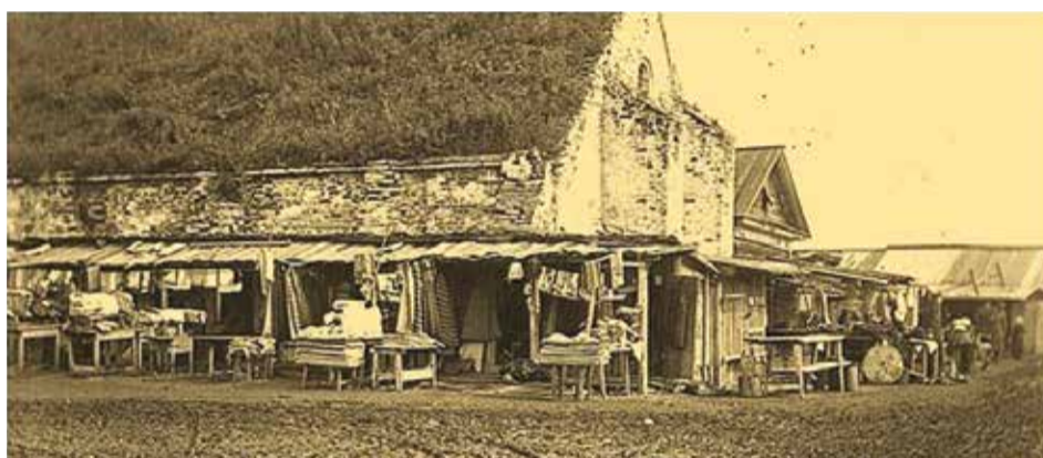
Так выглядел пороховой погреб на улице Арсенальской, здание окончательно разобрали при советской власти