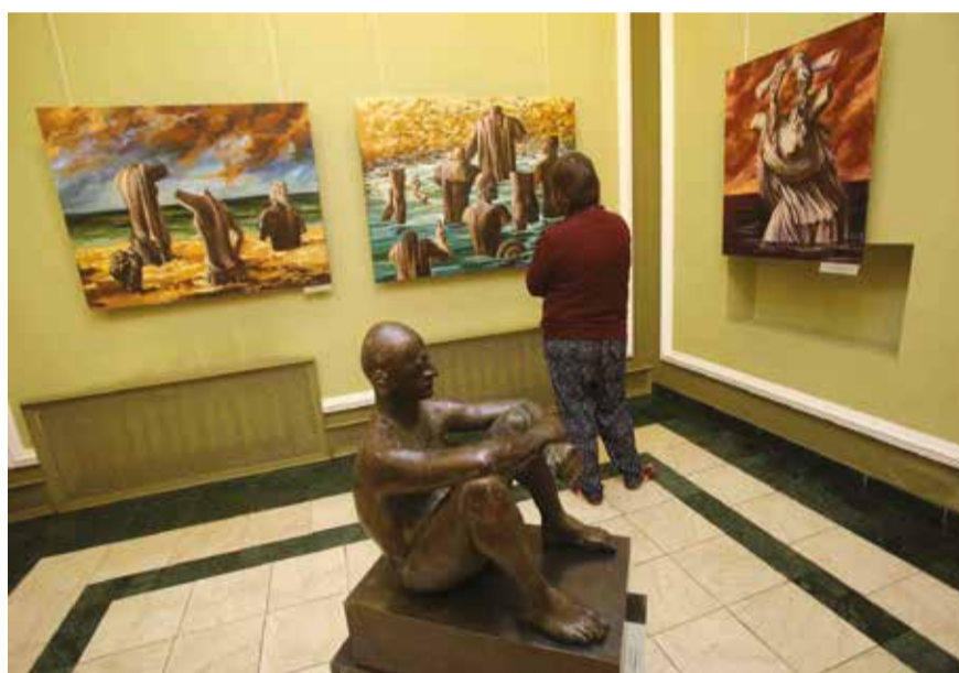
Уголок сюрреализма среди реалистических произведений