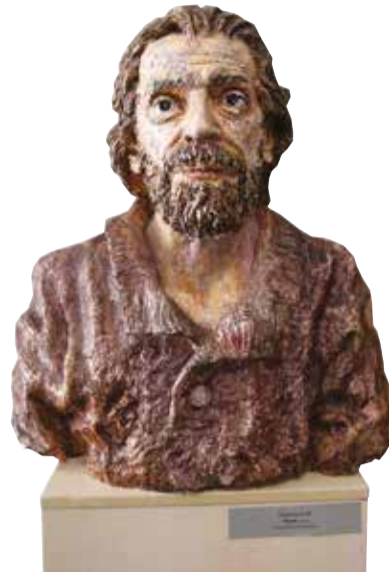
Впервые в Иркутске можно увидеть работы известного скульптора Леонида Баранова