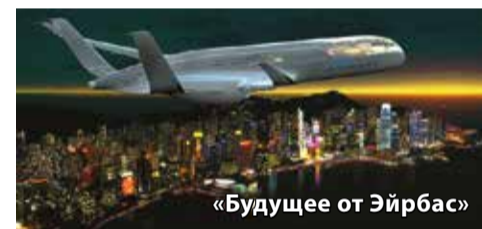
«Будущее от Эйрбас»

Постоянно действующие экспозиции о героическом прошлом земляков XIX— XX вв. Уроки мужества (по заявкам). Костюмированные экскурсии (по заявкам) (6+)