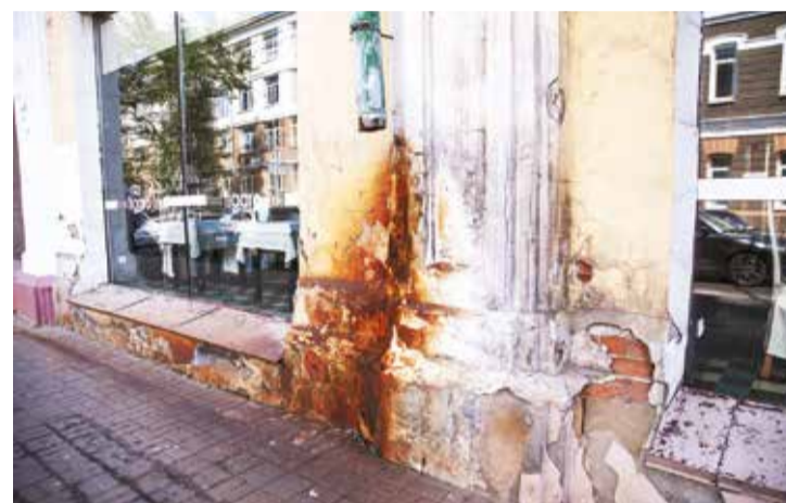
Здание гостиницы «Централь» за последние годы потеряло былой лоск

гичного здания, не являющегося памятником.