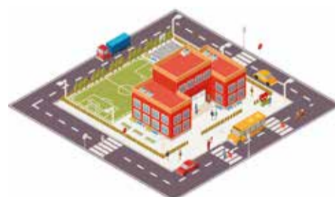
Школа № 19 на 1125 мест с планетарием

Детский сад на ул. Зимней на 350 мест Детский сад на ул. Байкальской на 140 мест Детский сад на ст. Батарейная на 140 мест