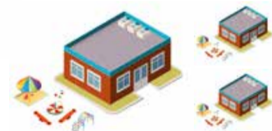
ФОК на бульваре Рябикова

Детский сад на ул. Зимней на 350 мест Детский сад на ул. Байкальской на 140 мест Детский сад на ст. Батарейная на 140 мест