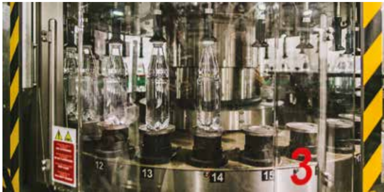
На заводе Baikalsea Company выпускают известную всем воду «Иркутскую»