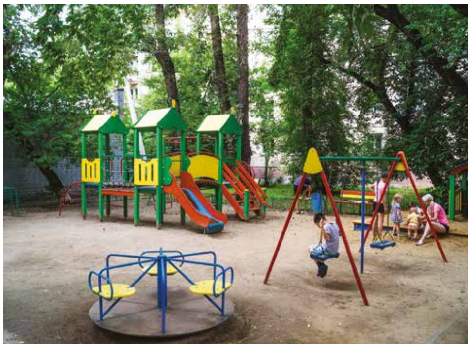
Более 18 млн рублей выделено из городской казны, чтобы оборудовать дворы детскими и спортивными площадками