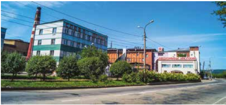
Одна из причин закрытия мясокомбината — непростые условия на российском рынке продовольствия, нестабильность политической и экономической ситуации в стране