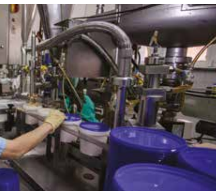
...м не только нашего региона