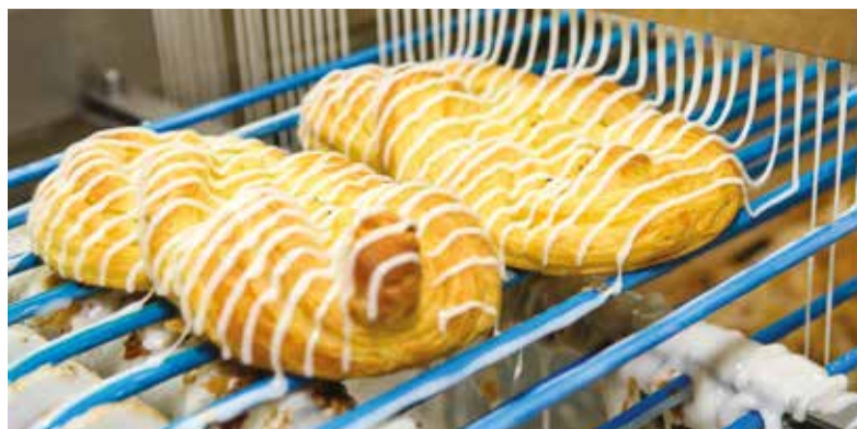
Иркутский хлебозавод выдерживает конкуренцию благодаря высокому качеству своей продукции

В иркутскую группу предприятий «Янта» помимо масложиркомбината и молокозавода входит Ангарская птицефабрика, тепличное и рыбо-водческое хозяйство под Ангарском, четыре животноводческих хозяйства по области и десять сельхозпредприятий в Приамурье. Холдинг имеет 32 представительства, в том числе за рубежом. Продукция холдинга продается по всей Иркутской области, а также далеко за ее пределами. Компания имеет 32 представительства, которые расположены по всей России, а также за рубежом. В частности, товары с фирменным знаком «Янта» представлены в Монголии, Китае, Белоруссии, Казахстане, Таиланде и Японии. Благодаря широкому распространению продукции, «Янта» нарастила выпуск товаров на 17% в 2016 году, несмотря на снижение спроса на внутреннем рынке.