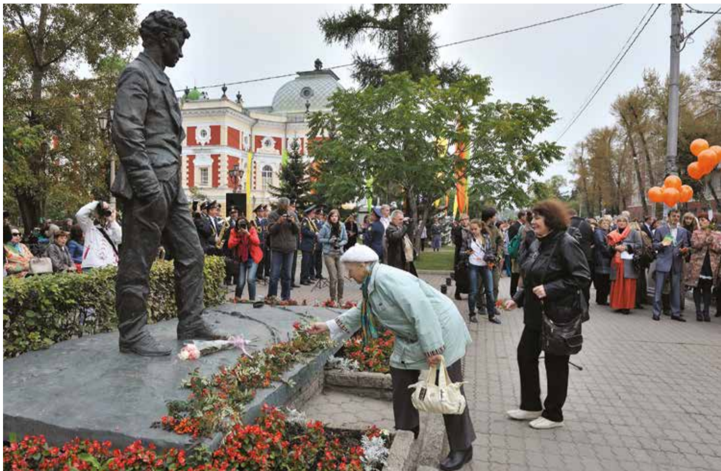
Вампиловский театральный фестиваль — это возможность для иркутских зрителей познакомиться с постановками театров не только из России, но и из Франции, Италии, Монголии, Южной Кореи

Полные юмора парадоксальные истории в спектакле «Провинциальные анекдоты» покажут гости из ближнего зарубежья — Государственный академический русский драматический театр Узбекистана. Постановочная группа этой пьесы Вампилова считает: «Редкий случай,