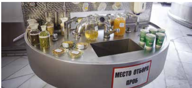
Чтобы сохранить позиции на рынке, производители вынуждены работать при минимальной рентабельности, они не могут поднимать цены, иначе их продукция будет не востребована