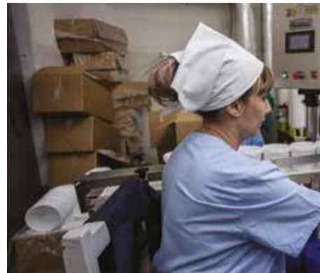
Продукция «Янты» уже стала брендом

М ясокомбинат «Иркутский» остановил производство, не дотянув несколько месяцев до своего 80-летия. Более 350 человек остались без работы, в суде второй месяц идет процесс по банкротству предприятия. Из-за экономического кризиса, падения спроса и агрессивной экспансии федеральных торговых сетей на грани банкротства в Иркутске оказалось не одно пищевое производство. Но несколько продовольственных предприятий и в этих сложнейших условиях умудряются удерживать устойчивые позиции на рынке. О том, как им это удается, газете «Иркутск» рассказали эксперты и сами руководители предприятий.