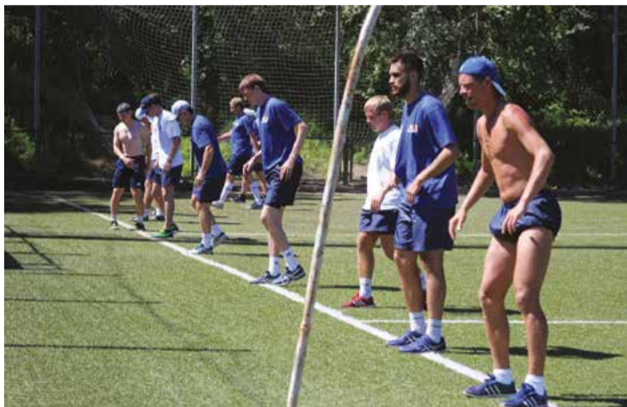
Иркутские хоккеисты уже приступили к тренировкам. Пока они занимаются на стадионе «Рекорд»