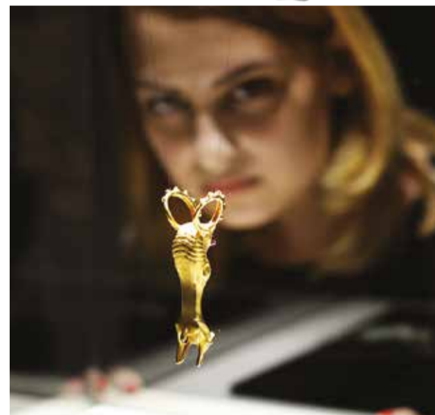
Маленькие шедевры, представленные на этой выставке, — фигурки зверей и насекомых — вызывают удивление и восхищение зрителей

— Нам повезло не только в очередной раз увидеть работы мастера, но и быть его совре-