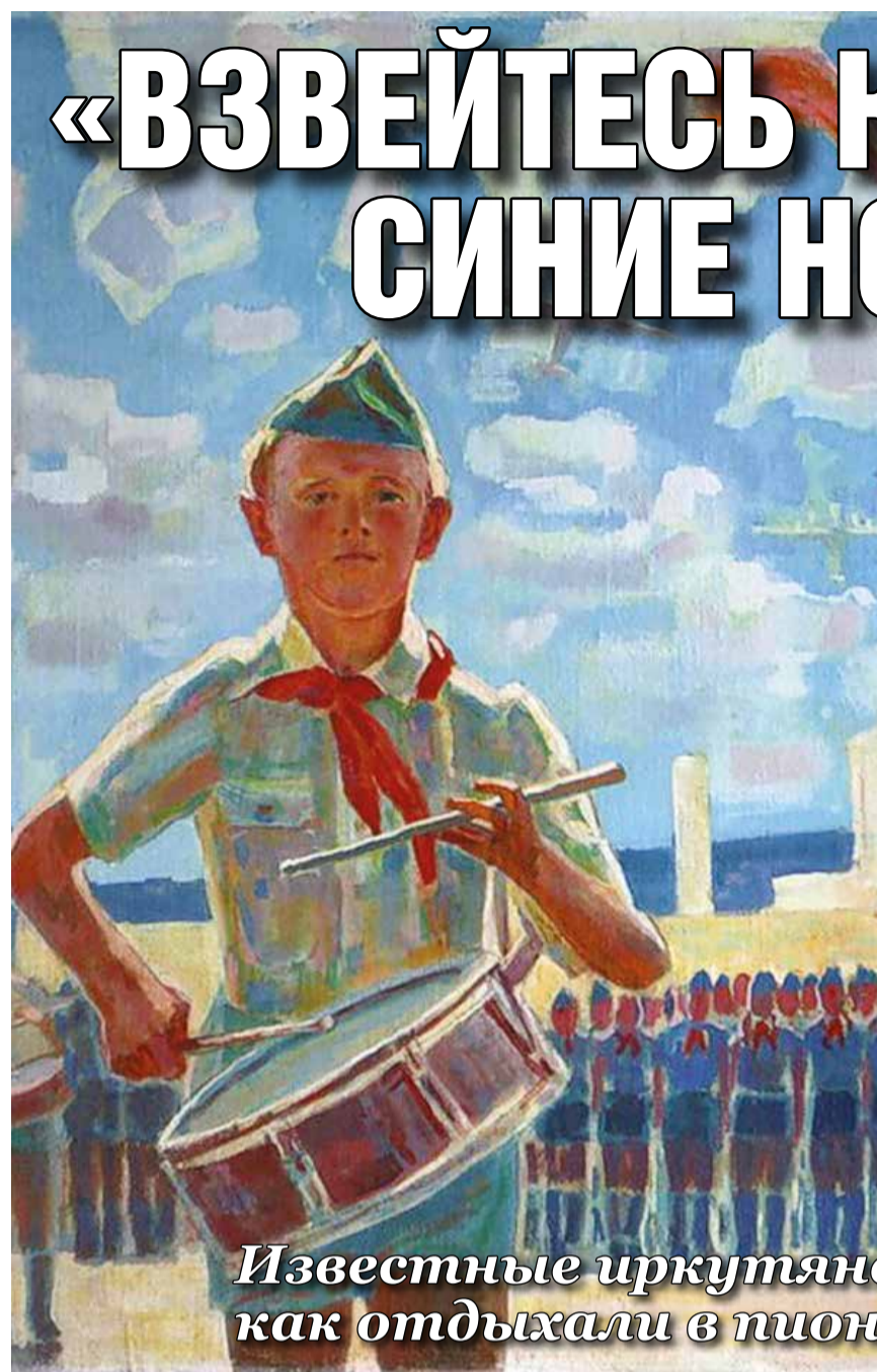
Известные иркутяне как отдыхали в пионерском лагере

А в 11 лет я выступала в лагере спасительницей лягушек. Родители отправили меня в лагерь под Новосибирском, там была болотистая местность, и все ближайшие дорожки у домиков облюбовали лягушки. Мальчишки же любят эксперименты, вот они и хватали бедных земноводных, играли с ними. Мне было жалко животных, я забирала у ребят их прямо из рук. А лягушки ведь влажные, склизкие, с перепончатыми лапами. Мне было неприятно, но я преодолевала себя! Боролась со своим страхом. Но мальчишкам, очевидно, понравилось смотреть, как я переживаю за лягушек, и они начали специально меня поддразнивать.