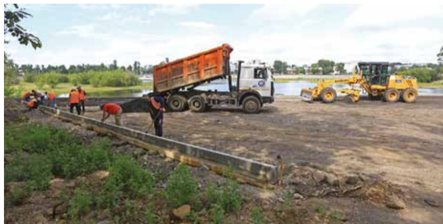
Сейчас при въезде на остров Юность работает техника — готовятся площадки под автопарковки

дорожек, установке скамеек, урн и светильников. Всего здесь будет оборудовано более 11 тысяч метров велосипедных дорожек и тротуаров, установлено 180 скамеек, более 100 урн, 22 опоры освещения и 43 светильника.