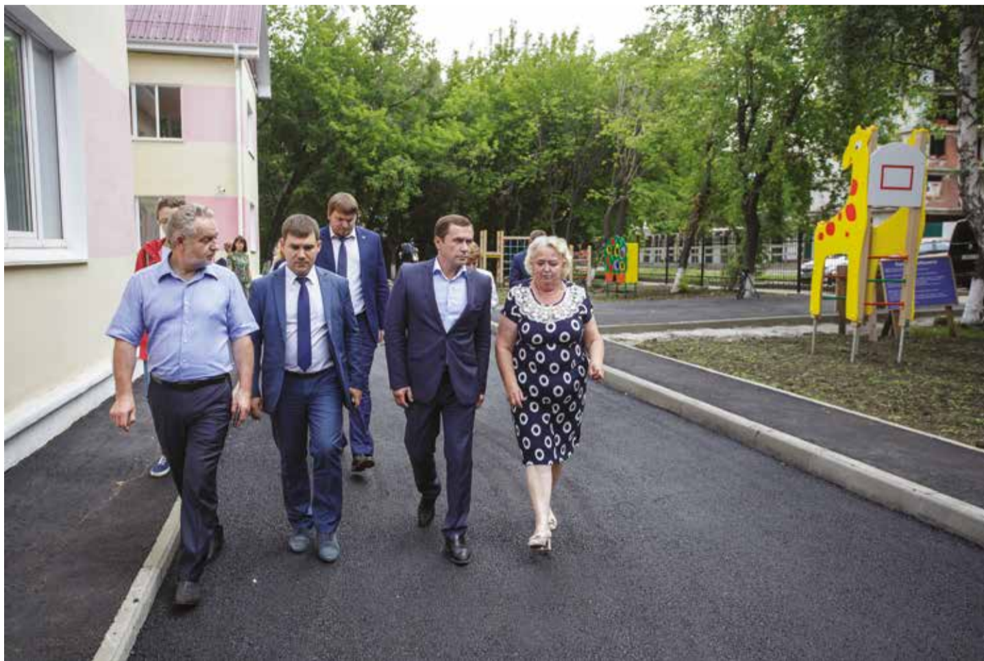
Детский сад № 103 планируют открыть после капитального ремонта 10 августа. Мэр Иркутска Дмитрий Бердников во время выездного совещания проверил, как ведутся работы

Лицей № 2 действительно выглядит как новый. Заменены окна и двери, фасадная часть спортзала реконструирована, и теперь она полностью прозрачная, поскольку выполнена из пластиковых конструкций. Единственное пожелание к подрядчику ООО «Кредострой» и