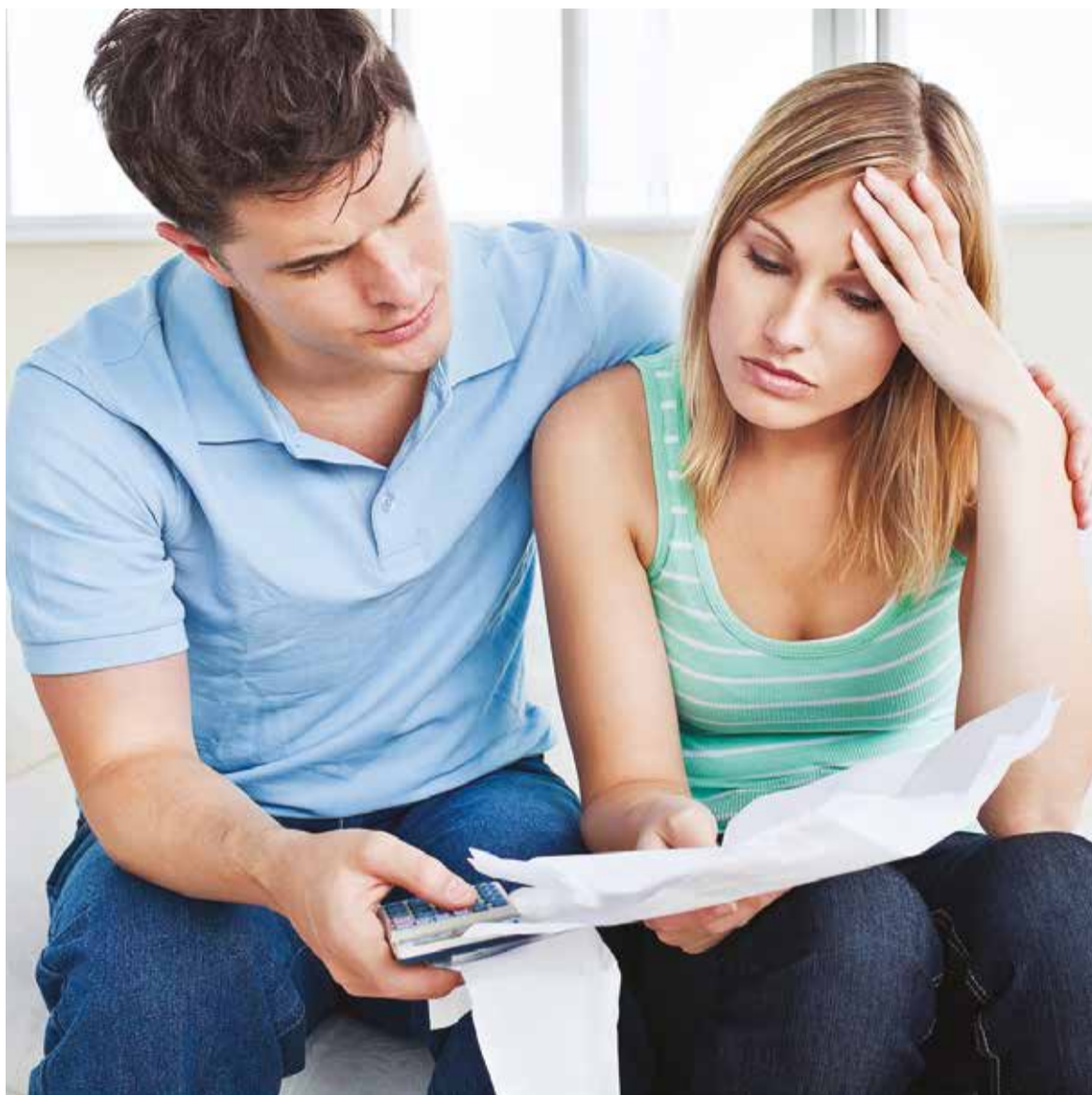
Некоторые банки уже сейчас предусматривают возможность предоставления клиентам кредитных каникул, но только в особых случаях

Кредитные каникулы возможны и сегодня — по согласованию заемщика и банка. Однако введение повсеместных каникул, по мнению специалистов, может повлечь негативные последствия. Например, повышение процентных ставок для тех заемщиков, которым такие послабления не нужны.