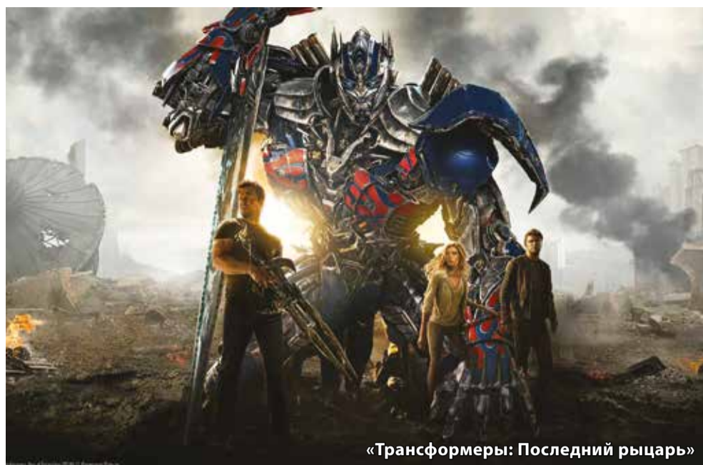
«Трансформеры: Последний рыцарь»