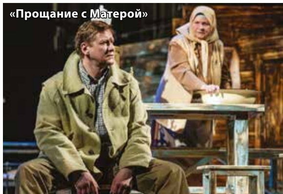
«Прощание с Матерой»