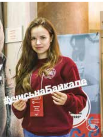
Государственный юбилей. Банк — козырем вуза