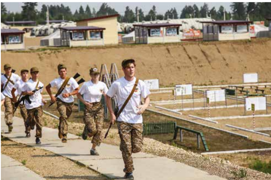
В областной военно-спортивной игре «Зарница» приняли участие более 140 ребят со всей области

помощи, марш-бросок в полной боевой выкладке, полоса препятствий, тест на знание военной истории России.