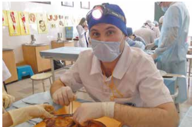
Учебу в мединституте скучной не назовешь: вместо монотонных лекций — полное погружение в профессию, операции на анатомических моделях и олимпиады по хирургии

для выпускников недоступно заочное отделение — туда принимают только сотрудников органов внутренних дел. В этом году ВСИ МВД набирает студентов на три специальности: «правовое обеспечение национальной безопасности», «правоохранительная деятельность», «судебная экспертиза». По этим направлениям выделено 179 бюджетных мест.