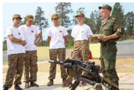
Один из этапов игры — знакомство с современной военной техникой