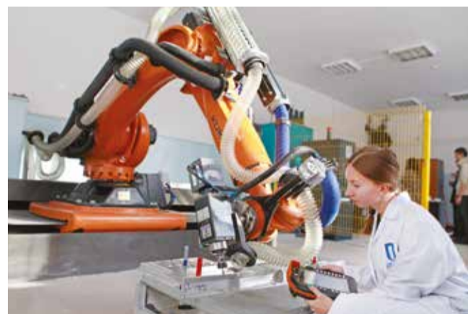
Этот робототехнический комплекс, позволяющий автоматизировать обработку деталей, находится в лаборатории Института авиационного транспорта ИРНТУ