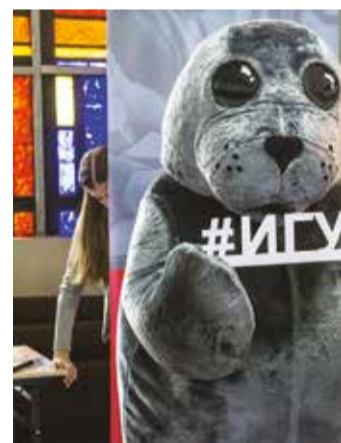
В 2018 году Иркутский госуниверситет отметит 100-летие. На протяжении века главным остается наука

Всего в этом году Иркутскому государственному университету выделено 410 бюджетных мест, из них 150 — на лечебное дело, 105 — на педиатрию, 40 — на стоматологию, 75 — на медико-профилактическое дело, 25 — на фармацию и 15 — на медицинскую биохимию. Но нужно понимать, что добрую половину занимают целевые места. К примеру, на лечебном факультете они составляют 116 из 150, а если еще отнять места для льготников, сирот и инвалидов, то на общий конкурс остается всего ничего — 19 мест.