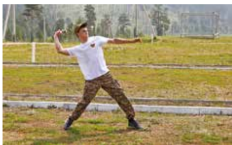
В метании гранаты учитывалась не только дальность броска, но и обращение со снарядом