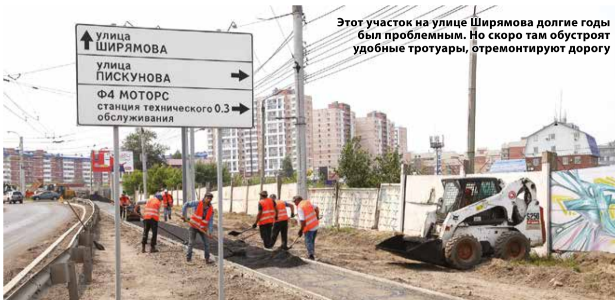
Этот участок на улице Ширямова долгие годы был проблемным. Но скоро там обустроят удобные тротуары, отремонтируют дорогу

— Мы привлекаем общественность Иркутска для контроля за обновлением дорог, — заметил Дмитрий Бердников. — Качество городских ма-