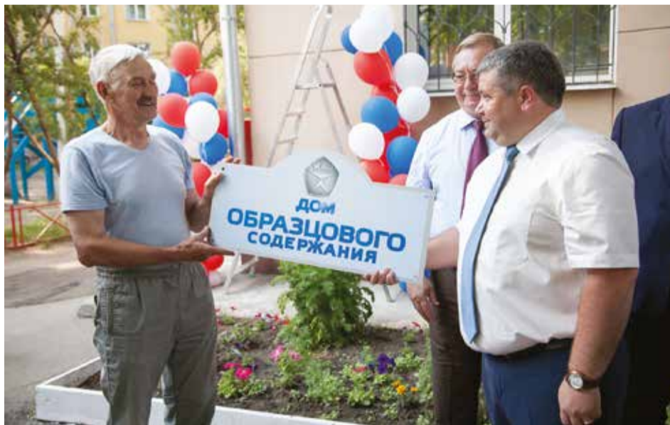
Теперь на фасаде здания на улице 5-й Армии будет висеть такая табличка. В России образцовых домов около 50

Первый дом образцового содержания появился в Иркутске