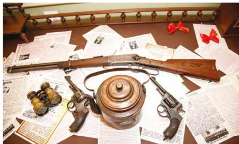
Причудливый революционный натюрморт, в котором pistols и листовки соседствуют с чайником