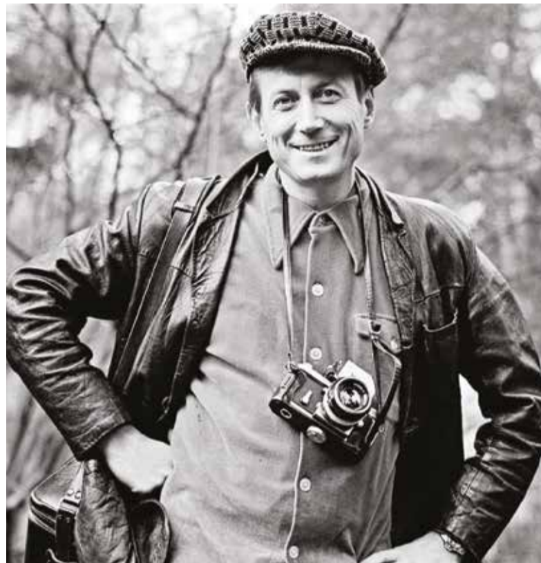
Стихи Евгения Евтушенко обжигают читателя жаром сердца, согревают большой любовью

Правда, был в этом мрачном для меня промежутке времени один светлый момент, который я запомнил на всю жизнь. Когда мы зашли в абсолютно темный подъезд на Кутузовском, Женя