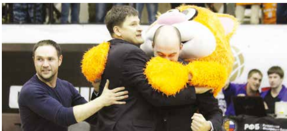
Тренерский штаб «Иркута» и талисман команды кот Феликс не могут сдержать эмоций после финальной сирены. Нервная и яркая победа!