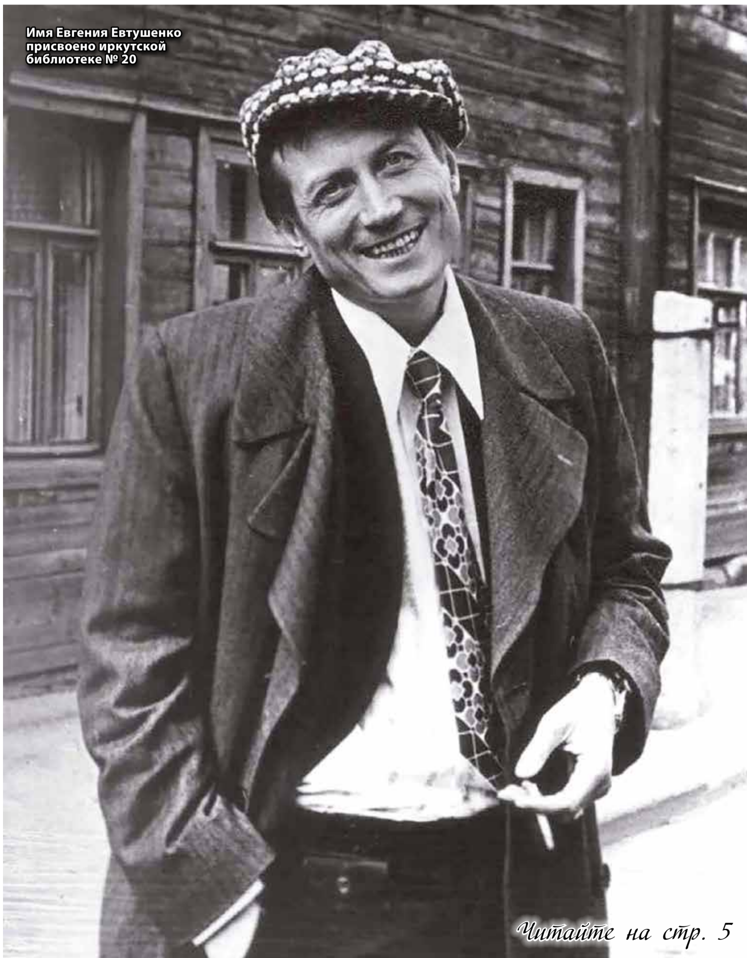
Имя Евгения Евтушенко присвоено иркутской библиотеке № 20