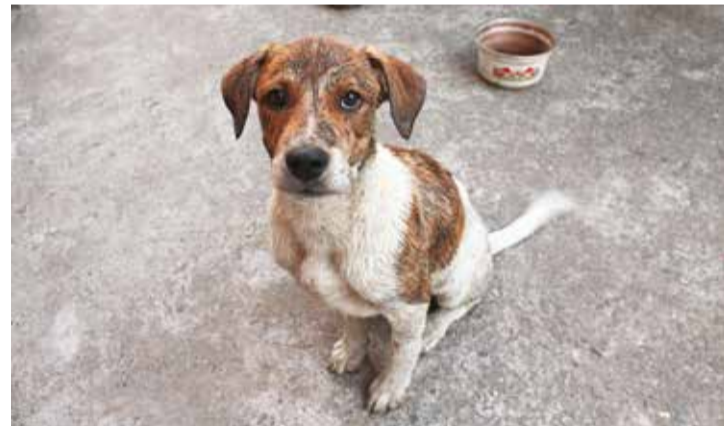
Недавно завершился аукцион на отлов 1 610 бездомных собак — столько позволяет областная субвенция. Но реальная потребность почти в три раза выше

Ну а пока иркутяне недовольны сложившейся ситуацией, ведь собаки собираются в стаи и представляют опас-