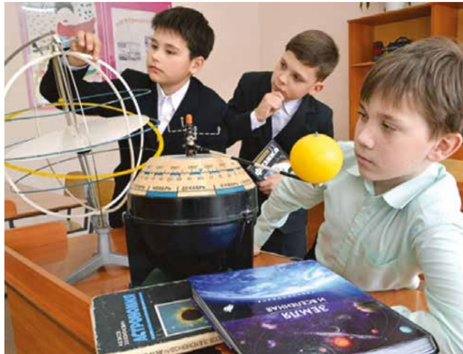
Ребята изучают движение планет с помощью современных наглядных пособий