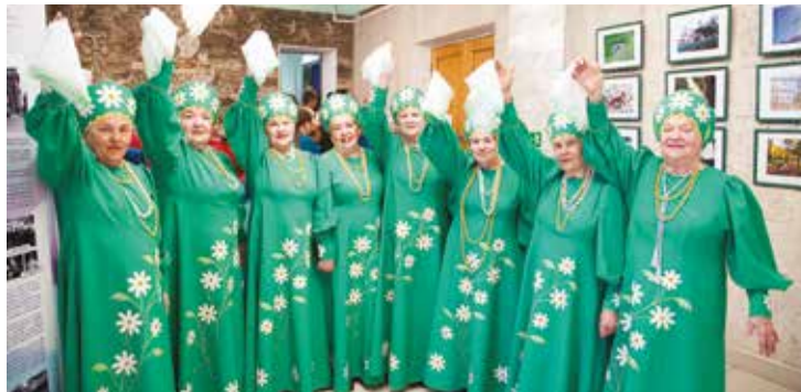
Ансамбль «Куйбышевские ромашки» — желанные гости на мероприятиях, только в марте ветераны дали пять концертов