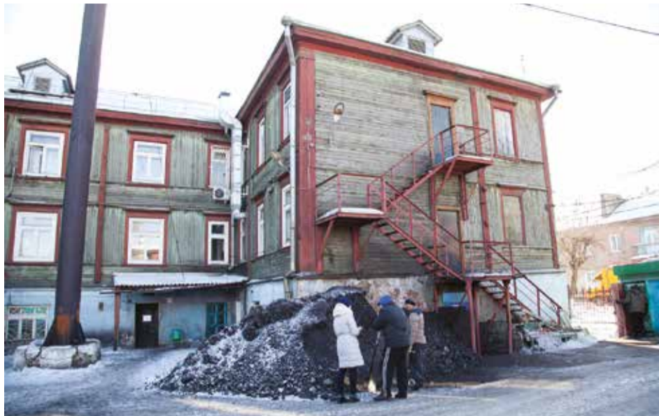
При больнице работает котельная, но механизированной подачи топлива нет. Поэтому в холодное время отбывающие наказание в основном раскидывают уголь