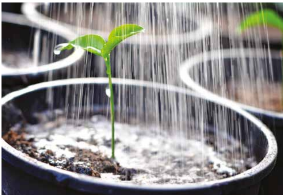
Обильно поливать рассаду можно только тогда, когда растение наберет хорошую зеленую массу и корневую систему. А вначале пользуйтесь ложкой!

мере только после появления 5–6-го листа.