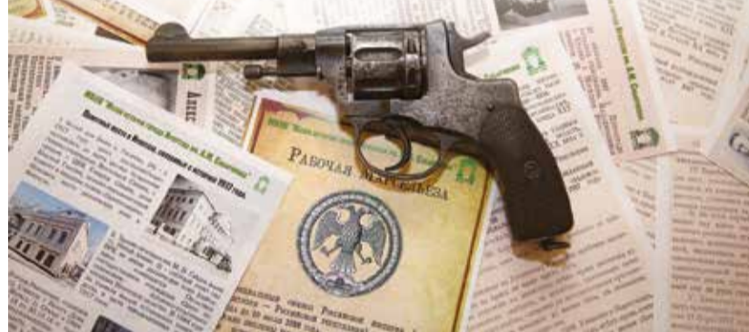
Мятежный 1917-й — время, когда последнее слово было за револьвером

Музее города Иркутска открылась выставка, посвященная Февральской революции 1917 года. Здесь можно увидеть уличные афишные тумбы с агитационными плакатами тех лет. А в витринах представлены редкие экспонаты: фотографии горожан, различные виды оружия, часы разных марок, деньги и другие вещи — свидетели тех трагических событий. Эхо Февральской революции в Иркутске было незначительным. И даже весть об отречении государя-императора пришла в наш город с большим опозданием. Люди еще не понимали, что ожидает их после этого. Иркутск Февральскую революцию встретил алыми бантами и восторженными стихами.