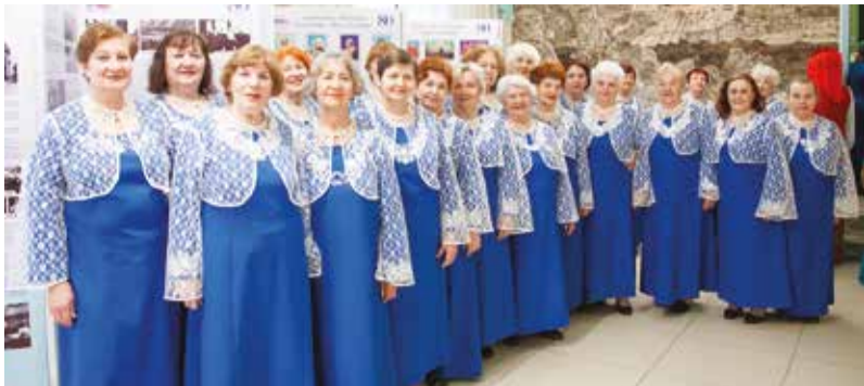
Народный хор ветеранов «Зори Байкала» — постоянный участник фестиваля-смотр «Не стареют душой ветераны»