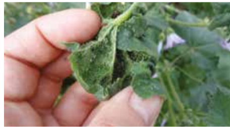
Обычно наличие тли на листьях замечают поздно. На первом этапе ее легко убрать руками