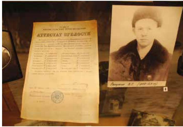
В школьном аттестате Валентина Распутина нет ни одной четверки

Музей писателя открыли выставкой «Откуда есть-пошли мои книги», рассказывающей об истоках