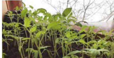
Рассада вытягивается в случае ранней посадки семян, а также при слишком обильном посеве