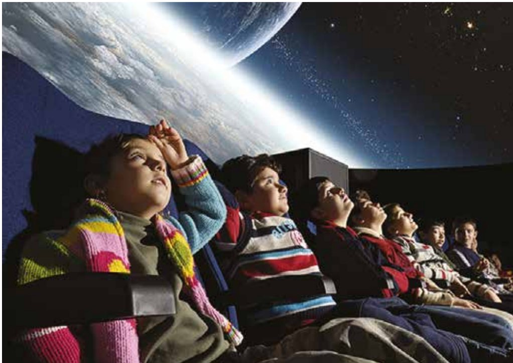
В век цифровых технологий изучать космос по рисункам на доске неправильно, считают иркутские ученые. Детям интереснее смотреть фильмы о космосе