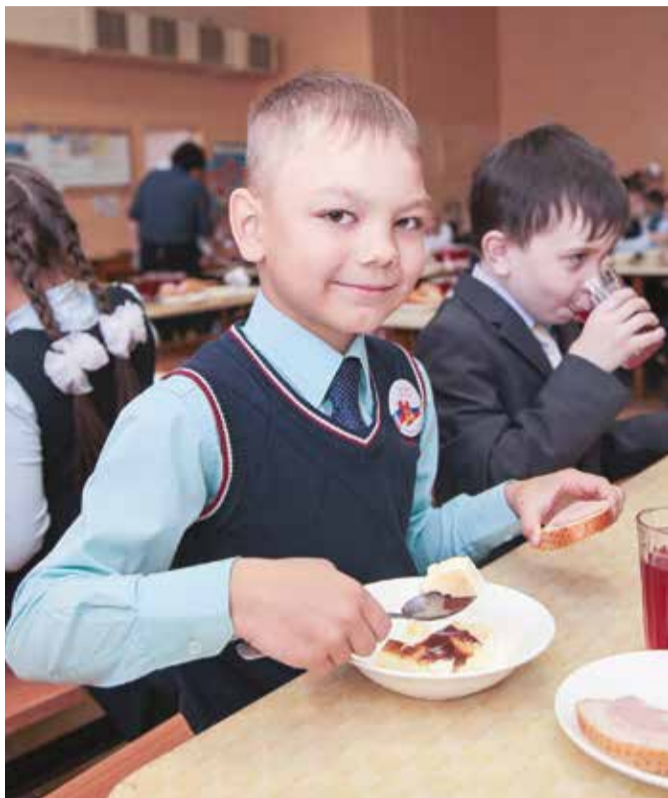
Сейчас стоимость горячего обеда для школьников в Иркутске — одна из самых высоких в регионе, она составляет 58 рублей. Областной бюджет компенсирует 15 рублей, остальные 43 рубля выплачиваются из городской казны

Дума Иркутска предложила областному парламенту поддержать инициативу мэра о школьном питании