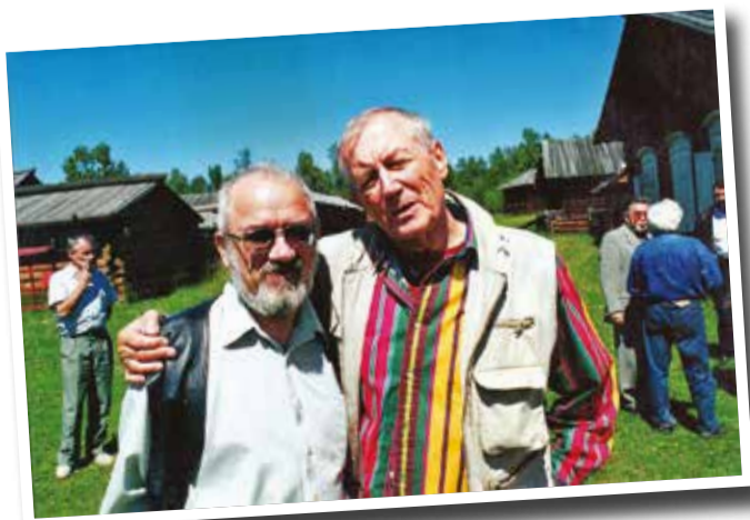
Год 2000. Встреча в музее «Тальцы»