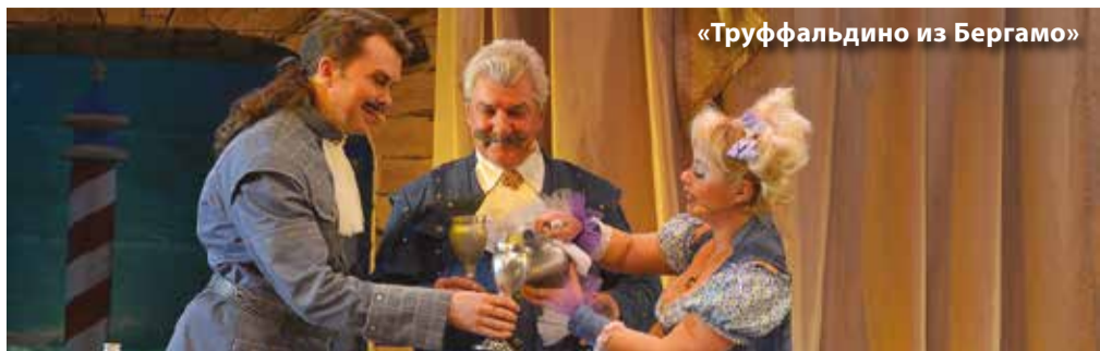
«Труффальдино из Бергамо»