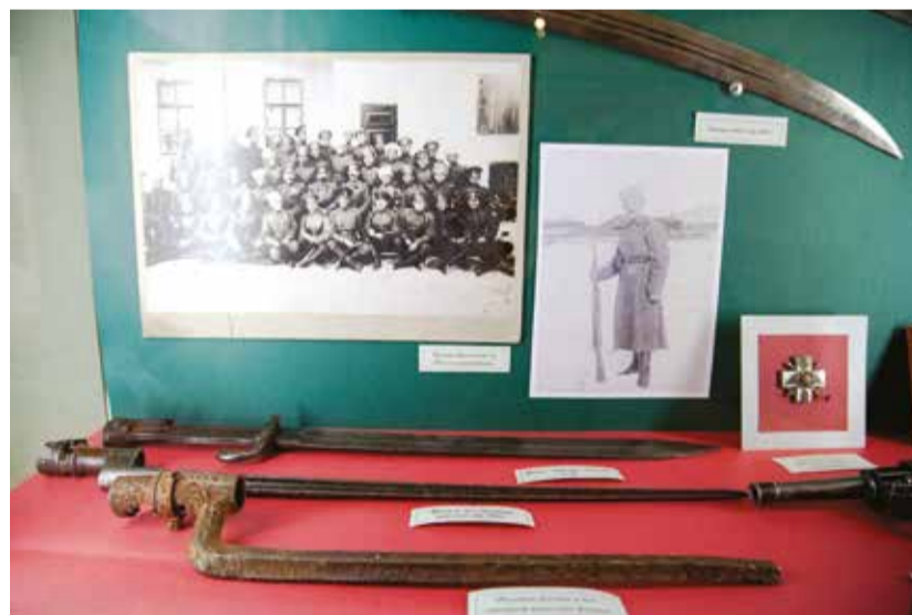
Музейная витрина, посвященная иркутским юнкерам