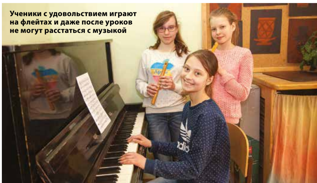
Ученики с удовольствием играют на флейтах и даже после уроков не могут расстаться с музыкой