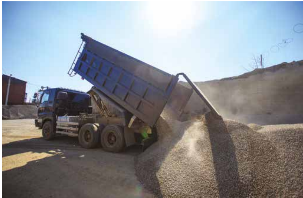
Для реконструкции и ремонта городских дорог в этом году потребуется 115 тысяч тонн инертных материалов