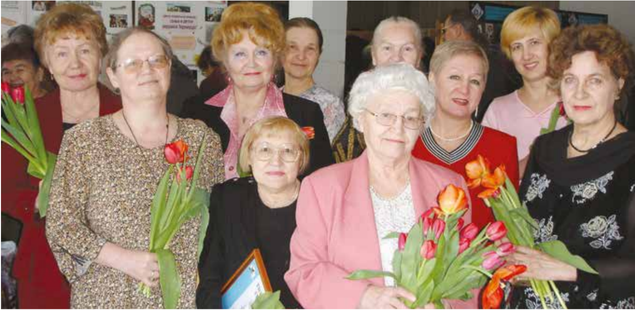
Актив женсовета Свердловского округа отмечает юбилей