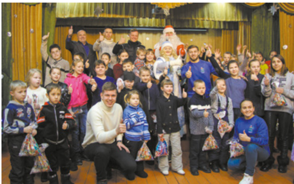
Иркутяне продолжают поддерживать жителей пострадавших территорий