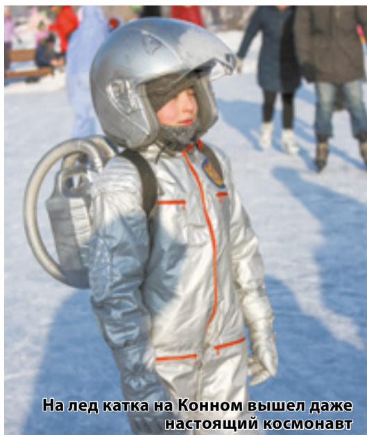
На лед катка на Конном вышел даже настоящий космонавт

Постоянными участниками праздника на острове Конный стала студия старинного танца Antiquo More, которая занимается реконструкцией танцев XV–XIX вв. Свои костюмы они представляют уже тре-