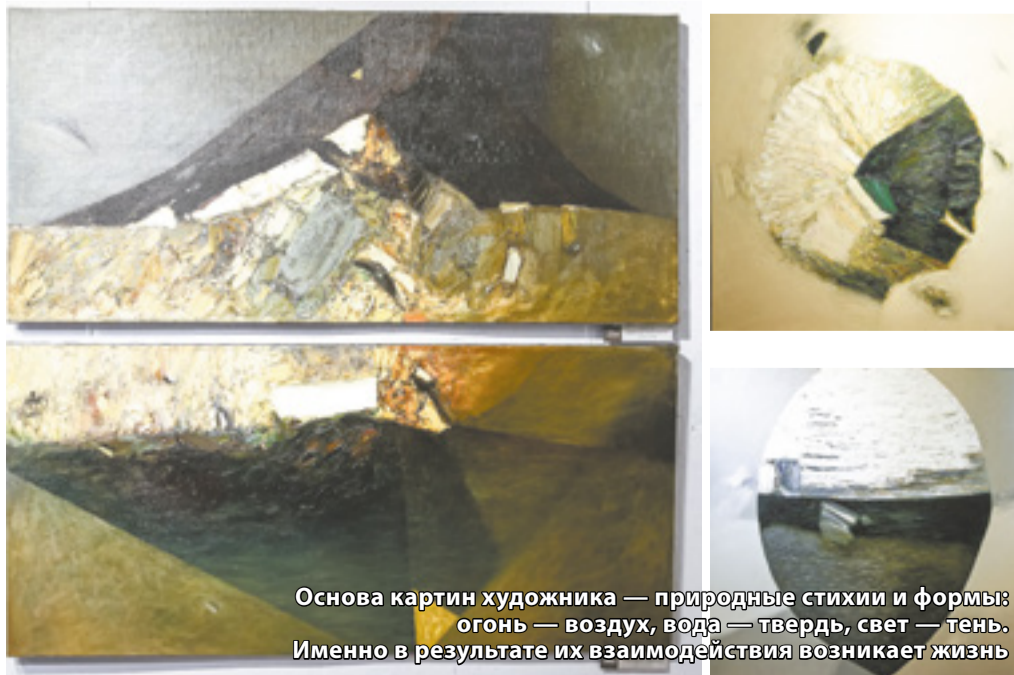
Основа картин художника — природные стихии и формы: огонь — воздух, вода — твердь, свет — тень. Именно в результате их взаимодействия возникает жизнь

Нина Александрова