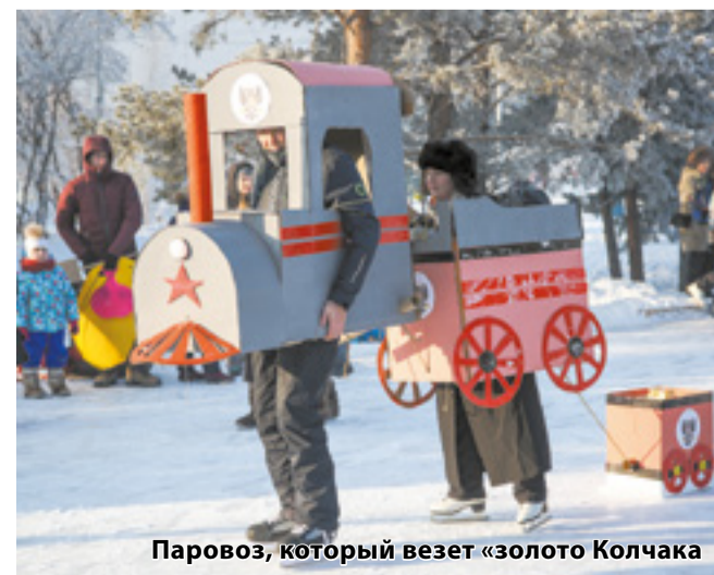
Паровоз, который везет «золото Колчака»

Алена Григорьева