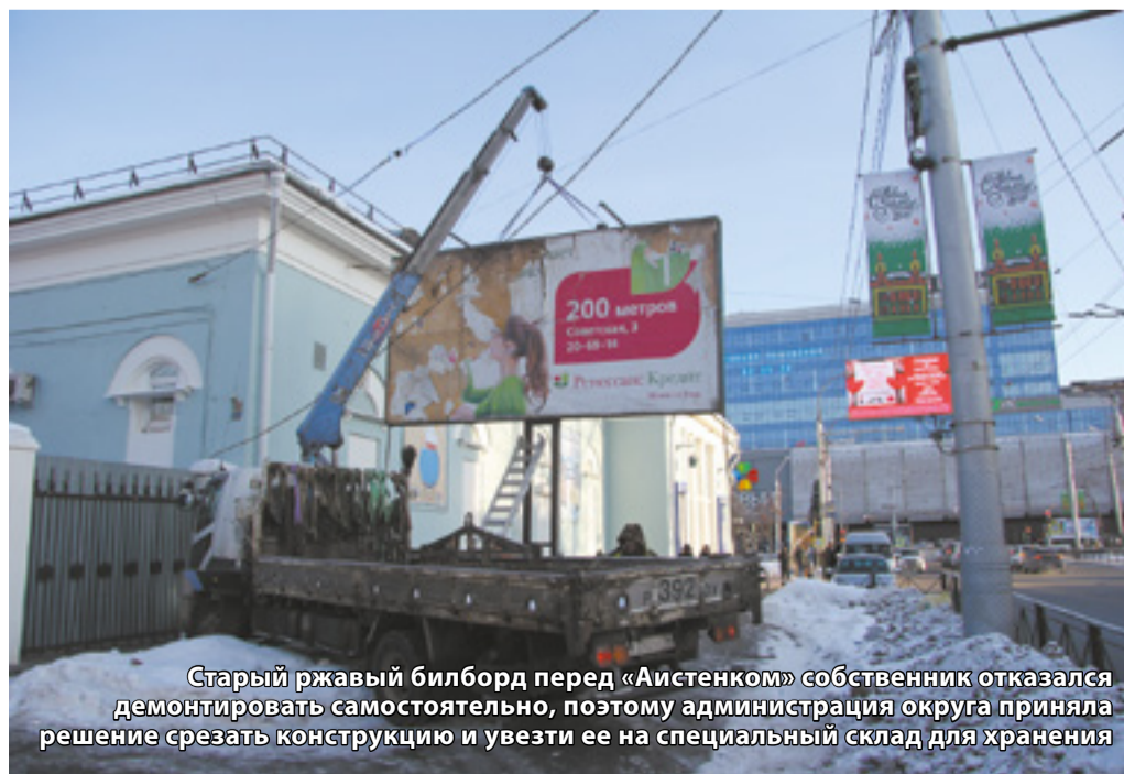
Старый ржавый билборд перед «Аистенком» собственник отказался демонтировать самостоятельно, поэтому администрация округа приняла решение срезать конструкцию и увезти ее на специальный склад для хранения