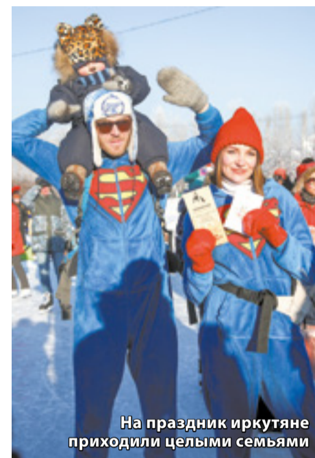
На праздник иркутяне приходили целыми семьями