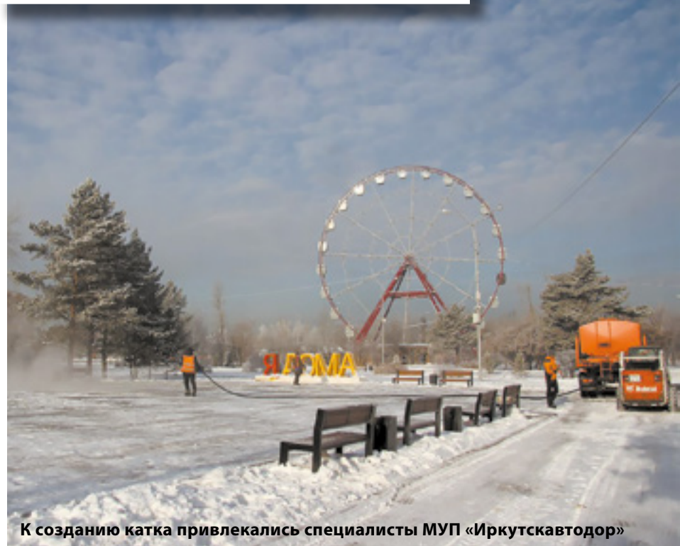
К созданию катка привлекались специалисты МУП «Иркутскавтодор»