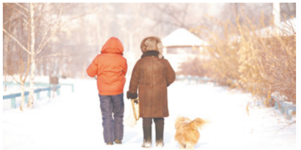
Специалисты отмечают, что короткие периоды потепления в январе, исходя из 130-летней истории метеонаблюдений, случались и раньше

— Нельзя сказать, что столь теплая погода в январе 2020 года — это аномалия. Короткие периоды потепления, исходя из 130-летней истории метеонаблюдений, случались и раньше, — отметила Юлия Янькова. — Они были в первой декаде января, например, в 1984 году, затем в 2002, 2007, 2015 годах. Об аномалии можно говорить, когда повторяемость составляет менее 10 %, в нашем случае она находится в пределах 20 %. Крещенские морозы в Иркутск и в целом в Приангарье придут, но уже после 19 января. Что касается осадков, то снег