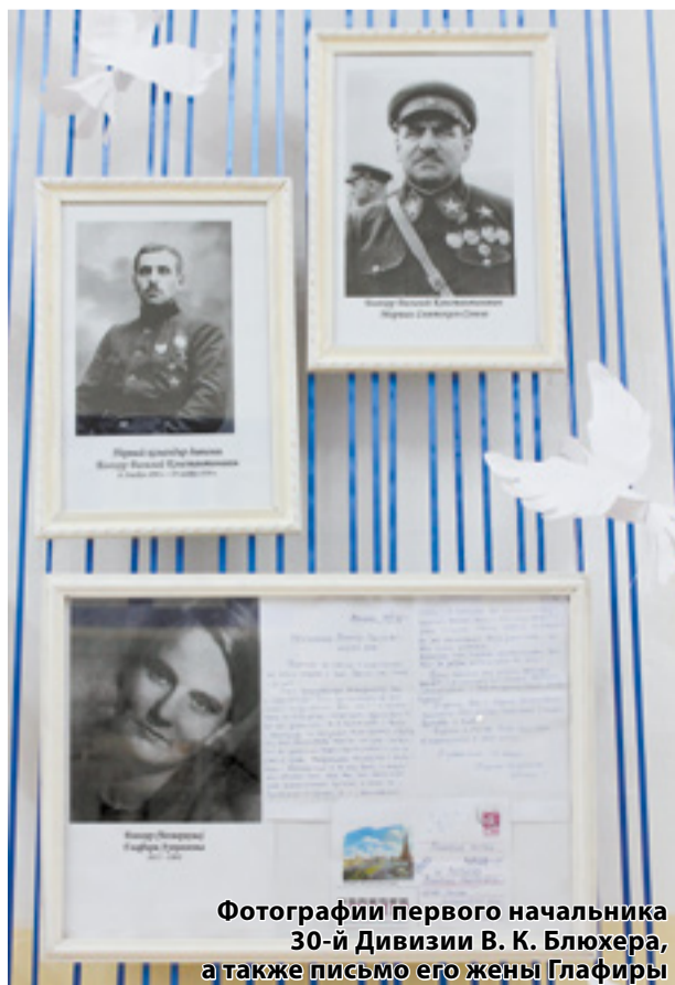
Фотографии первого начальника 30-й Дивизии В. К. Блюхера, а также письмо его жены Глафиры