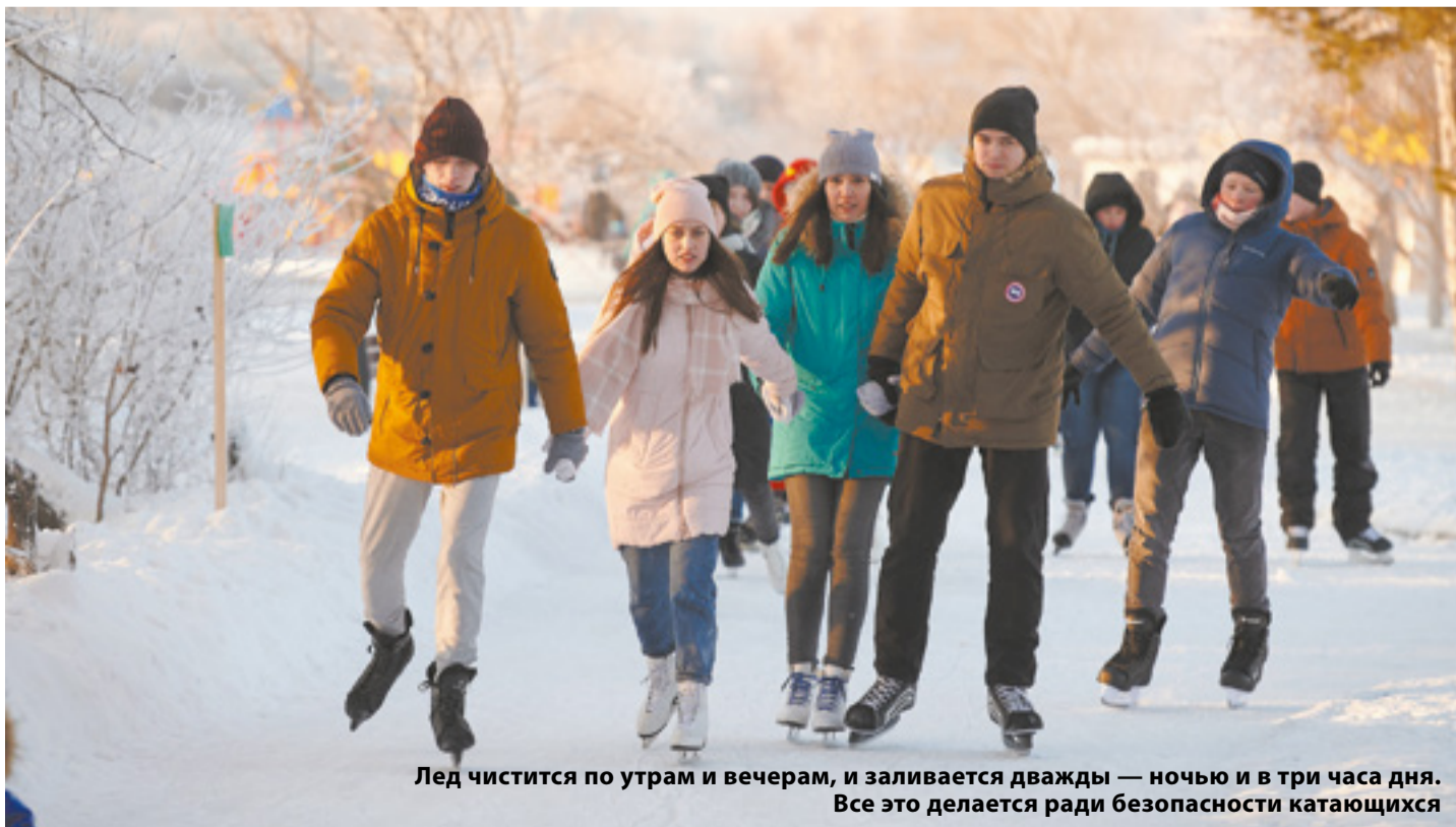
Лед чистится по утрам и вечерам, и заливается дважды — ночью и в три часа дня. Все это делается ради безопасности катающихся