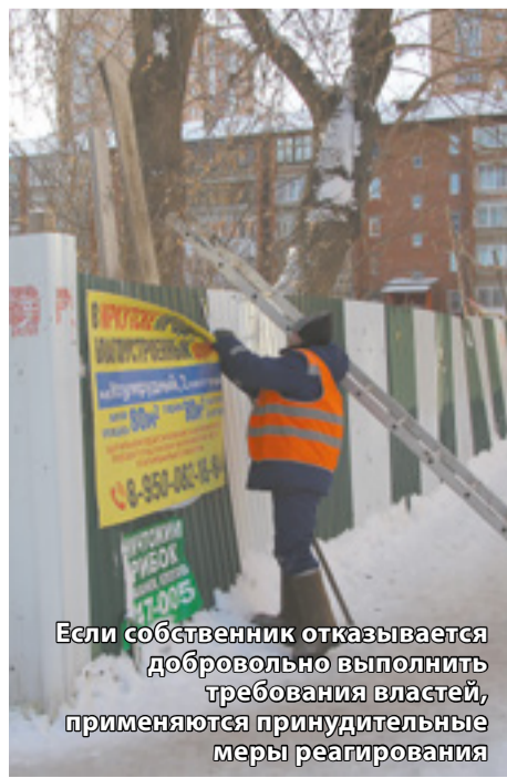
Если собственник отказывается добровольно выполнить требования властей, применяются принудительные меры реагирования