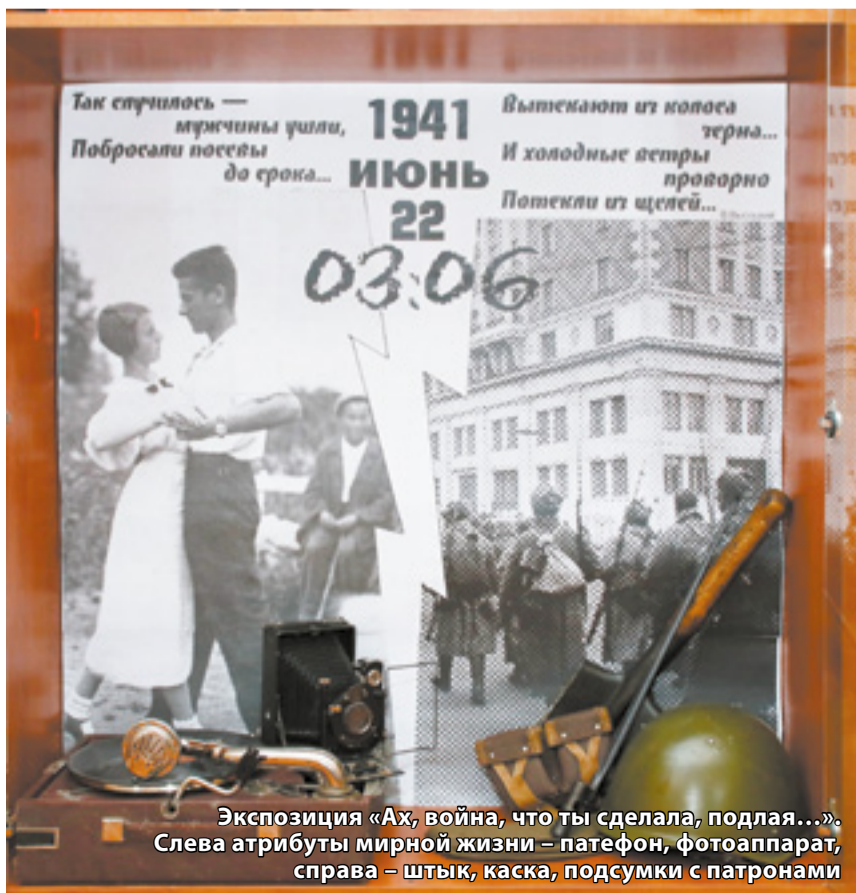
Экспозиция «Ах, война, что ты сделала, подлая...». Слева атрибуты мирной жизни — патефон, фотоаппарат, справа — штык, каска, подсумки с патронами