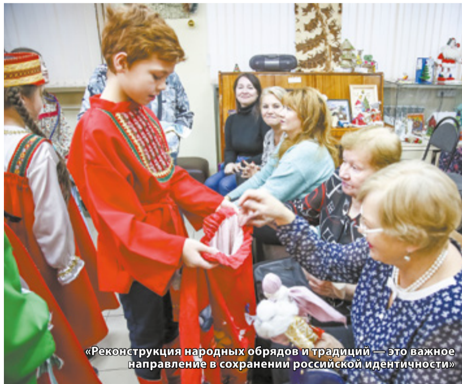
«Реконструкция народных обрядов и традиций — это важное направление в сохранении российской идентичности»