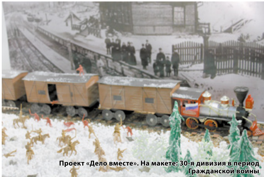
Проект «Дело вместе». На макете: 30-я дивизия в период Гражданской войны