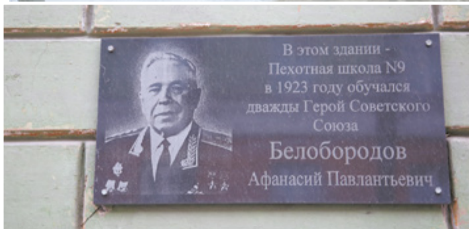
В январе 2003 года на здании дома № 65 бывшей пехотной школы по ул. 5-й Армии была установлена мемориальная доска: «В этом здании Пехотной школы № 9 в 1923 году обучался дважды Герой Советского Союза Белобородов Афанасий Павлантьевич»

это поражение, нанесенное ей летом вблизи от ее границ, явилось катастрофичнее, чем поражение под Сталинградом», — оценивал английский историк А. Ситон. За образцовое выполнение боевых заданий в Витебской операции генералу Белобородову 22 июля 1944 года было присвоено звание Героя Советского Союза.