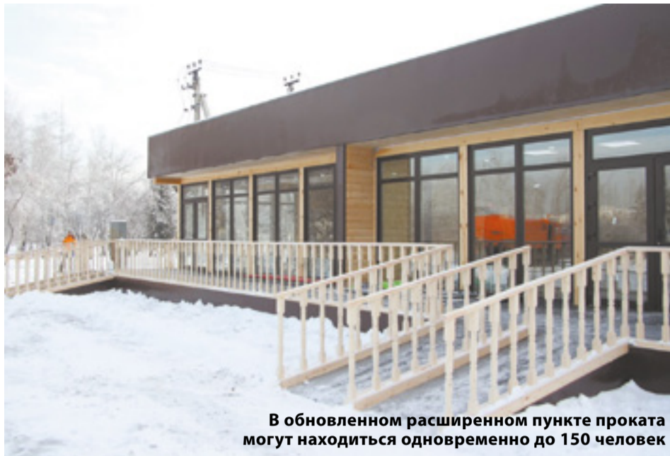
В обновленном расширенном пункте проката могут находиться одновременно до 150 человек

услышать отзывы о катке. Видим, что многие приводят гостей из других городов. Я зарегистрирован во всех социальных сетях, провожу мониторинг активности на катке, вижу фотографии иркутян с острова: на них всегда запечатлены праздничные, радостные эмоции. Чувствуется, что людям очень нравится это пространство. Остров заполняется активностями, там сохранена зона пешего трафика, оборудована самая большая городская детская площадка, есть заведения общепита.