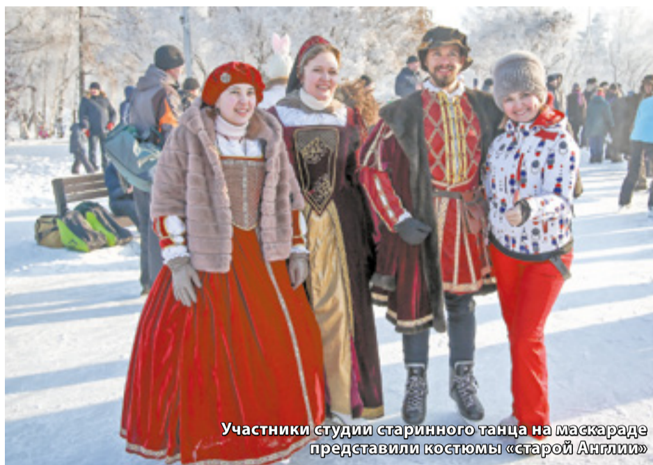
Участники студии старинного танца на маскараде представили костюмы «старой Англии»

Третий бал-маскарад прошел на самом большом катке Иркутска