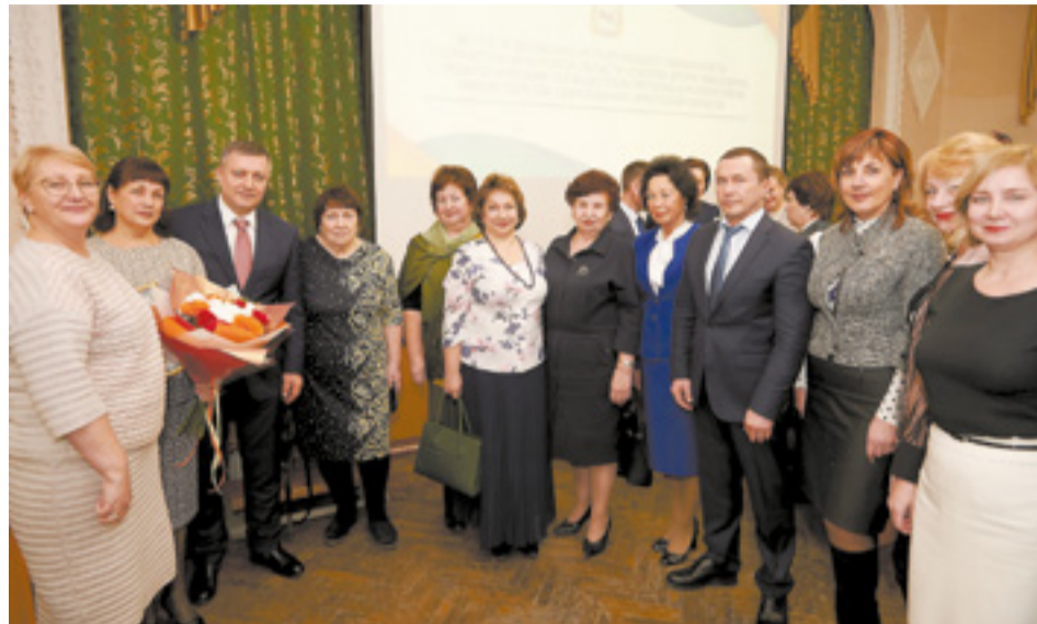
Участие в мероприятии приняли учителя и руководители школ, детских садов, средних профессиональных образовательных организаций и учреждений дополнительного образования