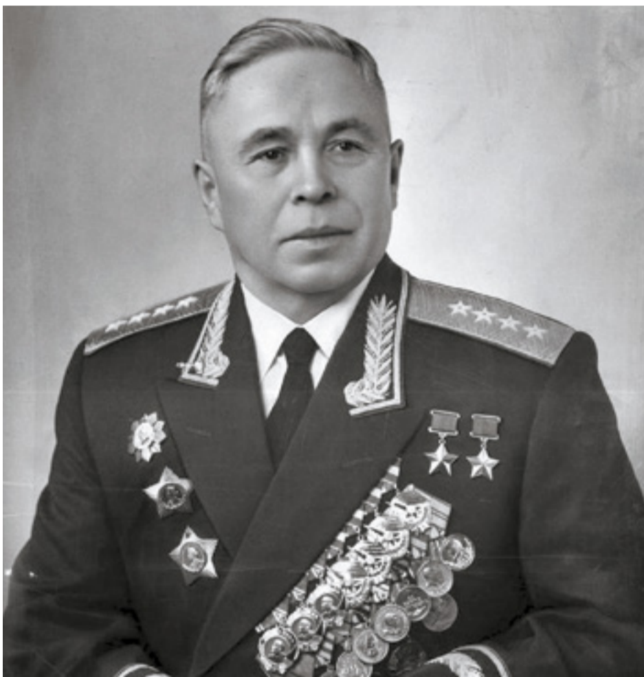
С 1963 по 1968 год Афанасий Павлантьевич руководил Московским военным округом и неоднократно командовал военными парадами на Красной площади в Москве

Об исключительном мужестве и военном таланте генерала армии Афанасия Белобородова