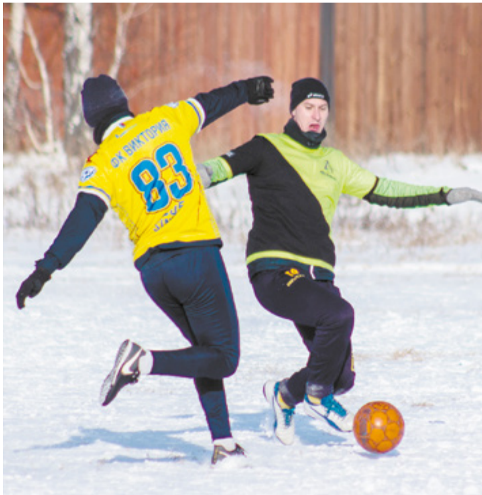
Игроки признаются, что снежное покрытие имеет свои особенности, отскок мяча совсем другой

— Вполне, ведь 10–15 лет назад был совершенно другой футбол. Считаю,