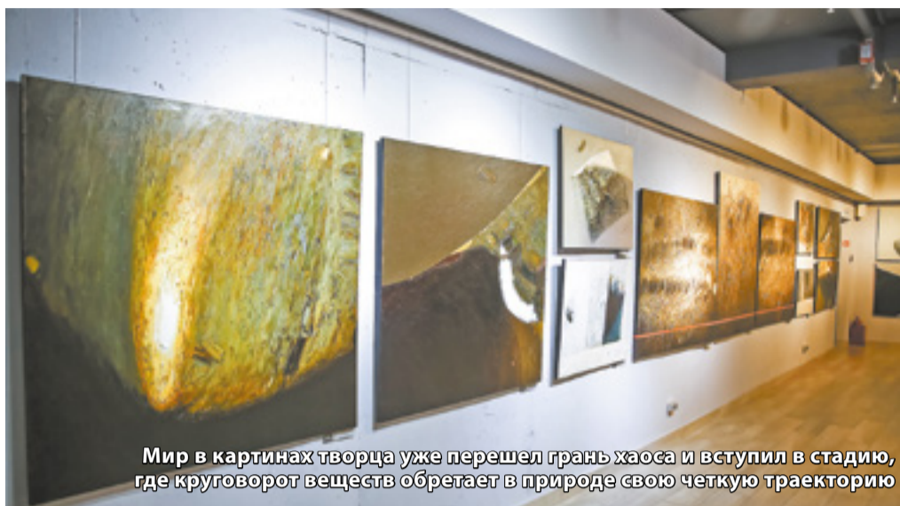
Мир в картинах творца уже перешел грань хаоса и вступил в стадию, где круговорот веществ обретает в природе свою четкую траекторию