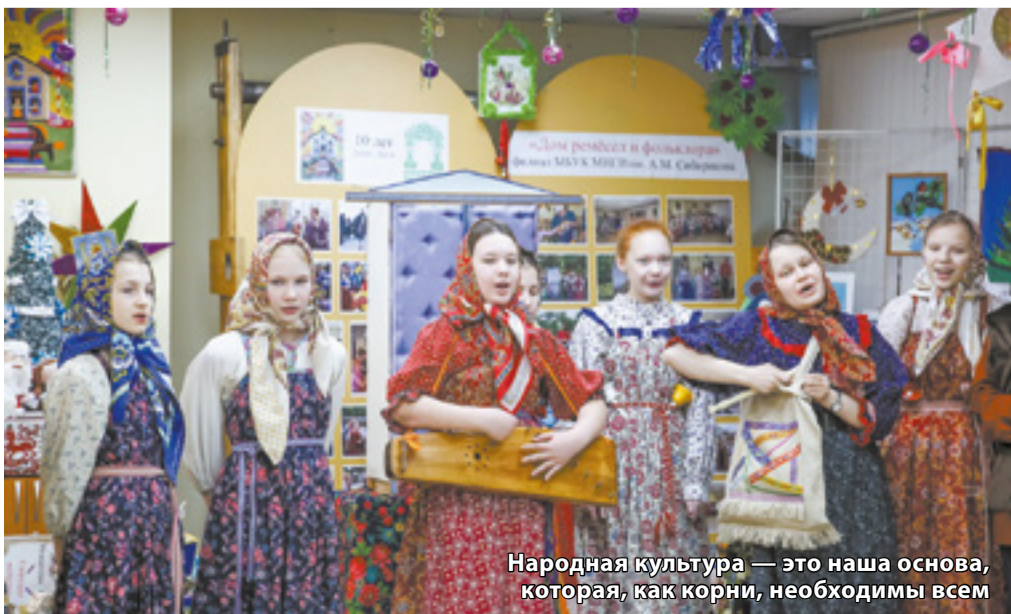
Народная культура — это наша основа, которая, как корни, необходимы всем