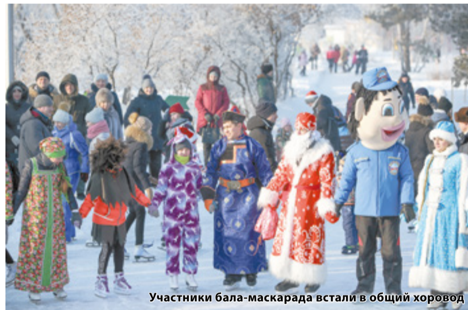
Участники бала-маскарада встали в общий хоровод

тий раз. Нынче на лед прямиком из второй половины XVI века пожаловали представители династии Тюдоров. Король Англии Генрих прибыл в сопровождении своих жен. Все эти наряды участники маскарада сшили самостоятельно. На льду они попробовали показать и один из самых сложных старинных французских танцев — бурре.