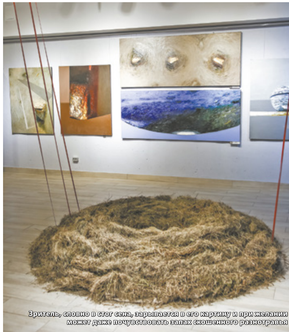
Зритель, словно в стог сена, зарывается в его картину и при желании может даже почувствовать запах скошенного разнотравья