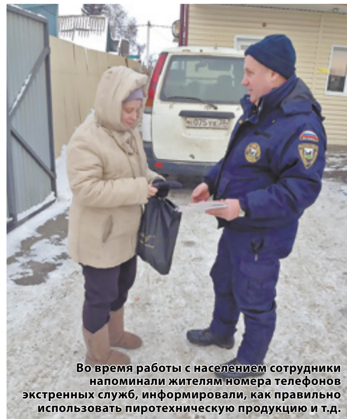
Во время работы с населением сотрудники экстренных служб напоминали жителям номера телефонов экстренных служб, информировали, как правильно использовать пиротехническую продукцию и т.д.