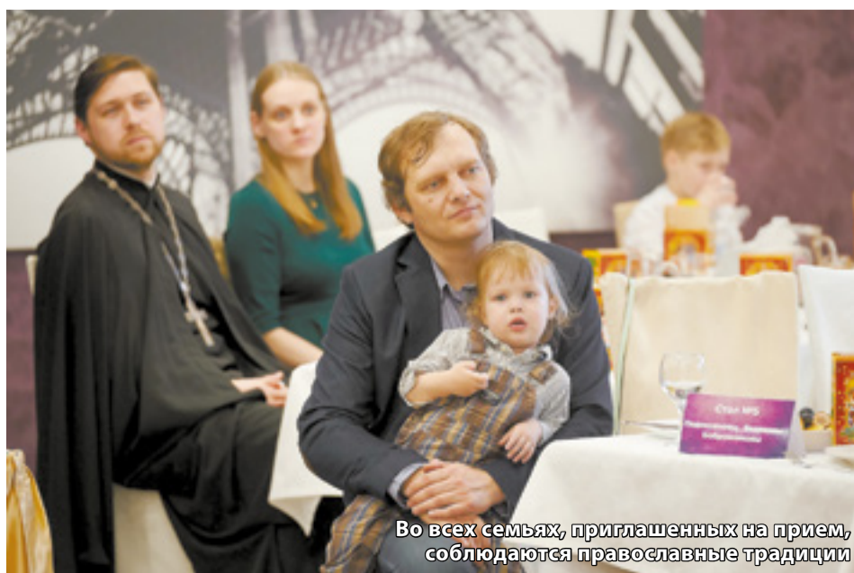
Во всех семьях, приглашенных на прием, соблюдаются православные традиции