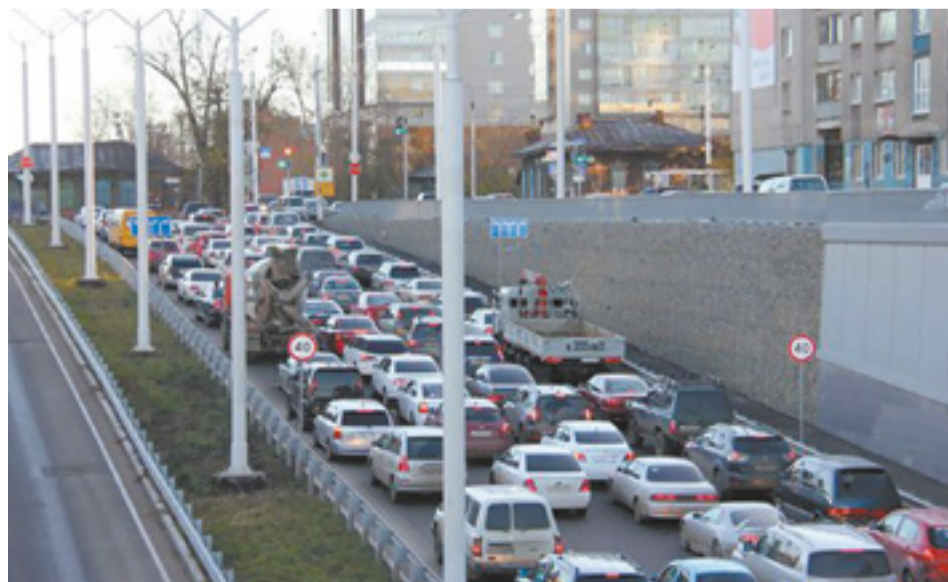
С 2020 года поменялись правила получения автомобильных номеров: теперь их будут выдавать не только в ГИБДД, но и в специализированных компаниях