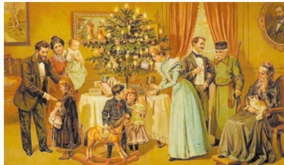
Рождество всегда было одним из самых значимых и веселых праздников для всех сословий