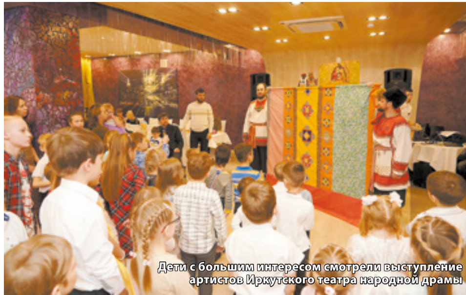
Дети с большим интересом смотрели выступление артистов Иркутского театра народной драмы