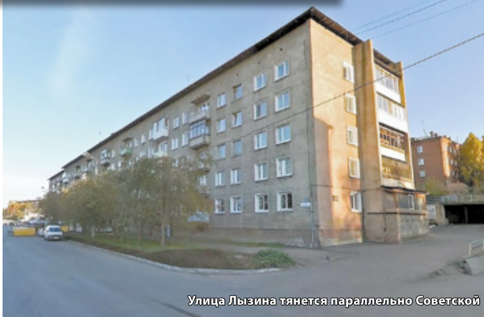
Улица Лызина тянется параллельно Советской