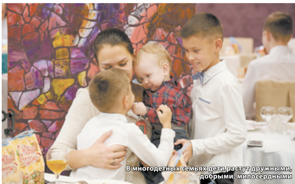
В многодетных семьях дети растут дружными, добрыми, милосердными