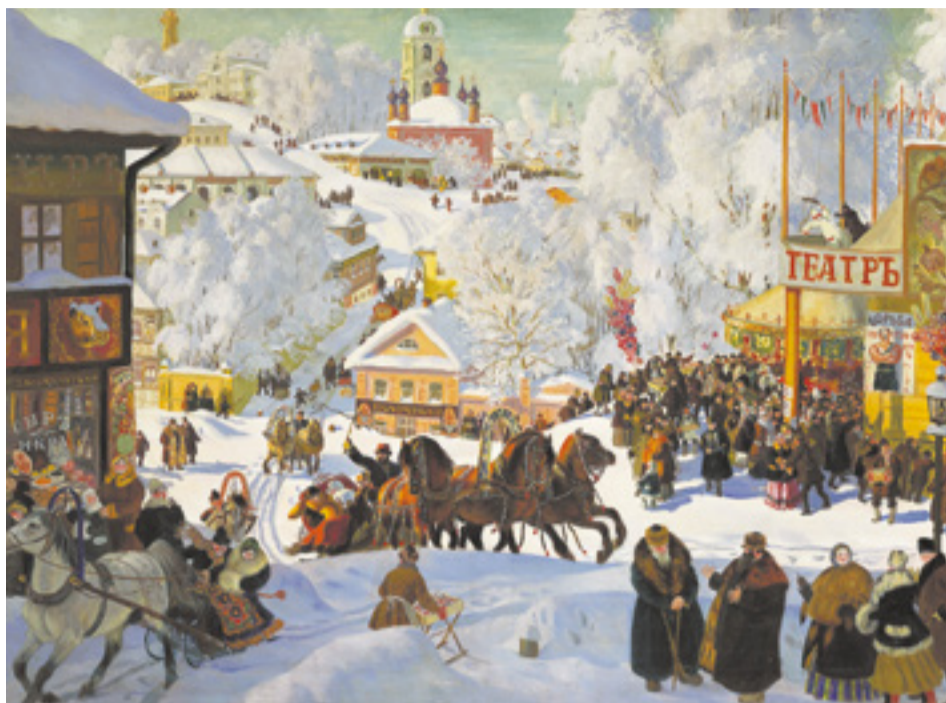
В святочные дни проходили широкие народные гуляния: катались на лошадях, ходили на рождественские ярмарки, устраивали ряжения

в виде домашних животных и птиц, которое выпекали в Сочельник.