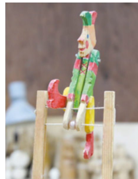
Народная механическая игрушка, выполненная мастерами Дома ремесел и фольклора