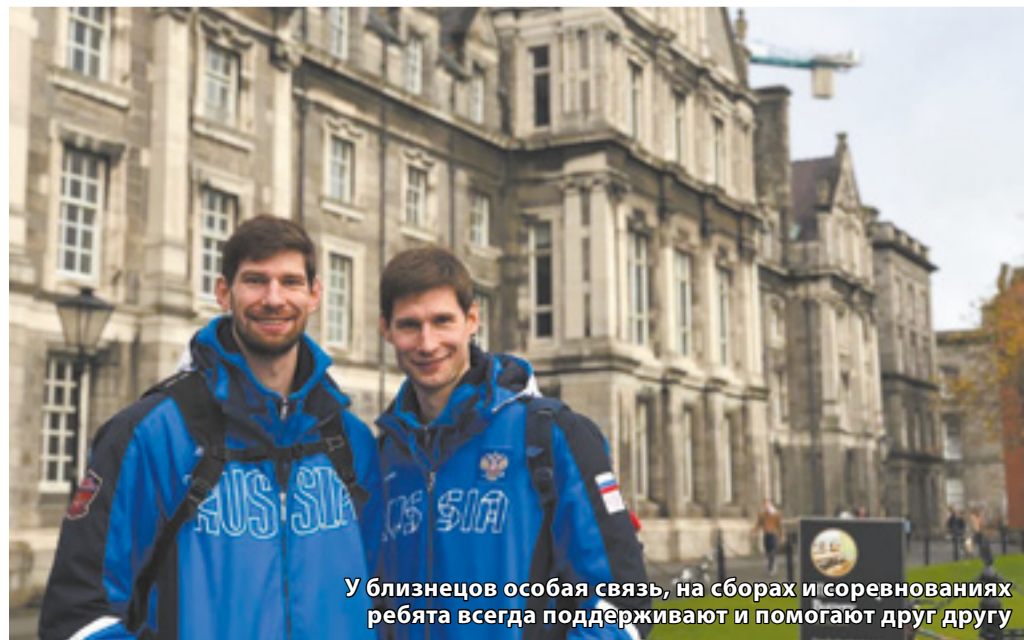
У близнецов особая связь, на сборах и соревнованиях ребята всегда поддерживают и помогают друг другу