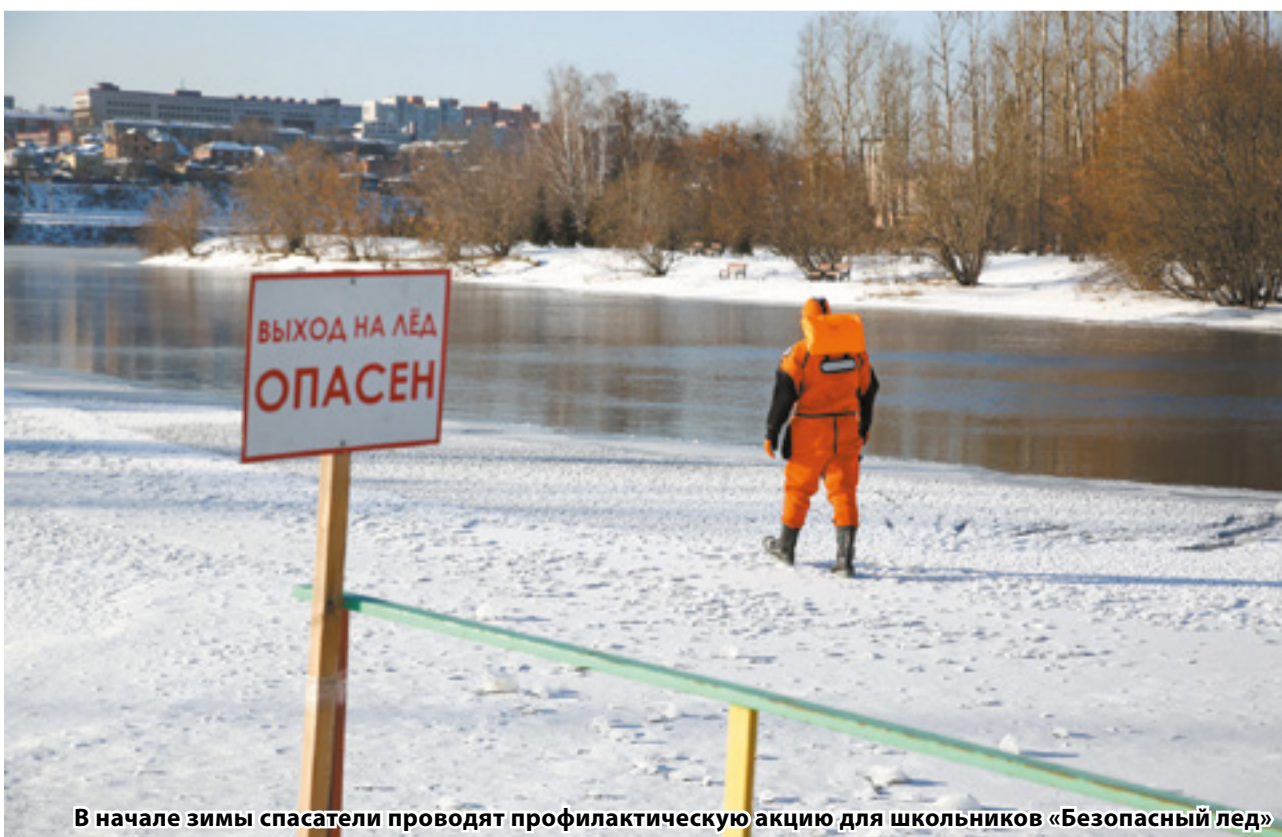
В начале зимы спасатели проводят профилактическую акцию для школьников «Безопасный лед»