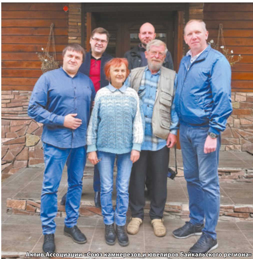
Актив Ассоциации «Союз камнерезов и ювелиров Байкальского региона»