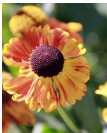
Гелиопсис гелениум осенний цветет до середины октября