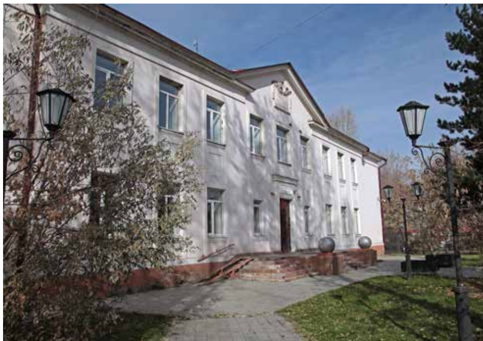
В лицее №2, включенном в топ-500 лучших школ России, обучаются дети с 8 по 11 класс. Особый упор здесь делают на математику, физику и информатику

Ученики школы № 14 — активные участники Российского движения школьников. Это общественно-государственная детско-юношеская организация, деятельность которой це-