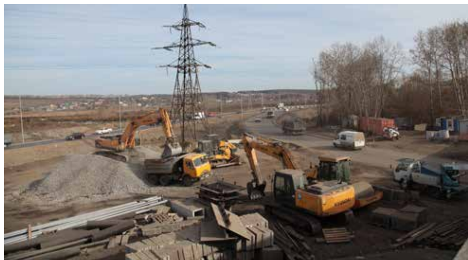
В рамках второго этапа идет реконструкция петлеобразного съезда с Иннокентьевского моста и прилегающих к нему дорог