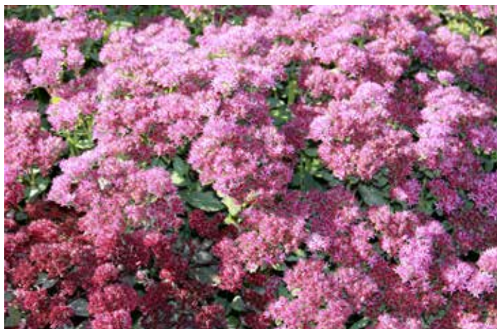
Очитки видные, пожалуй, самые главные осенние цветы. Им не страшен мороз до минус десяти градусов