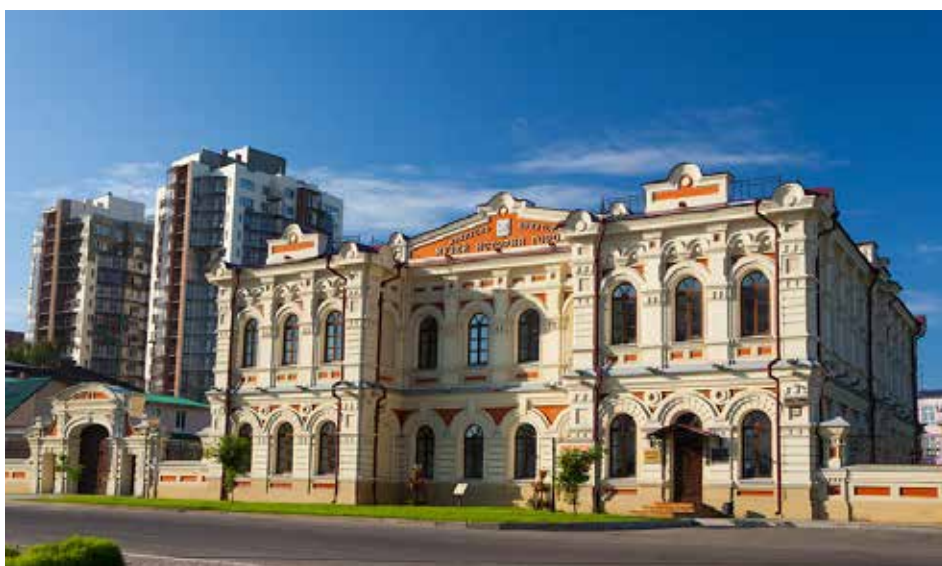
Это здание в свое время было построено Сибиряковым, а теперь Музей истории Иркутска, который там располагается, носит его имя

и Азиатской России, они, казалось бы, и должны играть в организме страны подобающую им роль. Сибирь богата своими водными путями, и наша задача состоит в том, чтобы ими воспользоваться как должно. Наступило время подумать об этом...» — писал Александр Сибиряков.