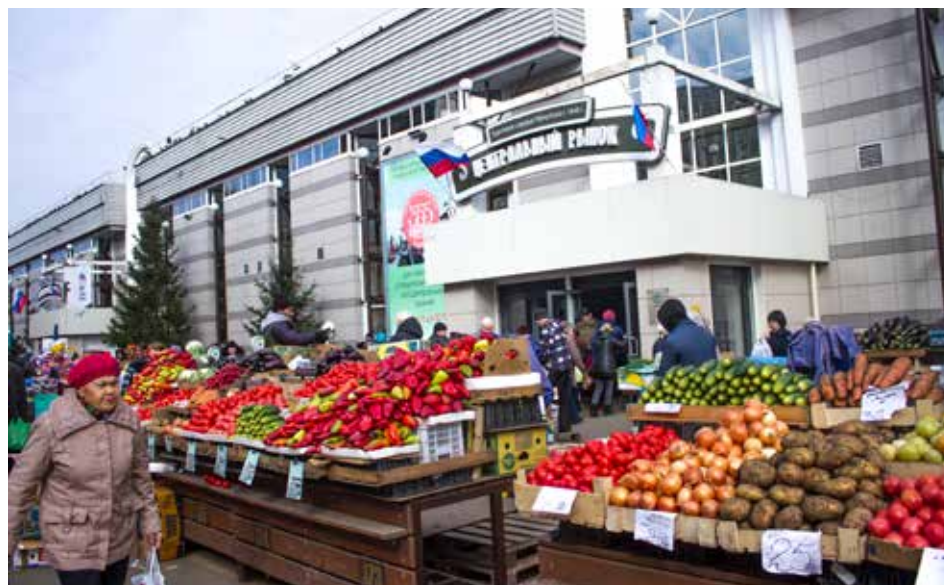
Сельскохозяйственная ярмарка в центре всегда пользовалась популярностью среди горожан. Однако для удобства жителей такие ярмарки скоро появятся во всех районах города