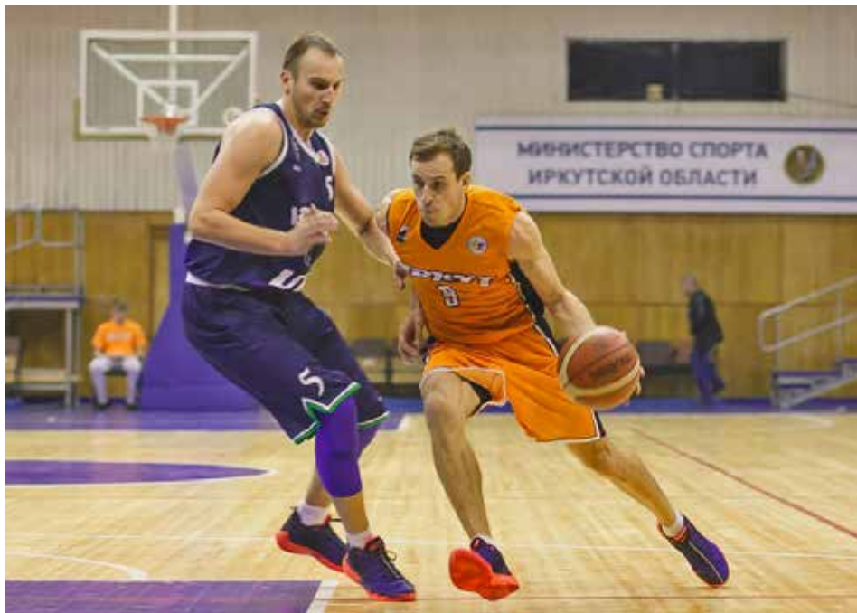
Баскетбольный сезон обещает быть крайне интересным. Основной козырь «Иркута» — командная игра, именно на это тренерский штаб сделал установку