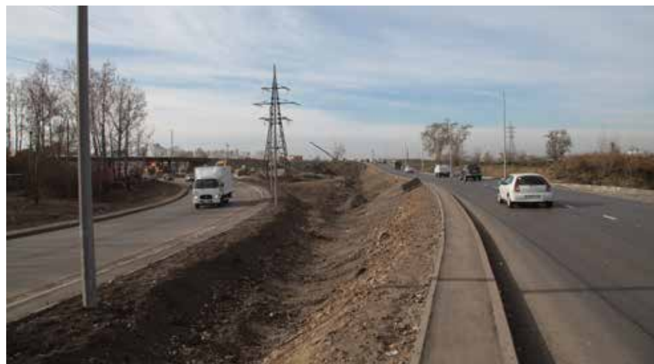
Пропускная способность Покровской развязки после ремонта увеличится более чем в два раза