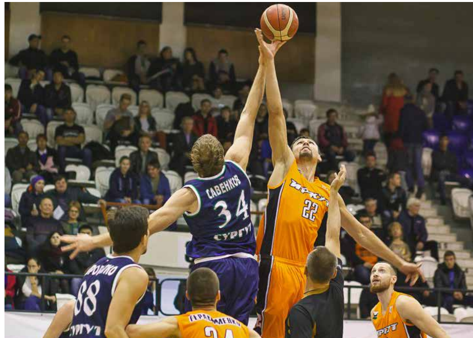
Первые домашние игры для иркутян были волнительными. Именно поддержка трибун помогла вырвать на последних секундах победу у «Университет-Югра»