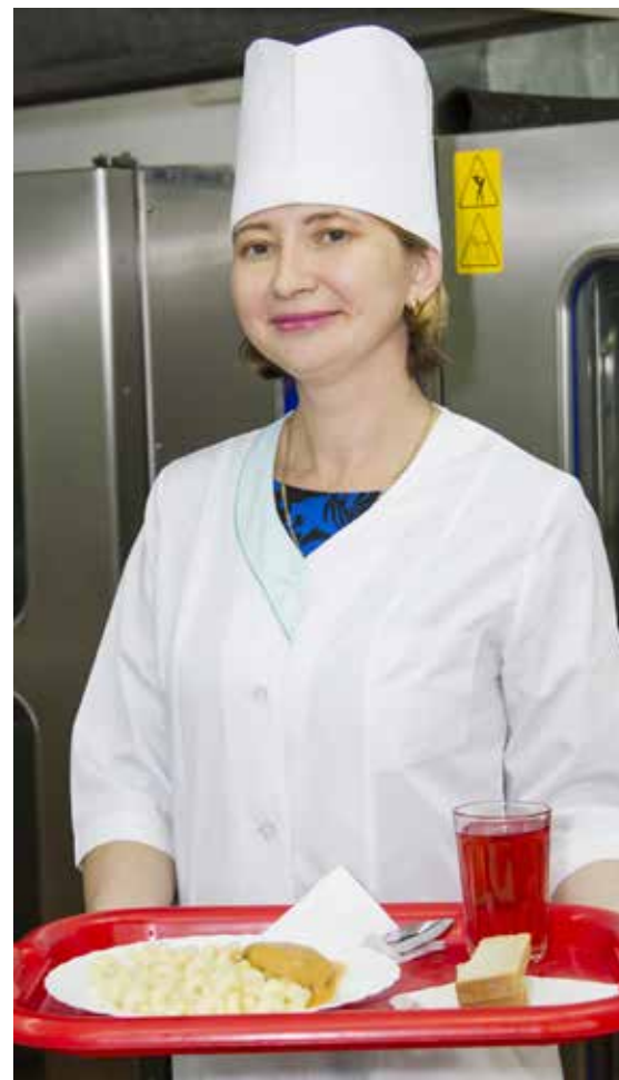
Горячие обеды, приготовленные на Комбинате питания, попадают на столы школьников в течение двух часов. Температуру блюда сохраняют специальные термосы