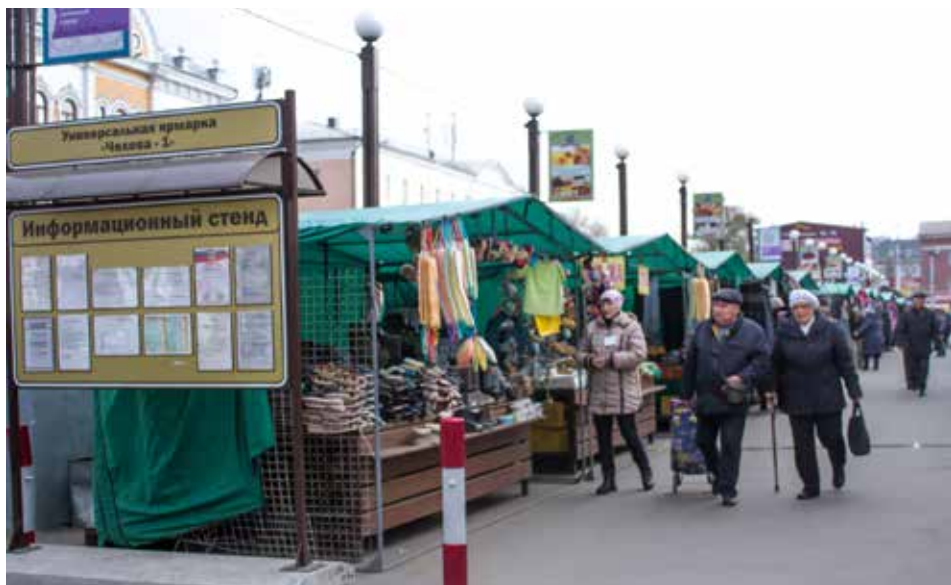
Территория вокруг Центрального рынка постепенно обустривается и приводится в порядок. Ремонтные работы ведутся и внутри помещения

Подготовила Анастасия Дарчук