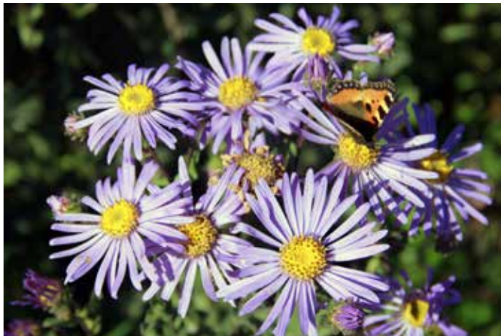
Астра звездчатая, позднецветущий сорт Кинг Джин. Отваром из ее цветков можно лечить кашель