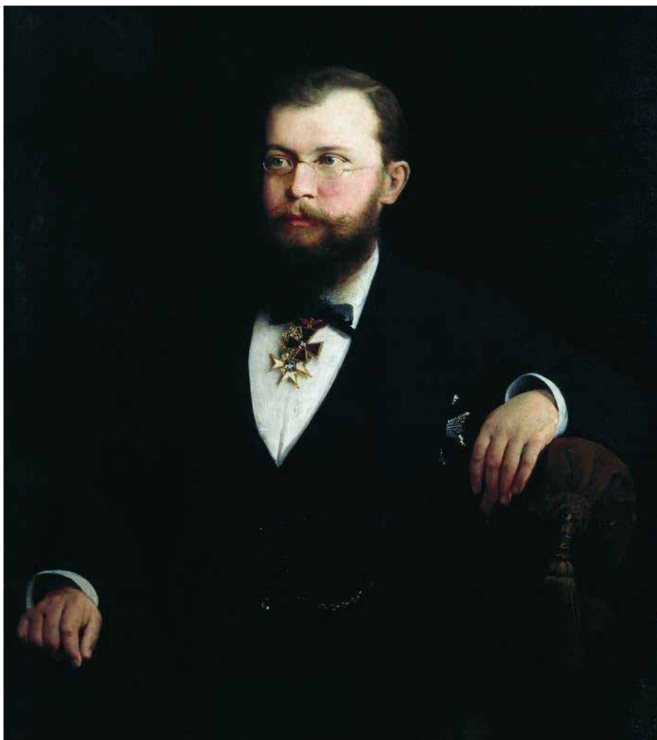
Портрет Сибирякова с орденом Полярной звезды кисти А.И. Корзухина хранится в Иркутском художественном музее

«Там, где реки имеют громадные протяжения, как у нас в Европейской