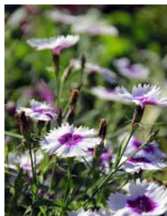
Двулетняя гвоздика обладает приятным ароматом