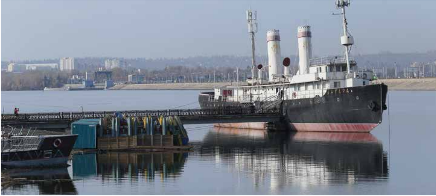
Набережная в Солнечном была и остается любимым местом отдыха горожан. В скором времени здесь появится современное общественное пространство с разными функциональными зонами