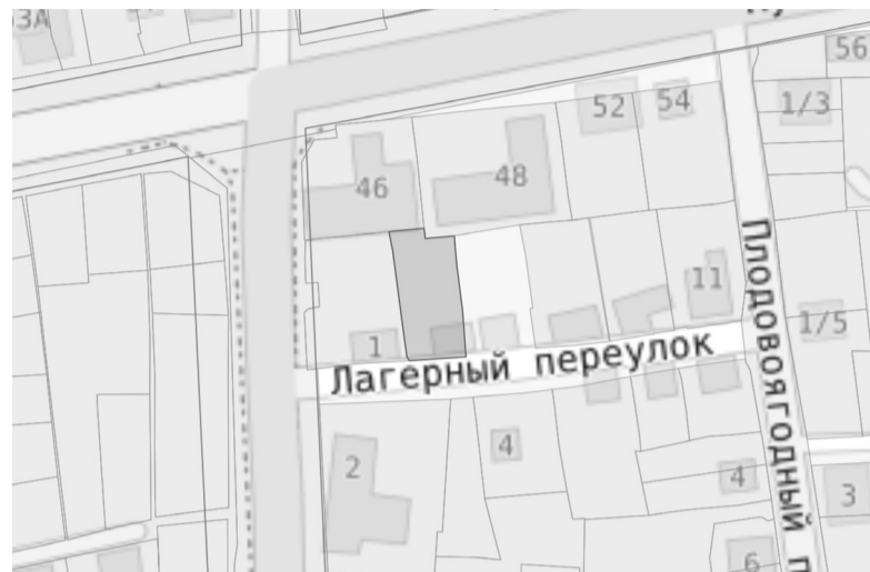
СХЕМА РАСПОЛОЖЕНИЯ ЗЕМЕЛЬНОГО УЧАСТКА, В ОТНОШЕНИИ КОТОРОГО ПОДГОТОВЛЕН ПРОЕКТ РЕШЕНИЯ О ПРЕДОСТАВЛЕНИИ РАЗРЕШЕНИЯ НА УСЛОВНО РАЗРЕШЕННЫЙ ВИД ИСПОЛЬЗОВАНИЯ «ПРЕДПРИНИМАТЕЛЬСТВО» В ОТНОШЕНИИ ЗЕМЕЛЬНОГО УЧАСТКА С КАДАСТРОВЫМ НОМЕРОМ 38:36:000020:876, ПЛОЩАДЬЮ 497 КВ. М, РАСПОЛОЖЕННОГО ПО АДРЕСУ: ИРКУТСКАЯ ОБЛАСТЬ, Г. ИРКУТСК, ПЕР. ЛАГЕРНЫЙ, 3.