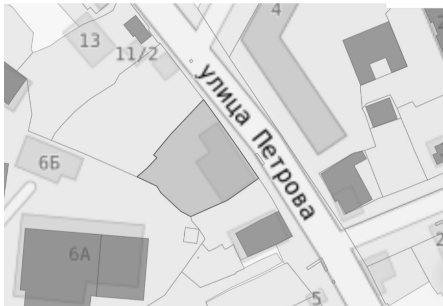
СХЕМА РАСПОЛОЖЕНИЯ ЗЕМЕЛЬНОГО УЧАСТКА, В ОТНОШЕНИИ КОТОРОГО ПОДГОТОВЛЕН ПРОЕКТ РЕШЕНИЯ О ПРЕДОСТАВЛЕНИИ РАЗРЕШЕНИЯ НА УСЛОВНО РАЗРЕШЕННЫЙ ВИД ИСПОЛЬЗОВАНИЯ «ОБЪЕКТЫ ДОРОЖНОГО СЕРВИСА» В ОТНОШЕНИИ ЗЕМЕЛЬНОГО УЧАСТКА С КАДАСТРОВЫМ НОМЕРОМ 38:36:000013:3337, ПЛОЩАДЬЮ 1154 КВ. М, РАСПОЛОЖЕННОГО ПО АДРЕСУ: РОССИЙСКАЯ ФЕДЕРАЦИЯ, ИРКУТСКАЯ ОБЛАСТЬ, В КУЙБЫШЕВСКОМ РАЙОНЕ Г. ИРКУТСКА ПО УЛ. ПЕТРОВА, 9.