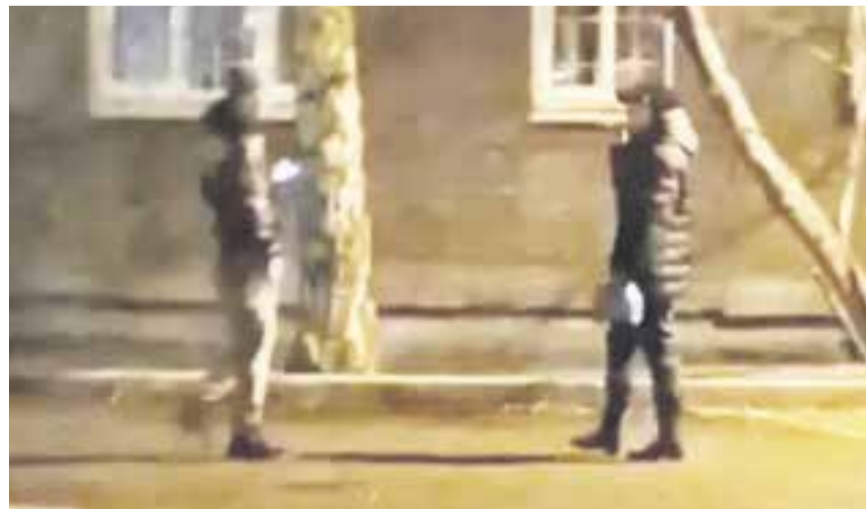
Это скриншот оперативного видео. Справа на фото — дочь обманутой пенсионерки. Она идет к курьеру, чтобы передать деньги за якобы проданную квартиру. Получив сверток, мужчина должен был написать «работодателям» в мессенджере, что все прошло по плану, и отвезти миллионы другому соучастнику преступления. За такую подработку ему пообещали заплатить пять тысяч рублей

Доверие не порок, но в сегодняшнем мире, где любому могут позвонить лжеследователи, верить можно только проверенным номерам. Никогда не поздно нажать отбой и набрать 02 или 112. Не вступайте в разговоры с мошенниками! Кладите трубку!