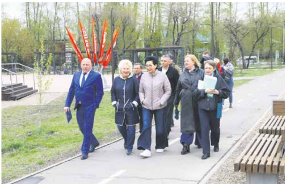
Представители Общественной палаты РФ осмотрели парк «Комсомольский» в Иркутске II. Это одна из самых масштабных по площади территорий, где проводятся значимые городские мероприятия. Благоустройство парка проходило по президентскому проекту «Формирование комфортной городской среды» нацпроекта «Инфраструктура для жизни»