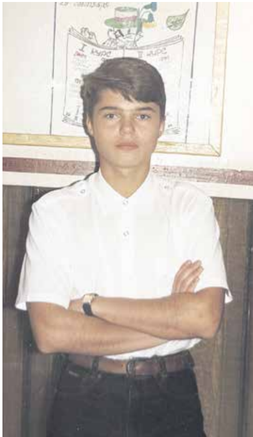
Учеба в лицее № 1 Усолья-Сибирского. 1995 год