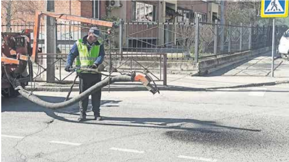
Ямочный ремонт на улицах Новаторов и Авиастроителей в избирательном округе № 9 депутата Павла Кудеева выполнен по заявке жителей. Сотрудники «Иркутскавтодора» не только привели дороги в порядок, но и покрасили ограждения