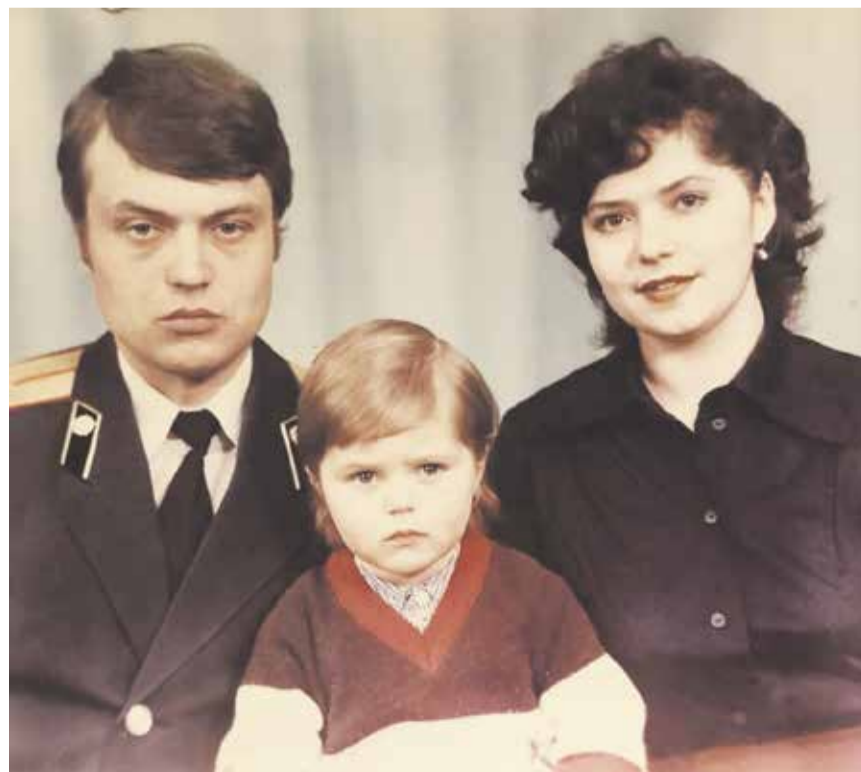
Вместе с родителями. 1983 год