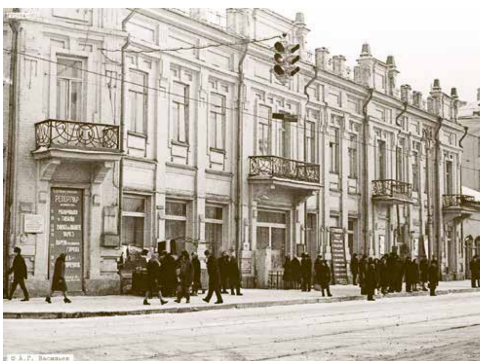
Этот исторический снимок сделан иркутским фотографом Александром Васильевым в 1964 году. На нем вы видите старое здание Театра юного зрителя на улице Ленина, а на переднем плане — светофор на проезде! А первые три светофора в нашем городе, по информации «Восточно-Сибирской правды», появились летом 1934 года: их установили на улице Карла Маркса — на углу с Литвинова, с Ленина и с Пролетарской

После долгой и суровой зимы в нашем городе продолжается весенняя генеральная уборка: вывозят собранный на субботниках мусор, чистят и красят лавочки и ограждения, приводят в порядок общественные пространства — всего и не перечислишь. Но мало кто знает, что и городским светофорам тоже необходим уход и забота. И дело не только в поддержании правильной работы этой техники. Два раза в год регуляторы дорожного движения моют, а затем красят. Эту нестандартную работу выполняют сотрудники службы эксплуатации светофорных объектов муниципального учреждения «Безопасный город». Вместе с ними репортажная группа «Иркутска» выехала недавно на улицу Советскую и узнала, почему уход за «красно-желто-зелеными» требует и терпения, и специальных навыков. А еще почему электромеханики не любят суперклеи и красят столбы вручную — кисточками на телескопических ручках.