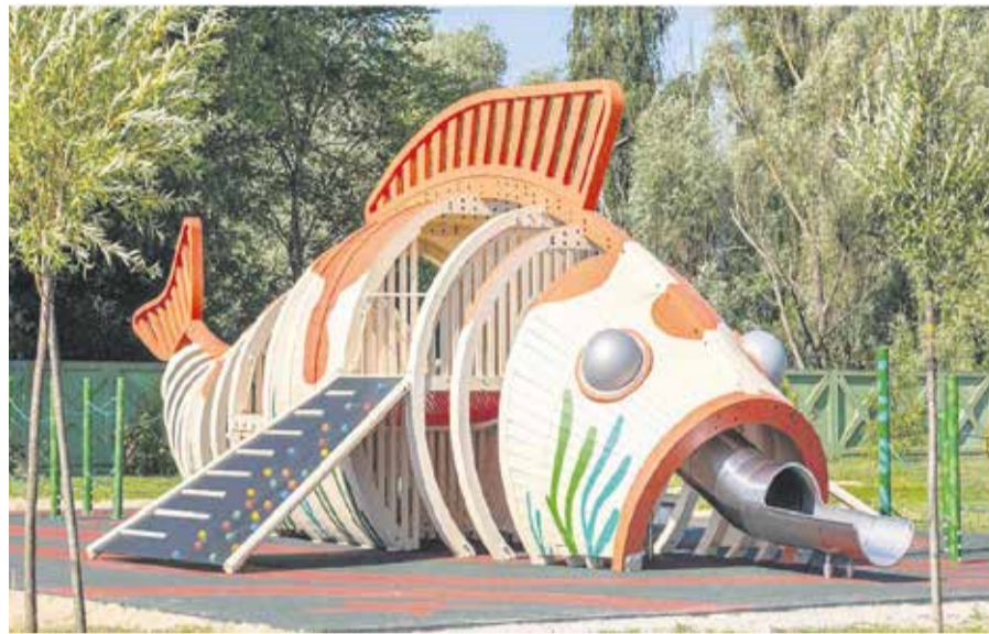
Так будет выглядеть детская площадка в парке «Караси» в микрорайоне Юбилейном. А еще здесь появятся прогулочные дорожки, место для кормления уток, освещение, семь объемных арок с подсветкой, более 30 парковых скамеек разных моделей, газоны и 107 деревьев и кустарников взамен аварийных — Свердловский округ обретает еще одно красивое место для прогулок

Особо охраняемая природная территория Иркутска «Птичья гавань», расположенная на въезде в микрорайон Ново-Ленино, не имеет равных в Южном Прибайкалье по разнообразию и видовому составу птиц — здесь обитают более 200