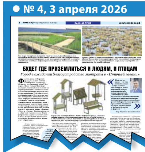
В начале апреля мы подробно рассказывали, как будет обустроена «Птичья гавань»: удобная парковка, асфальтированная дорожка и деревянный настил со смотровыми площадками, скамейками в форме скворечников и биноклями позволят поближе познакомиться с птицами, обитающими на ново-ленинских болотах

Ирина Покоява