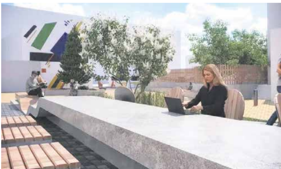
В центре города, во дворе здания Культурного центра Александра Вампилова (он находится на улице Богдана Хмельницкого, 3) появится длинный стол из бетона. Планируется, что здесь горожане будут не только отдыхать — читать книги или играть в настольные игры, но и смогут поработать за ноутбуком

Победившие пространства будут благоустроены в 2027 году.