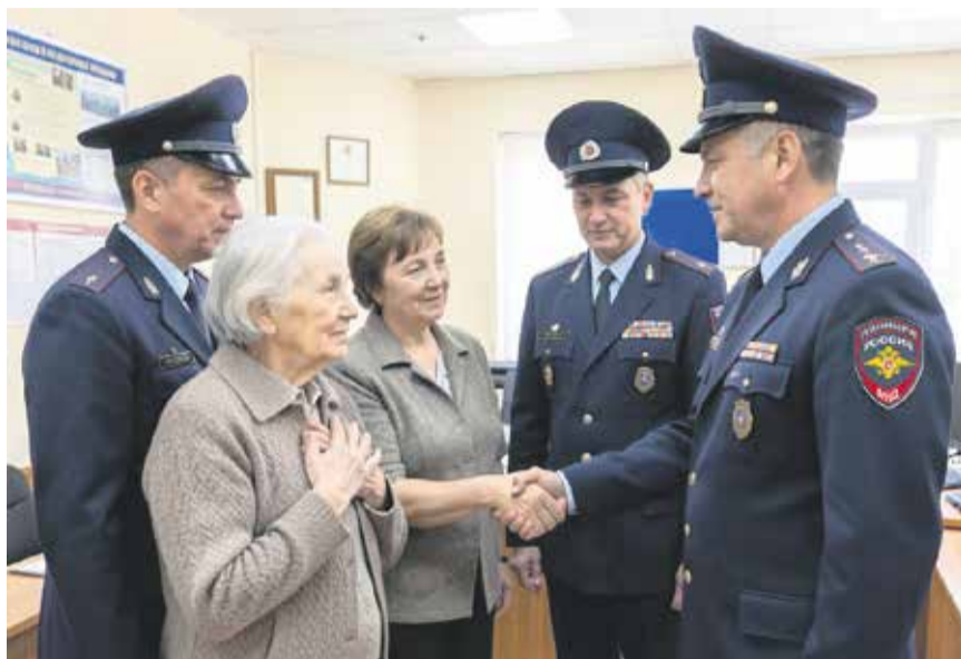
Вот так искусственный интеллект увидел, как пожилая женщина и ее дочь благодарят иркутских полицейских за помощь. И так действительно было: обманутые мошенниками женщины выразили горячую признательность сотрудникам правоохранительных органов за спасение их единственного жилья!

Почти шести с половиной миллионов злоумышленникам показалось мало, и они решили забрать у пострадавших все, что возможно: продолжали звонить, давить мораль-